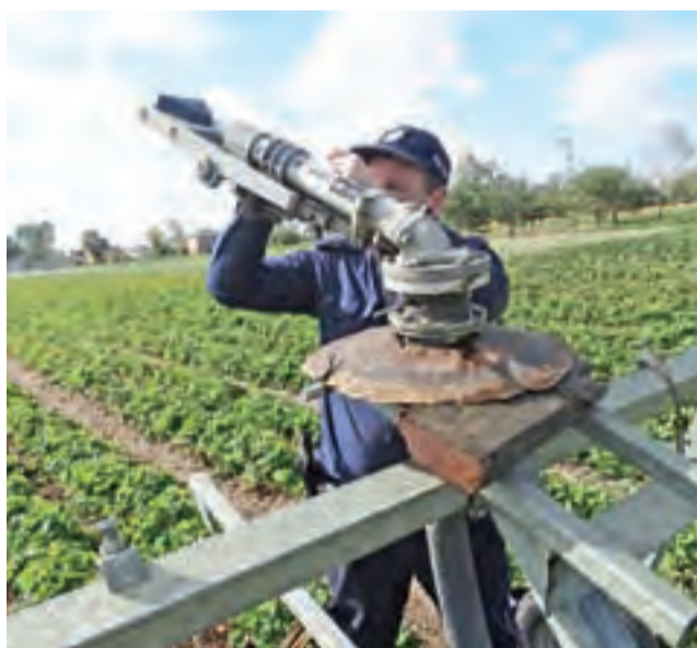
Dzięki oznakowaniu i dokumentacji fotograficznej nie powinno być wątpliwości kto jest właścicielem sprzętu, nawet jeśli zostałby on znaleziony gdzieś indziej.

Policjanci zwracają się więc do wszystkich rolników z gminy Sanniki z apelem o oznakowanie swoich urządzeń. Można to zro-