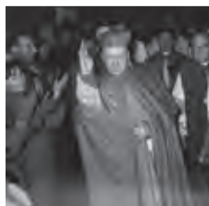
Poznań, 17 kwietnia 1966.

Toczy się [...] zacięta walka, która w istocie rozstrzygnie o przyszłości nie tylko Kościoła w państwie socjalistycznym, ale i o duchowej przyszłości narodu. Decydujące będzie to, czy w obliczu bezprzykładnej ofensywy komunistycznego państwa, do której zmobilizowało ono wszelkie środki, Prymas Polski znajdzie się wraz z Episkopatem izolowany i osamotniony, czy też otrzyma wsparcie od społeczeństwa. Wynik tej konfrontacji, tego swoistego społecznego referendum, zależy będzie od tego, jak zachowują się masy.