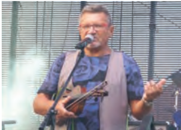
Jacek Zieliński z zespołu „Skaldowie” udowodnił, że posiada nie tylko talent wokalny, lecz także poczucie humoru.