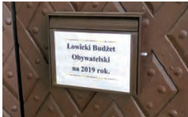
Wypełnione formularze z propozycjami można wrzucać do skrzynki na bramie ratusza.

Z zaplanowanych na bieżący rok 11 inwestycji w ramach budżetu obywatelskiego, choć mamy