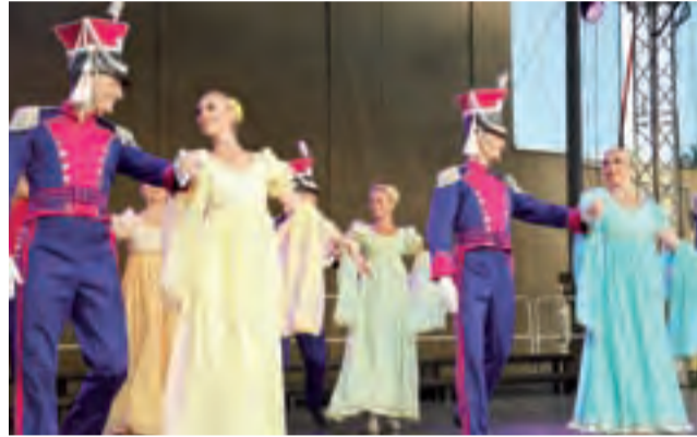
W skromnych, ale szykownych strojach z okresu Księstwa Warszawskiego tancerze przedstawili mazura.

Rozmawialiśmy z 21-letnim tancerzem jeszcze przed występem. Powiedział nam, że w zespole spełniło się jego marzenie, które powstało gdy miał 16 lat. Wtedy to – jako uczeń Szkoły Baletowej im. Feliksa Parnella w Łodzi (w której uczył się od 12. roku życia) – po raz pierwszy pojechał na Festiwal Polskich Tańców Narodowych, którego organizatorem jest ZPiT Śląsk i który odbywa się w jego siedzibie w Koszęcinie. – Wtedy dowiedziałem się, na czym polega ta praca i postanowiłem, że jak