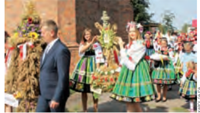
Procesja eucharystyczna z wieńcami niesionymi przez delegację z wiosek. Na pierwszym planie wieńiec z Wyborowa.

Nie wykazał mienia ruchomego o powyżej wartości 10 tys. zł oraz zobowiązań kredytowych powyżej tej wartości. tb