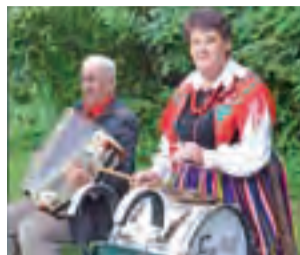
Rozgrzewka przed przeglądem przy muzyce granej na żywo przez kapelę z gminy Bedno.