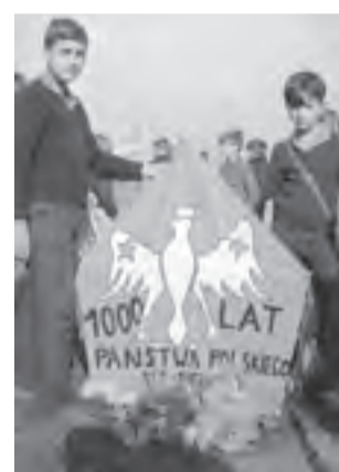
Warszawa, 1966. Chłopczy z latawcem udekorowanym z okazji Tysiąclecia Państwa Polskiego podczas święta latawca.

Przed katedrą i w katedrze setki tysięcy ludzi. To nie jest tylko uroczystość religijna. To manifestacja