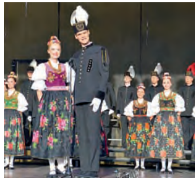
Na scenie pojawili się też śpiewacy w strojach górniczych z białymi i czerwonymi pióropuszcami. Obok nich panie w strojach opolskich.

Przed występem gwiazdy wieczoru – Zespołu Pieśni i Tańca Śląsk, scena ta przeszła lifting w wykonaniu obsługi technicznej zespołu. Najpierw ją czyścili, po-