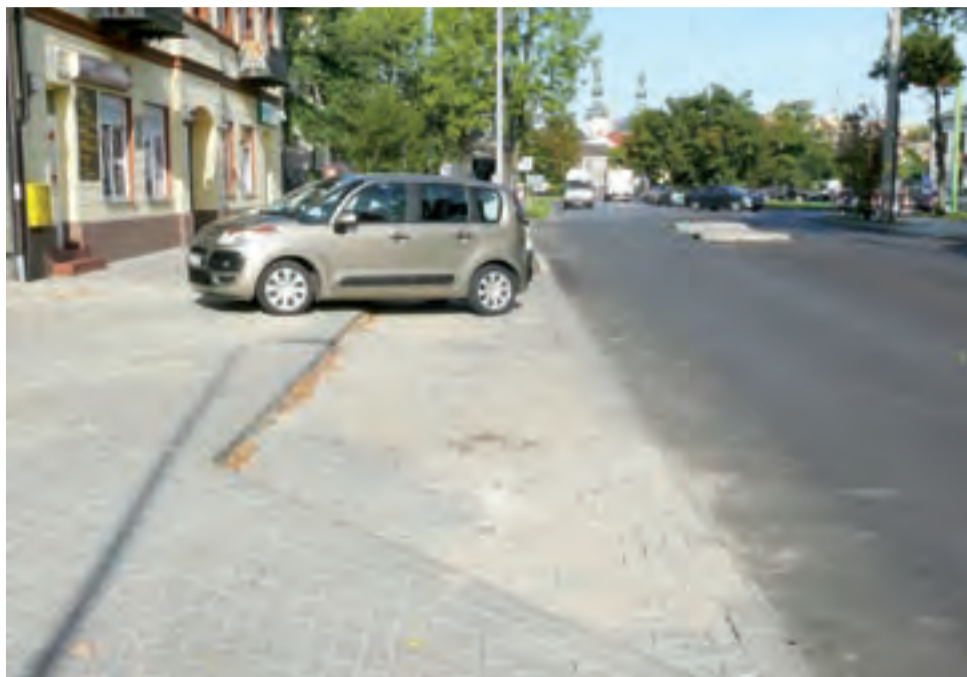
Zatoka parkingowa przy ul. 1 Maja, samochody nie parkują na niej równolegle, ale prostopadłe bo i inaczej kolejni kierowcy nie mieliby gdzie stanąć.

Naczelnik Wydziału Inwestycji i Remontów w ratuszu Grzegorz Pełka powiedział nam, że pomysł nie został zarzucony. Od strony południowej do ronda dochodzi ścieżka rowerowa biegnąca po wschodniej stronie ul. Dmowskiego, w miejscu skrzyżowania rozdziela się ona w dwóch kierunkach, w stronę wschodnią (Zielkowiec), ale także w stronę zachodnią (Końskiego Targu). Przez