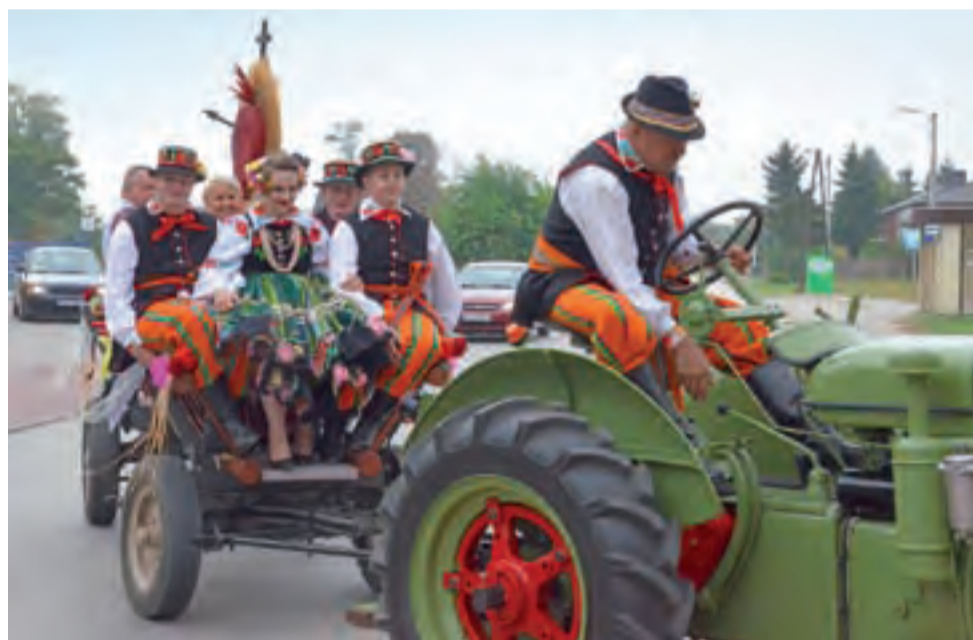
Dożynki parafialne w Zdunach jeszcze chyba nigdy nie miały takiej oprawy, jaką w tym roku przygotowali mieszkańcy Strugienic.

Kościół został przez gospodarzy dożynek udekorowany – pojawiły się w nim np. ule, miniatura wiatraka i dynie. Po zakończeniu mszy św. starostka dożynek zaprosiła wszystkich na poczęstunek przygotowany przez mieszkańców parafii – był chleb ze smalcem, kwaszone ogórki i ciasto. Przygrywała kapela. Potem wóz odjechał do Strugienic, gdzie przygotowano obiad i zabawę, która trwała do wieczora. Zaangażowani w przygotowanie dożynek mieli jednak pewien niedosyt, że mało osób