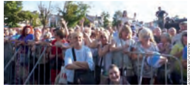
Większość przebojów zespołu „Akcent” publiczność zaśpiewała wraz z wokalistą – Zenonem Martyniukiem.