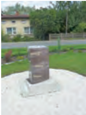
Postument jest już przygotowany, ale do czasu obchodów pozostaje zasłonięty.

będzie się przemarsz na cmentarz wojenny, gdzie odczytany zostanie Apel Poległych. Ok. godz. 10.40 nastąpi przemarsz uczestników przed Urząd Gminy, gdzie dokona się odsłonięcie postumentu w kształcie zegara słonecznego, wewnątrz którego umieszczona zostanie kapsuła czasu. Przypro-