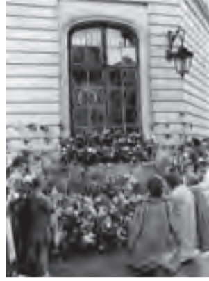
Warszawa, 20-21 czerwca