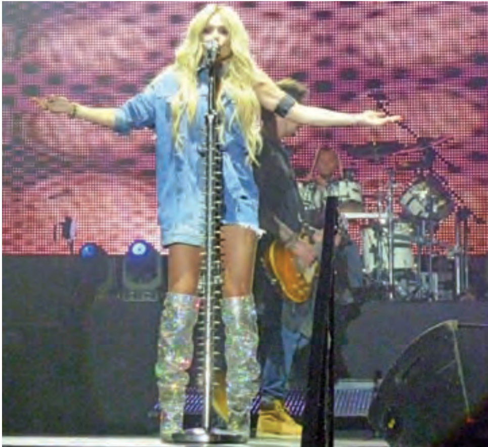
Doda zachwycała publiczność oryginalnymi kreacjami oraz perfekcyjnym wykonaniem swoich przebojów.

Na deser pozostawiono tego dnia występy gwiazd sceny muzycznej: Zenona Martyniuka z ze-