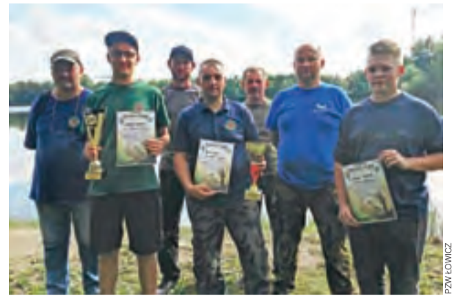
Wędkarze z PZW Łowicz podczas zawodów w Sochaczewie.

– Ważne jest, aby ludzie widząc zwierzęta, które potrzebują pomocy człowieka, reagowali to, aby nie byli obojętni – mówi prezes. – Może następnym razem na taką pomoc nie będzie za późno.