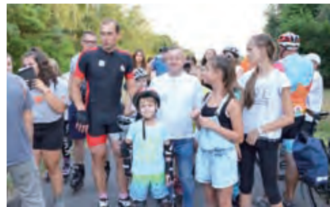
Dodatkową atrakcją treningu w Nieborowie była możliwość zadawania pytań mistrzowi olimpijskiemu oraz zrobienia z nim zdjęcia.