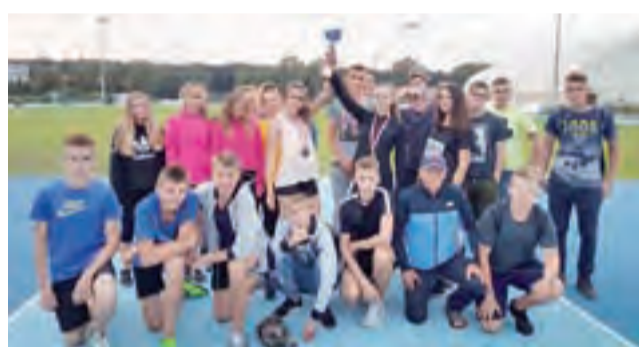
Ekipa lekkoatletów z UKS Błyskawica Domaniewiczej.

Lekkoatleci z naszego powiatu, reprezentujący kluby UKS Błyskawica i UKS Jedynka Łowicz, w niedzielę, 9 września startowali na Międzywojewódzkich Mistrzostwach U16 w lekkoatletyce, które odbyły się w Belchatowie.