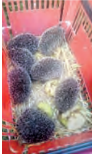
Małe jeże ujawniły się właścicielce posesji wtedy, gdy wyszyły z ukrycia w poszukiwaniu pożywienia.

Do naturalnego środowiska bardzo im się jednak spieszy, po-