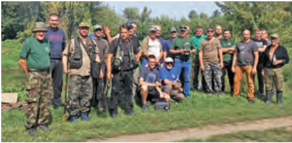
Uczestnicy wędkarskich zawodów spinningowych o tytuł Mistrza Koła PZW Łowicza na 2018 rok na wspólnym zdjęciu.

24 uczestników przystąpiło w niedzielę, 2 września, do wędkarskich zawodów spinningowych o tytuł Mistrza Koła PZW Łowicza na 2018 rok. Rywalizacja odbyła się wzdłuż Bzury w Bednarach, w pobliżu niebieskiego mostu.