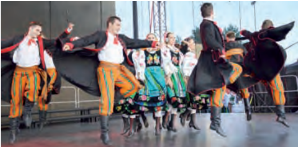
Łowicki oberek był wyjątkowo skoczny, pełen skomplikowanych akrobacji.

A publiczność? Czy zwracają na nią uwagę? – Ludzi zazwyczaj jest dużo i są bardzo zadowoleni. Myślę, że przychodząc na występ „Śląska”, wiedzą, że to jest naprawdę sztuka i tego się właśnie spodziewają. Sądzę, że występ robi wrażenie, zwłaszcza wtedy, gdy widzi się go pierwszy raz. Wiem, że tak jest, bo sam tego doświadczyłem. ■