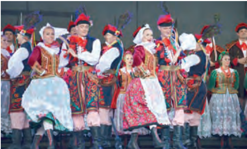
W finałowej scenie tancerze – jakby nie zmęczeni po dwugodzinnym koncercie – wykonali bardzo widowiskowego krakowiaka.