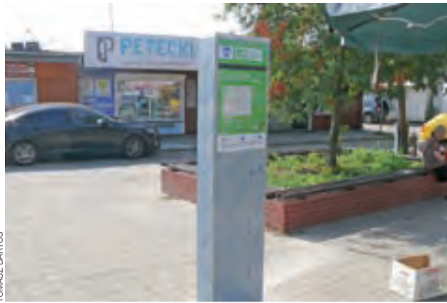
Pylon, który będzie informował o strefie z rowerami na terenie miejskiego targowiska.