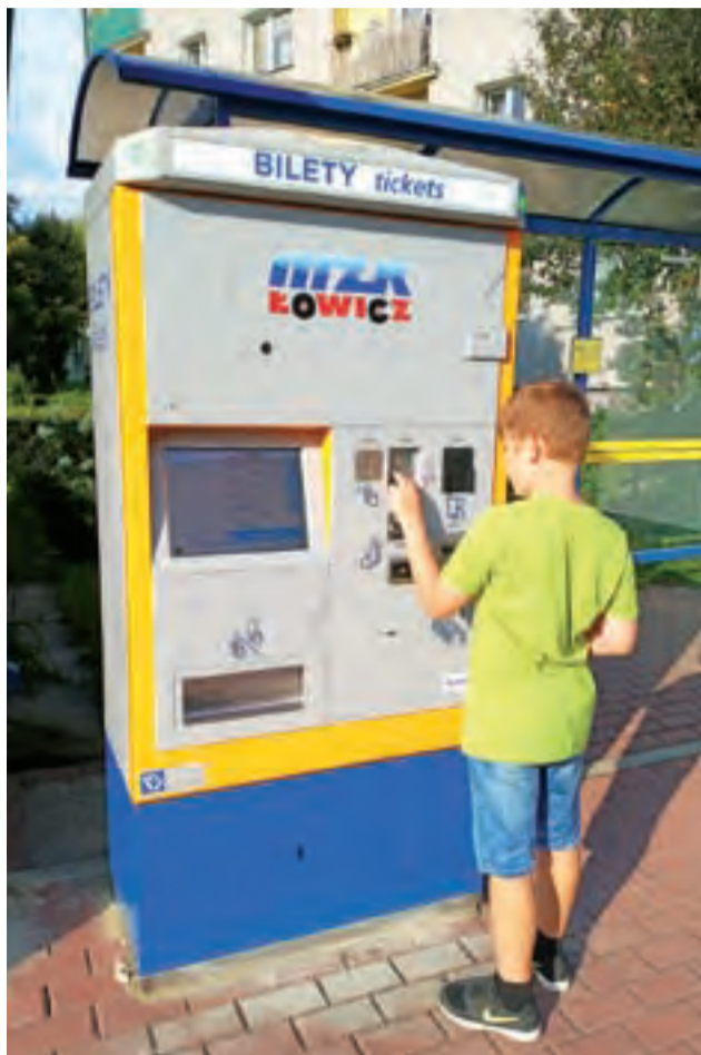
Zakup biletu w biletomacie miał być dziecinnie łatwy, jednak seniorzy twierdzą, że sprawia im to spory kłopot.

Biletomaty najczęściej się zawieszają po tym, jak podróżny wciśnie zbyt dużo różnych funkcji w jednym czasie.