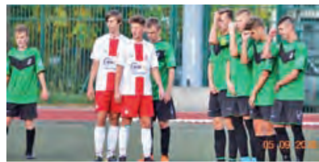
Pelikan 2002 nie miał szczęścia w meczu z ŁKS II.