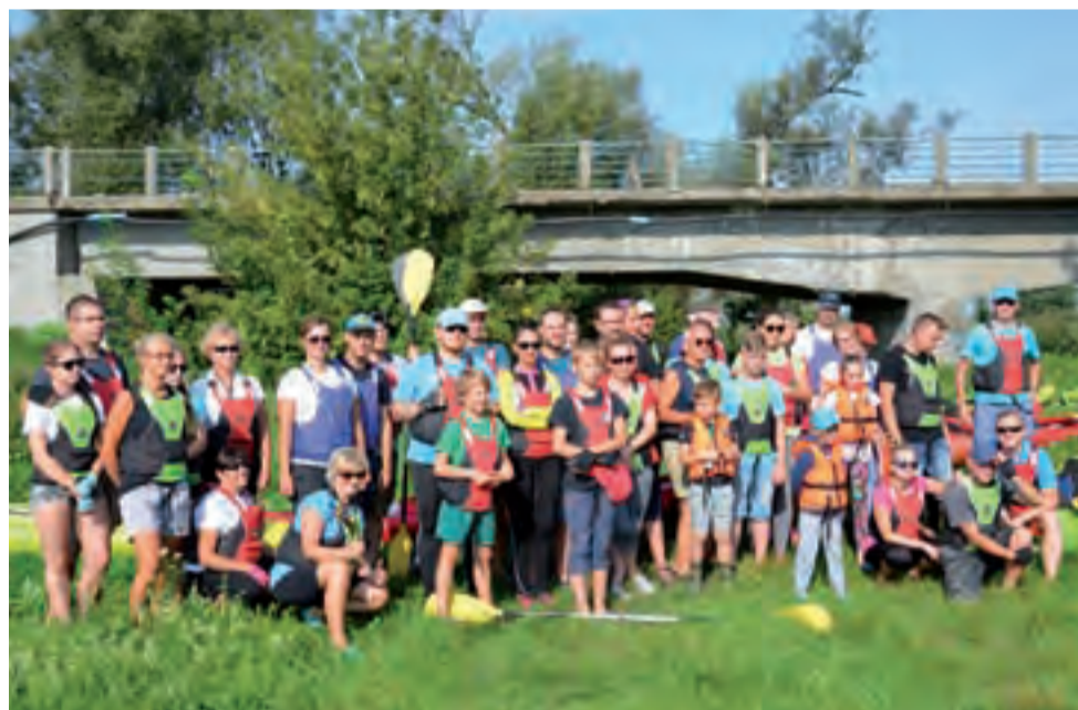
Blisko 50 osób wzięło udział w spływie kajakowym z „Soboty w sobotę”. Na chwilę przed wodowaniem kajaków zrobili sobie wspólne zdjęcie.