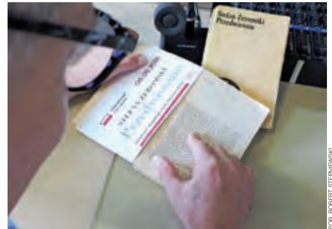
Lektura w więzieniu pozwala zabić czas, a przy tym jest ważnym elementem resocjalizacji.