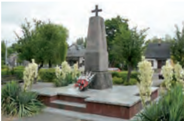
Pomnik upamiętniający partyzantów Gwardii Ludowej w Bolimowie już tak nie wygląda, po zmianach poświęcony jest bohaterom poległym za Ojczyznę.

Z pomnika zniknęły symbole GL: metalowy tzw. Krzyż Grun-