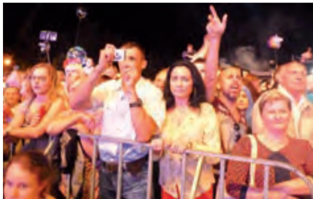
Publiczność licznie przybyła na występ wienający „Księżackie Jadło” – koncert Dody.

Nostalgia za minionymi latami wywołał występ zespołu Skaldo-