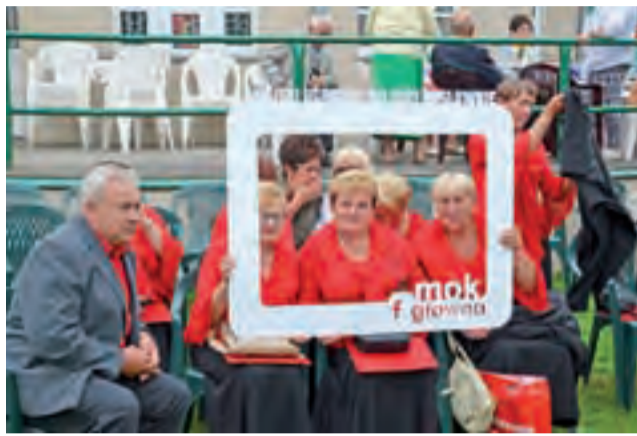
Zespoły chętnie robiły sobie pamiątkowe zdjęcia z wykorzystaniem ramki przygotowanej przez MOK.

Miejsce I w kategorii zespołów (jedno z trzech równoległych) zajął chór Klubu Seniora Radość