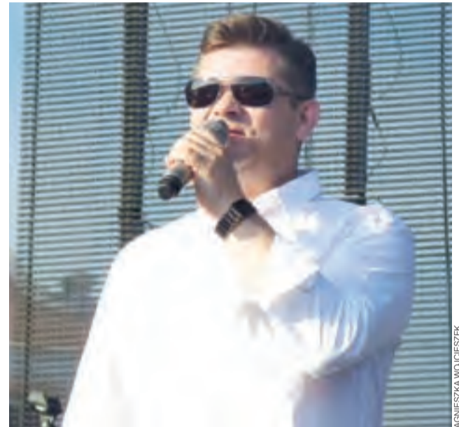
Zenon Martyniuk z zespołu „Akcent” przyciągnął tłumy, których w Łowiczu dawno nie było.

wie. Ich wykonanie m.in. „Prześlicznej wiolonczelistki” wielu uczestników porwało do tańca.