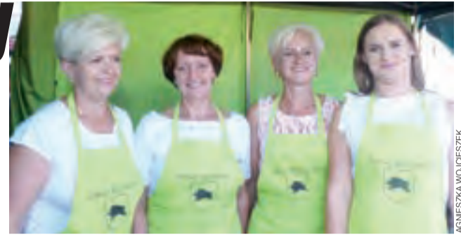
Gospodynie z KGW Kiernozia rozpieszczały podniebienia uczestników pysznymi kartaczami.