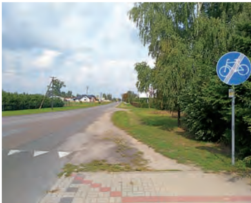
Chodnik przy ul. Kiernozkiej w tym miejscu kończy się. W odległości około 100 m widać chodnik w Małszycach.

W Urzędzie Gminy Łowicz dowiedzieliśmy się, że przed około 4 laty gmina chciała w Małszycach, wzdłuż drogi do Kiernozi pobydować chodnik, który byłby przedłużeniem chodnika w ciągu ulicy miejskiej, jednak Zarząd Dróg Wojewódzkich nie wyraził na to