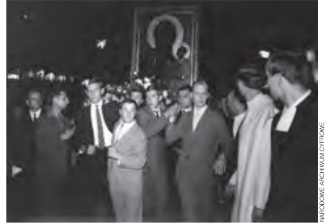
Lublin, 5 czerwca 1966. Obraz Matki Bożej Nawiedzenia niesiony przez studentów podczas obchodów Tysiąclecia Chrztu Polski.

1966. Wierni przed Obrazem Matki Bożej wystawionym w oknie zakrystii katedry.