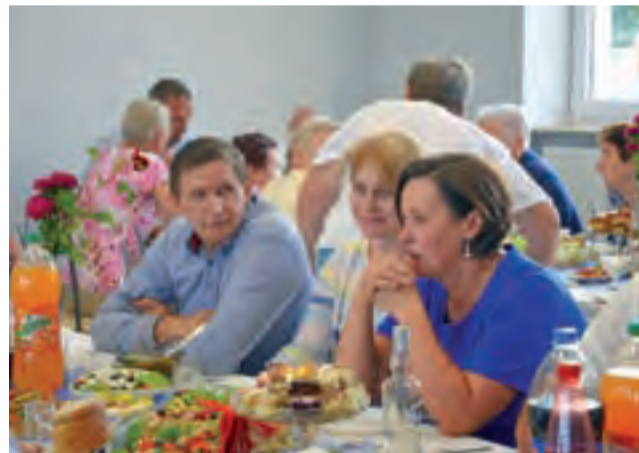
Po części oficjalnej goście spotkali się na przyjęciu z okazji otwarcia nowej sali.

bawili się na potańcówce na placu przed świetlicą.