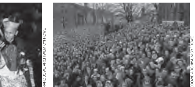
Białystok, 20 listopada 1966.