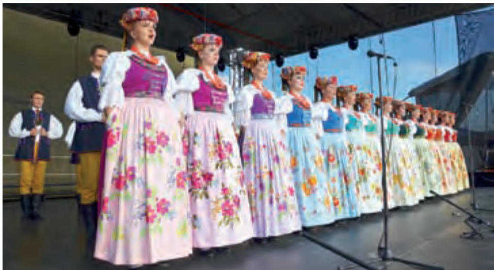
W wykonaniu chóru ZPIT Śląsk (ubranego w stroje śląskie tzw. rozbarskie) usłyszeć można było m.in. znany utwór „Zasiali górale”.