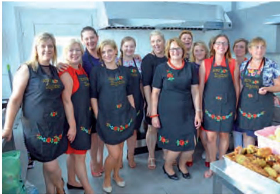
Panie z KGW Rogóżno w swoim żywiole – w kuchni, w której po remoncie mają zdecydowanie lepsze warunki.