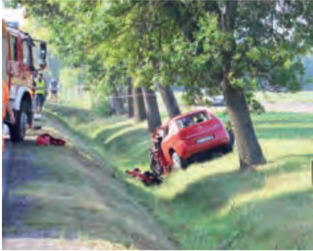
Miejsce tragedii – zniszczony Fiat Punto, ciężarówka znajdowała się po drugiej stronie jezdni.

Akcja ratownicza i później usuwanie skutków tragedii trwały do późnych godzin wieczornych. Początkowo droga była całkowicie zablokowana, podobnie jak zjazd z ronda na węzle autostrady, zaś podróżujących kierowano do objazdów. Później ruch odbywał się wahadłowo. W akcji dowodzonej