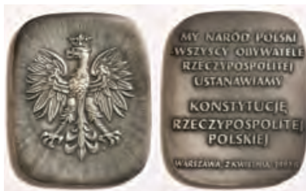
Plakietka okolicznościowa upamiętniająca podpisanie Konstytucji Rzeczypospolitej Polskiej z 1997 roku.

■ 2 kwietnia 1997 – uchwalona zostaje Konstytucja Rzeczy-