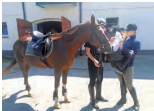
Osoby lubiące konie mogą zdobyć kwalifikacje instruktora jazdy konnej lub instruktora hipoterapii.

W ramach projektu zostanie przeprowadzonych 12 rodzajów