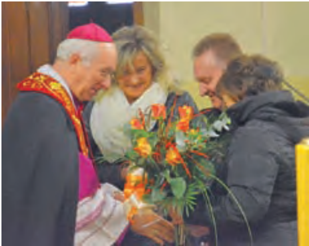
W murach kościoła w Zdunach biskupa łowickiego witali m.in. chórzyści.