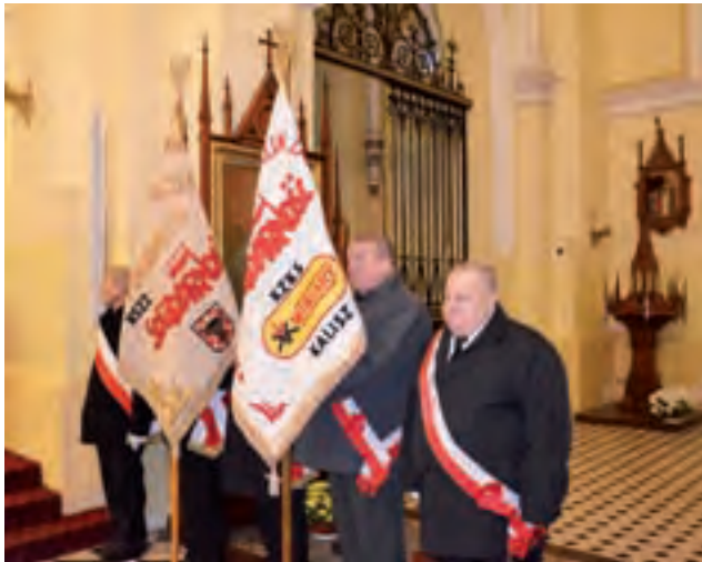
W uroczystości udział wzięły dwa poczty sztandarowe NSZZ Solidarność z Kalisza.