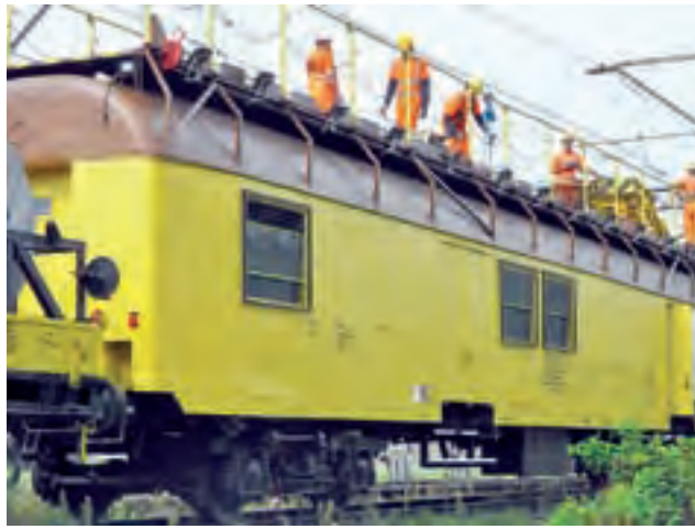
Pociąg trakcyjny niedawno pracował na jednym z torów w okolicach Zielkowic.

W pierwszych tygodniach przyszłego roku powinna zakończyć się budowa Lokalnego Centrum