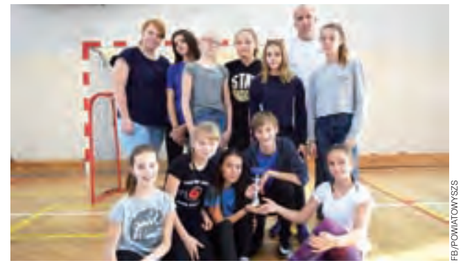
Dziewczyny z SP 1 Łowicz wygrały zawody w Bielawach.