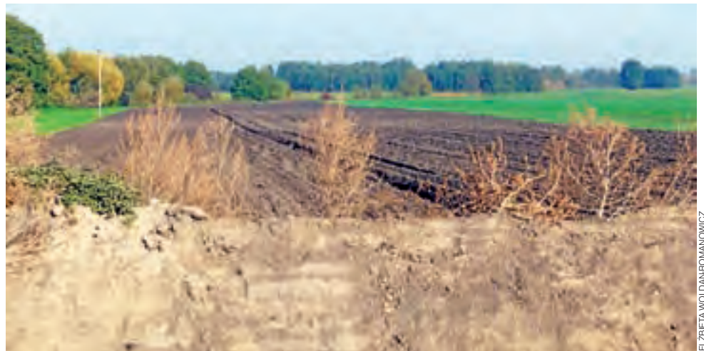
Pola za skarpią rowu. Te działki rolnika z Chrusłina oddziela od przebudowywanej DW 703 głęboki rów, przez który nie wybudowano zjazdu.

Trzeba tu zaznaczyć, że działki położone na północy DW 703 oddziela od równoległej do niej dro-