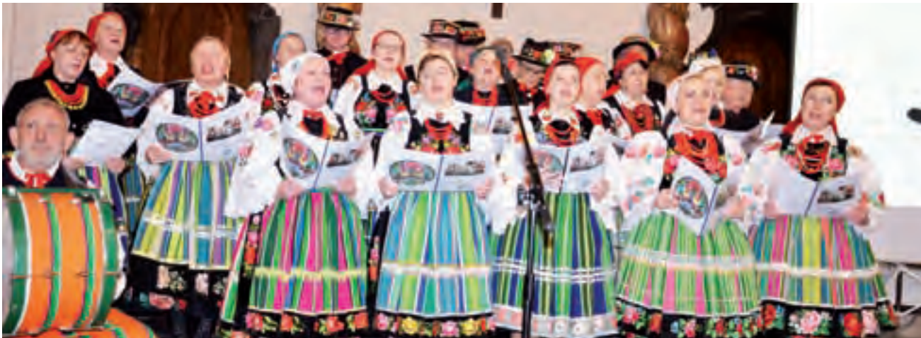
W koncercie Ksinszoków publiczność mogła aktywnie brać udział, ponieważ słowa śpiewanych utworów wyświetlane były na ekranie po prawej stronie.

Łowicz | Koncert promujący płytę zespołu Ksinszoki