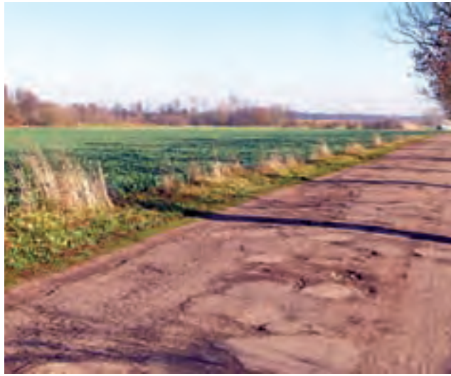
Droga gminna z Walewic do Piotrowic. Ją najbardziej niszczy ciężki transport buraków ze stadniny do cukrowni. Stan drogi na 6 listopada.

gminną, która niegdyś miała nawierzchnię asfaltową. Jej stan od lat pozostawiał zresztą wiele do życzenia, ale teraz, kiedy w wielu przypadkach stała się dla lokalnego transportu alternatywą dla drogi wojewódzkiej nr 703, wygląda gorzej niż kiedykolwiek. Asfalt znajduje się w zaniżu, na dziurach łatwo uszkodzić samochód, a gdy pada deszcz – w głębokich wyrwach gromadzi się woda i powstaje długo niewysychające błoto.