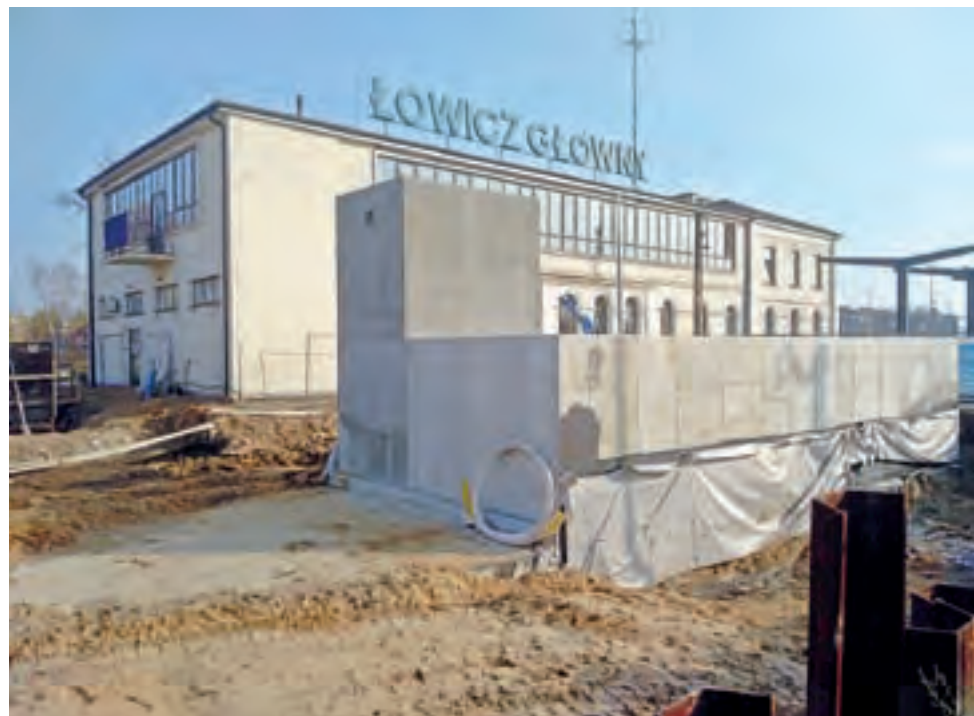
O okolice stacji Łowicz Główny od dawna przypominają duży plac budowy. W tle budynek dworca.

Łowicz | Roboty przy modernizacji linii kolejowej Warszawa – Poznań