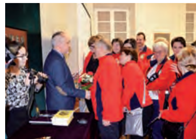
Na promocję wydawnictwa przybyła liczna grupa przewodników PTTK, ubranych w charakterystyczne czerwone polary.