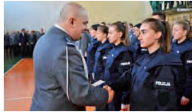
Insp. Andrzej Łapiński, komendant KWP w Łodzi składa gratulacje nowo przyjętym funkcjonariuszom.

Do zdarzenia doszło o godzinie 11.35. Kierująca samochodem osobowym marki Renault Modus, 21-letnia, mieszkanka powiatu słupeckiego (województwo wielkopolskie), wskutek niedostosowania prędkości do warunków panujących na drodze utraciła panowanie nad pojazdem, a następnie uderzyła w pobliską barierę energochłonną. Nikomu nic poważnego się nie stało. Kierującą ukarano mandatem. Kobieta poruszała się pasem w kierunku Warszawy. Utrudnienia na tym pasie trwały przez ok. 2 godziny. aw