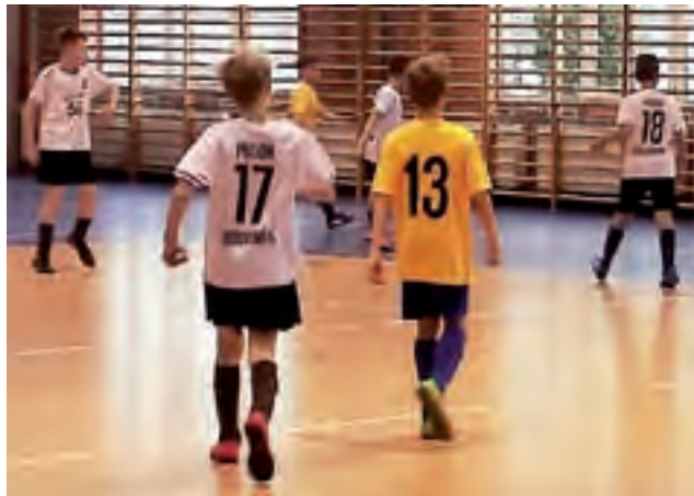
Zespół fowickiej Akademii wygrał tylko Pogonią Godzianów.

Piłka nożna | Puchar Marszałka Województwa Łódzkiego