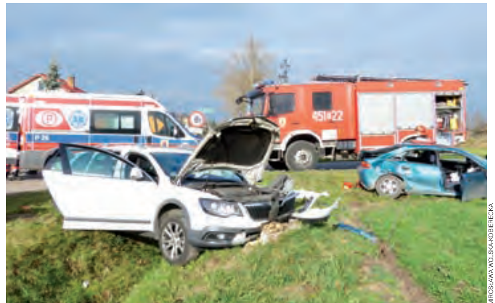
Mazda (w kolorze turkusowym) jechała drogą podporządkowaną, od strony Łagowa i nie zatrzymała się przez „stopem”. Skoda (biała) jechała od strony Łyszkowic w kierunku Bełchowa.

NASI DZIENNIKARZE DO WASZEJ DYSPOZYCJI OD 8.30 DO 15.30 Telefon redakcyjny 534 013 371 e-mail: tomasz.matusiak@lowiczanie.info TOMASZ MATUSIAK