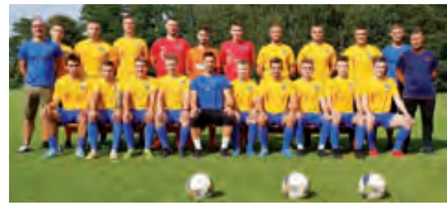
Pogoń zremisowała z wiceliderem Jutrzenką Drzewce 1:1.

■ Olimpia Chaśno – Vagat Domaniewice 5:4