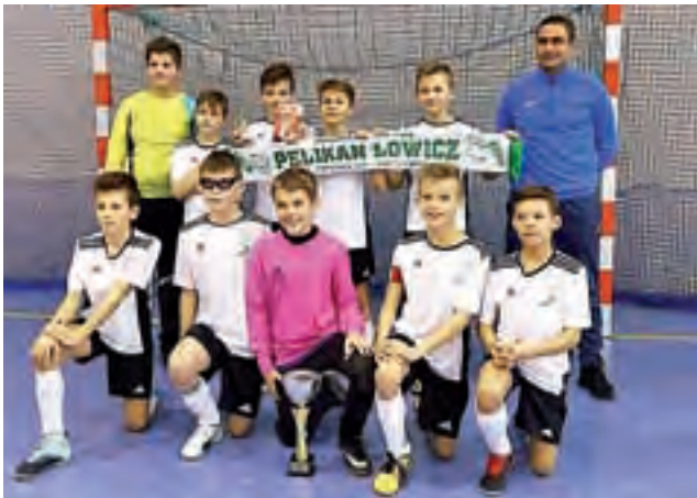
Drużyna fowickiego Pelikana-2007 nie kryła zadowolenia po turnieju.