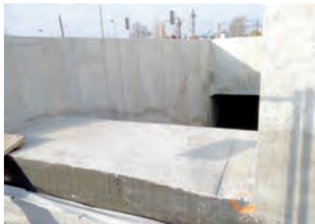
Przejście podziemne od strony nieczynnego jeszcze peronu nr 1 na dworcu Łowicz Główny.

Tymczasem dopiero po oddaniu peronu pierwszego do użytku oraz uruchomieniu „przypisanych” do niego torów będzie mogła rozpocząć się kolejna faza robót przy dworcu, czyli rozbiórka