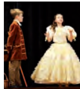
„Przeminęło z wiatrem” w wykonaniu uczniów z Warszawy było kostiumowym musicaliem.

ny” na kilkanaście różnych postaci tworzących diabelskie ministerstwo. Listy cytowane przez aktorów grających w przedstawieniu to studium sposobów kuszenia i niszczenia człowieka przez diabła, pokazujące też mocne strony „pacjenta”, który jest w stanie się przed nim bronić.