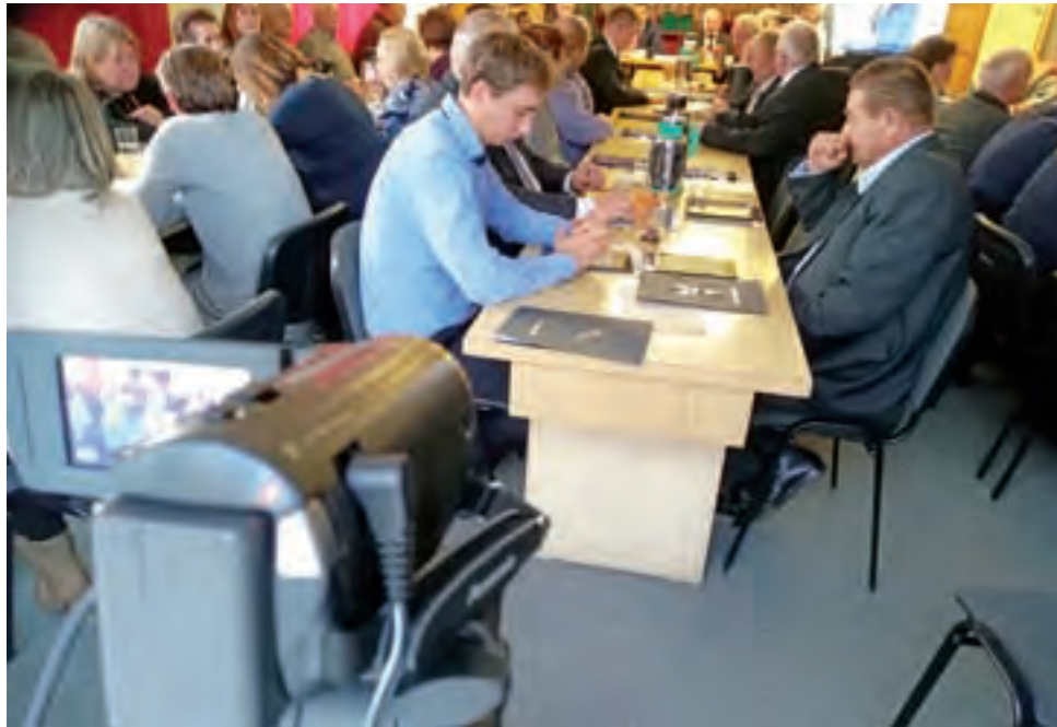
Nowa kadencja, nowe przepisy. I sesja Rady Gminy w Bolimowie w środę 21 listopada. Kamera rejestruje przebieg obrad.

Gmina poniosła stosunkowo mniejsze niż większość samorządów wydatki na przystosowanie sali urzędu do transmisji na żywo, wydając tylko około 17 tys. zł. Było to możliwe, ponieważ już wcześniej zainwestowała w sprzęt, głównie pod kątem prowadzenia