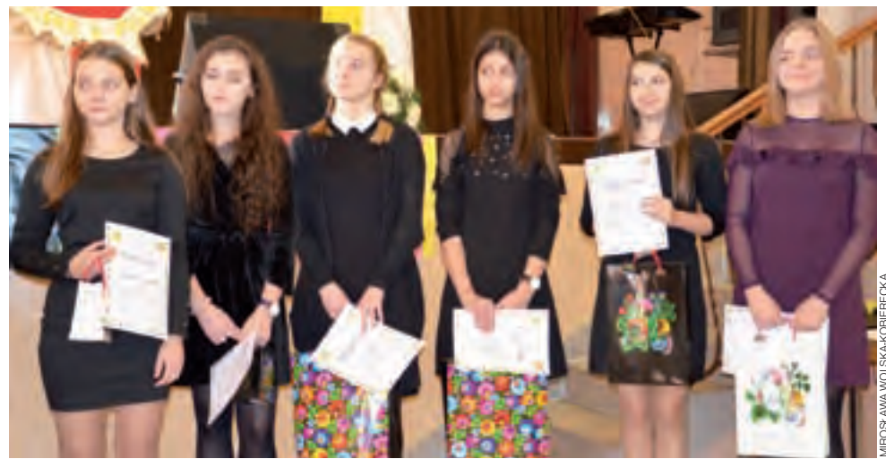
Konkurs związany z Dniem Papieskim podzielony jest na recytatorski i poezji śpiewanej. Na zdjęciu laureatki tego drugiego.

Warto przypomnieć, że Tipos Topes to cykliczny projekt, który zadebiutował w 2001 roku pod patronatem Łowickiego Ośrodka Kultury. Program zawsze jest tak dobierany, aby oscylował wokół promocji alternatywnych form kultury i sztuki współczesnej, z akcentem na muzykę i film. aa