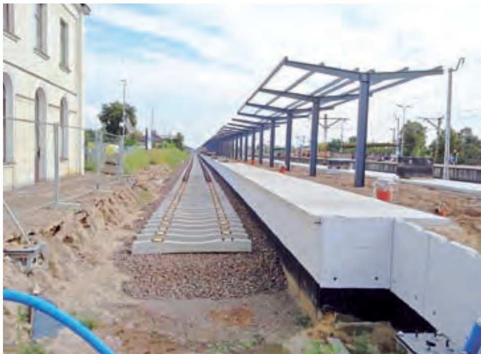
Budowa peronu nr 1. Układana jest nawierzchnia, a w najbliższym czasie montowane będzie pokrycie wiaty.