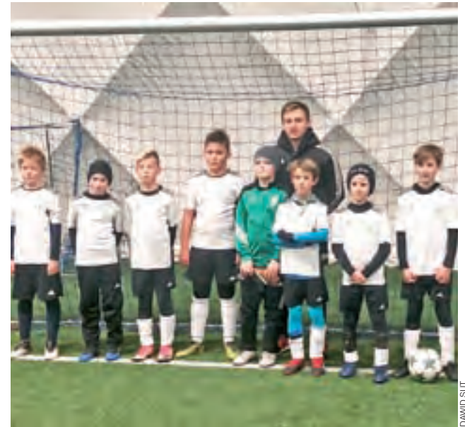
Pelikan 2008 udanie wystartowali w lidze zimowej.

W następnej kolejce zespół trenera Suta zmierzy się z Mazurem Radzymin, a mecz zaplanowano