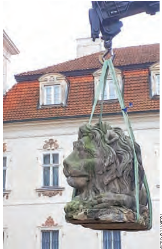
Jeden z nieborowskich lwów w czasie demontażu, w tle pałac Radziwiłłów.