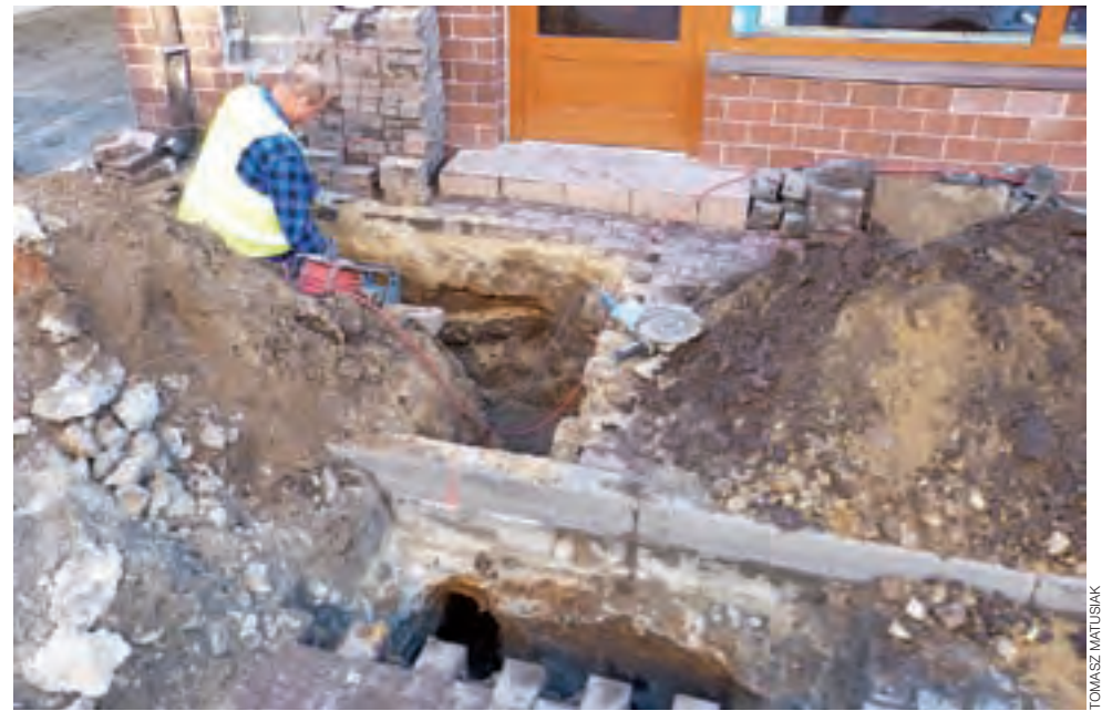
Podczas prac rozkopane zostały chodniki w części Zduńskiej pomiędzy Browarną a Kozią.

Przez cały czas awarii był dostęp do sklepów i zakładów usługowych w tej części Zduńskiej, choć utrudniony – na co narzekali niektórzy przedsiębiorcy. Mówili,