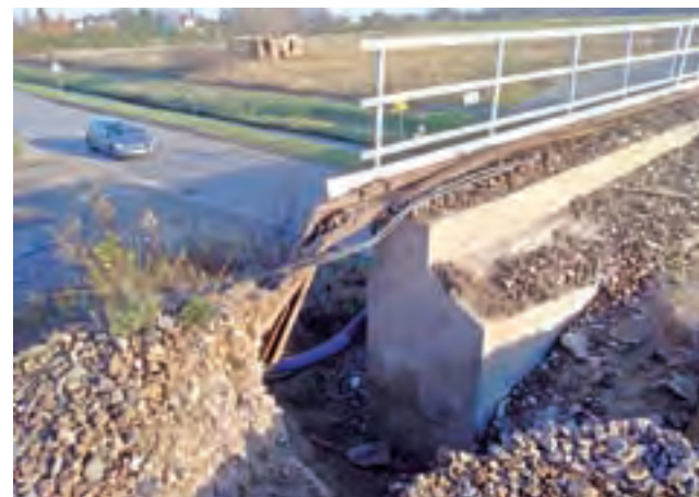
Investor rozważa jaki zakres powinna mieć modernizacja wiaduktu nad ul. Arkadyjską.

i budowa nowego peronu nr 2 oraz prace związane z trakcją kolejową i urządzeniami sterowania ruchem na drugiej części rozjazdów – tych przypisanych do torów dochodzących do peronu nr 2.