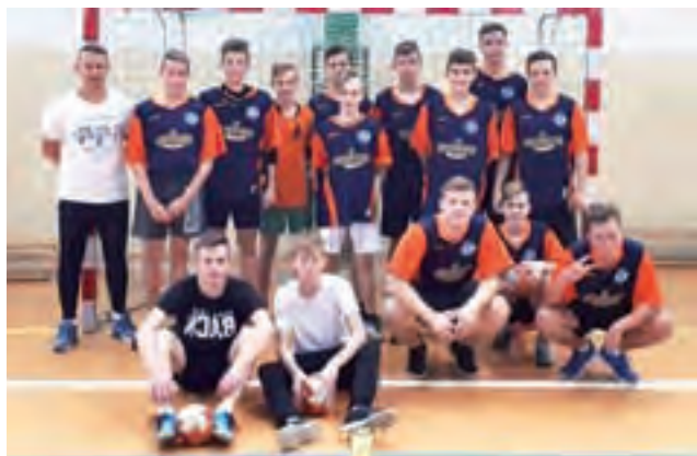
Drużyna SP 2 Łowicz pewnie wygrała powiatowe zmagania.

Tradycyjnie dobrze zaprezentowali się również szczypiornistki z SP Popów, którzy ostatecznie