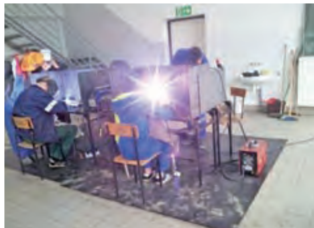
Kurs spawania elektrodami otulonymi dla młodzieży możliwy był w ramach poprzedniego projektu, jest dostępny też obecnie.

Na terenie szkoły powstanie Punkt Informacji i Kariery, w którym uczniowie będą zachęceni do podejmowania własnych inicjatyw, otrzymają porady jak przezwyciężyć bierność, a jak radzić sobie ze stresem i trudnymi sytuacjami.