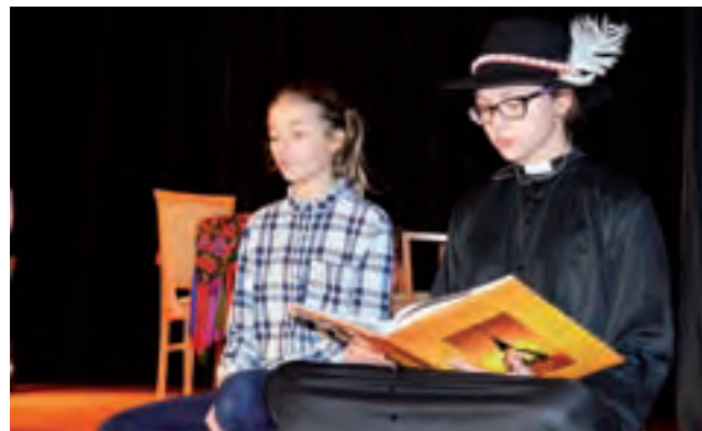
W „Tischnerowskich drogowskazach” dwie młode aktorki z Katowic czytały fragmenty nauk ks. Tischnera.

W jej przedstawieniu główny bohater – czyli stary diabeł, Krętacz – został „rozszerp-