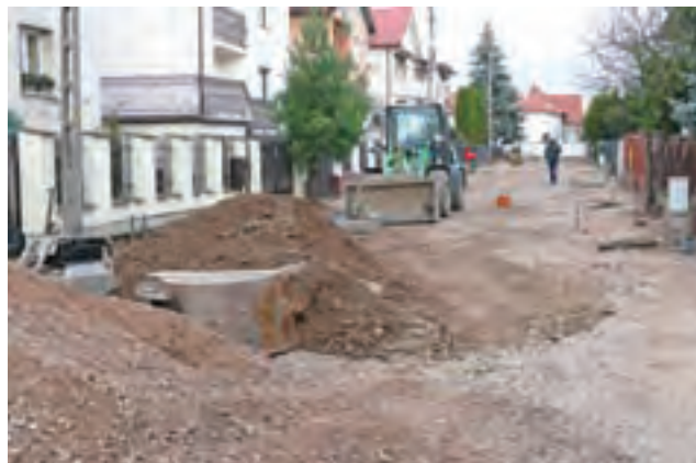
Prace na ul. Zielonej trwają od kilku dni.

W zakresie prac firma ma wykonanie nawierzchni z betonowej kostki na odcinku ulicy Zielonej o długości 128 m, który jest prostopadły do ul. Legionów. Nawierzchnia jezdni i chodnika zostanie ułożona na jednakowej wysokości, bez rozdzielających je krawężników. Chodniki zostaną jednak wydzielone pasami obniżonej kostki, które będą pełniły funkcję rynsztoków – woda spłynie nimi do krat wpustowych kanalizacji deszczowej zamontowanych na początku i na końcu odcinka, na którym trwają roboty. Firma zgodnie z projektem ma wykonać spadki umożliwiające jej spływ od środka w obu tych kierunkach.