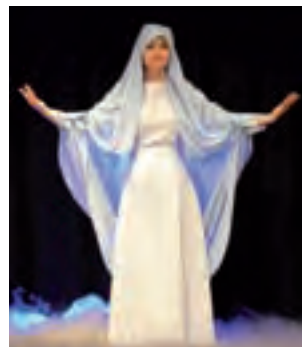
W przedstawieniu „Towarzystwo Stwórcy” piękna kobieta symbolizowała mądrość.