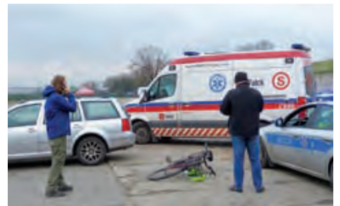
Do zdarzenia na miejskiej targowicy doszło na wysokości bramy położonej najbliżej ul. Piłsudskiego.

Po 1,5 godzinie poszukiwania zakończyły się sukcesem – mężczyzna został znaleziony przez policję. Nic mu się nie stało. mwk