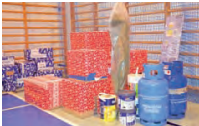
Potrzeby zgłaszane w ramach Szlachetnej Paczki są różne, tak jak różne są historie rodzin. W tej znalazły się m.in. farby do malowania ścian.