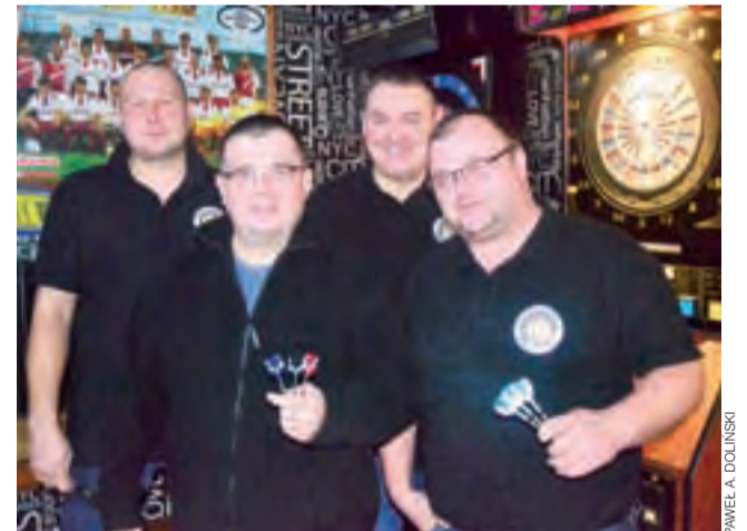
Czterech zawodników zdobyło w niedzielnym spotkaniu punkty dla ŁKD Leg Łowicz.