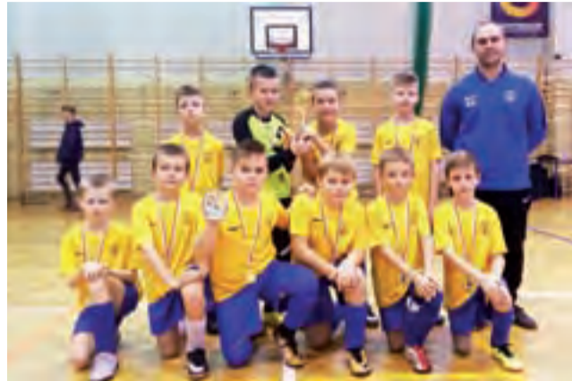
Championsi zdobyli brązowe medale w turnieju Unia Cup – rocznik 2009.

– Pierwszy mecz zagraлиśmy z Pogonią Grodzisk Mazowiecki i zaczęliśmy jak można tylko turniej od wysokiej przegranej, bo aż 8:0. To oczywiście był dla nas bardzo trudny, bo po pierwszym meczu chłopcy spuścili głowy w dół i nie było widać żadnego entuzjazmu. Wiedzieliśmy więc, że następny mecz musimy po prostu wygrać, żeby odzyskać pew-