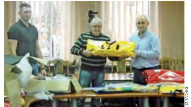
Sprzęt strażacki już trafił do jednostek OSP, ale druhowie jeszcze nie mieli okazji, żeby go użyć.