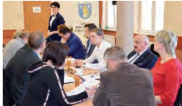
Na sesji Rady Gminy Kocierzew Płd. podwyżka za śmieci została przyjęta, ale tylko 4 głosami „za”, przy 2 przeciwnych i 9 wstrzymujących się.

Obecnie w województwie łódzkim obowiązuje plan gospodarki odpadami dla województwa łódzkiego na lata 2016-2022 (z uwzględnieniem lat 2023-