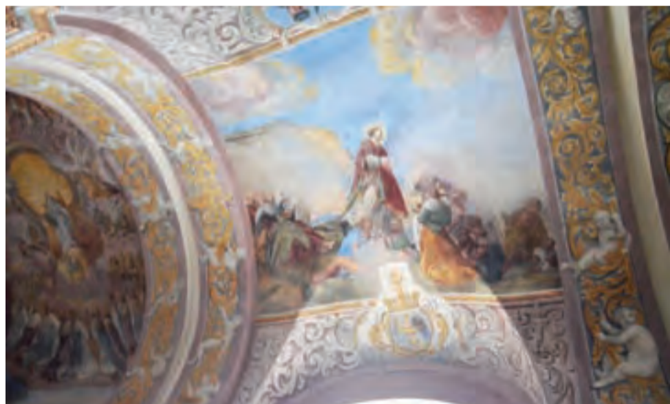
Trudno z całą pewnością stwierdzić, który święty uzdrowia chorych na tym malowidle.

Odsłonięte malowidło przedstawia scenę ekstazy św. Teresy z Avili. Wielka mistyczka z XVI