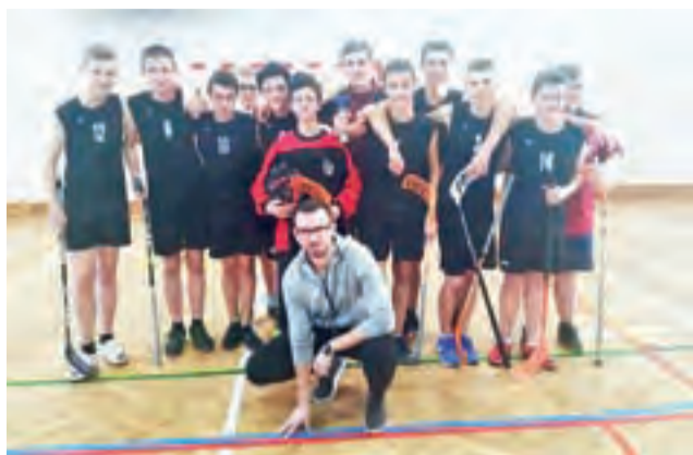
Reprezentanci z Nowych Zdon wygrali zawody powiatowe w Bielawach.

1. SP w Nowych Zdunach 2 pkt. 2. Gimnazjum nr 2 w Dzierżgówku 0 pkt.