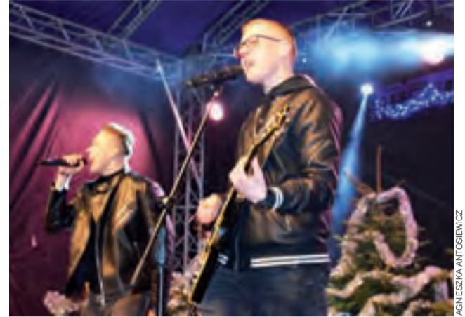
Koncert zespołu discopolowego Dejm. Przeboje, takie jak „No chętnie”, „Moja wariatka” znali i śpiewali wszyscy z publiczności.