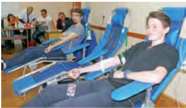
Uczniowie Zespołu Szkół na Blichu w czasie poboru krwi 10 grudnia.

Oddział łowicki PCK nie rezygnuje jednak w kolejnych latach z organizowania w listopadzie