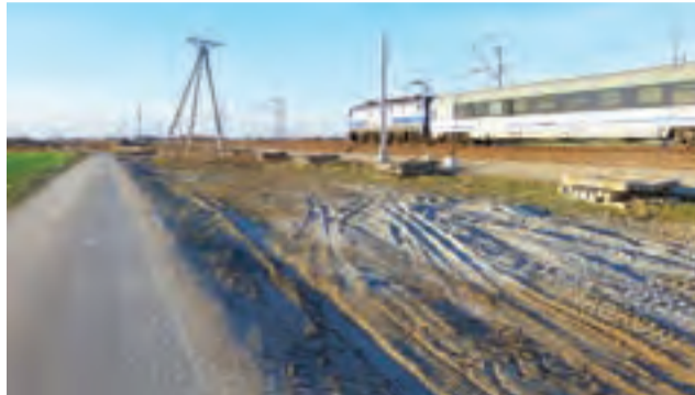
Na terenie gminy Zduny niszczone są drogi w okolicach linii kolejowej E-20, co jest związane z prowadzoną przez kolej inwestycją.

Remont odcinka linii E-20 przebiegający przez gminę Zduny rozpoczął się jesienią tego roku. Obecnie roboty są prowadzone