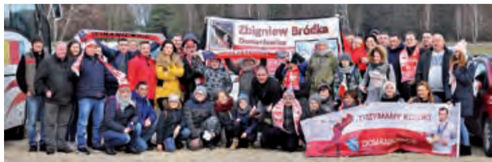
Kibice z Domaniewic na parking przed halą w Tomaszowie.

Polacy w drugiej parze zmierzili się z Białorusinami. Od początku biegu nasi panczeniści jechali poprawnie technicznie ale niestety nie za szybko. Nadspodziewanie dobrze prezentował się