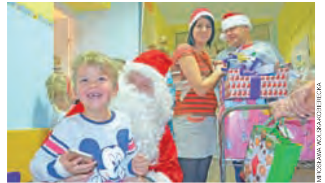
Mikołaj – co widać na zdjęciu – wywołał na twarzach dzieci uśmiech. I na tym organizatorom akcji najbardziej zależało.

Jeszcze w ten sam dzień, późnym wieczorem, na Facebooku GOK Bolimów pojawiła się informacja, że Szkolny Klub Wolontariatu zebrał podczas wydarzenia kwotę 1.836,20 zł. aa