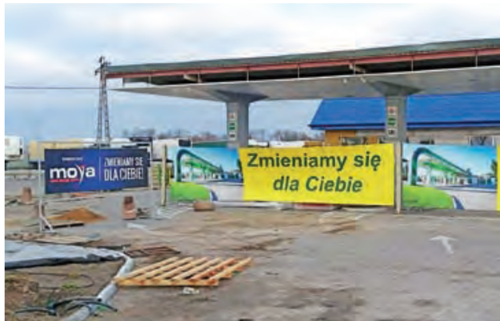
Moya na zamkniętej obecnie stacji reklamuje się od początku rozpoczęcia prac. Zdjęcie przedstawia stan z listopada.

tego wystarczająco długo działał w tym sektorze. Rezygnacja z prowadzenia stacji nie oznacza jednak w jego przypadku rezygnacji w ogóle z prowadzenia własnego biznesu. – Dalej prowadzę działalność gospodarczą, ale nie jest ona już związana z paliwami – powiedział. Przyznał, że czuje satysfakcję z ponad 20 lat działalności przy Poznańskiej. – Nie spotkaliśmy się z pretensjami klientów, zawsze staraliśmy się sprostać ich wymogom, oferowaliśmy paliwa dobrej jakości – mówi – prowadzenie stacji paliw to bardzo odpowiedzialne przedsięwzięcie, obciążone powtarzającymi się kontrolami, koniecznością zdo-