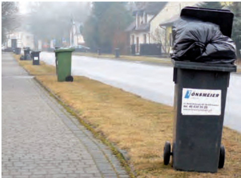
Kosze na śmieci ustawione wzdłuż Alei Legionów w Nieborowie.

nić, nie mamy alternatywy. Nie-sprawiedliwym jest to, że obowiązek przyjęcia uchwały spada na radnych, podczas gdy wysokość przyjmowanych stawek tak naprawdę od nich nie zależy.