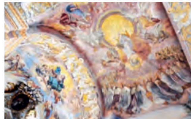
Jeszcze w lipcu konserwator mówił o bliżej nieokreślonej „scenie eschatologicznej”. Po odkryciu całości może już z całą pewnością stwierdzić, że to scena z Apokalipsy św. Jana.

Najdłużej czekaliśmy na odkrycie fresku w nawie bocznej, na zachodniej ścianie kościoła, w miejscu, gdzie przez lata znajdował się ołtarz Przemienienia Pańskiego, który wymaga konserwacji. Po odnowieniu zostanie przeniesio-