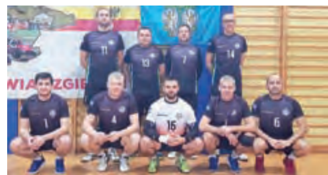
Mocny zespół nauczycieli z Łowicza tym razem na drugim miejscu.

Mecz finałowy z ekipą Głowna był wyrównany, ale to miejscowi cieszyli się z wygranej. Nasi nauczyciele za łatwo wygrali pierwszą partię (25:18) i chyba nieco się zdekoncentrowali. W kolejnych