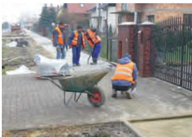
Pracownicy Danetpilu w czasie prac przy budowie chodnika w Mysłakowie.

Powiat nie przewidział i nie przewiduje natomiast utwardzenia parkingu przy drodze do szkoły w sąsiedztwie przejazdu kolejowego. – To nie jest nasz teren, ale kolei – powiedziała nam Gajek-