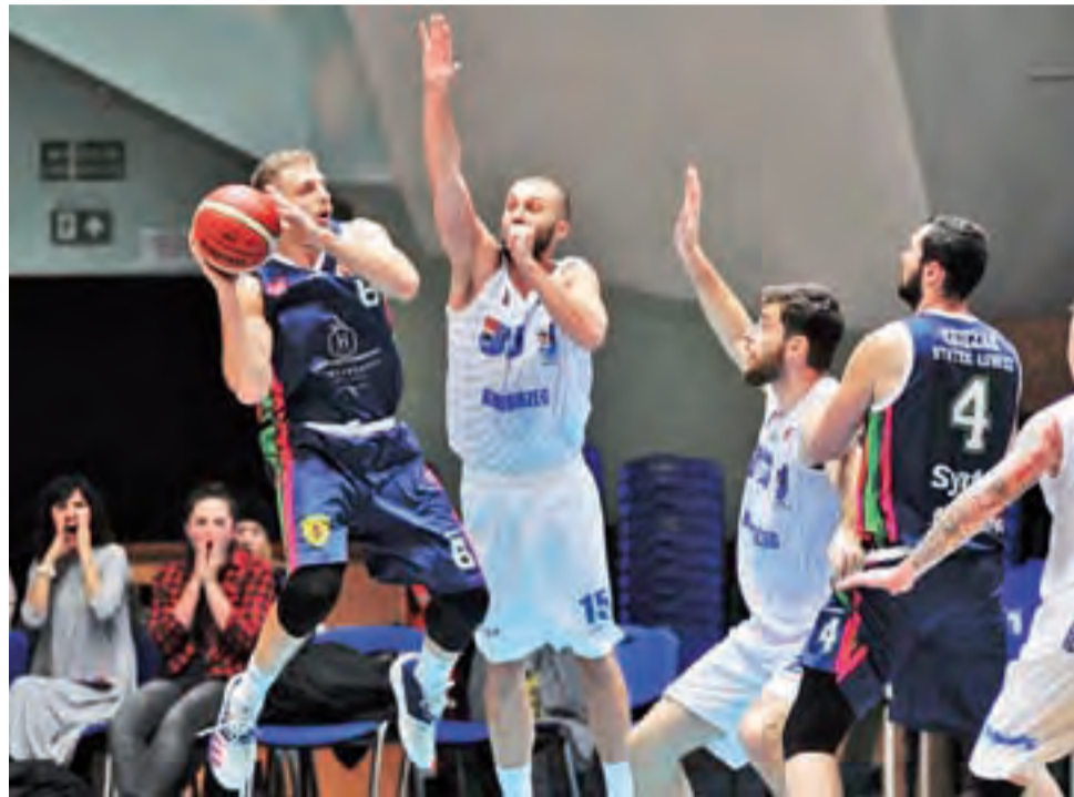
O meczu w Kołobrzegu Księżacy muszą szybko zapomnieć.

– To co pokazał zespół w pierwszej połowie, to śmiało można nazwać żenadą. Jak byśmy