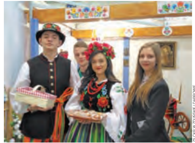
Uczniowie ze Zduńskiej Dąbrowy na Narodowej Wystawie Rolniczej pokazali się w łowickich strojach.

Na terenie targów można było oglądać zarówno ekspozycję prezentującą historyczne, jak i współczesne maszyny rolnicze, w tym najnowocześniejsze urządzenia, jak np. drony, wykorzystujące