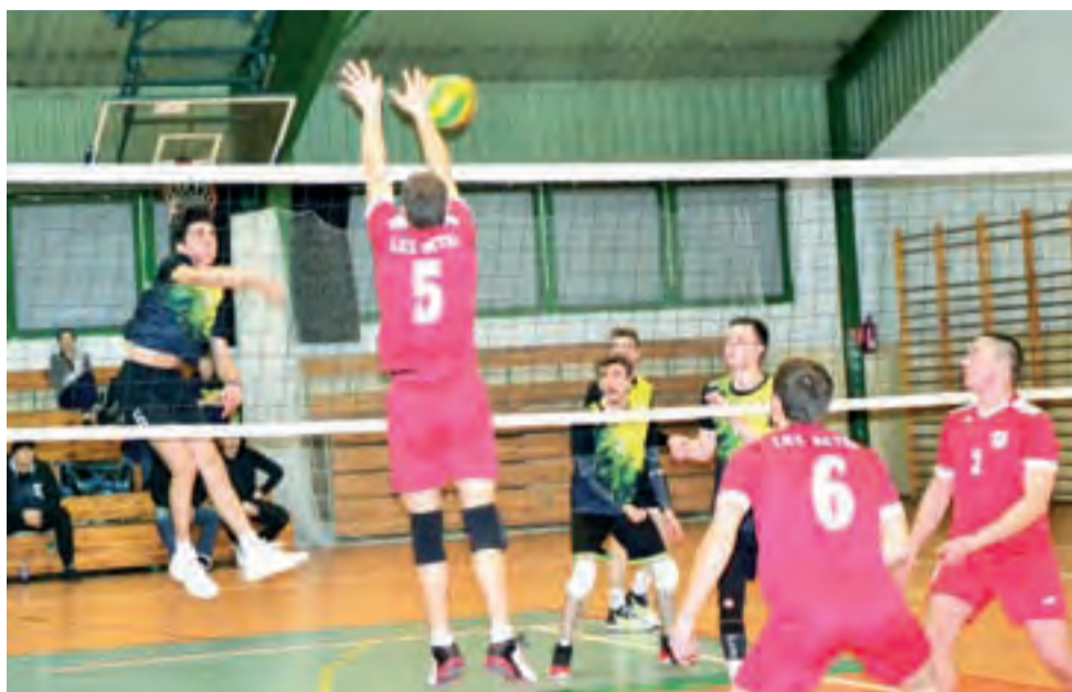
W meczu na szczycie LKS Retki pokonały UKS Korabkę I 3:1.

■ UKS Korabka II Łowicz – Dora Digital Łowicz 3:0 (26:24, 25:23, 25:18)