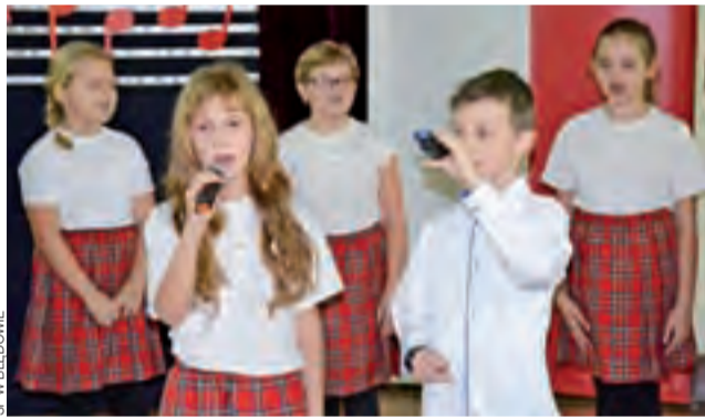
W szkole w Błędowie, nie pierwszy raz w ostatnim czasie, królowały białoczerwone barwy.