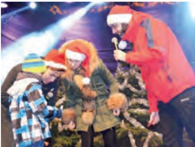
A jaki to numer wygrał nagrodę od sponsora? Na scenie jeden z posiadaczy szczęśliwego kuponu.

Dla wielu dzieci spotkanie z Mikołajem było wyjątkowym przeżyciem, dlatego rodzice nie zmarnowali okazji, aby uwiecz-