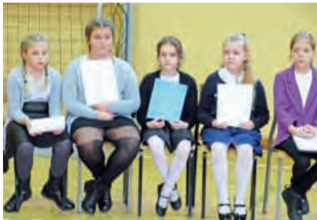
Dziewczęta przygotowywały się do występu od czerwca, bo muzyka Chopina jest wymagająca.