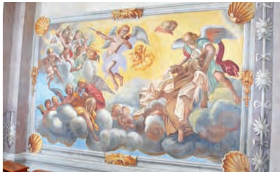
Malowidło przedstawiające ekstazę świętej Teresy na ścianie bocznej kościoła zostało zaprezentowane podczas jubileuszowej mszy świętej.