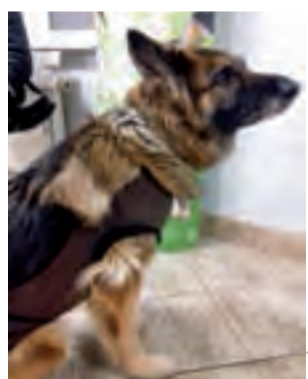
Bella, na leczenie której zbierane są grosiki, jest 12-letnią suką po operacji onkologicznej.

W ramach akcji przekazane zostały do szpitala również książki, zbierane w kilku przedszkolach i szkołach w Łowiczu, okolicach oraz półki na nie do zamontowania na ścianach. mwk