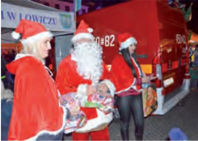
Mikołaj i jego urocze pomocnice rozdają paczki przygotowane dla najmłodszych.