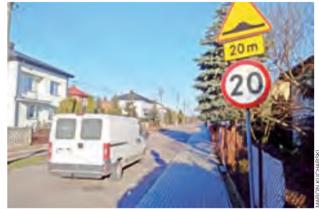
Na ul. Wólczyńskiej znajdują się trzy progi zwalniające.

i planistyczne zaplanowali w przyszłorocznym budżecie. ewr