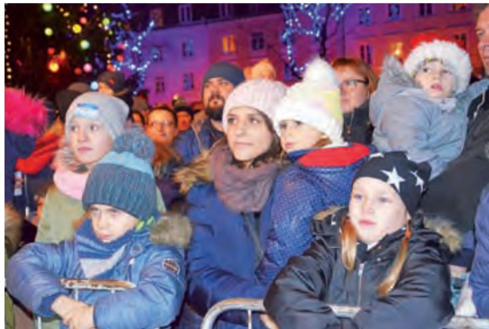
Dzieci i ich rodzice z zaciekawieniem oglądali bajkę pt. „Czas zimy” w wykonaniu aktorów z Teatru Avatar z Legnicy.

nić te chwile na pamiątkowych zdjęciach.