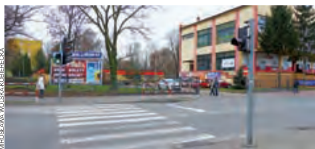
80 i 81-letnia kobieta zostały potrącone na tym przejściu dla pieszych, na wysokości Domu Chłopa przy ul. Kurkowej.

Policja ustala, jakie przebieg miało zdarzenie. Ze wstępnych ustaleń wynika, że Kia jechała ul. Kurkową w stronę Sikorskiego. mwk