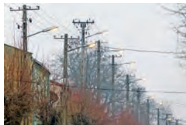
Lampy świeciły się w dzień, gdyż przeprowadzana była konserwacja.