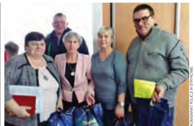
Sołtysi z terenu gminy Stryków. Uczestnicy spotkania zorganizowanego 15 lutego z inicjatywy strykowskijskich dzielnicowych.

■ 16 lutego o godz. 8.05 w Sosnowcu na drodze krajowej nr 71 doszło do kolizji. Kierujący Hondą