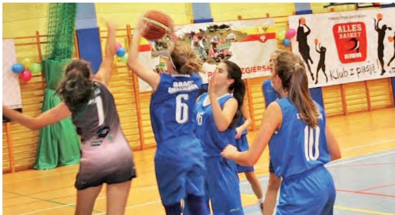
Alles Basket Głowno (fioletowe stroje) jest liderem rozgrywek gr. D Wojewódzkiej Ligi Koszykówki do lat 16.