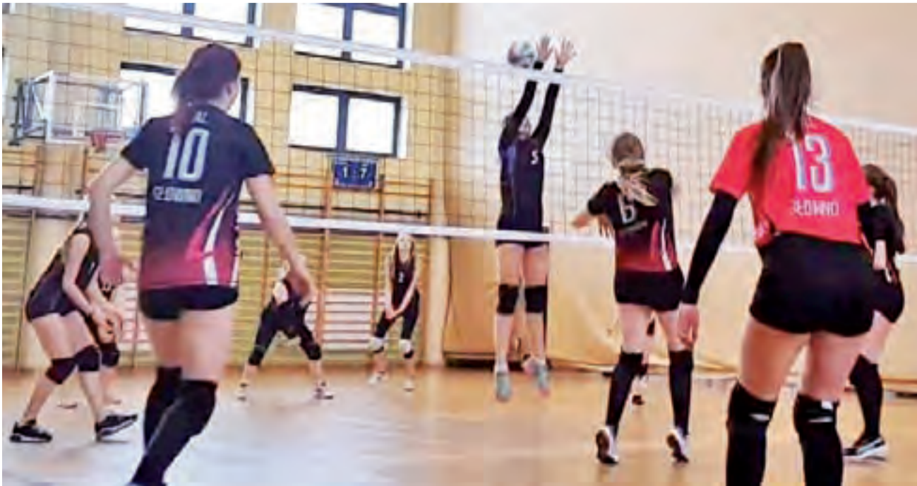
Siatkarki Stali Głowno (czarno-czerwone stroje) liczą, że uda im się podtrzymać wysoką formę przez cały sezon aż do finałów w kwietniu.

Siatkówka | 12. kolejka I Ligi ŁALS Kobiet