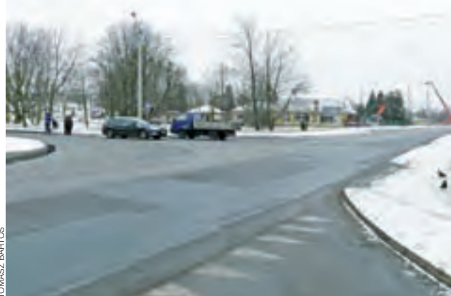
Widok na skrzyżowanie ulicy Warszawskiej z ul. Bolimowską widziane od ul. Gdańskiej