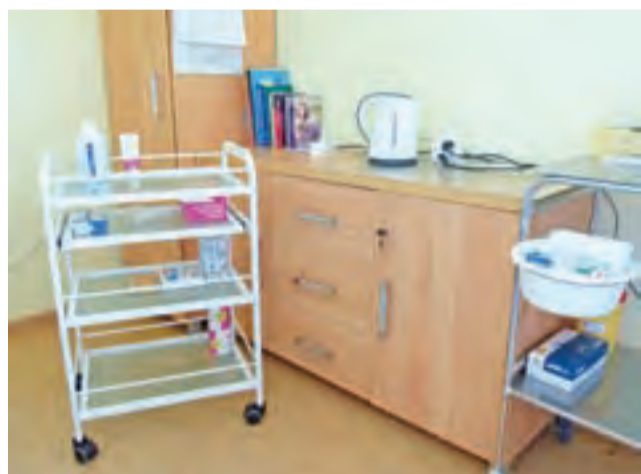
Gabinet pielęgniarski w ZSLG. Na zdjęciu nowe meble i nowa szafka medyczna (na kółkach) zakupiona dzięki dotacji.

W ZSS opieką medyczną objętych jest 84 uczniów. Profilaktyczna opieka zdrowotna w placówce realizowana przez pielęgniarkę wymaga dobrze wyposażonego gabinetu i nowoczesnego sprzętu. Niezbędny jest sprzęt w postaci: parawanu, wagi elektronicznej, aparatu do pomiaru ciśnienia tętniczego krwi, środków do nadzorowanej grupowej profilaktyki