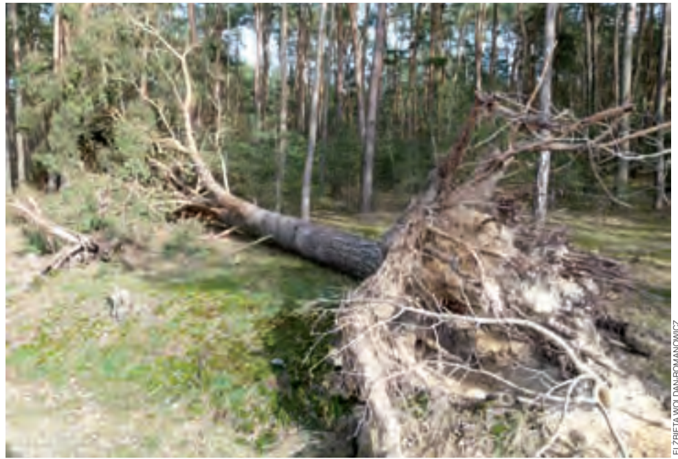
Wciąż nierzadki to widok. Poważne drzewo w lesie w okolicach Helenowa. Stan na 20 lutego.

Aktualne informacje o tym, gdzie obowiązują zakazy wstępu do lasów, znaleźć można na stronie internetowej właściwego nadleśnictwa, w przypadku Nadleśnictwa Grotniki to: www.grotnik.lodz.lasy.gov.pl . ewr