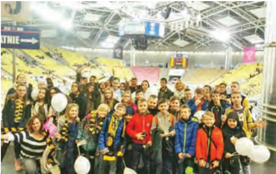
Uczniowie mieli okazję zobaczyć mecz Skry w Atlas Arenie.