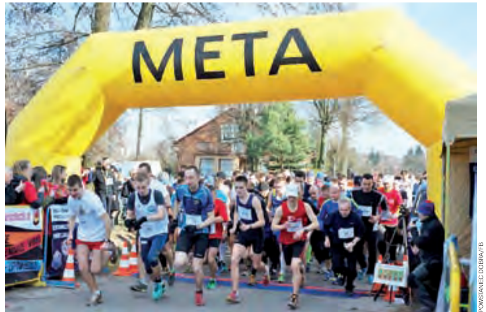
Zawodnicy startujący w Dobrej chwalą sobie organizację imprezy pod nazwą Bieg Powstańca. Z roku na rok frekwencja jest bardzo duża i tym razem nie będzie inaczej.

Celem imprezy jest wspieranie i popularyzowanie imprez biegowych w okolicach Łodzi, zachęcanie do aktywnego i zdrowego trybu życia mieszkańców gminy Stryków i Ziemi Łódzkiej, uatrakcyjnienie oferty imprez rekreacyjno-sportowych na terenie Ziemi Łódzkiej oraz integracja biegaczy oraz instytucji i klubów sportowych. Po raz kolejny miejscem rozgrywania zawodów będzie Dobra k. Strykowa. Biuro zawodów zlokalizowane będzie w Szkole Podstawowej im. 24 lutego 1863 roku w Dobrej przy ul. Witanówek 8 i zostanie otwarte w dniu zawodów o godzinie 10:00, a zamknięte o godzinie 12:30 dla marszu i 13:30 dla biegu głównego. Zgłoszenia do zawodów przyjmowane były wyłącznie poprzez wy-