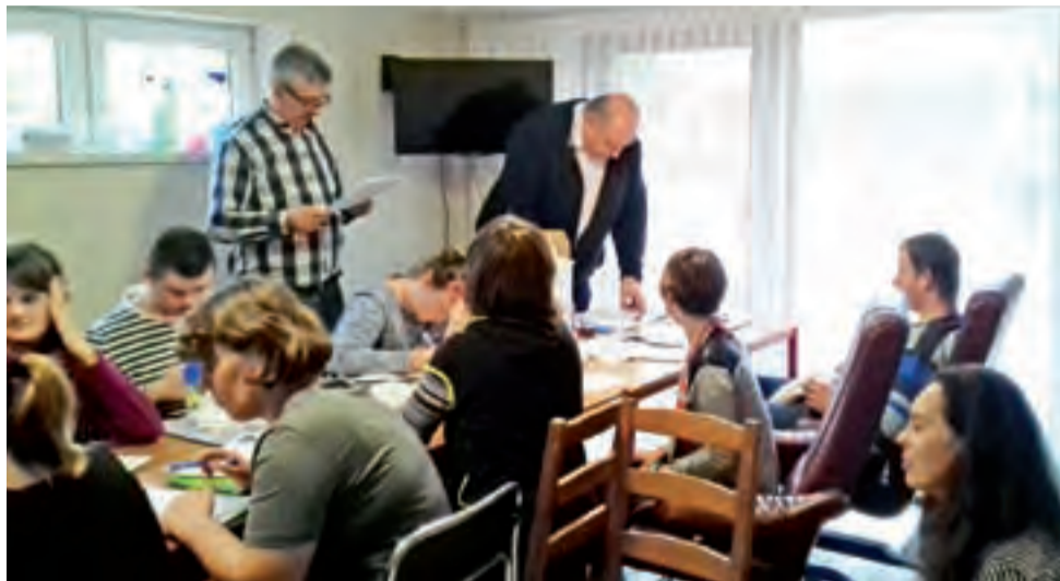
Szkolenie w domu treningowym. Uczestnicy projektu „Autostrada do samodzielności” uczyli się m.in. profesjonalnego sprzątnia.

Uczestnicy przeszli kilka treningów, m.in. trening umiejętności społecznych czy gospodarowa-