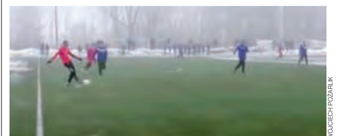
Piłkarze Strykowa (niebieskie stroje) w 2018 roku wygrywali do tej pory wszystkie spotkania, choć to dopiero mecze sparingowe.

■ Wyniki sparingów: ŁKS Łódź - KTK Kalisz 6:4, Pelikan Łowicz - Górnik Konin 1:3, RTS Widzew Łódź - Lech II Poznań 3:0, Pelikan II Łowicz - Mazur Gostynin 0:2, Zjednoczeni Stryków - PTC Pabianice 12:1, Pogoń Zduńska Wola - LKS Kwiatkowiec 0:1.