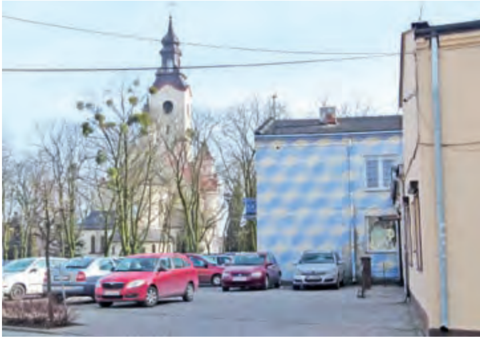
Plac Łukasieńskiego. Obecnie budynek Domu Kultury dzieli od kościoła parking i park. Przeciwnicy budowy o wiele większego nowego obiektu w miejscu starego wątpią w możliwość powodzenia tego planu.

Na pytanie, czy zostało już skonstruowane oficjalne pismo, na które czeka burmistrz Strykowa, a w którym byłyby wyartykułowane wygłoszone z ambon obawy, proboszcz odpowiada, że jeszcze nie. Wobec jego wcześniejszych zapowiedzi, można się jednak