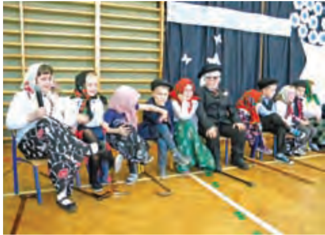
Cała grupa babć i dziadków. Starszaki z przedszkola w Mąkolicach podczas występu.

Najmłodsze dzieci przygotowały inscenizację o babci i dziadku, wiersze, piosenki itp. Duże wrażenie zrobiła grupa starszaków z przedszkola – cała przebrana za babcie i dziadków. Uczniowie klas I-II zaprosili gości na koncert życzek, w którym wystąpili m.in.: Krzysztof Krawczyk i Maryla Rodowicz. Klasa III z kolei rozegrała