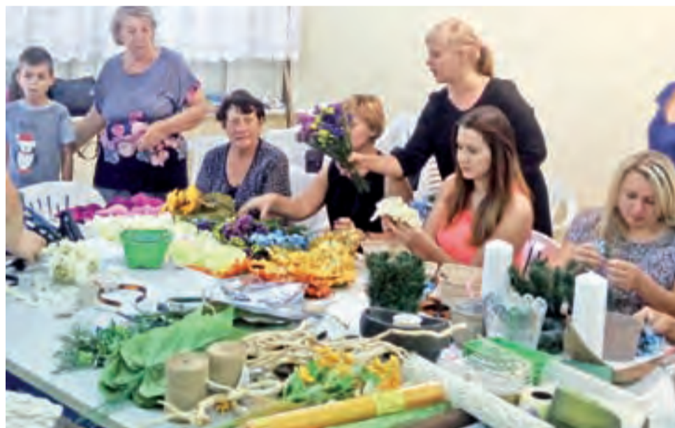
Warsztaty florystyczne zostały zorganizowane dzięki pozyskanemu przez koło mikrograntowi.

Później było jeszcze świąteczne pieczenie i dekorowanie pierniczek. Pięknie prezentujące się piernikowe serce z Kalinowa zdobyło ex aequo pierwsze miejsce w konkursie organizowanym przez OSiR w Strykowie. To „nakreśliło” do kolejnych działań. Ostatnio panie spotkały się na smażeniu pączków przed tłustym czwartkiem. Przyszło zarówno młode, jak i to trochę starsze pokolenie. Zaplanowano już kolejny Dzień Kobiet, a później pieczenie mazurków – tyle w niedalekiej przyszłości. W tej dalszej panie marzą o nowej świetlicy, w której pomieściliby się wszyscy mieszkańcy. Wówczas, kto wie, może w Kalinowie pokuszą się o bicie rekordu w lepieniu pierogów. ■