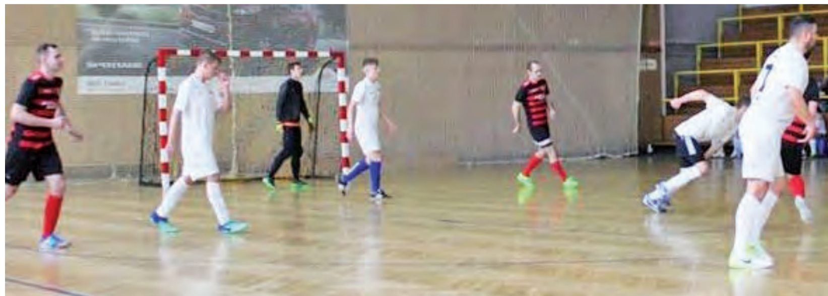
Błękitni Dmosin (czarno-czerwone stroje) w drugiej części sezonu zanotowali serię wspaniałych występów, która dała im tytuł i awans.

Futsal | 12. kolejka Zina III Ligi ŁoLiF