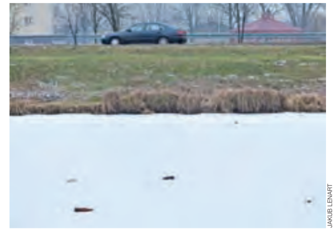
Tafla lodu upstrzona jest butelkami.

Wzór wniosku można znaleźć na stronie www.glowno.pl lub w Referacie Rolnictwa i Ochrony Środowiska Urzędu Miejskiego przy ul. Norblina 1 (pokój nr 18 na I piętrze). Dofinansowania będą realizowane pod warunkiem, że magistratowi uda się otrzymać dotację z Wojewódzkiego Funduszu Ochrony Środowiska i Gospodarki Wodnej.