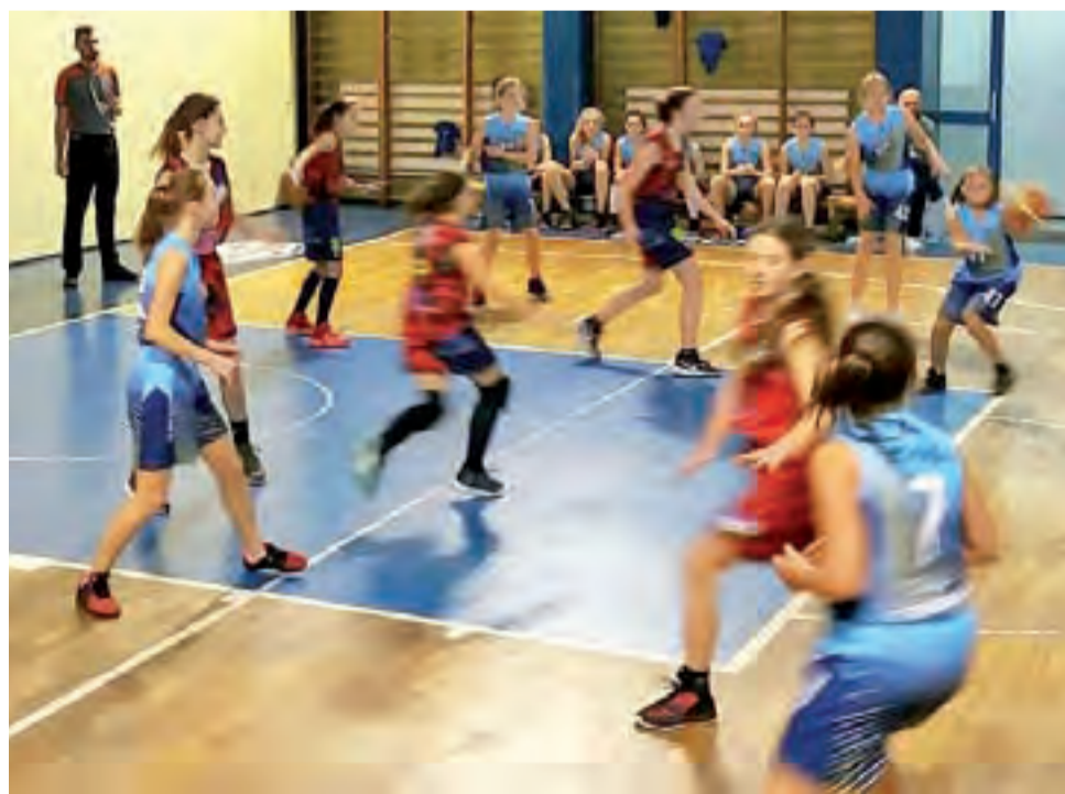
Strykowskie koszykarki TK Basket (niebieskie stroje) nabierają doświadczenia w ligowych rozgrywkach.

Kolejny mecz w lidze do lat 16 strykowianki rozegrają po kolejnej kilkutygodniowej przerwie. W sobotę, 10 marca w Łodzi rywalem TK Basket ponownie będzie AKS SMS. Sezon zakończy spotkanie u siebie w sali Szkoły Podstawowej w Dąbrowce Dużej w dniu