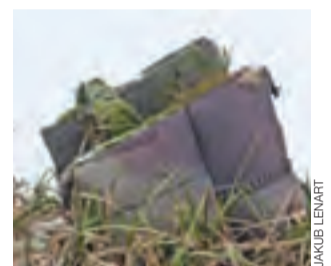
Przy brzegu można nawet znaleźć stary fotel.

Zimą dodatkowo uaktywnia się też druga grupa śmieciaków. Gdy tylko na zalewie pojawia się minimalna choćby warstwa lodu, nie brakuje osób, które z niewytłumaczalnych powodów, za wszelką cenę próbują sprawdzić jej