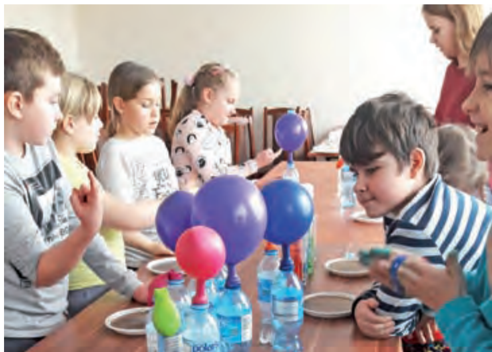
Podczas ferii w świetlicy dzieci miały m.in. możliwość poeksperymentowania.