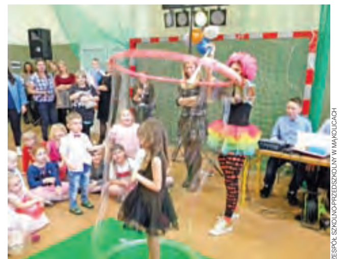
Zamykanie w bańce. Zabawa z animatorką na balu karnawałowym w ZS-P w Mąkolicach.