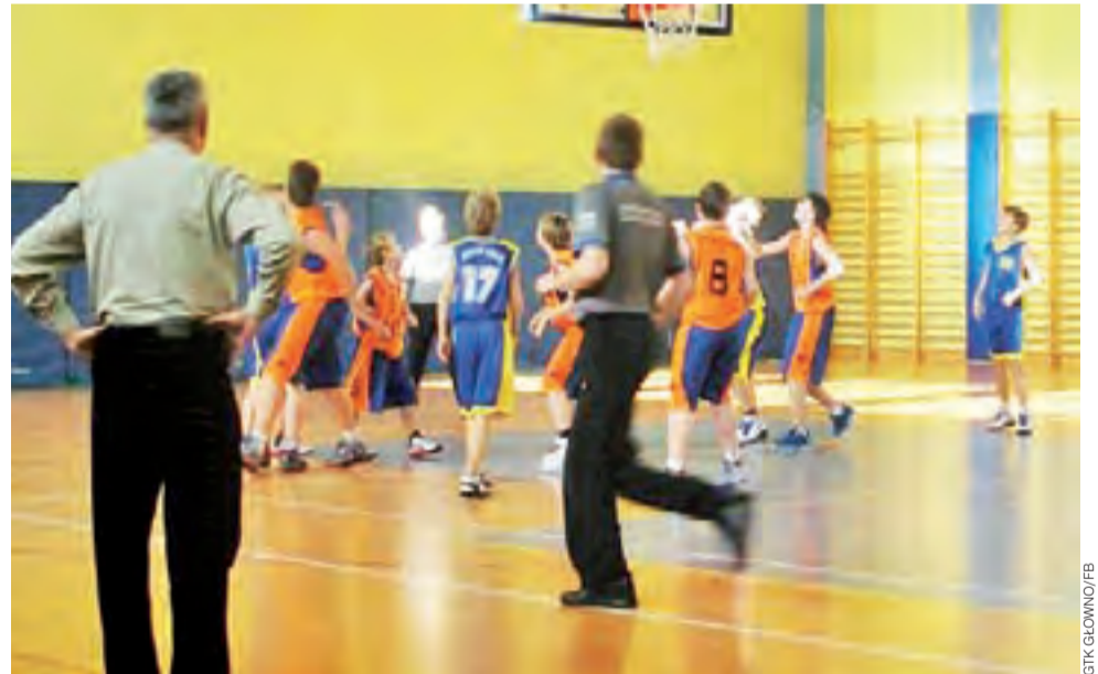
Koszykarze GTK Głowno (pomarańczowo-niebieskie stroje) byli bliscy wywalczenia kompletu zwycięstw w dwóch ligach wojewódzkich do lat 11 i do lat 14.