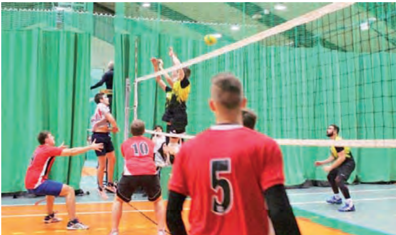
Siatkarze Mníchów z Południa Głowno (czerwone koszulki) zajęli trzeci stopień podium Amatorskich Mistrzostw Łowicza. To kolejny sukces gówniejskich zawodników, którzy w tych rozgrywkach grają już kilka lat.

Piątkowy rywal gównian był niżej notowaną drużyną, ale można było spodziewać się dość wysoko postawionej poprzeczki. Początkowo wszystko szło gładko,