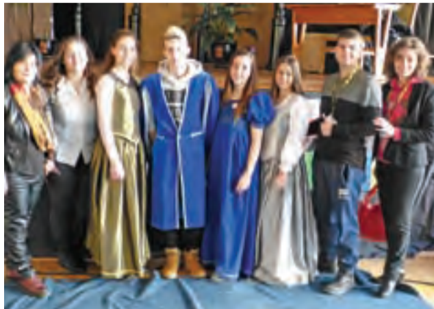
Po przedstawieniu „Kupca Weneckiego” uczniowie jeszcze długo robili sobie pamiątkowe zdjęcia w wykorzystanych kostiumach.