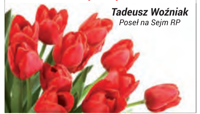
Tadeusz Woźniak Poseł na Sejm RP