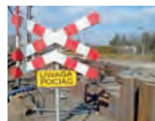
Przyczyną zmian w rozkładzie są głównie remonty.

Najistotniejsze zmiany dotyczą pociągów Łódzkiej Kolei Aglomeracyjnej – czyli kursujących na odcinku pomiędzy Łowiczem a Łodzią, co ma związek z planowaną na wiosnę intensyfikacją remontów – szczególnie na linii kutnowskiej i łowickiej. Na odcinkach tych tras nastąpi czasowe wstrzymanie ruchu pociągów. ŁKA uruchomi autobusową komunikację zastępczą, w tym autobusy przyspieszone.