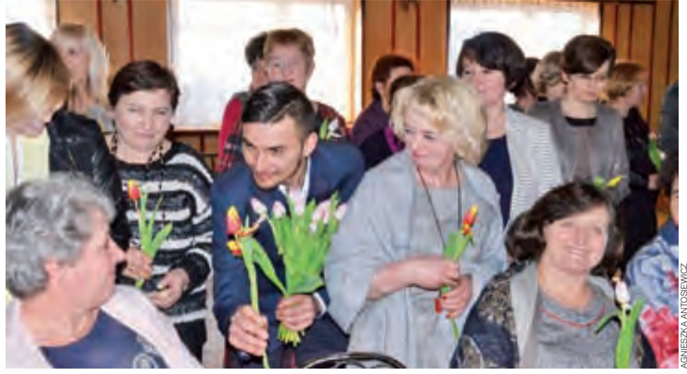
Podczas spotkania KGW w Złakowie Kościelnym delegacja druhowów złożyła paniom wizytę i każdej z nich wręczyła po tulipanie.

Organizatorem spotkania jest KGW, ale miejscowa straż dofinansowuje zakup prezentów dla kobiet. Komitet organizacyjny do ostatniej chwili utrzymywał w tajemnicy co jest w tajemniczych pudełkach, a ich wręczenie odbyło się dopiero podczas imprezy. W tym roku każda z pań otrzymała komplet talerzy. Wśród gospodyń dało się usłyszeć, że to bardzo trafiony prezent. aa