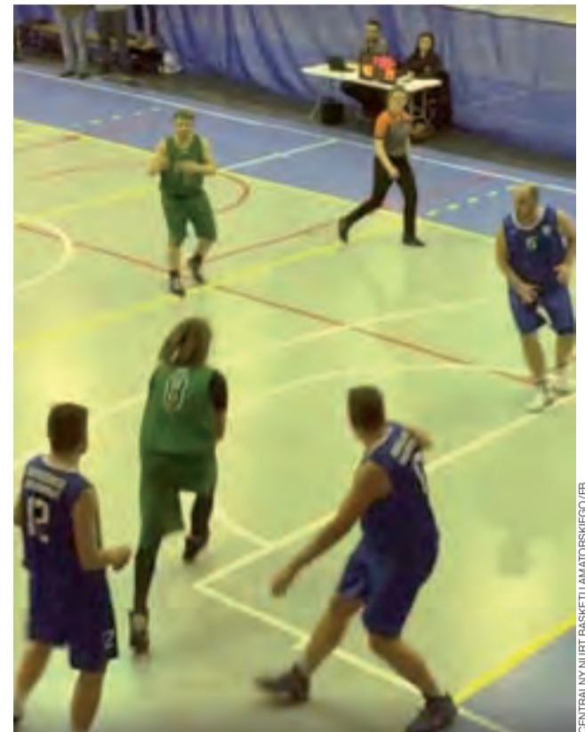
Koszykarze BKS Lalalilo Bratoszewice (niebieskie stroje) po porażce z OVOO wrócili na dobrą ścieżkę.

Występujący w zaledwie 6-osobowym składzie BKS Lalalilo przez całe spotkanie trzymał mocne równe tempo.