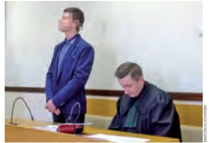
Oskarżony o zabicie psa odmówił składania wyjaśnień przed sądem. Odpowiadał wyłącznie na pytania swojego adwokata.