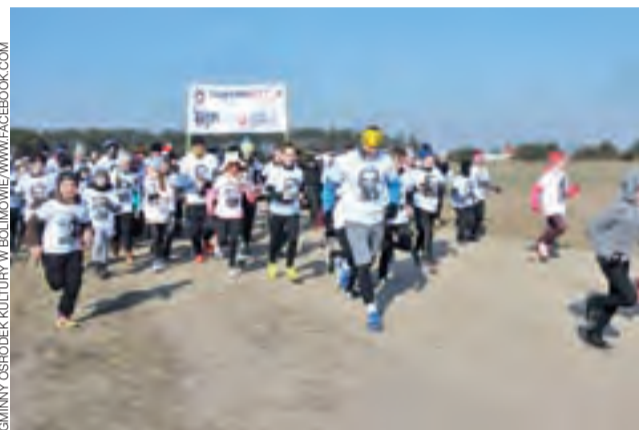
Uczestnicy biegu Tropem Wilczym w Bolimowie ruszyli na trasę.

komendanci bądź przedstawiciele wszystkich współpracujących ze szkołą służb mundurowych. Kadeci zaprezentowali przed gośćmi swoje najważniejsze dokonania i sukcesy oraz zdobyte w ciągu nauki w szkole umiejętności. tm