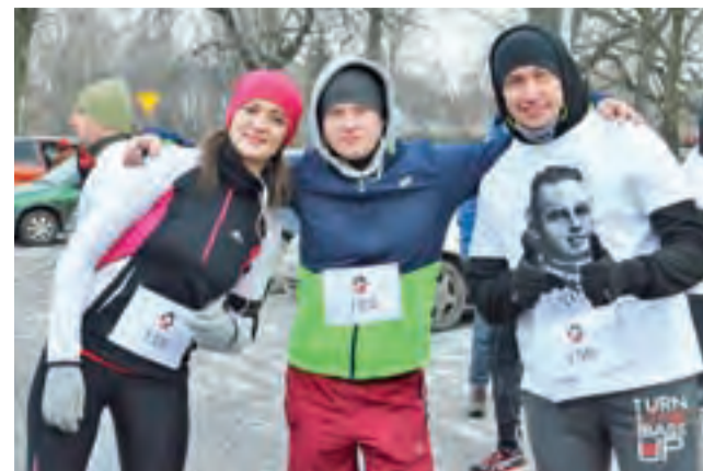
Mimo mroźnej aury, humory dopisywały uczestnikom Biegu Tropem Wilczym.