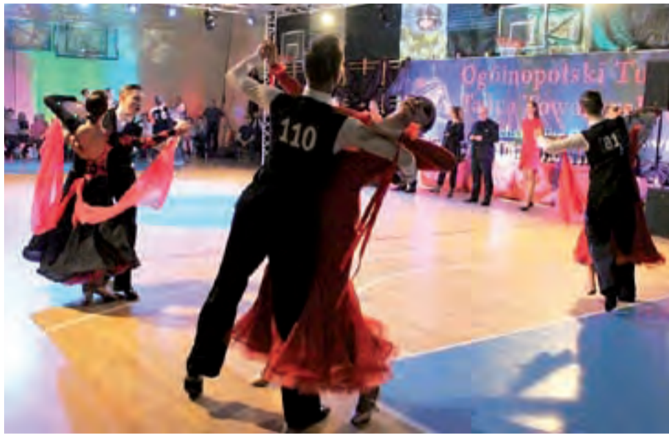
Uczestnicy Turnieju Tańca w Popowie zaprezentowali się w pięknych strojach i różnych stylach.