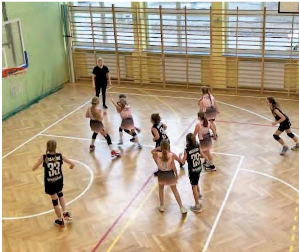
Alles Basket Głowno (rózowe stroje) dały pokaz ambitnej i nieustępliwej walki. Głowieński klub od dawna charakteryzuje taka postawa we wszystkich grupach wiekowych.

Kluczowa dla losów spotkania była pierwsza kwarta, w której cały zespół zagrał świetnie w ataku i obronie.