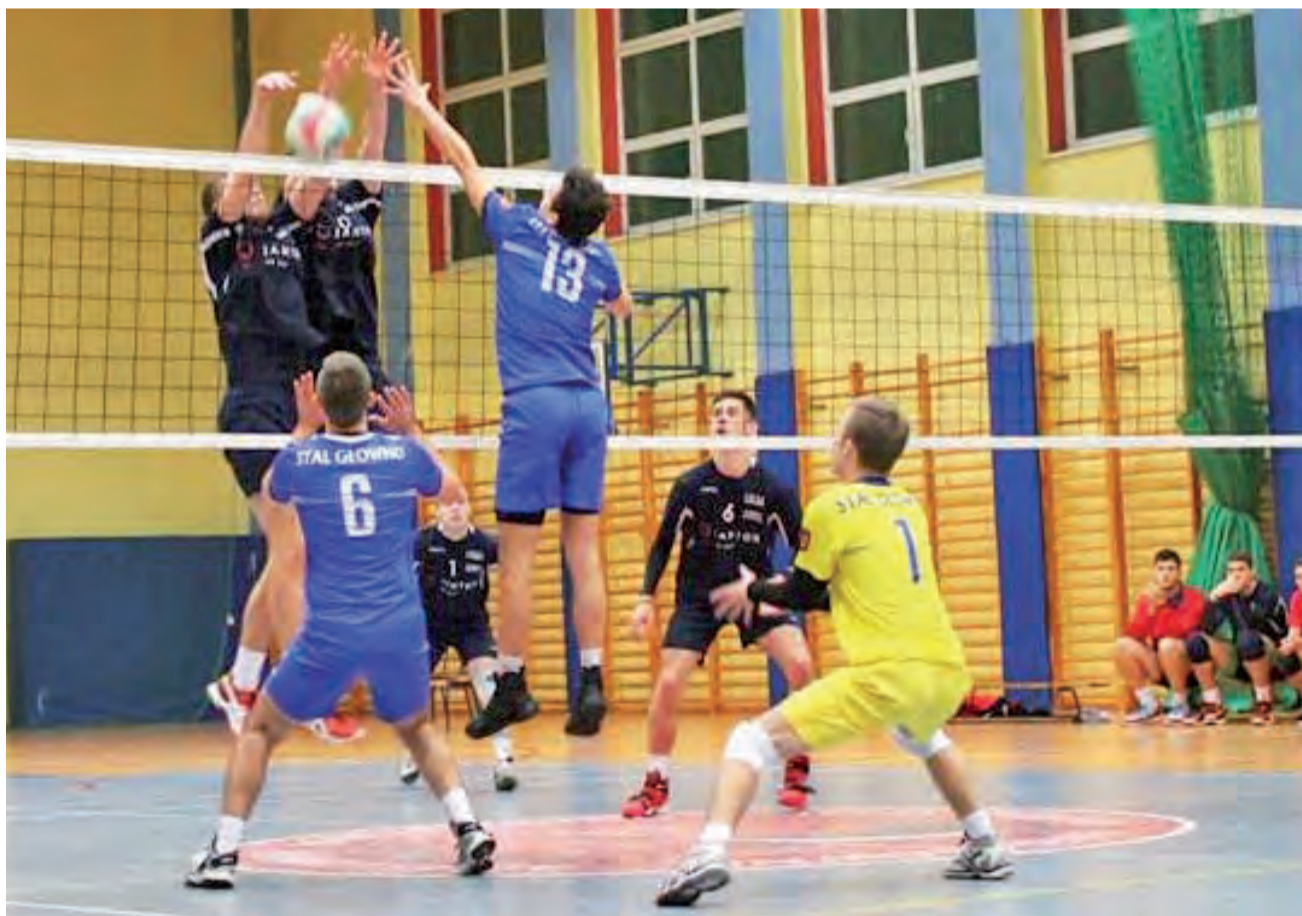
Siatkarze Stali Głowno (niebieskie stroje) byli mało skuteczni w spotkaniu z Kasztelanem, co było główną przyczyną porażki.

Głównianie tylko momentami przypominali zespół, który potrafił napsuć krwi najmocniejszym w tym sezonie drużynom III ligi. Stal źle weszła w spotkanie i po pierwszym secie przegrywała 0:1. Później koncertowa gra gości i zwycięstwo do 20 dało ponowny remis. Niestety taki stan rzeczy nie utrzymał się długo. Drużyna z Głowna zaczęła popełniać coraz