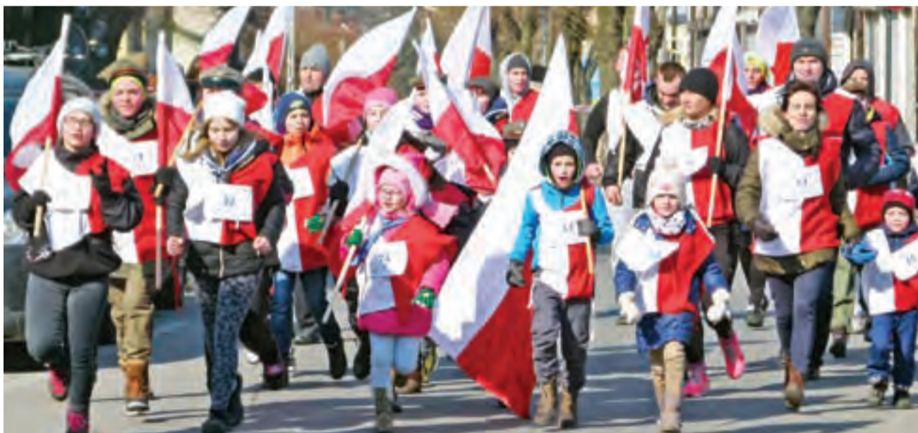
Na pierwszym w historii Biegu Tropem Wilczym w Głownie w oczy rzuciła się zwłaszcza grupa związana z hufcem ZHP im. Kornela Makuszyńskiego. Biało-czerwone flagi i kamizelki nadały imprezie patriotycznego kolorytu. Dzięki okrzykom „Czuj, czuj! Czuj!” słychać ją też stąd z daleka.