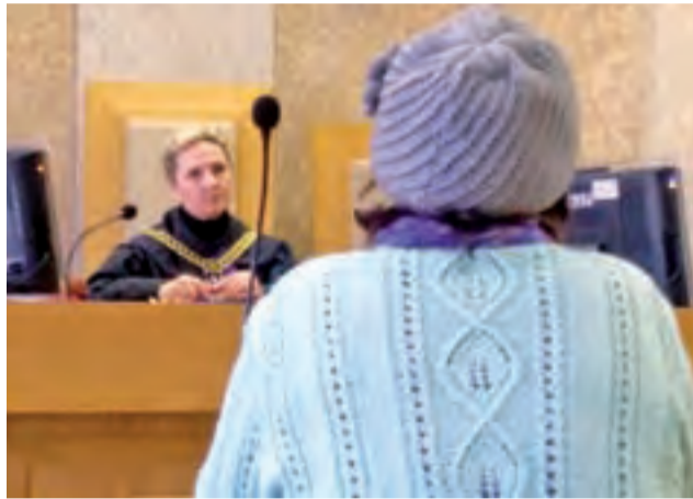
Przed sądem zeznawała m.in. matka oskarżonego.

Mówiła, że syn nie sprawiał problemów wychowawczych, choć problemy w nauce miał, nie nadużywał alkoholu, nie znęcał się nad zwierzętami, a w gospodarstwie było ich wiele: krowy, koń, kilka psów czy koty. Chętnie pomagał w gospodarstwie.