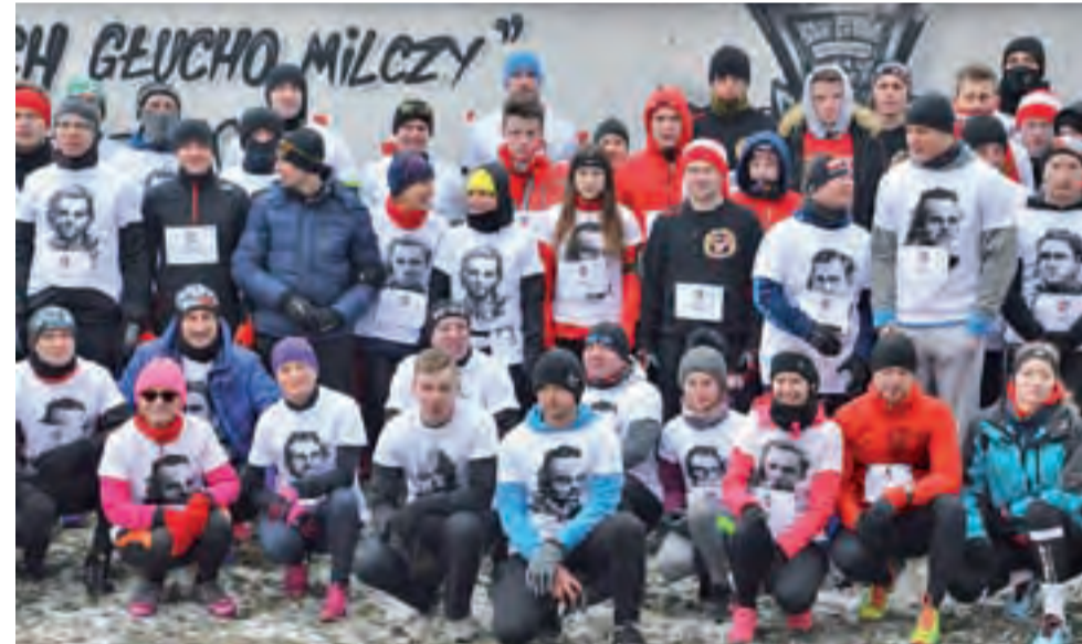
Przed startem uczestnicy ustawili się do pamiątkowego zdjęcia pod muralem upamiętniającym Żołnierzy Niezłomnych.

Łowicz | Złożyli kwiaty, zapalili znicze