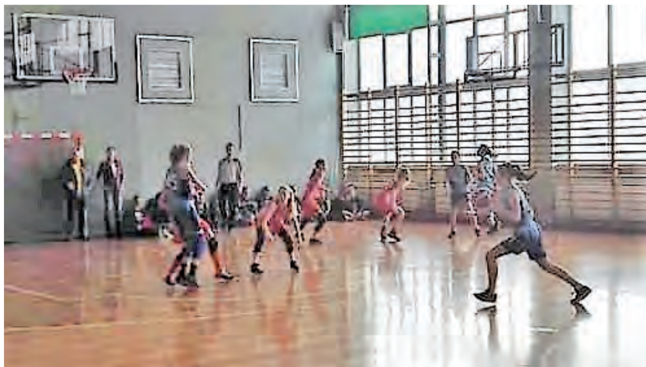
Zawodniczki TK Basket Stryków (biało-niebieskie stroje) coraz lepiej radzą sobie w rozgrywkach wojewódzkich U-14 lat.