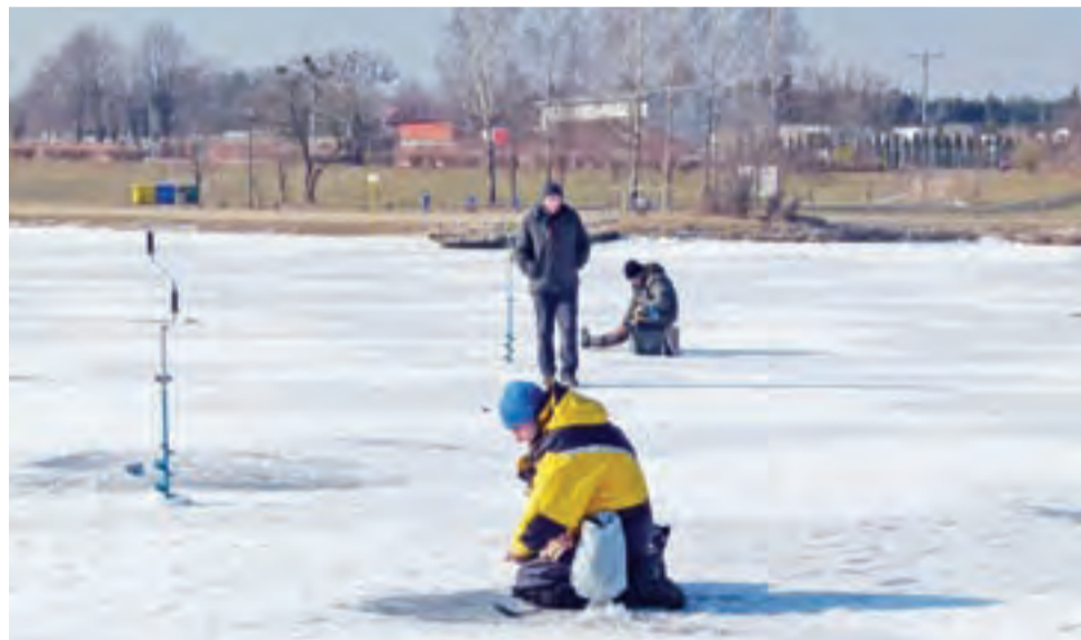
Pozycja w wędkarstwie podlodowym do najwygodniejszych z pewnością nie należy.

Wędkarstwo podlodowe wymaga specjalistycznego sprzętu, w postaci choćby niewielkich rozmiarowo (mają kilkadziesiąt centymetrów długości; łowi się kłęcząc nad dziurą w lodzie lub siedząc na niskim krzeselku) wędek, świdrów do wywierca-