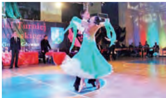
Niektóre pokazy zapierały dech i przenosiły w bajkowy nastrój.