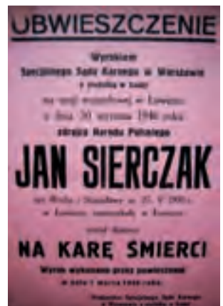
Powojenne obwieszczenie o wykonaniu kary śmierci za zadenuncjowanie Żydów.

– Myślę, że odpowiedź musielibyśmy podzielić na dwie części. Na tę obojętność, czy niechęć aktywnego pomagania, bardzo duży