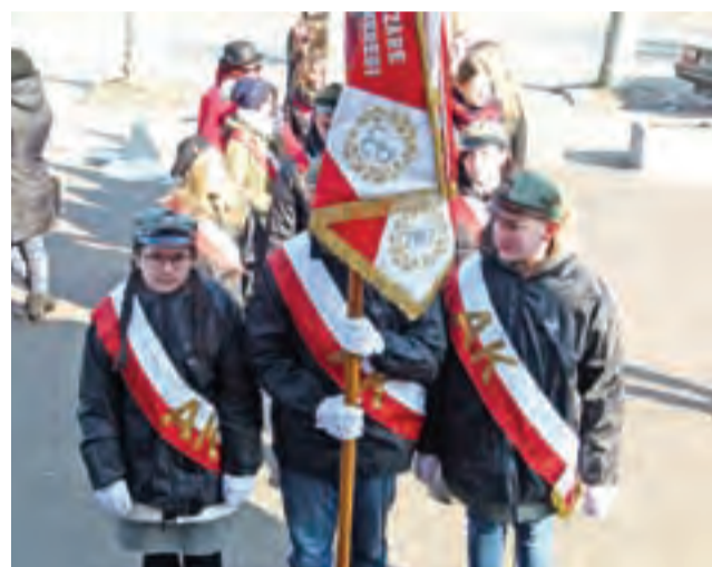
Na mszy obecne były poczty sztandarowe koła AK, harcerzy i szkół.

kaligrafii i małą degustację. Dodatkowo odbędą się występy zespołów działających przy Domu Kultury w Niesułkowie: Lipkowiarki wraz z kapelą, Rozśpiewanej Ferajny i Dziecięcego Zespołu Muzycznego. Wstęp wolny. ljs