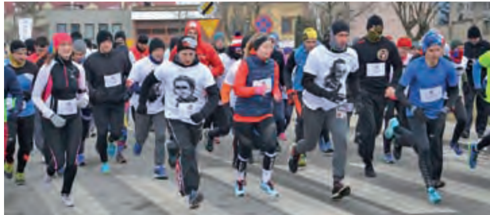
Zawodnicy wystartowali na trasę Biegu Tropem Wilczym.

Przed biegiem uczczono minutą ciszy pamięć zmarłego kil-