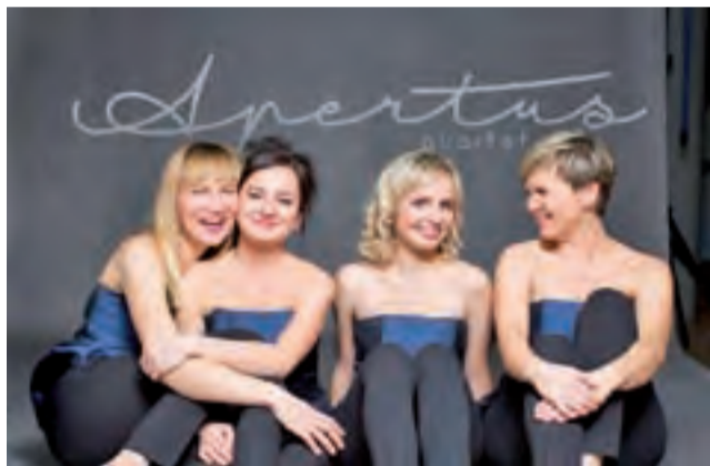
Kwartet smyczkowy Apertus Quartet wystąpi z okazji Dnia Kobiet w Muzeum w Łowiczu.

W sobotę, 10 marca, o godz. 17.00, w Muzeum w Łowiczu, w ramach cyklu „Burmistrz miasta zaprasza”, będzie można wysłuchać koncertu z okazji Dnia Kobiet. Najbardziej znane tematy filmowe zagra zespół żeński Apertus Quartet.