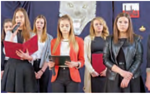
Uczniowie ZSP nr 4 w Łowiczu podczas apelu z okazji Narodowego Dnia Pamięci Żołnierzy Wyklętych.

Uczniowie uczcili pamięć Żołnierzy Wyklętych programem wierszy i piosenek patriotycznych, wykonanych przy akompaniamencie akordeonu i gitary. Mocno wybrzmiało w nich, że w czasach kiedy komuniści pozbywali się ostatnich obrońców niepodległej Polski, wielu partyzantów poległo z bronią w ręku, a innych więziono i poddawano okrutnym torturom. Część z nich zasiadała na ławie oskarżonych w pokazowych procesach, których wynik był z góry przesądzony – natychmiastowa kara śmierci.