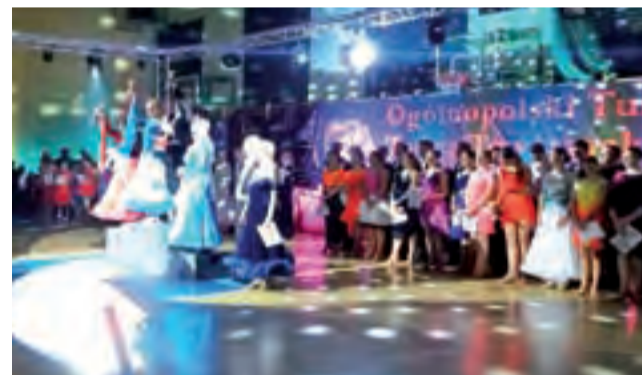
Turniej w Popowie miał też fantastyczną oprawę muzyczną i świetlną.