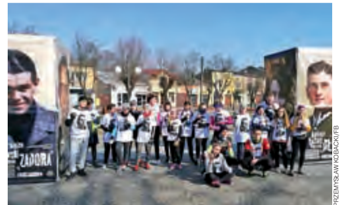
Uczestnicy Biegu Tropem Wilczym w Głownie cieszyli się na myśl, że mogą uczcić pamięć żołnierzy.