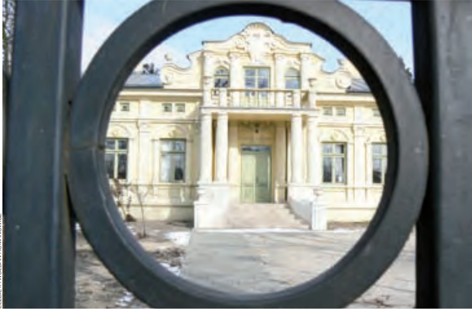
Nowa siedziba ŚDS. Widok zza bramy na zmodernizowany zabytkowy pałacyk. Stan na 28 lutego.