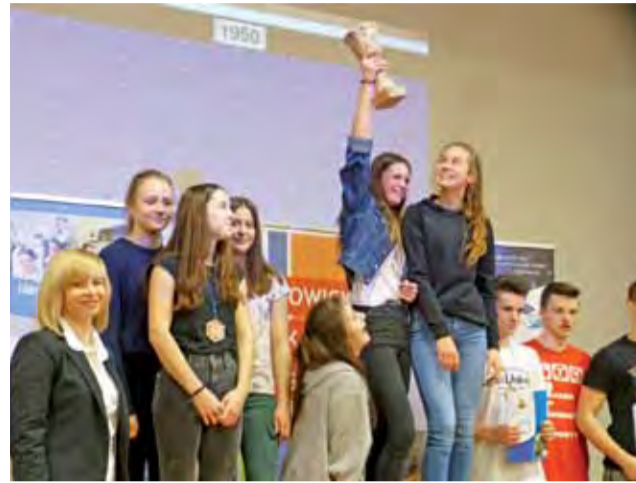
W klasyfikacji gimnazjów zwyciężył oddział gimnazjalny Szkoły Podstawowej nr 2 w Łowiczu.

Najlepszy czas w rywalizacji męskiej i zarazem w całych mi-