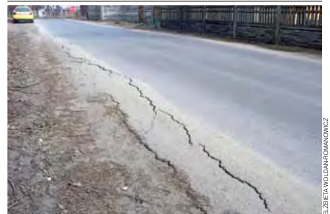
Nowa nawierzchnia na drodze gminnej w Antoniewie nie przetrwała nawet roku w zadowalającym stanie. Na kilku odcinkach, przy skrajach jezdni, z jednej lub drugiej jej strony, rysują się już głębokie pęknięcia. Każdy cięższy transport i każdy większy mróz może tylko pogłębić erozję. Droga, wybudowana w 2017 r. przez firmę Drogomex, jest na gwarancji, mieszkańcy liczą więc na skuteczną naprawę gwarancyjną. ewr