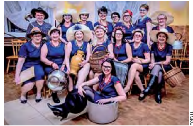
Nowostawianki zafundowały sobie m.in. sesję zdjęciową.