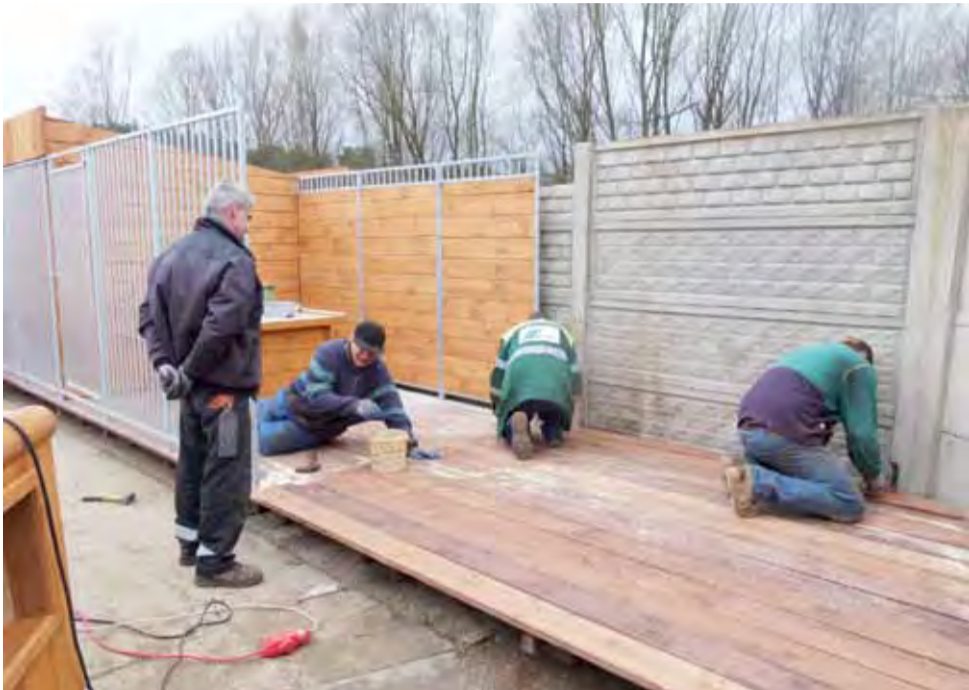
Prace w toku. Tak powstawały nowe, bardziej przestronne boksy dla psów. Stan na 14 marca.