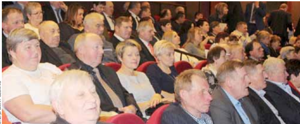
Pełna widownia. Na zdjęciu sołtysi z gminy Głowno podczas gali w Teatrze Wielkim w Łodzi z okazji Dnia Sołtysa.