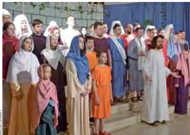
Finałowa scena Misterium Męki Pańskiej.