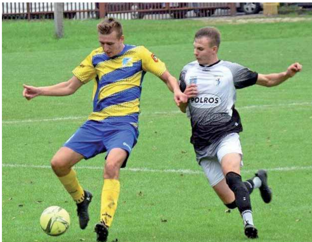
Piłkarze Stali Głowno (żółto-niebieskie stroje) wkrótce rozpoczną rundę rewanżową Łódzkiej Klasy Okręgowej.