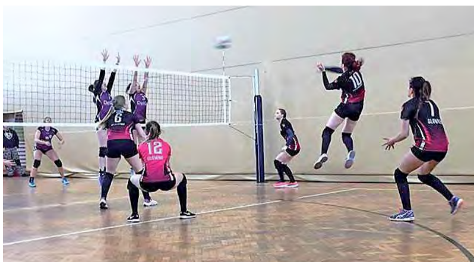
Stalówki (czarno-czerwone stroje) muszą odzyskać formę przed finałowymi pojedynkami.

■ Ostatnia, 18. kolejka odbędzie się w sobotę, 24 marca: Wieluński Klub Sportowy Siatkarz Wieluń - Klub Sportowy Stal Głowno, KS Lechia II Tomaszów Mazowiecki - LUMKS Kasztelan Rozprza, ULKS MOSiR Sieradz - MKS Zduńska Wola.