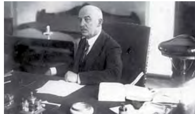
Gabriel Narutowicz w swoim gabinecie.

Historia i Terazniejszość | Czego nas uczy ostatnie 100 lat