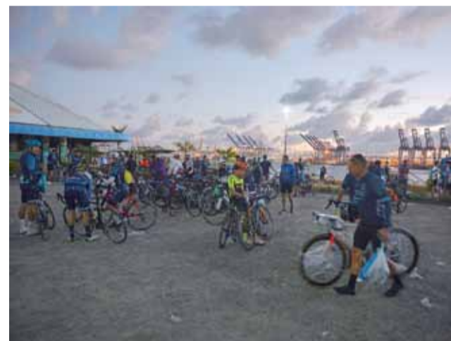
Międzynarodowy wyścig kolarski pomiędzy dwoma oceanami rozpoczyna się w Colon, a kończy w Panamie.

ku niebu, sprawiając, że w bezpośrednim jej obliczu czujemy się jeszcze bardziej bezbronni i małe. Trzeba mieć dużo szczęścia, by „jego wysokość” móc podziwiać w całości. Od wczesnych porannych godzin koroną kołosa szczególnie przykrywa bowiem gęsta poducha z chmur, która niechętnie i rzadko kiedy odkrywa