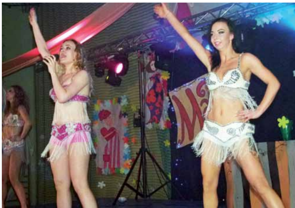
To był show! Artystki z zespołu Maraquija prezentowały na scenie nie tylko talenty wokalne i taneczne, ale i swe kobiece wdzięki w kuszonych kreacjach. Więcej czytaj na str. 10.

Głowno | Przedstawiciele SIME na komisji