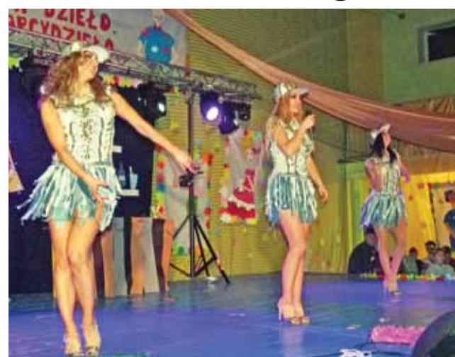
Roztańczone i rozśpiewane dziewczyny. Zespół Maraquja porwał publiczność do zabawy.