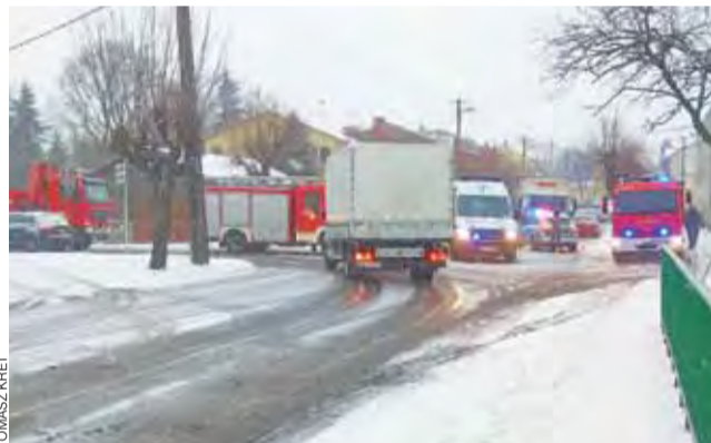
Potrącenie na Zgierskiej. Na pierwszym planie widać jak wyglądała wówczas nawierzchnia drogi.

w końcu XV w., był obrabowany i spalony przez Szwedów, został odbudowany w 1696 r. W latach 1898-1901 przeszedł przebudowę wg planów arch. Konstantego Wojciechowskiego. ewr