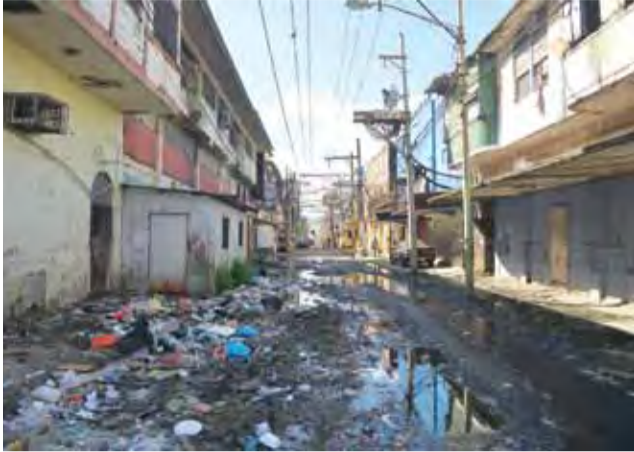
Slumsy w Colon straszą i inspirują.