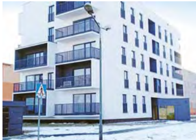
Blok przy ul. Medycznej jest już prawie w całości zamieszkały.

Decyzję o tym, żeby o usterkach „zacząć głośno mówić” nasz rozmówca z bloku podjął kilka dni temu, po tym, jak doszło do zalania części piwnicy. – Wczoraj np. wyczepiły się rury kanalizacyjne w piwnicy i została cała zalana – alarmował. Jak się później okazało, do awarii doszło w pomieszczeniu socjalnym w piwnicy i ścieki wybiły w znajdującej się tam toalecie. Problem ze ściekami wystąpił po raz kolejny. Ekipa hydrauliczna była wzywana do