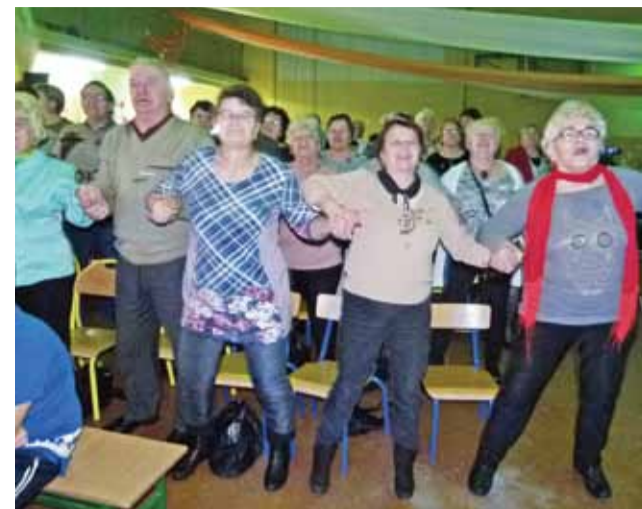
Dobra zabawa na widowni. Publiczność z miejsc porwał już pierwszy koncert wieczoru – „Usta milczą, dusza śpiewa”.