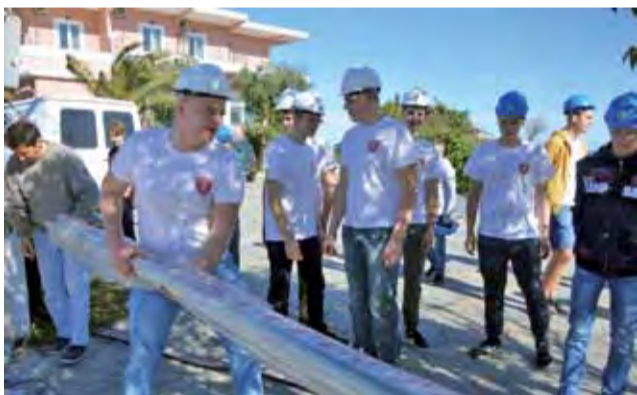
Uczniowie kształcący się na elektryków nabierali doświadczenia zawodowego w montażu instalacji elektrycznych w hotelu (oraz przy nim) powstającym w miejscowości Dion.

Uczniowie z technikum kształcącego informatyków pracują z urządzeniami sieciowymi, tj. ro-