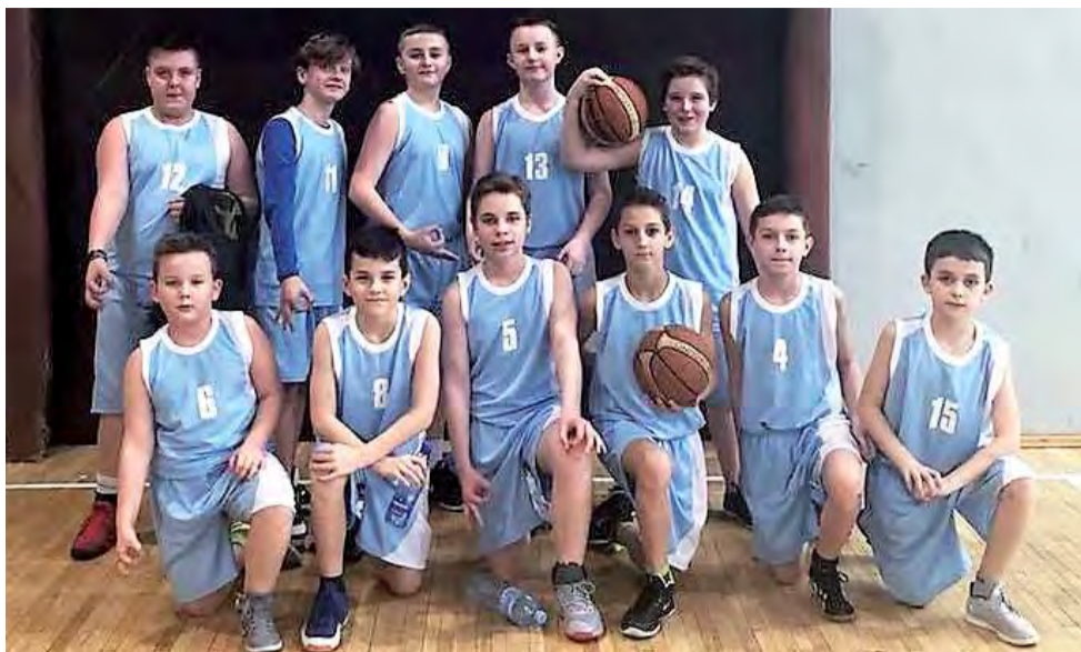
Uczniowie głowieniejskiej Jedynki spisali się znakomicie w powiatowych finałach Igrzysk Dzieci w koszykówce.