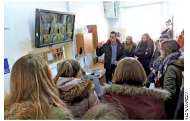
Uczniowie klasy mundurowej mogli obejrzeć pomieszczenia, do których na co dzień nie mają wstępu goście z zewnątrz.

Są to uczniowie maturalnej klasy o profilu „obrona i bezpieczeństwo publiczne”, więc byli przygotowani. Na zajęciach teoretycznych w szkole poznali już historię więziennictwa, przepisy i zasady odbywania kary pozbawienia wolności, regulacje międzynarodowe dotyczące więziennictwa, zasady funkcjonowania zakładów karnych w Polsce. Zapoznawali się z zasadami przyjętymi do Służby Więziennej oraz specyfiką pracy w poszczególnych działach służby. Teraz mieli okazję porównać teorię z praktyką.