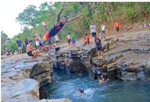
Wakacje w Panamie trwają od grudnia do początku marca.