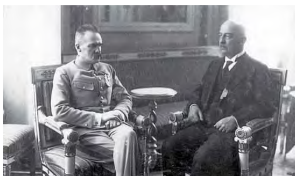
Warszawa, 10 grudnia 1922. Józef Piłsudski i Gabriel Narutowicz w Belwederze.

■ 9 grudnia 1922 – Zgromadzenie Narodowe wybiera Gabriela Narutowicza na pierwszego w historii Prezydenta Rzeczypospolitej; za Narutowiczem głosowało 186 posłów polskich oraz 103 posłów innych narodowości, przeciw – 256 głosów polskich. Prawica narodowa i chrześcijańskie centrum odmawiają współpracy z prezydentem i rozpętały przeciw niemu agresywną kampanię; z informacji w „Kurierze Warszawskim”: Przed gmachem sejmowym przez czas trwania Zgromadzenia Narodowego gromadziła się młodzież polska, czekając na rezultaty głosowania. Nawieść, iż prezydentem ma zostać Narutowicz, zwolennik Belwederu [Piłsudskiego], który uzyskał większość dzięki głosom Żydów, Niemców i innych „mniejszości narodowych” – z piersi młodzieży wydarł