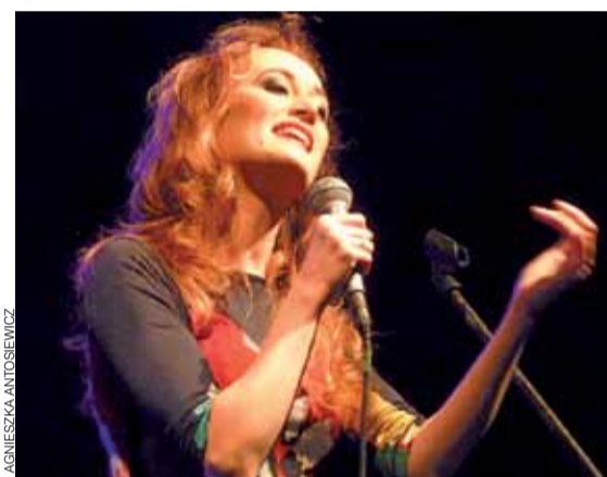
Przy pełnej sali kina Fenix odbył się w czwartek, 15 marca, koncert w wykonaniu artystów Łódzkiego Teatru Piosenki, zamykający obchody 10-lecia Łowickiego Uniwersytetu Trzeciego Wieku.

„Muzyczna podróż w czasie i przestrzeni” – bo taki był tytuł koncertu – rozpoczęła się za oceanem od piosenek z repertuaru amerykańskiego piosenkarza Franka Sinatry, zaś później była kontynuowana już w Europie, a w programie pojawiły się m.in. piosenki francuskiej piosenkiarki Edith Piaf. aa