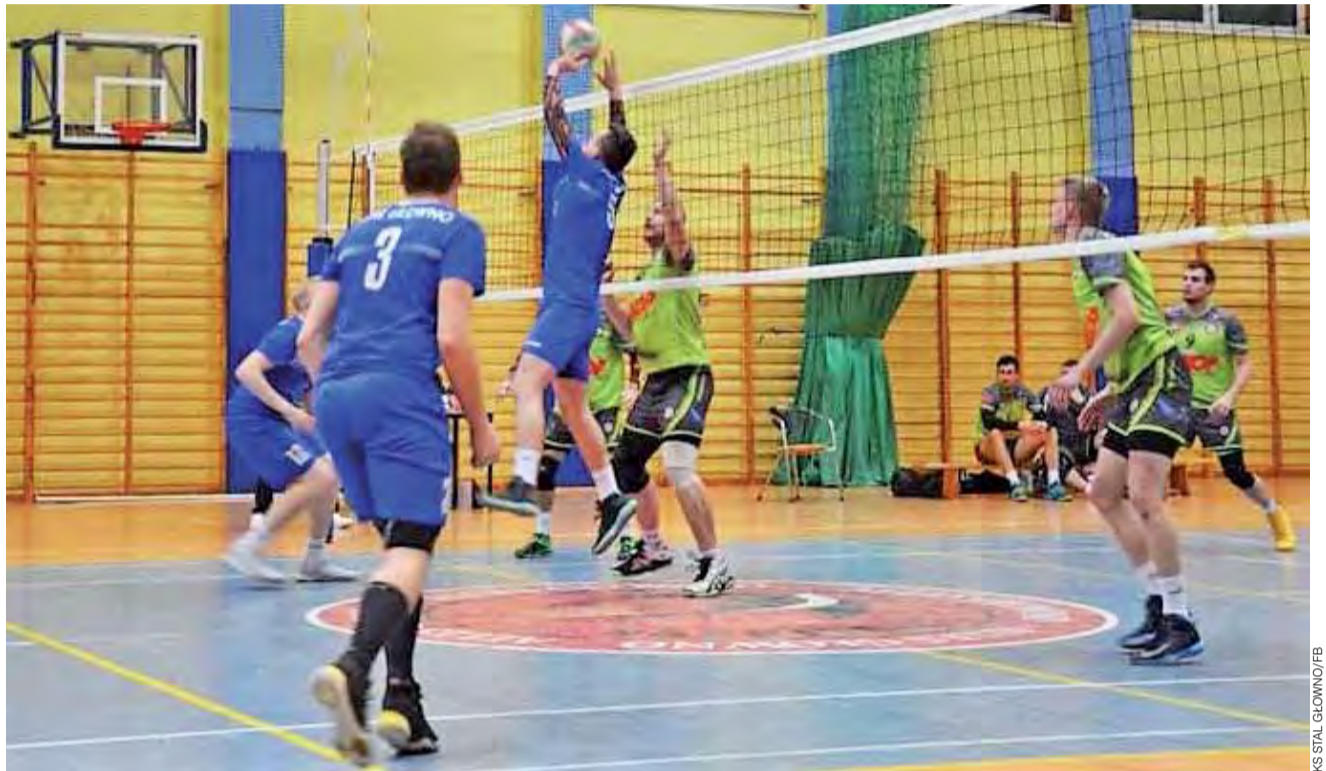
Siatkarze Stali Głowno (niebieskie stroje) nie wytrzymali dostatecznie długo, by złamać opór rywali z Dobronia.

Bolesna porażka sprawiła, że Stal spadła na 7. miejsce w ligowej tabeli. Mistrzostwo zapewnił sobie już wcześniej ULKS MOSiR Sieradz. Drużyna z Głowna ma szansę na przeskoczenie szóstego Dobronia, ale w ostatniej kolejce w sobotę, 24 marca musi pokonać WKS Siatkarz Wieluń, który ma blisko dwukrotnie większy dorobek punktowy. Stal czeka zatem trudne zadanie. wp