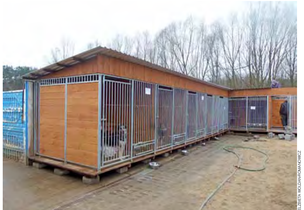
Po zmianach. W części nowych kójców zwierzęta już mieszkają.