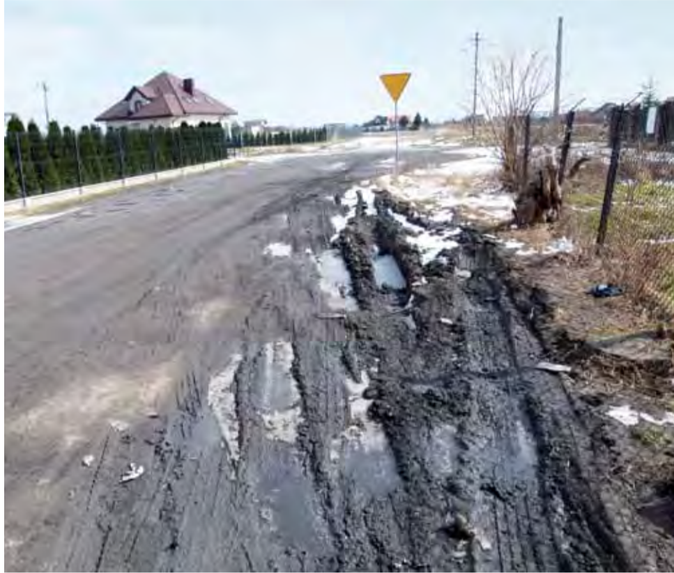
Ulica 11 Listopada w Głownie. Stan na 21 marca.

Radny nie wyobraża sobie sytuacji, w której na równanie dróg będzie trzeba czekać do czerwca.