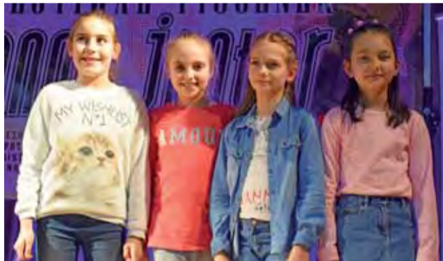
Najmłodsze reprezentantki grupy, która przyjechała do Głowna z Lublina.