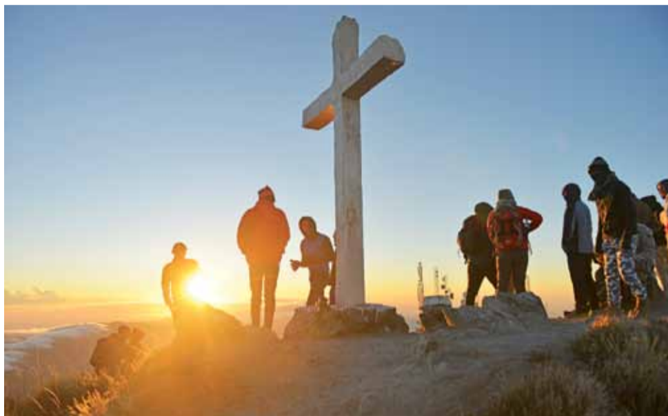
Widok z wulkanu Barú warto podziwiać o wschodzie słońca.

Barú to jednocześnie najwyższe położone miejsce w kraju. Dopiero stojąc u stóp wulkanu dane jest nam odczuć prawdziwą potęgę natury. Z solidnej, masywnej podstawy, bryła pnie się strzeliście