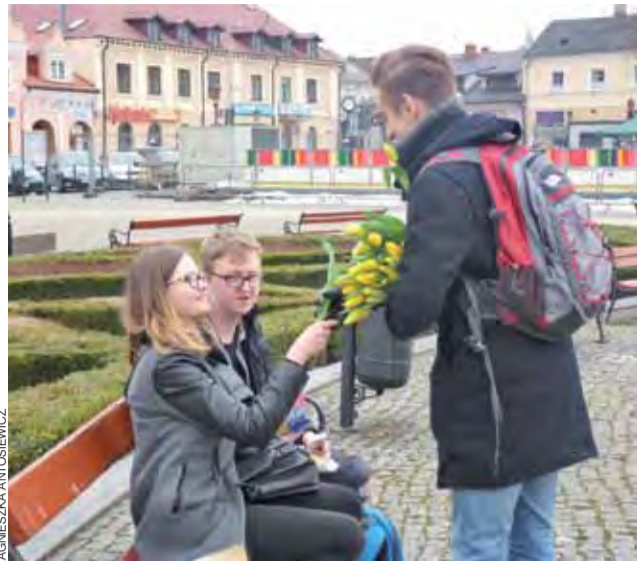
Męska część Młodzieżowej Rady Miejskiej wręczała tulipany każdej napotkanej pani.