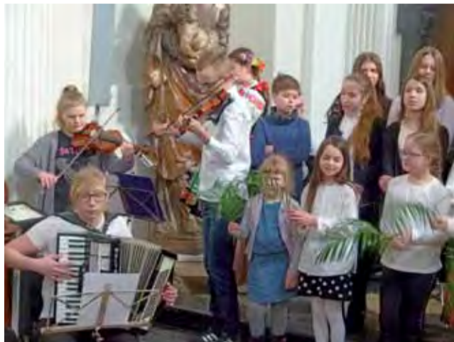
W czasie corocznego koncertu „na przywitanie wiosny” nie brakowało też występów zbiorowych.

Zagrali wszyscy podopieczni CEM, zarówno ci, którzy uczyli się od kilku lat, jak i ci stawiają-