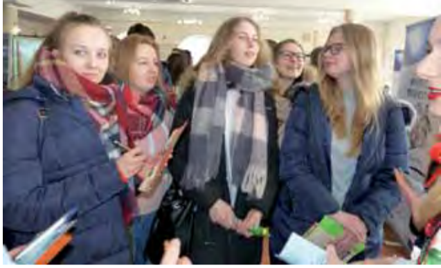
Gimnazjaliści odwiedzający targi pytali przede wszystkim starszych kolegów o to, jak jest w danej szkole.

Targi zostały zorganizowane 20 marca w restauracji Szkiełka w Łowiczu. Stoiska wystawowe od godz. 10 do 12.30 czekały na gimnazjalistów, którzy przyjechali ze wszystkich gmin powiatu łowickiego. Część uczniów targi traktuje jednak jako rozrywkę, dzięki której część lekcji przepada, inni starają się dobrze wykorzystać ten czas, aby zadawać py-