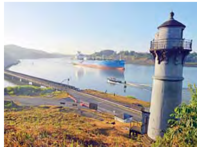
Widok statków przepływających Kanałem Panamskim o świcie na długo pozostanie w mej pamięci.