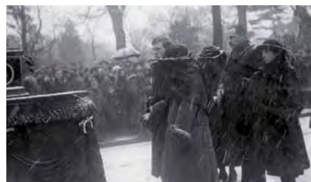
Warszawa, 22 grudnia 1922. Rodzina prezydenta Gabriela Narutowicza w kondukcje żałobnym.