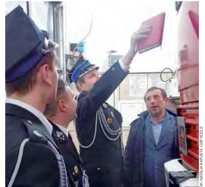
Wizyta w garażu. Goście z Koźła byli zainteresowani przygotowaniem jednostki OSP z Murzasichla do udziału w akcjach.