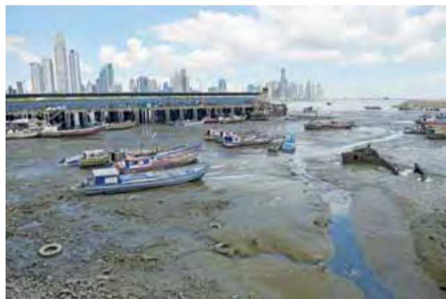
Port rybacki w centrum Panamy.