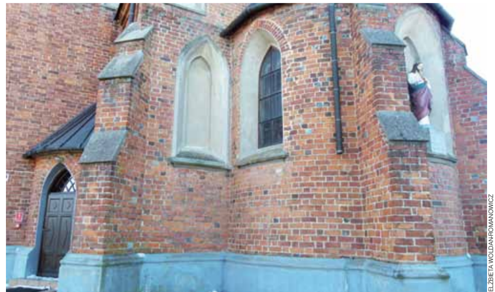
Jedna z częściowo oberwanymi rynnami. Złodzieje zdemontowali ją do takiej wysokości, do jakiej dali radę sięgnąć.