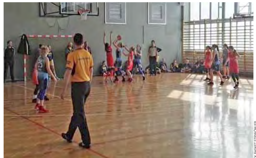
Koszykarki TK Basket Stryków (niebieskie stroje) zakończyły zmagania ligi wojewódzkiej U-16 dopiero na 11. miejscu z jednym zwycięstwem na koncie.

Więści z Głowna i Strykowa członkiem Stowarzyszenia Gazet Lokalnych Edycja wspólna z tygodnikiem „Nowy Łowiczanie”