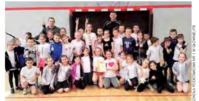
Reprezentacja SP 1 Głowno cieszy się po zdobyciu medalu.