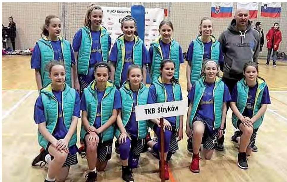
Koszykarki TK Basket Stryków pokazały się na turnieju w Bochni ze świetnej strony nie tylko pod względem sportowym, ale także wizualnym.