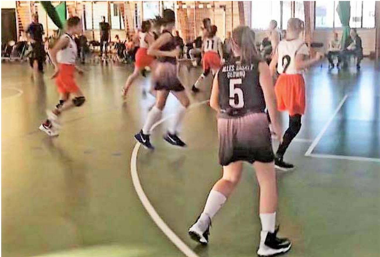
Allles Basket Głowno kontynuuje dobrą grę w rozgrywkach Wojewódzkiej Ligi Koszykówki do lat 12.

■ Allles Basket Głowno – UMKS Książek Łowicz 75:63 (19:8, 19:13, 21:17, 16:25)