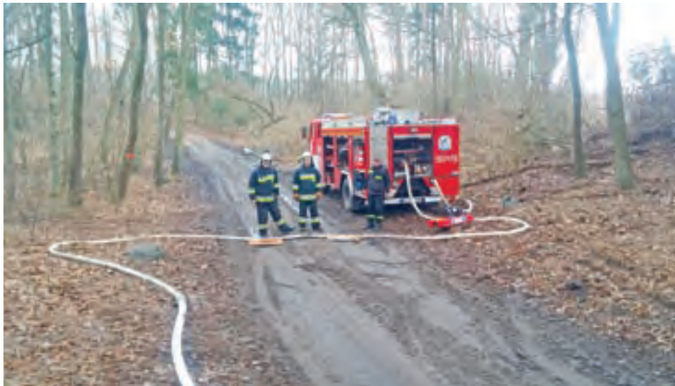
Dla druhów była to okazja do sprawdzenia się w trudnym terenie.

Przypomnimy, że w ramach tej jednej z największych inwestycji ostatnich lat w okolicach zalewu działo się naprawdę wiele. Na górze Kapusty zbudowano park linowy, bliżej plaży powstało nowe molo, altana taneczno-koncertowa. Nad zalewem pojawiły się także pomosty cumownicze, miejsca piknikowe, zadaszone stanowiska do grillowania, ścieżka edukacyjna, a przy wypożyczalni sprzętu powstał nowy plac zabaw. Do samej wypożyczalni zakupiono nowe rowery wodne. Nad Mrożyczką pojawiły się również dodatkowe ławki, kosze na śmieci, stojaki na rowery. ■