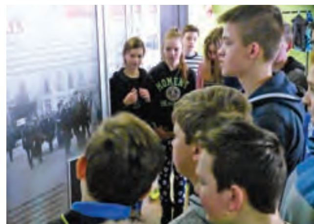
Wystawę w Błędowie oglądają uczniowie SP w Mastkach.