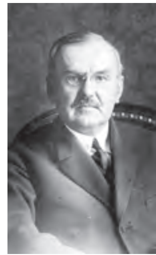
Premier Władysław Grabski.