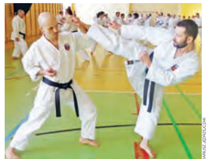
Karatecy z Łódzkiego Centrum prezentują styl kumite.