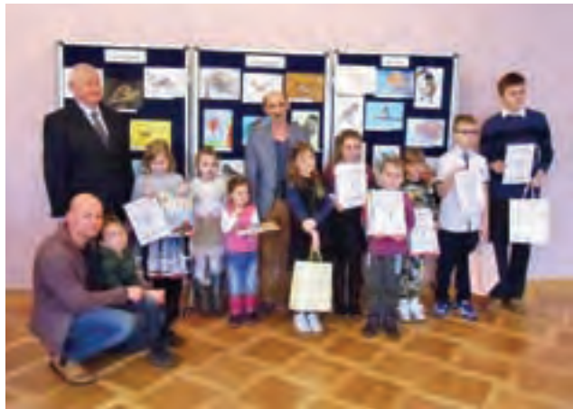
Laureaci konkursu plastycznego na portret wróbla.