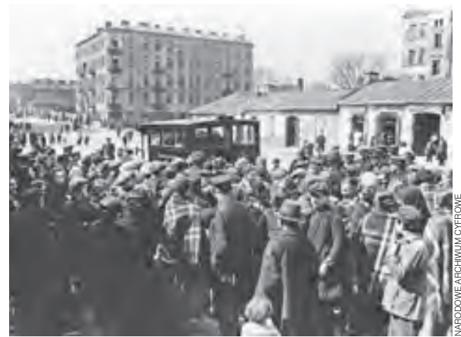
Warszawa, kwiecień 1926. Demonstracja bezrobotnych na ul. Leszno.

Historia i Teraźniejszość | Czego nas uczy ostatnie 100 lat