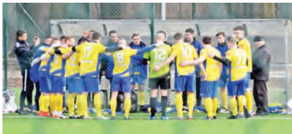
Stal Głowno w minionej kolejce odpoczywała od piłkarskiej rywalizacji w Łódzkiej Klasie Okręgowej.

Pojedynek piłkarzy Głowna z ŁKS-em II Łódź przełożono na 18 kwietnia, z kolei mecz innej łódzkiej drużyny Widzewa II z Górnikiem Łęczycza przesunięto na 4 kwietnia. Pozostałe spotkania V ligi doszły do skutku, a najciekawiej było w Rosanowie, gdzie trzeci LKS zmierzył się z wiceliderem Zawiszą Rzgów