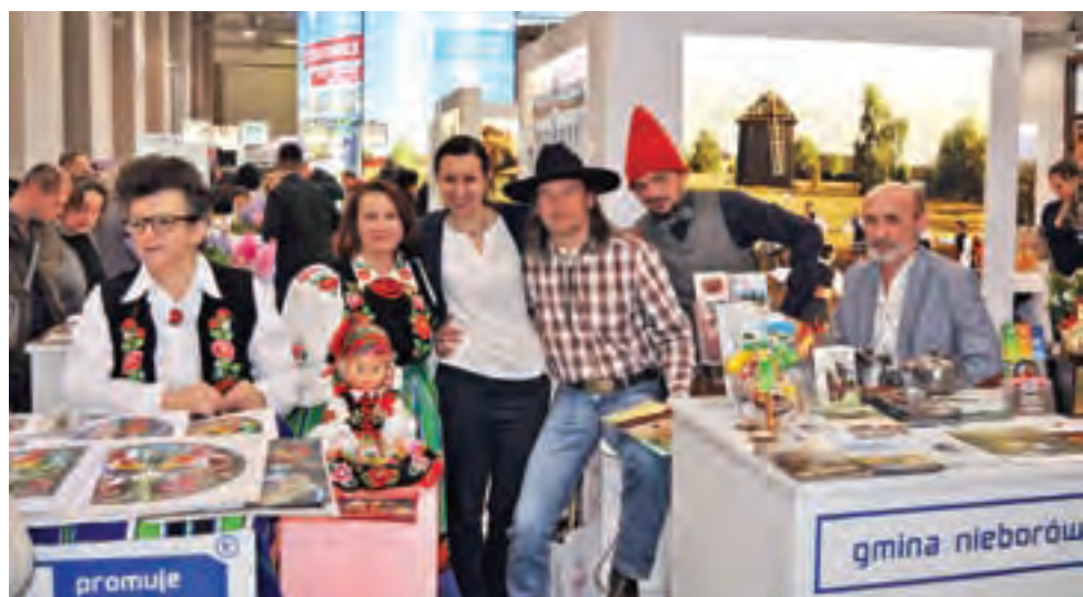
Delegaci nie tylko promowali Powiat Łowicki, ale także zapraszali na wydarzenia zaplanowane w bieżącym roku.

Uważa, że ekonomia opiera się przede wszystkim na wiedzy. – Znajomość matematyki, zwłaszcza biegłość w rachunkach, jest oczywiście atutem, ale bez kalkulatora w głowie też można być dobrym ekonomistą – mówi. – Najważniejsza jest wiedza i bycie „na bieżąco”. To nie jest coś, czego można się raz nauczyć i zostać w ten sposób ekspertem, ekonomią trzeba się interesować stale, obserwować, uczyć się. Trzeba nią żyć – uważa. mwk, tm