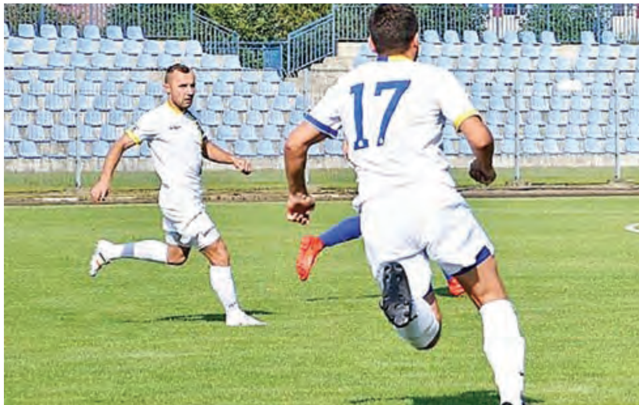
Zjednoczeni Stryków (białe stroje) pokazali się w Żelowie z dobrej strony, ale punktów do domu nie przywieźli.

Podopieczni trenera Łukasza Wijaty dobrze rozgrywali swoje akcje, ale brakowało im szczęścia, a może po prostu zawodziła skuteczność. Z upływem minut coraz