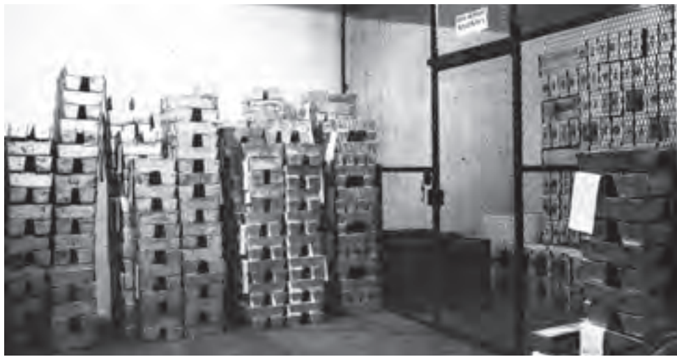
Warszawa, lata 20. Skarbiec w Mennicy Państwowej.