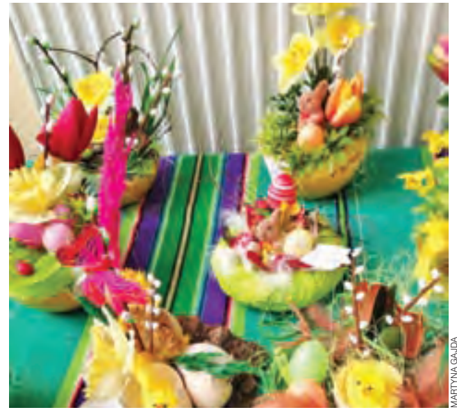
Ozdoby wykonywali florysty ze szkoły policealnej.

Przyznaje też, że sceptycznie podchodzi do rewelacji na temat prozdrowotnych właściwości rzemieślniczych cydrów. – Wiadomo, że im bardziej naturalny jest sposób produkcji, tym mniej jest szkodliwych, sztucznych substancji, ale trzeba pamiętać, że to nadal jest alkohol, więc umiar z nim jest więcej niż wskazany – mówił. – Cydr ma być smaczny, aromatyczny, sprawiać nam przyjemność, ale jeśli chodzi o zdrowe odżywianie, to polecam jednak jedzenie jabłek. tm