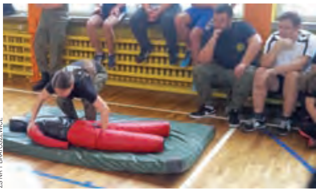
Ćwiczenie z podnoszeniem manekina to część testu sprawnościowego przeprowadzonego w Bratoszewicach.