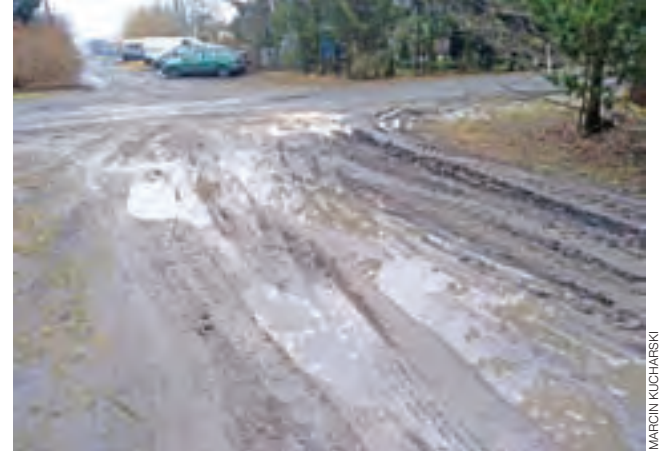
Błoto na osiedlu Witosza w Sannikach. Tak wygląda większość osiedlowych uliczek.

Gmina Sanniki | Budżet gminy wywrócony do góry nogami