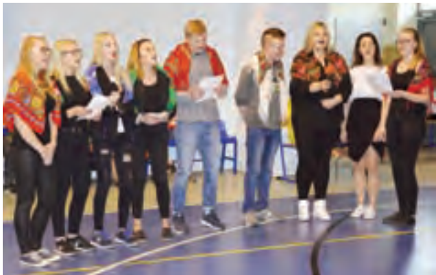
Część artystyczna apelu – było w niej dużo muzyki i śpiewu.