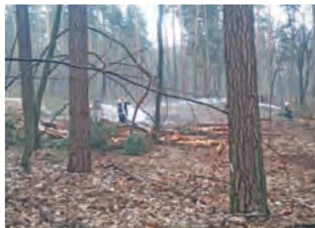
Strażacy ćwiczyli gaszenie pożaru w lesie.