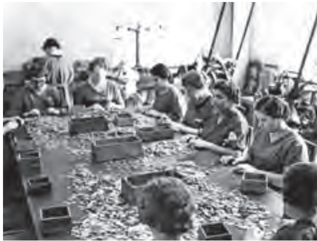
Warszawa, lata 20. Sortowanie monet w Mennicy Państwowej.