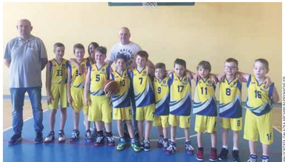
Klub TK Basket Stryków po raz pierwszy w historii klubu ma męską drużynę koszykówki.