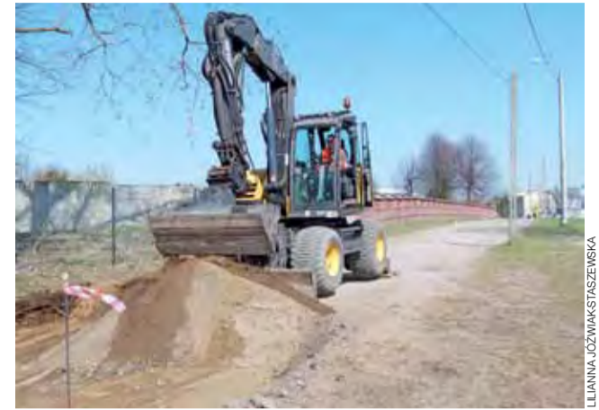
Podwykonawca rozpoczął prace przy utwardzaniu od strony zalewu.

Wakepark w Głownie ma powstać do połowy czerwca tego roku. Docelowo sezon korzystania z nowej atrakcji nad Mrożyczką ma trwać od kwietnia do września.