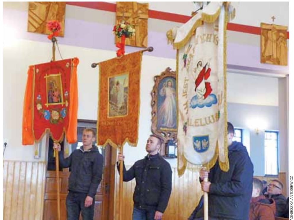
Msza święta chorągwiarzy w kościele pw. św. Rocha w Boczkach Chelmońskich.

Następnie idą na mszę chorągwiarzy do kościoła. aa