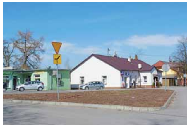
Obelisk wzniesiony zostanie u zbiegu Placu Staszica z ulicą Szkolną, więc powinien być widoczny również z trasy krajowej nr 14 przebiegającej przez Bratoszewice.

Na głazie umieszczona będzie tablica z napisem o treści: Książd Idzi Radziszewski/ urodzony 1 kwietnia 1871 roku/ w Bratoszewicach/ zmarł 22 lutego 1922 roku w Lublinie/ Wybitny uczonego Założyciel i pierwszy rektor Katolickiego Uniwersytetu Lubelskiego/ W setną rocznicę powstania KUL/ i odzyskania przez Polskę niepodległości/ Rodacy. Wokół mają pojawić się nowe nasadzenia niskiej zieleni oraz ogrodzenie łańcuchowe. Podejście pod obelisk zaplanowane od strony ośrodka zdrowia.