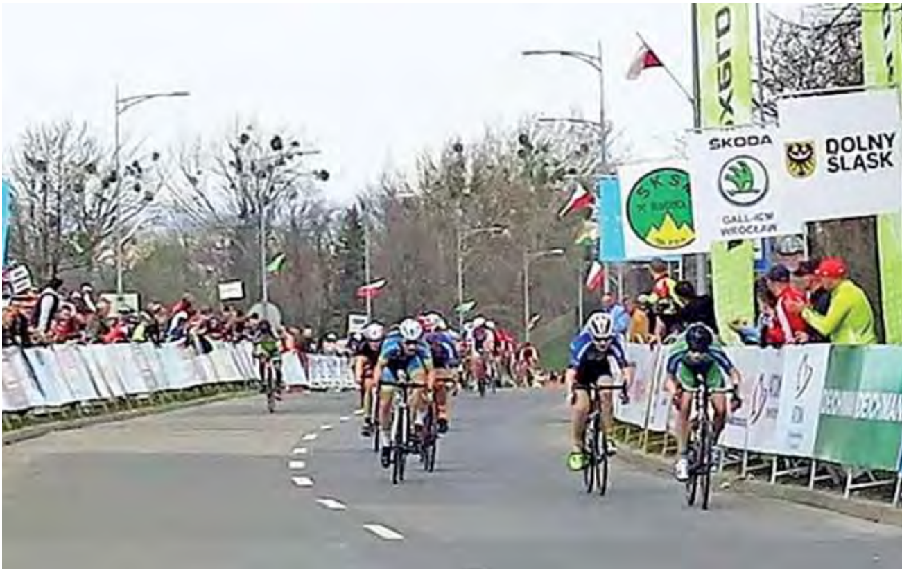
Finisz kategorii młodzik był jednym z najbardziej emocjonujących w trakcie trwania imprezy w Sobótce.