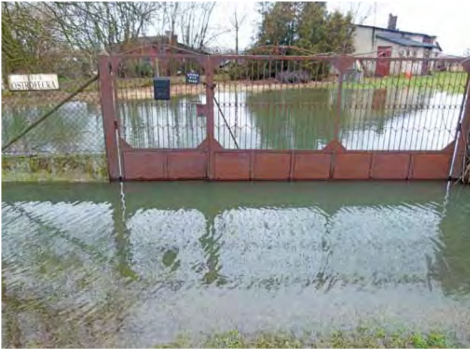
Część mieszkańców miała dość problemów z wodą na podwórkach i po prostu się wyprowadziła.