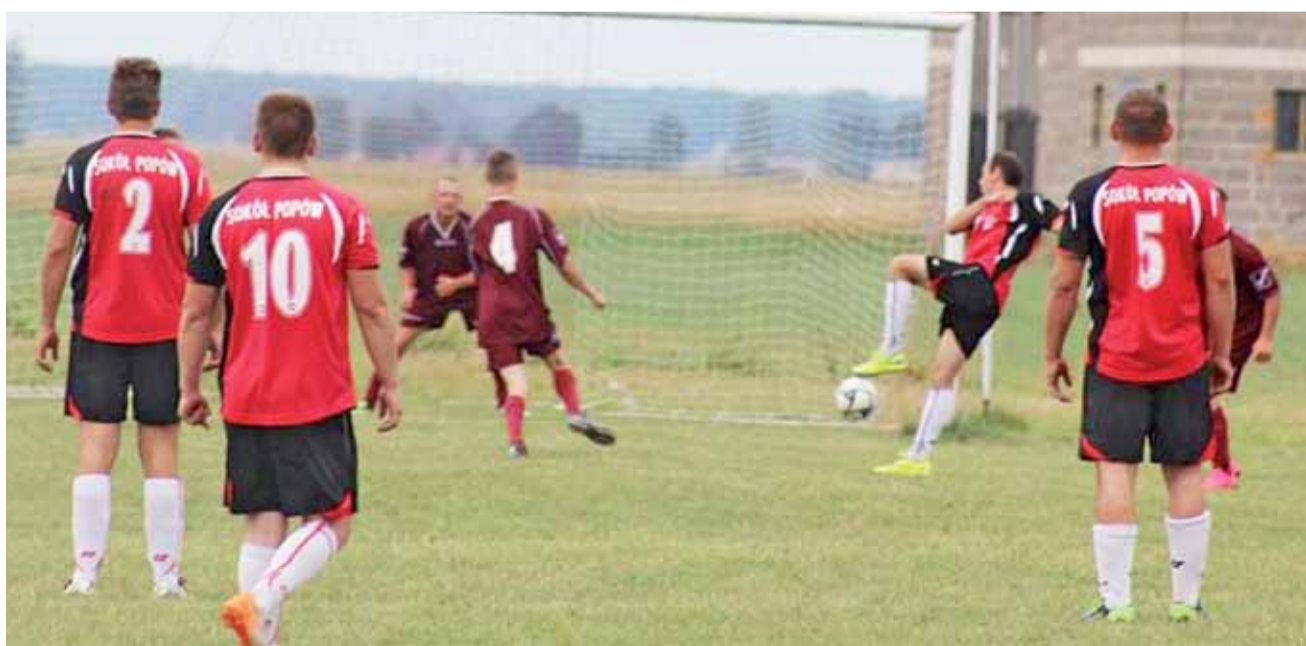
Piłkarze Sokola Popów zaprezentowali wspaniałą formę podczas pierwszej kolejki rundy wiosennej B-klasy, gr. III.