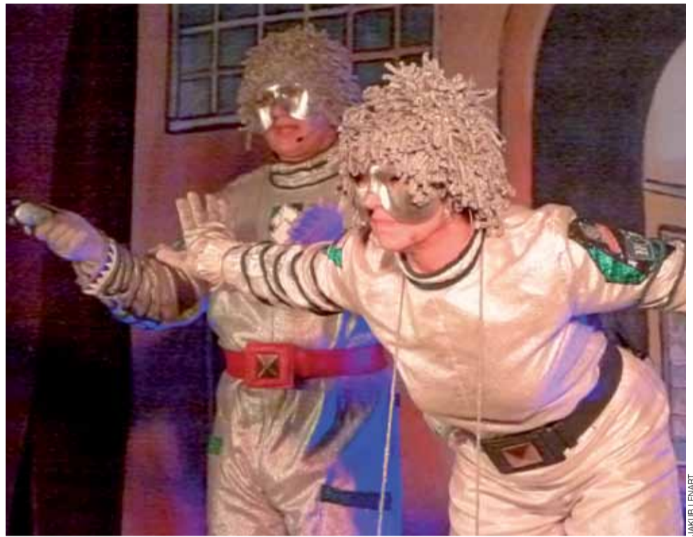
Bohaterowie spektaklu poszukiwali brakującego elementu, który pozwoliłby im wrócić do domu.

W minionych latach, dzięki wsparciu Polskiego Towarzystwa Walki z Kalectwem, udało się choćby kupić łóżko wodne i basen z piłkami dla dzieci z głębokim upośledzeniem, tablicę multimedialną, wyremontować kilka klas. W ramach akcji dofinansowano budowę boiska wielofunkcyjnego, stworzenie klasy przysposabiającej do pracy dla dzieci upośledzonych w stopniu umiarkowanym, oddziału dla dzieci autystycznych czy też wreszcie