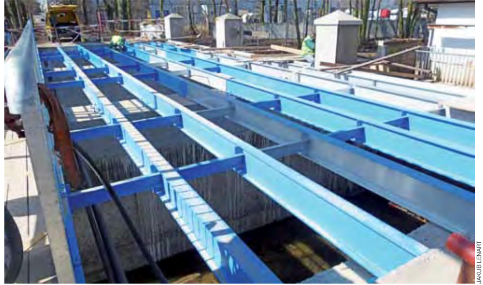
Konstrukcja jazu ponownie zapewni bezpieczeństwo przechodzącym.

Z roku na rok stan techniczny się pogarszał, w wyniku czego, w 2011 roku, został on zamknięty dla ruchu. Po remoncie jaz będzie ponownie mógł pełnić rolę skrót dla pieszych i rowerzystów (przejeżdżanie przez niego samochodem będzie zabronione). kl