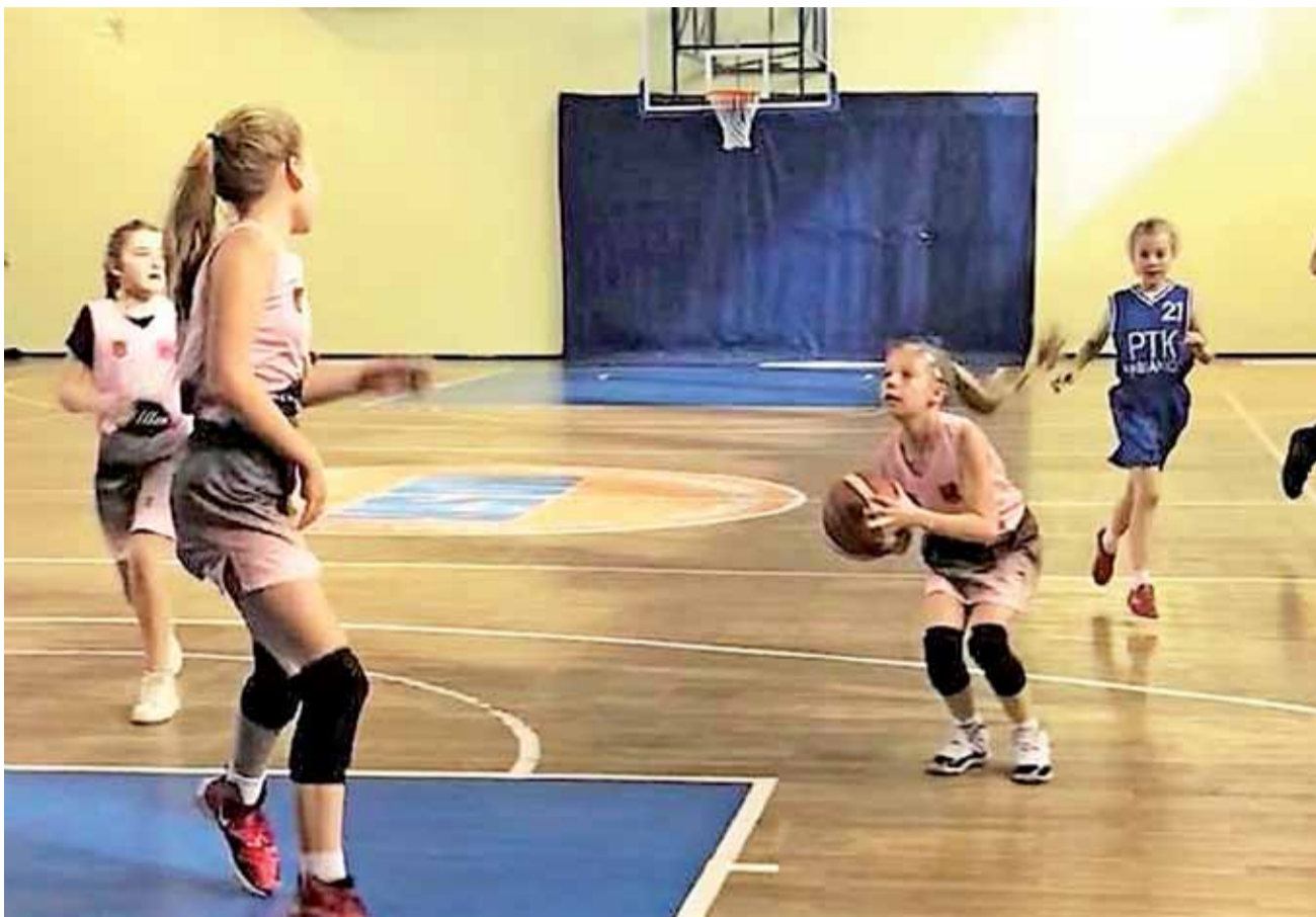
Najmłodsza grupa Alles Basket Głowno (przy piłce) jest na dobrej drodze do wywalczenia mistrzostwa Wojewódzkiej Ligi do lat 11.