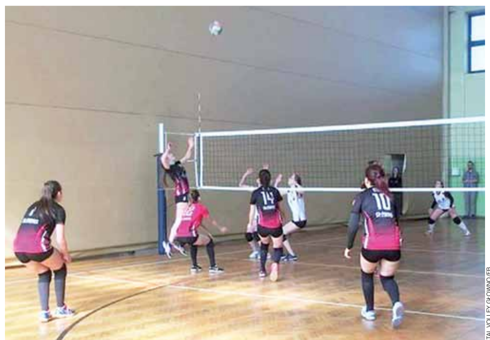
Stalówki z Głowna (czarno-czerwone stroje) stoją przed jeszcze jedną szansą awansu do Ekstraklasy Kobiet Łódzkiej Amatorskiej Ligi Siatkówki.

■ Mecze barażowe o awans zaplanowano na sobotę, 14 kwietnia: VIP Gwarant – TKKF Dzikusy II Łódź, TKKF Dzikusy I Łódź – Stal Volley Głowno.