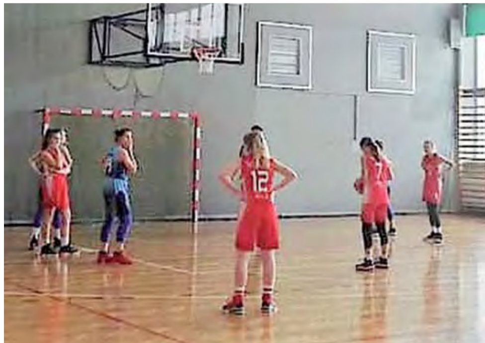
Koszykarki TK Basket Stryków (niebieskie stroje) prezentują wyborną formę w końcówce sezonu Ligi Wojewódzkiej do lat 14.

■ 7. kolejka, 15 kwietnia: TK Basket Stryków – SK Mag-Rys Zgierz, KKS Pro-Basket II Kutno – LUKS Trójka Sieradz, AKS SMS Łódź – PTK ETL Finance Pabianice, UKS Basket Aleksandrów Łódzki – KS American Widzew Łódź (24.04.).