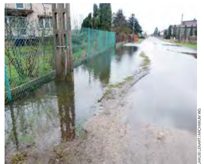
Od lat woda przelewająca się przez drogę to na Ostrołęckiej normalny widok.

Przez lata nie tylko przerywanie zbieraczy doprowadziło do złej sytuacji. Część mieszkańców pozasypywała istniejące niegdyś rowy. Woda przelewała się więc przez ulice i zalewała posesje, pola, sady. Dodatkowym problemem jest też fakt, że część osób opróżnia zawartość szamb nie poprzez zamówienie firmy, a po