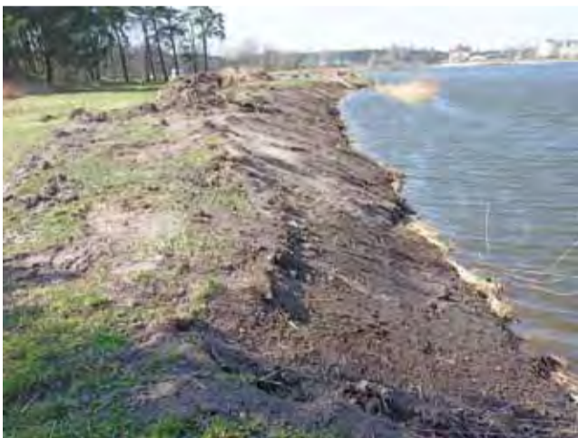
Prace przygotowawcze objęły m.in. prace ziemne przy linii brzegowej.

Przypomnijmy, że inwestycję wartą szacunkowo około 5 milionów złotych netto przeprowadzić chce w Głownie spółka Neighbors (pisownia oryginalna – przyp.