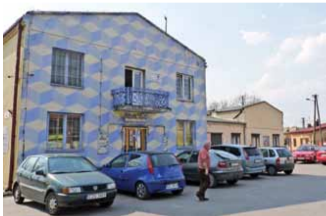
Lokalizacja nowego, ale znacznie większego, Domu Kultury w tym miejscu była przyczyną zbiórki podpisów, na którą odpowiedziało ponad 1700 osób.

W jaki sposób obecnie władze Strykowa będą szukać rozwiązania zaistniałego problemu? Czy nadal pod uwagę brane są alternatywne rozwiązania, o których burmistrz Andrzej Jankowski informował mieszkańców osiedla Wschód podczas spotkania w sprawie lokalizacji pomnika z okazji odzyskania 100-lecia niepodległości Polski, 12 lutego bieżącego roku?