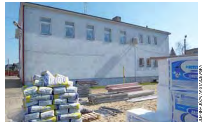
Na tyłach remizy OSP Stryków już wszystko gotowe do rozpoczęcia termomodernizacji.

Inwestycje dotowane są z Europejskiego Funduszu Rozwoju Regionalnego. Projekt obejmuje 10 budynków, które mają zostać zmodernizowane do 2020 r. Całość oszacowano na ponad 7,4 mln zł, z czego dotacja pokrywa blisko 85%. W ubiegłym roku skorzystały na tym: Szkoła Podstawowa nr 1 w Strykowie, SP nr 1 w Niesułkowie oraz OSP Kielmina. Dotacja pokryła również część kosztów wykonanej wcześniej termomodernizacji świetlicy wiejskiej w Ossem. Oszczędniej i bardziej ekologicznie ma być również w: SP Bratoszewice i SP 2 w Strykowie, rozbudowywanej SP w Dobrej i w Urzędzie Miejskim w Strykowie. ijs