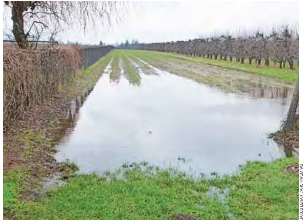
Woda, która nie ma dokąd odpłynąć, pojawia się na polach, w sadach czy na podwórkach.