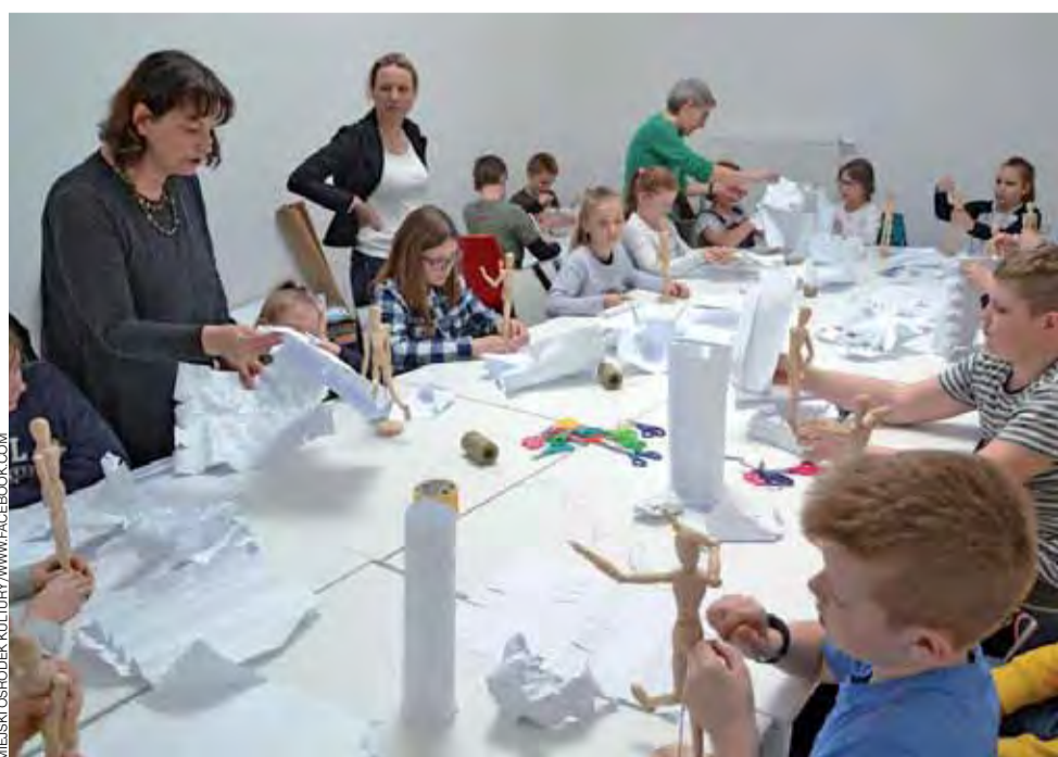
Uczestnicy projektu mieli szansę uruchomić wyobraźnię.