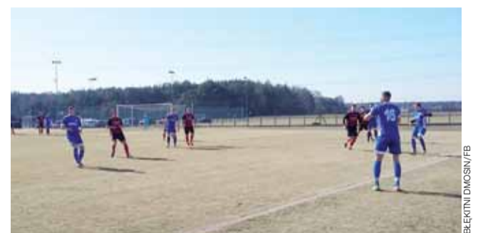
Błękitni Dmosin (niebieskie stroje) walczą o mistrzostwo.

Jusport II - GOK Lutomiersk, Kamikaze - LUKS Koźle, Sobmar Kudrowice - Zapał, TBS Piekarnia - Korad, Uniwersytet Medyczny II Łódź - Toma, Vabank - Aristo Jeans, Zarten - Woodstyl.