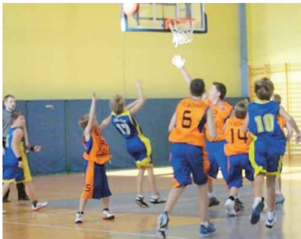
Gracze Głowieńskiego Towarzystwa Koszykówki (pomarańczowe koszulki) są wiceliderami swojej grupy.

■ Zaległe spotkania odbędą się w dniach 14-15 kwietnia: PKK 99 II Pabianice - GTK Głowno, PKK 99 II Pabianice - Szkoła Gortata II Łódź.