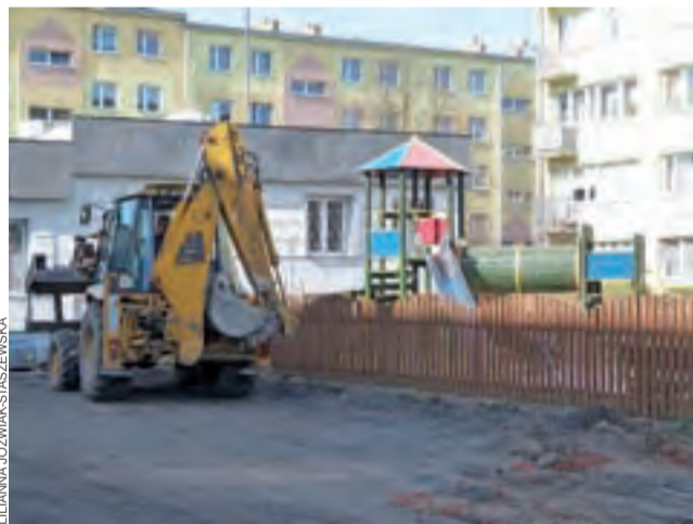
Prace przy utwardzaniu terenu mają potrwać od 3 do 4 tygodni.

Jak udało się nam dowiedzieć, funkcjonariusze z Komisariatu Policji w Głównie zajmują się tą sprawą. W ostatnich dniach byli na miejscu i sporządzali m.in. dokumentację fotograficzną. Czy po latach stare Uno na osiedlu Kopernika przestanie straszyć i wreszcie stąd zniknie? kl