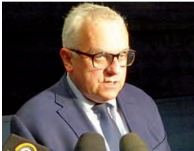
Adam Lipiński. Wiceprezes PiS podczas spotkania w Łowiczu.

Adam Lipiński wspominał też o osiągnięciach rządu PiS, które – zapowiedziane w kampanii wyborczej – uznawane były przez oponentów na nierealne, m.in.: program „Rodzina 500+”, uszczelnienie systemu podatkowego, które spowodowało wzrost wpływów do budżetu o 30 miliardów złotych.