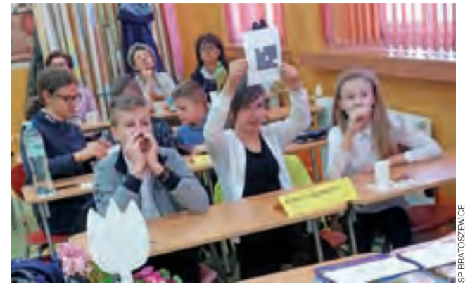
W pierwszym etapie konkursu uczniowie udzielali odpowiedzi za pomocą QR kodów.

z Domem Kultury wspierał będzie imprezę. Oprócz wydarzeń plenerowych nad zalewem, organizatorzy zapowiadają również konkurs piosenki abstynenckiej w Domu Kultury oraz podsumowującą mszę świętą w kościele św. Marcina. Szczegółowy program Dnia Trzeźwości opublikujemy w wydaniu poprzedzającym ostatni weekend kwietnia. ljs