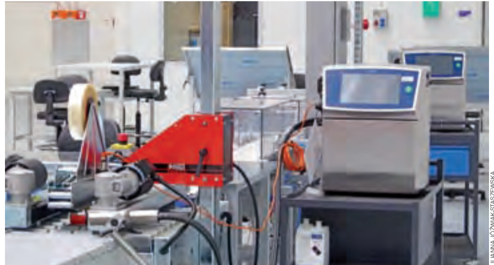
Uruchomionych zostaje 17 linii produkcyjnych, na których wykonywane będzie automatyczne blistrowanie, podawanie i pakowanie produktów w kartony, zgrzewanie i foliowanie.

Po pracy oferuje kluby sportowe, organizuje wyjazdy i pikniki, zapewnia opiekę medyczną. Placa zależy od stanowiska, na najniższych przekracza o 10%-20% minimalną krajową. ljs