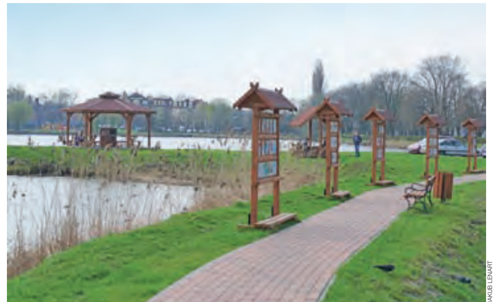
W ramach zagospodarowania powstała m.in. ścieżka edukacyjna, czy widoczne w tle stanowisko do grillowania.

Głowno | Nominacja do prestiżowej nagrody