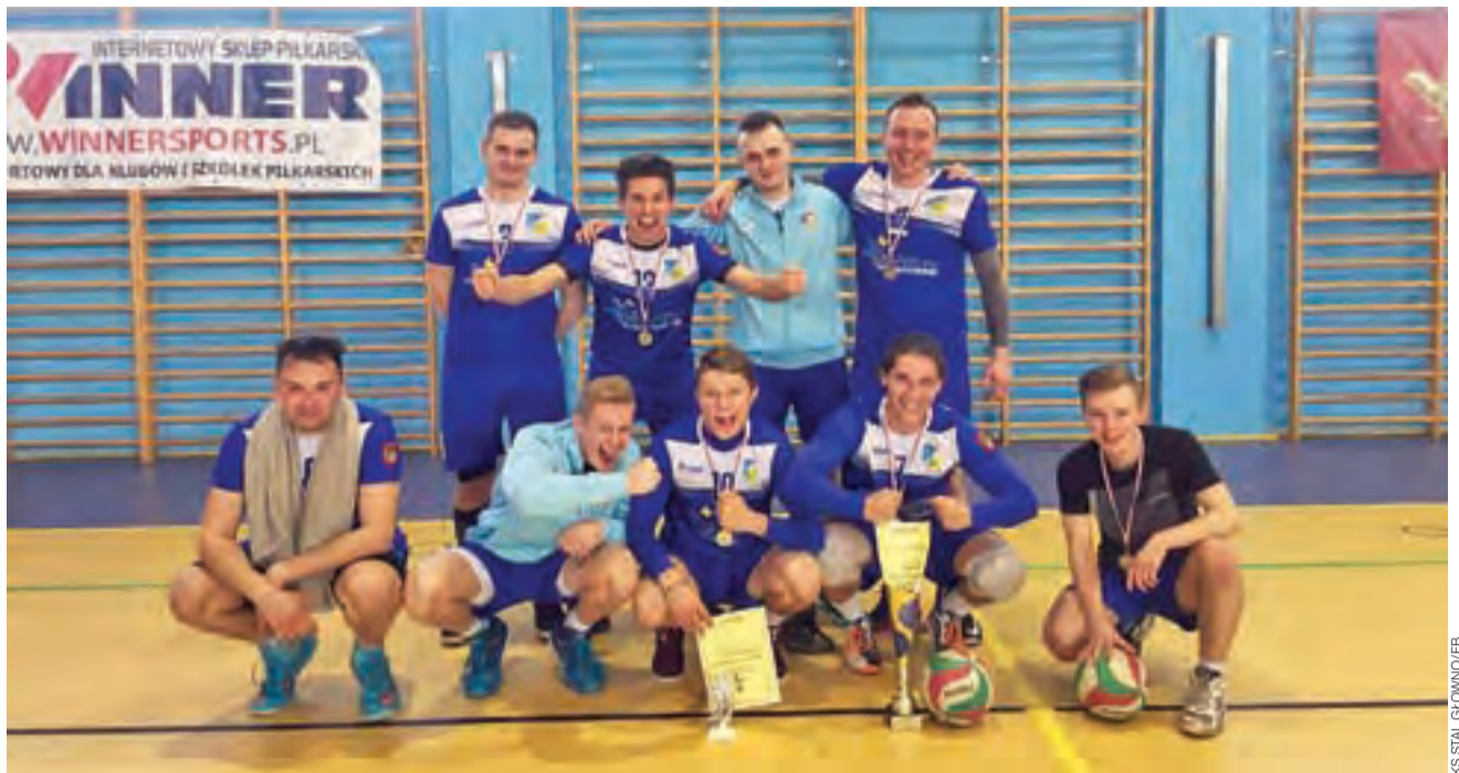
Siatkarze Stali Głowno udanie zaprezentowali się w Choceniu, ale nie powiedzieli jeszcze ostatniego słowa.

Siatkarze Głowna rozegrali kapitalne zawody, a pokonani zostali dopiero w wielkim finale, w którym po fantastycznej walce prze-