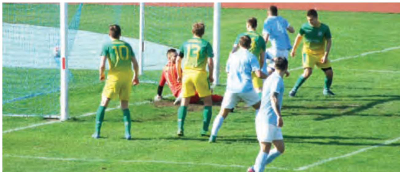
Po zamieszaniu w polu bramkowym piłkarze Zjednoczonych (błękitne koszulki) zdobyli zwycięską bramkę.

14 kwietnia podopieczni trenera Łukasza Wijaty rozegrali kolejne ligowe spotkanie. Strykowscy zawodnicy znów udali się na mecz w roli gości, tym razem na trudny teren do Kleszczowa. Rywalem Zjednoczonych była Omega, która w tym sezonie prezentuje futbol zbliżony do strykowskiego. Po zwycięskiej walce i голу w 13 min. Karo-