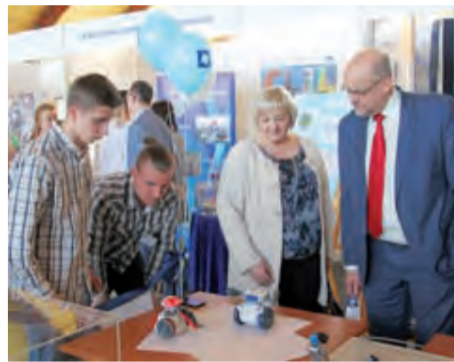
Roboty na nagrodzonym stoisku „Cebertowicza”.