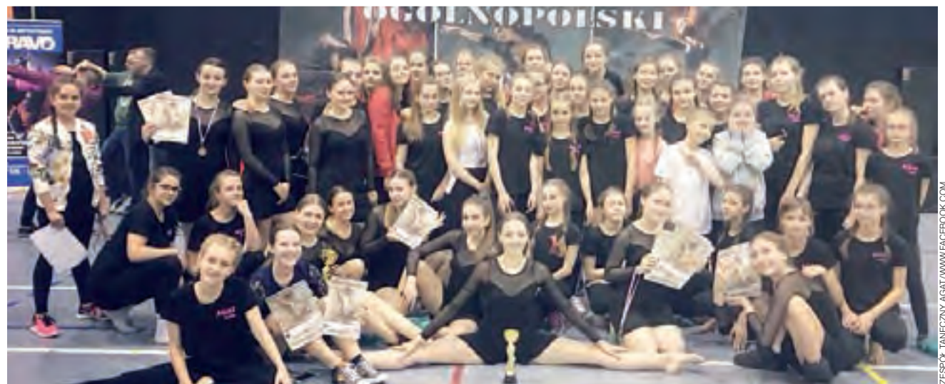
Tancerki z Agatu pokazały w Łebie co potrafią.

Już w najbliższy weekend tancerki z zespołu Agat wystąpią w kolejnym, cieszącym się dużą popularnością konkursie, tym razem w Bydgoszczy. Życzymy więc kolejnych sukcesów! ■