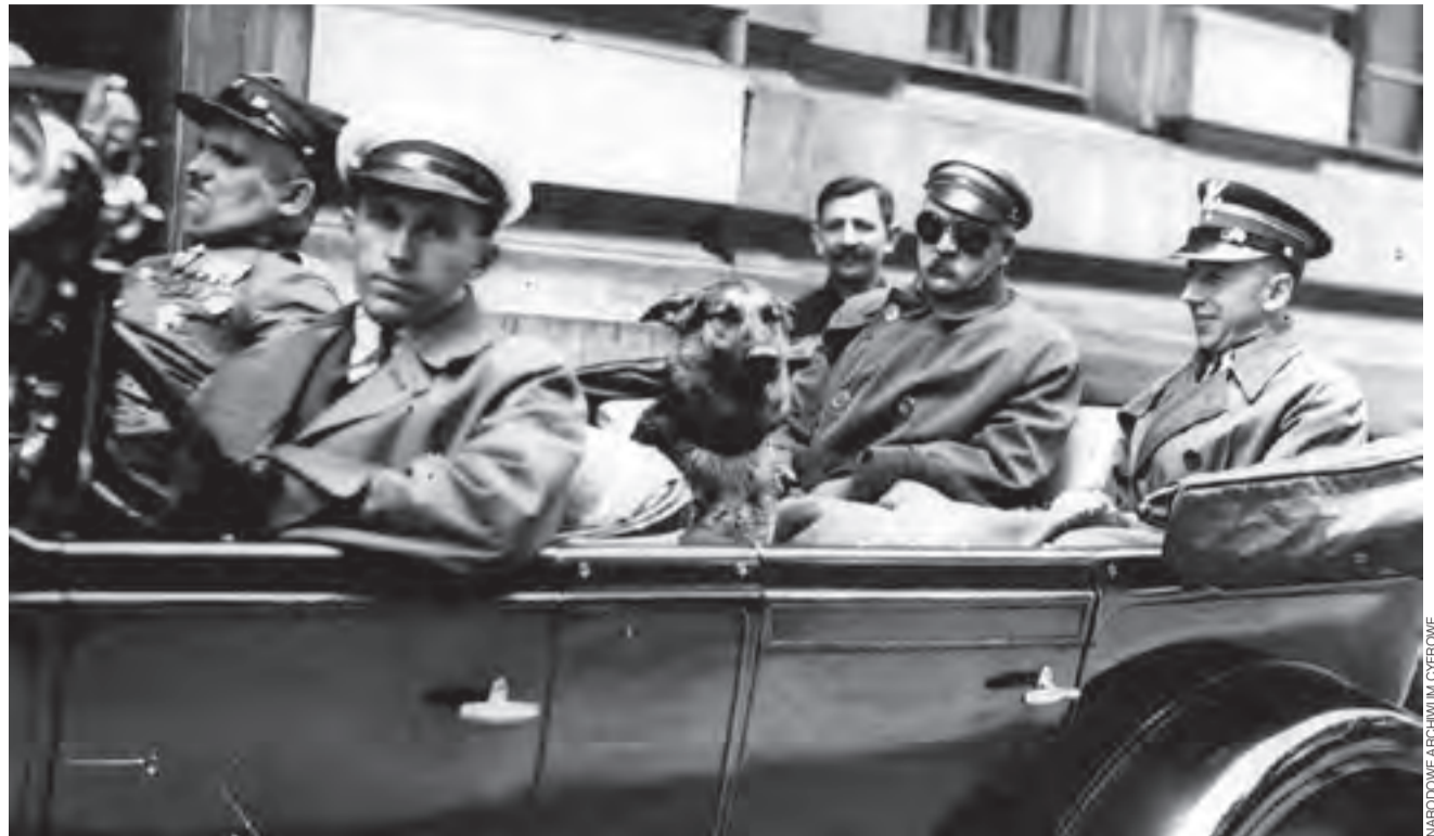
Warszawa, 11 lipca 1929. Wyjazd Józefa Piłsudskiego do Sulejówka.

Historia i Teraźniejszość | Czego nas uczy ostatnie 100 lat