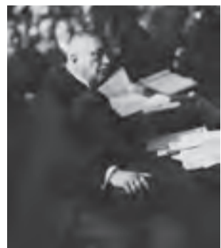
Warszawa, 26 czerwca 1929. Były minister skarbu Gabriel Czechowicz na ławie oskarżonych podczas procesu przed Trybunałem Stanu.

■ Wicepremier Kazimierz Bartel w przemówieniu sejmowym