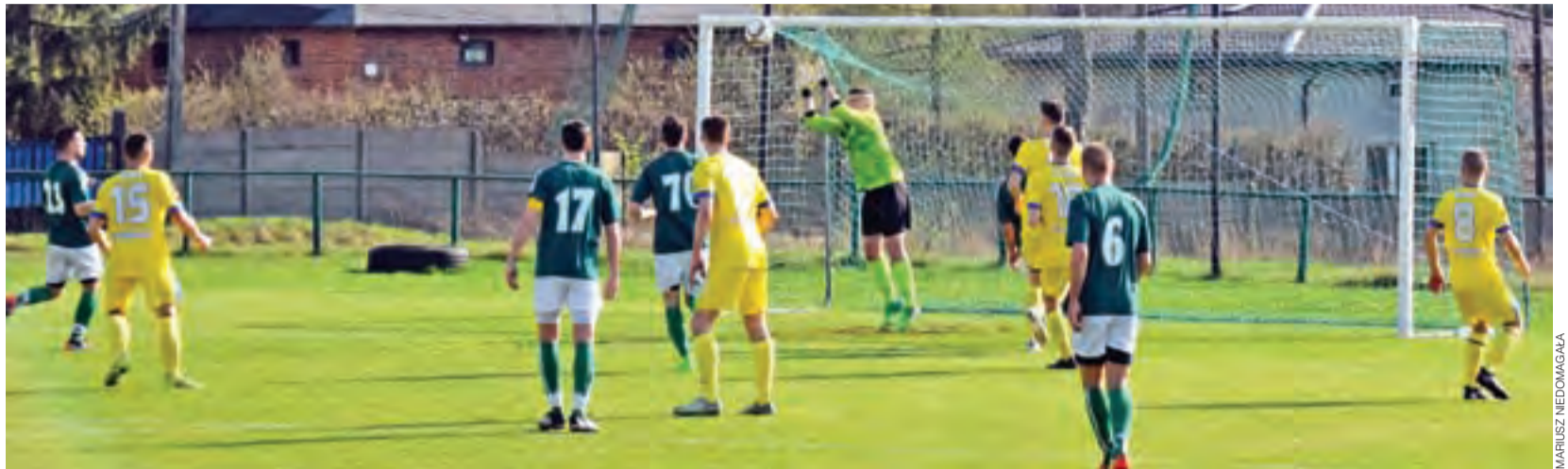
Piłkarze Stali Głowno (żółte stroje) nie mieli problemów z pokonaniem ostatniego w tabeli Włókniarza Konstantynów Łódzki.