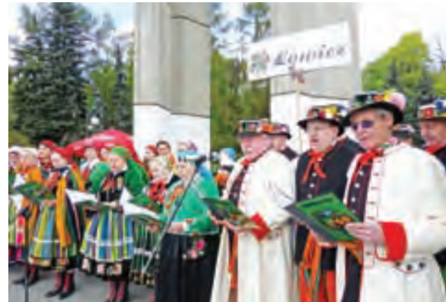
Zespół Śpiewaczy Ksinzoki z Łowicza podczas występu pod Dzwonem Wolności w Cytadeli w Poznaniu 24 kwietnia 2016 r., podczas Dni Ułana.

Zespół Ksinzoki dwukrotnie gościł z patriotycznym występem na Święcie Ułana w Poznaniu, na zaproszenie wspomnianego towarzystwa. Było to w 2016 i 2017 roku. Wcześniej – w 2014 roku – Ksinzoki spotkały się z ułanami w Ziewanicach w gminie Głowno, dokąd przyjeżdżają oni rokrocznie konno około 300 km, aby oddać cześć żołnierzom poległym na naszym terenie we wrześniu 1939