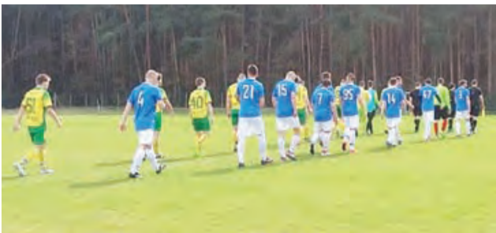
Błękitni Dmosin (niebieskie koszulki) na swoim stadionie nie zwykli przegrywać.

■ Następna, 20. kolejka odbędzie się 21-22 kwietnia: Włókniarz Pabianice – Stal Głowno, Termy Uniejów – PTC Pabianice, Zawisza Rzgów – Widzew II Łódź, Sokół II Aleksandrów – LKS Rosanów, UKS SMS Łódź – Andrespolia, LKS Sarnów – GKS Bedno, Włókniarz Konstantynów – Górnik Łęczycza, ŁKS II Łódź – Orzeł Parzęczew.