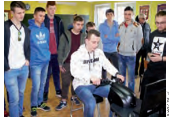
Uczniowie jednej z klas Technikum Mechanizacji Rolnictwa szkoły blichowskiej sprawdzali swoje umiejętności na symulatorze jazdy motocyklem.

– Można się domyślać, że oskarżony był pionkiem w tym procederze. Może nie powiedział o innych, bo się boi o życie i zdrowie? Jest obcy na tym terenie – przekonywał przydzielony z urzędu adwokat. Sam oskarżony powiedział łamaną polszczyzną (podczas procesu obecny był też tłumacz), że był tylko zwykłym pracownikiem i nie wiedział, co działo się na terenie posesji w Kalenicach. mak