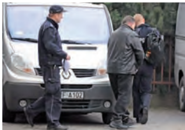
Łotysz był doprowadzany na rozprawę z Zakładu Karnego w Łowiczu, gdzie przebywał a areszcie tymczasowym od roku i 3 miesięcy.

Przypomnijmy, że 46-letni obywatel Łotwy przez kilka miesięcy zajmował na pozór opuszczoną posesję w Kalenicach, w której zainstalował system urządzeń do nielegalnego poboru paliwa. W styczniu ubiegłego roku proceder zakończyła wspólna akcja policjantów z Łowicza i Komendy Wojewódzkiej Policji w Łodzi. Na miejscu zabezpieczono 8 tys. litrów spuszczonego paliwa oraz – co podkreślali przedstawiciele concernu paliwowego specjalistyczne oraz firmy eksploatującej rurociąg – urządzenia do odpompowywania paliwa z rurociągu. Paliwo z Kalenic nadawało się do utylizacji, gdyż koncert nie mógł sobie pozwolić na to, żeby niepełnowartościowy produkt trafił na rynek.