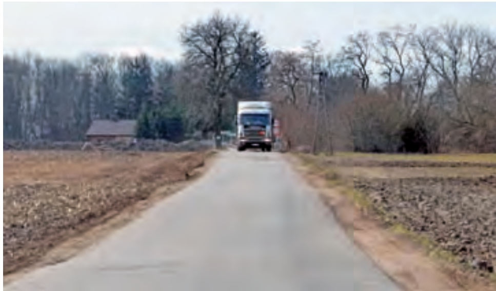
Gmina Bielawy. Objazd remontowanej DW 703 wyznaczony dla pojazdów o masie całkowitej do 3,5 tony.

Zła sytuacja jest zwłaszcza na wąskich drogach w Chruślinie Nowym oraz na objęździe z Bielaw do 703 w kierunku Brzozowa (od ul. Podrzecznej w lewo i dalej prosto), gdzie asfalt został w wielu miejscach dosłownie rozjechany, a pobocza zarwane.