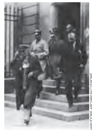
Warszawa, 26 czerwca 1929. Minister Spraw Wojskowych Józef Piłsudski opuszcza gmach sądu po złożeniu zeznań przed Trybunałem Stanu.