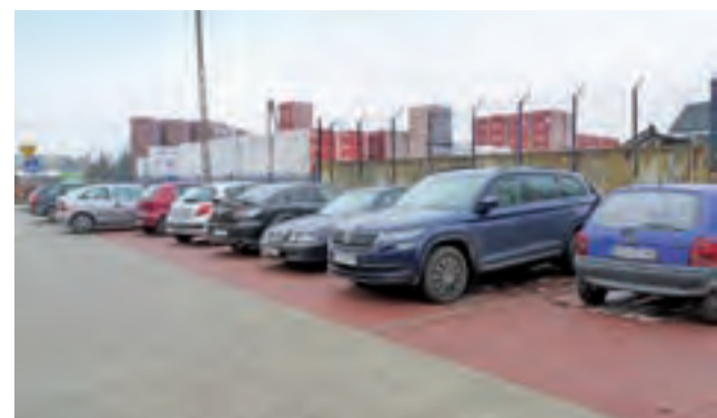
W terenie chodzi o tę drogę wewnętrzną, sąsiadującą z prywatną firmą oraz dwoma posesjami: przy ul. Rolniczej 10 i Piłsudskiego 1.