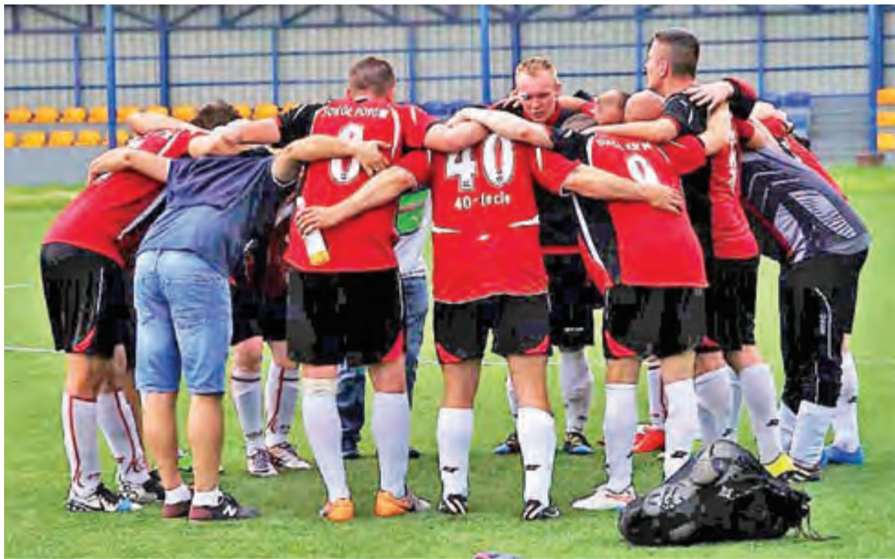
Sokół Popów świetnie rozpoczął rundę wiosenną i planuje szaleńczą pogoń za liderami.

Wyczekiwany komplet punktów zdobył natomiast Powstaniec