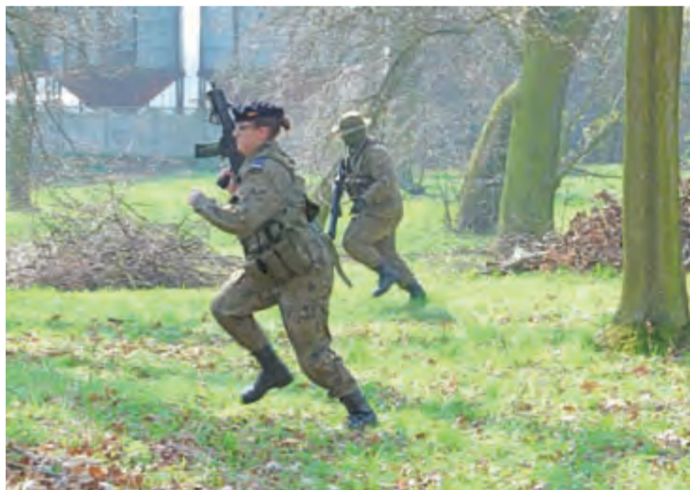
Prezentacja tzw. taktyki zielonej w wykonaniu bratoszewickich kadetów.

Wcześniej warsztaty na uniwersytecie dały licealistom z Głowna możliwość porozmawiania po angielsku z zagranicznymi studentami łódzkiej uczelni. Przyznają, że różne akcenty (np. turecki) trochę utrudniały zrozumienie, ale generalnie wspominają te warsztaty bardzo dobrze. Częsty kontakt z językiem angielskim w szkole i na zajęciach wyjazdowych sprawia, że młodzież świadomie wybiera go także w czasie wolnym – np. oglądając ulubione seriale czy programy po angielsku. Wiele osób już postanowiło, że na maturze w przyszłym roku język ten będzie zdawać na poziomie rozszerzonym. ■