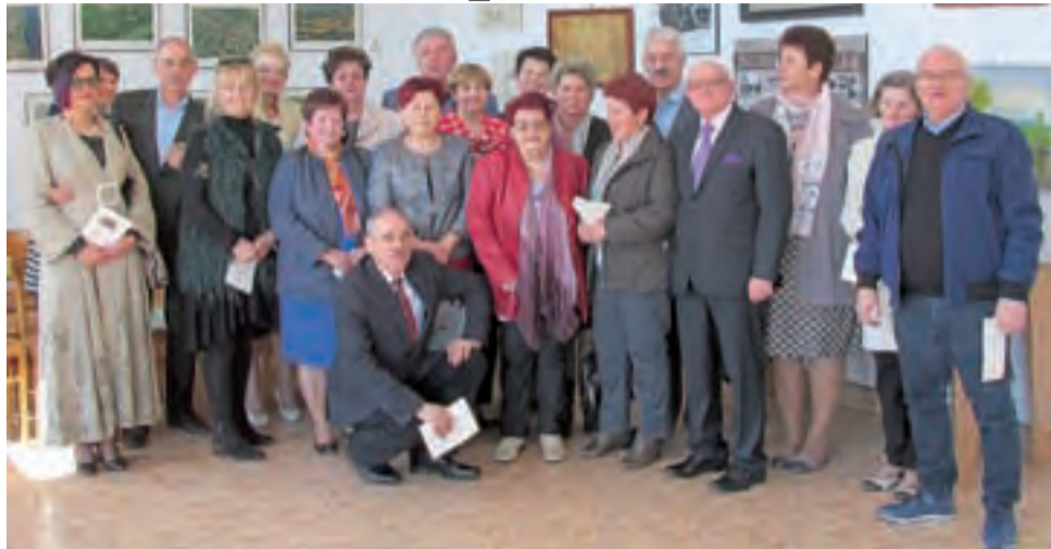
Absolwenci klasy IV A o profilu matematyczno-fizycznym LO w Zdunach (rocznik 1978) w sali politechnicznej, z której obecnie korzysta technikum w Zduńskiej Dąbrowie.

Część nieoficjalną, pełną wzniesień i sentymentalnych wspomnień, kontynuowali w restauracji „U Julka” w Zdunach. Warto dodać, że absolwenci tej klasy spotykają się regularnie od momentu