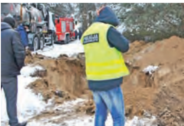
Policjanci natrafili na instalację służącą do kradzieży paliwa przypadkowo.

99-400 Łowicz Jastrzębia 95 46/837-14-10 46/837-15-89