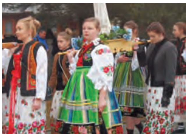
Łowiczanki na procesji rezurekcyjnej w Murzasichlu.