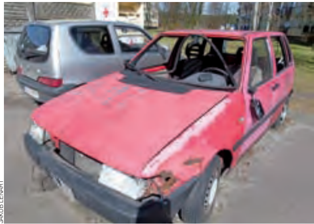
Stary wrak blokuje miejsce i szpeci okolicę swym wyglądem już od kilku lat.