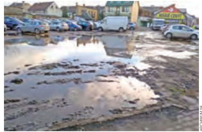
Stan parkingu u zbiegu ul. Podrzecznej i Koziej w grudniu 2017 roku.

■ że lepiej byłoby rozbudować parking na Błoniach. Może tak, on przyda się w weekendy, ale nie będzie służył tym, którzy – a tacy jesteśmy prawie wszyscy – chcieliby podjechać jak najbliżej do sklepu. Te 200 metrów sprawa jednak różnicę. Tak jak niemal nikt nie parkuje na placu za