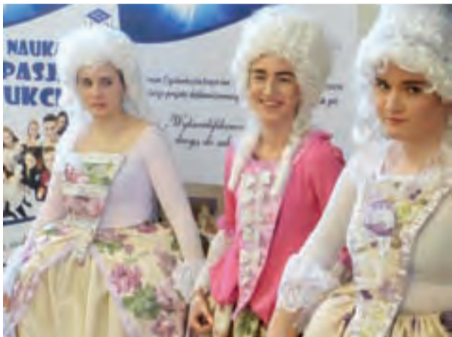
Uczennice II LO prezentują się w fantazyjnych sukniach i kostiumach sprzed przeszło 200 lat.