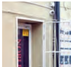
Klienci wchodzący do salonów byli obserwowani przez kamery, tutaj przykład z ul. Zduńskiej w Łowiczu.

W trzecim, skontrolowanym na terenie Łowicza salonie gier hazardowych, automaty ukryto za kotarą. Łącznie, w trzech lokalach funkcjonariusze KAS zabezpieczyli 15 maszyn, router, tablet i kartę Wi-Fi.