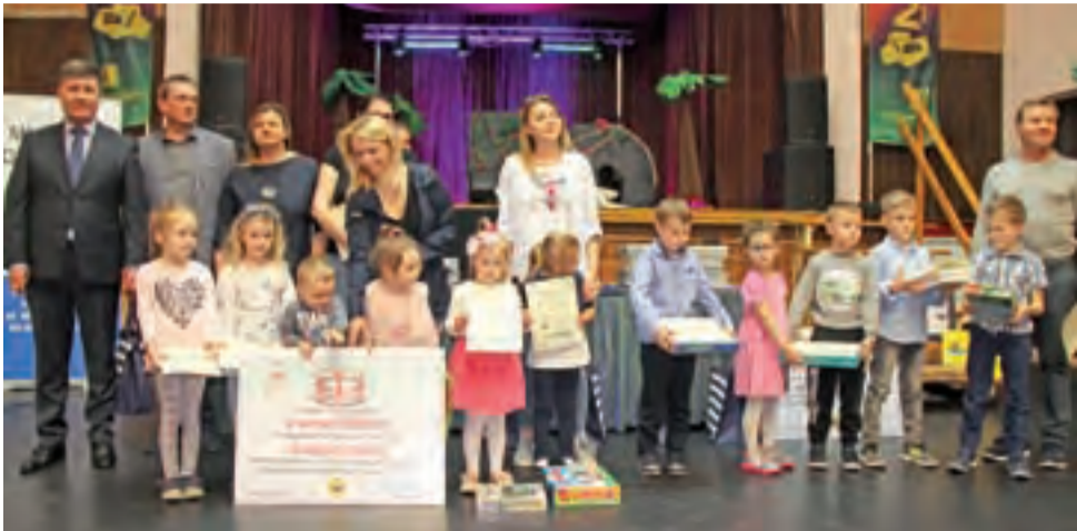
Finał zbiórki odpadów. Nagrodzeni w kategorii przedszkolnej.