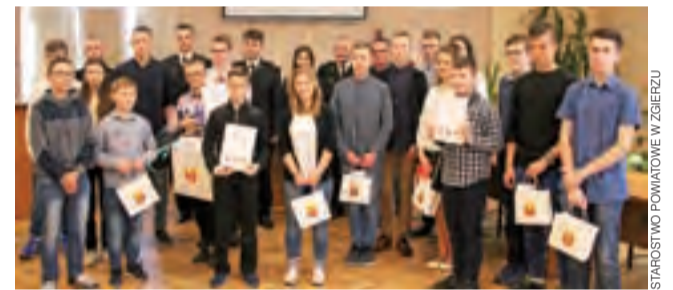
Uczestnicy etapu powiatowego Turnieju Wiedzy Pożarniczej.

W eliminacjach powiatowych, które odbyły się 11 kwietnia w siedzibie zgierskiego starostwa, wzięło udział 20 uczniów szkół podstawowych, gimnazjalnych i ponadgimnazjalnych z terenu powiatu. Byli to zwycięzcy rozegranych wcześniej eliminacji gminnych. oprac. ewr