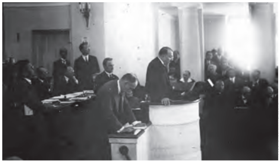
Warszawa, lipiec 1926. Premier Kazimierz Bartel odczytuje swoje exposé.