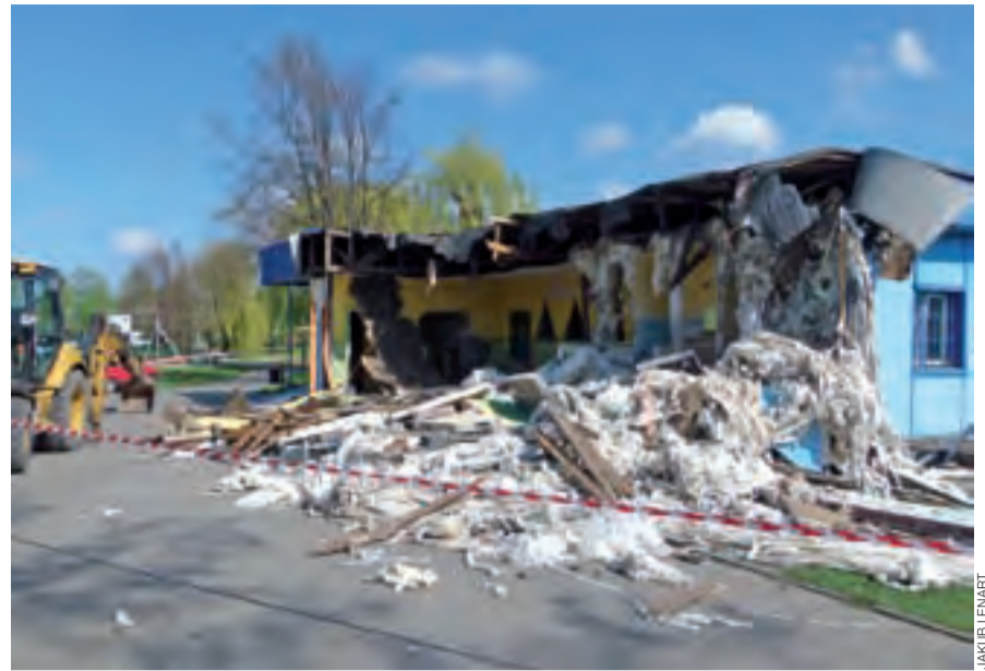
Budynek wypożyczalni w trakcie rozbiórki. Wkrótce zniknie z krajobrazu Głowna