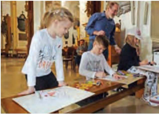
Dzieci z grupy „Akwarelki” podczas pleneru malarskiego w katedrze.