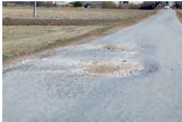
Droga gminna do Bielaw. Tędy prowadzi objazd, wyznaczony na czas przebudowy bielawskiego odcinka DW 703. Stan na 5 kwietnia.

Pytania o organizację ruchu podczas przebudowy DW 703, o możliwość wprowadzenia wahadła i świateł, a także o zakres odpowiedzialności za uszkodzenie dróg gminnych w okresie obowiązywania objazdów wysłaliśmy zarówno do Eurovii, jak i do Zarządu Dróg Wojewódzkich w Łodzi.