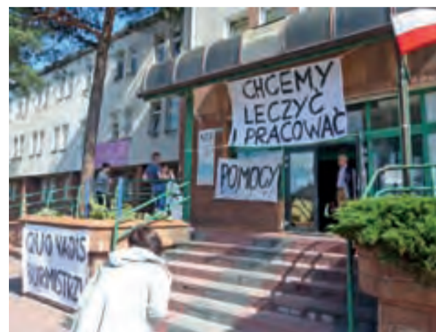
Pracownicy zmanifestowali swoje stanowisko. Transparenty przygotowane przez Komitet Obrony Szpitala w Głownie, 18 kwietnia.

Jeśli intencje nowego Inwestora dotyczące kontynuowania działalności szpitalnej w Głownie są szczerze, to nie ma on powodów obawiać się zapisu o sankcjach, które Gmina Miasta Głowno mogłaby egzekwować tylko w sytuacji, gdyby szpitala w Głownie dalej nie prowadził.