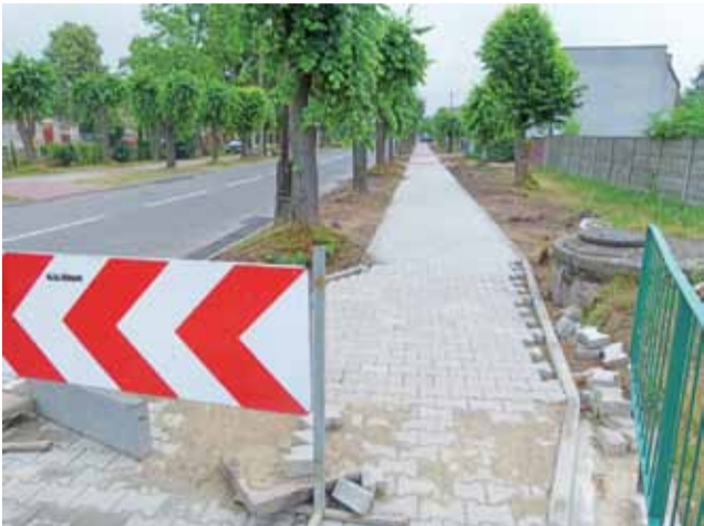
Przy okazji kładzenia nitki gazociągu powstał nowy odcinek chodnika