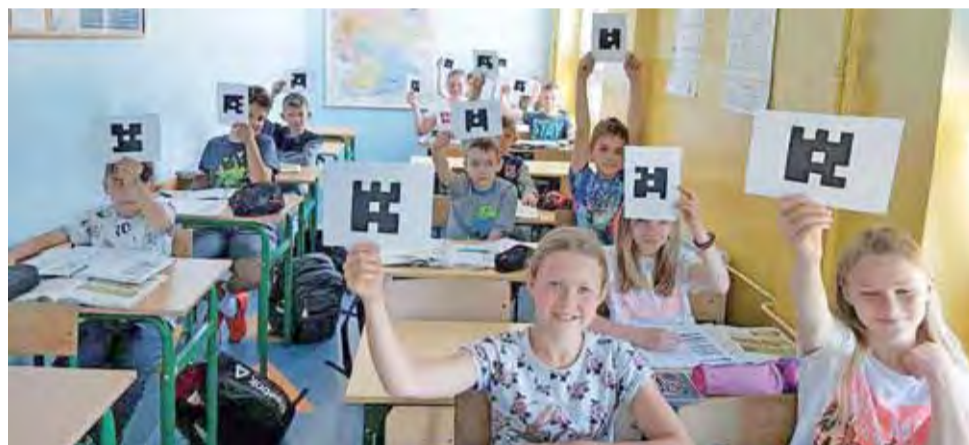
Zamiast odpytywać, nauczyciele sprawdzają odpowiedzi uczniów za pomocą aplikacji Plickers, czyli kodów.

Końcówka roku szkolnego zbiega się tu z finałem unijnego projektu „Krok do przodu”, realizowanego tu przez blisko 2 lata, dzięki któremu nauka, zajęcia pozalekcyjne, ale i sprawdzanie wiedzy zyskały zupełnie nowy wymiar. Przypomnijmy, że projekt edukacyjny finansowany jest ze środków Europejskiego Funduszu Społecznego. Dzięki niemu 5 nauczycieli szkoły przy ul. Targowej mogło skorzystać z 16 różnych kursów realizowanych