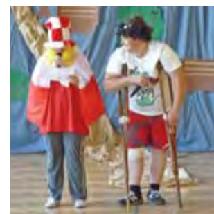
Kibicować można wspólnie. Rodzice uczą dzieci tolerancji wobec osób chorych i niepełnosprawnych.

Dodajmy, że rodzice klas I b i IV b wszystko przygotowali sami: zadbał o opracowanie scenariusza, wypożyczenie strojów,