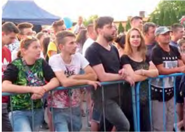
Pod sceną. Publiczność czekająca na koncert Grubsona.