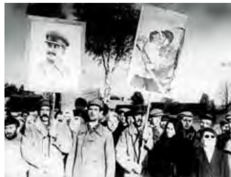
1939, brak miejsca, Polska. Uczestnicy wiecu z plakatami propagandowymi, na jednym widnieje Józef Stalin, drugi to plakat W. Korieckiego przedstawiający „wyzwolonego” chłopca całującego się z żołnierzem Armii Czerwonej.

■ 22 października 1939 – na zajętych przez Armię Czerwoną ziemiach II RP w atmosferze terroru odbywają się wybory do Zgromadzeń Ludowych Zachodniej Ukrainy i Zachodniej Białorusi. Ziemie te zostają następnie włączone do Ukraińskiej i Białoruskiej SRR.