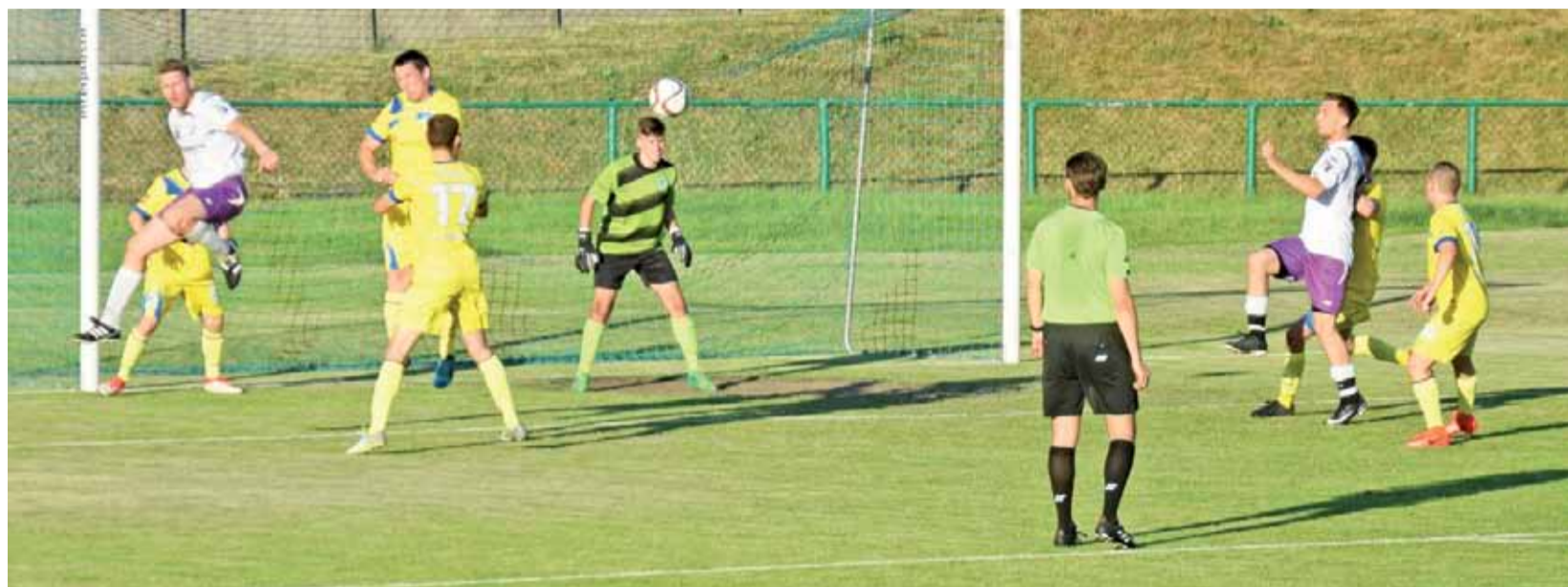
Piłkarze Stali Głowno (żółte stroje) rzadko pozwalali gościom z Pabianic na zagrożenie pod własną bramką.