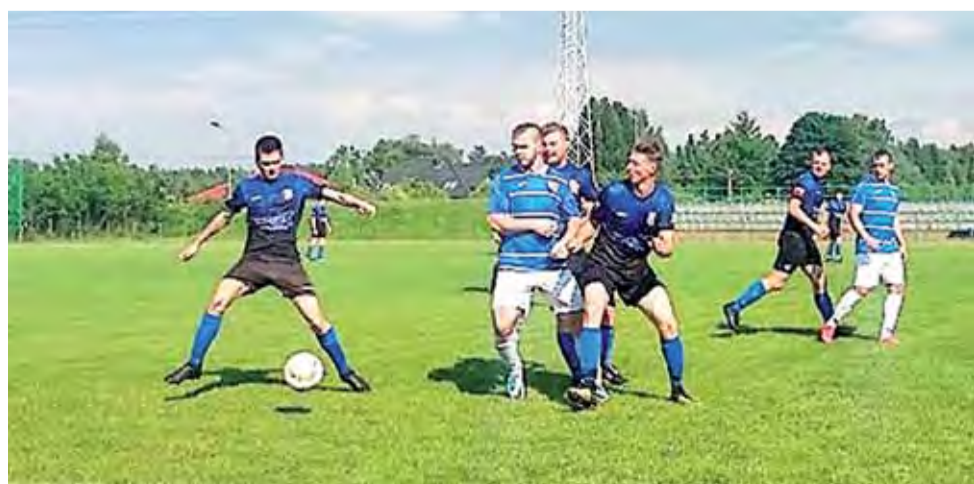
Błękitni (niebiesko-białe stroje) po raz kolejny uplasowali się na podium A-klasy.

Siatkówka plażowa | Gimnazjada - powiat, rejon