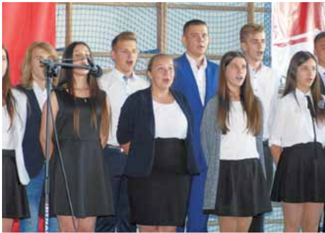
Pierwsi zaprezentowali się członkowie ZPT „Blichowiaci”.