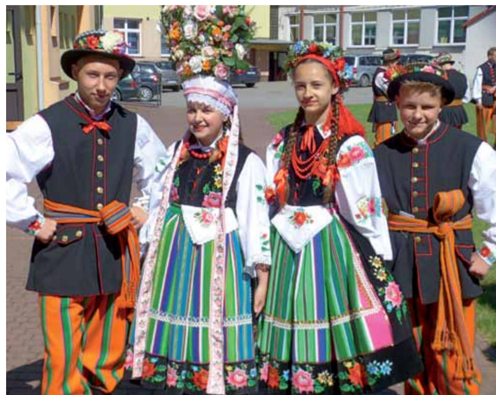
Uczniowie, którzy w obrzędzie weselnym odgrywali rolę pary młodej i drużby.