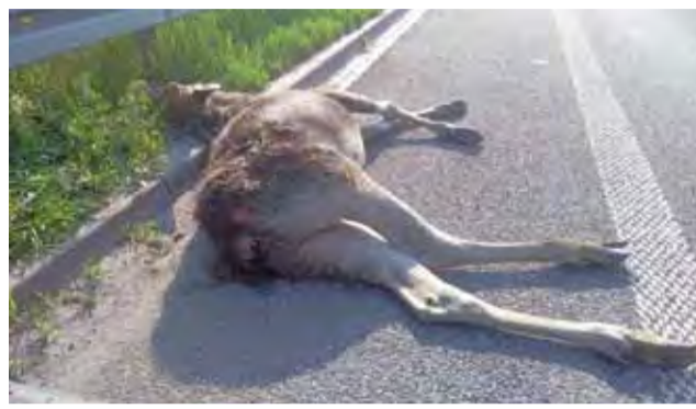
Martwy łoś w okolicach mostu w Maurzycach.

Ciężarówka nie było już na miejscu. Z niewiadomych przyczyn kierowca postanowił odjechać. Uszkodzenia pojazdu nie mogły więc być bardzo poważne. Łosiem zainteresowały się natomiast osoby, które zamierzały go