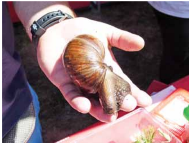
Ślimak gigant. Afrykańska Achatina – największy ślimak lądowy – przyjechał do Łowicza z Zakładu Zoologii Bezkręgowców Uniwersytetu Łódzkiego.