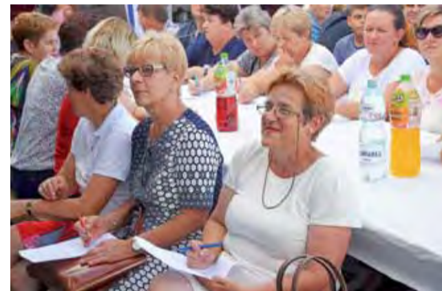
Jedną z atrakcji pikniku folklorystycznego był test wiedzy o zespole Boczki Chelmońskie.

– Po roku czasu, kiedy tańczyłam w zespole, przyjechał taki chłopak w mundurze wojskowym, przysiadł się do mnie i tak już zostało na całe życie – wspo-