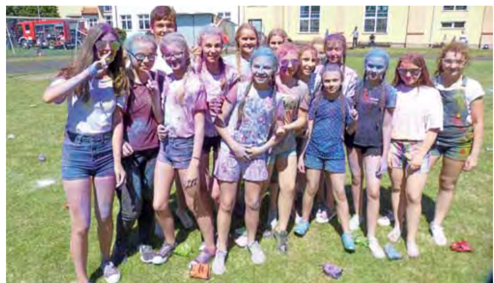
Po „bitwie” na kolory uczestnicy byli od stóp do głów pokryci barwnikami.

Po rozdaniu pamiątkowych medali i nagród uczniowie zostali zaproszeni na murawę boiska na bitwę kolorów. Otrzymali kolorowe, łatwo zmywalne i nieszkodli-