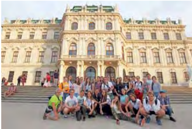
Grupa wyróżnionych uczniów na wycieczce w Wiedniu.

kowie uczestniczyli również w mszy świętej z okazji Bożego Ciała. Dzięki życzliwości duchownego mieli oni możliwość zobaczyć nie tylko wnętrza tamtejszego kościoła pijarów, lecz także wejść na dach. Co więcej, pod świątynią udało się im zaprezentować niektóre z autorskich piosenek. To spontaniczne wystąpienie spotkał się z aplauzem zgromadzonych osób oraz klientów pobliskiej kawiarni. Wyjazd zakończył się zwiedzaniem jaskiń na czeskich Morawach.