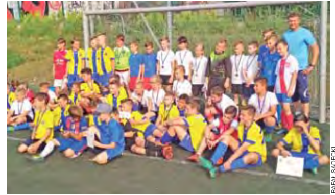
Uczestnicy Mundial Orlik Cup 2018 po sportowych zmaganiach.

Drużyna Kataru wygrała Turniej Piłki Nożnej Mini Mundial Orlik Cup o Puchar Burmistrza Strykowa. W zawodach udział wzięli młodzi zawodnicy, którzy wcielali się w rolę piłkarzy reprezentacji, biorących udział w nadchodzących Mistrzostwach Świata w Rosji.