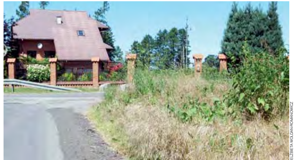
Okolice Karnkowa, skrzyżowanie drogi z Domaradzyna z drogą powiatową nr 5118E, stan na 6 czerwca.

Skoncentrowała się na rejonie skrzyżowania drogi gminnej z Domaradzyna z powiatówką nr 5118E, gdzie, by wyjechać ciągnikiem rolniczym z drogi podporządkowanej w drogę z pierwszeństwem, pasażer musiał wysiąść z kabiny, wyjść na jezdnię i dawać kierowcy znaki, czy ten może ruszyć, a i tak nie był to manewr w pełni bezpieczny. Mieszkanka gminy 4 czerwca powiedziała nam, że to wysokie trawy i krzaki na poboczach odpowiadają za ograniczenie widoczności. Jej zdaniem nawet te odcinki dróg, gdzie koszenie traw miało miejsce, zostały uporządkowane jedynie na wąskim pasku około 50 cm, co niewiele pomaga, bo i tak największe ograniczenie stanowią bujne i rozłożyste krzaki. Niekiedy rolnicy po pro-