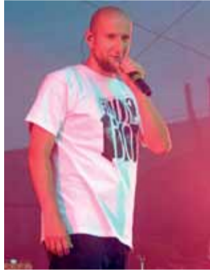
Grubson w Strykowie. Początek dwugodzinny show z udziałem rapera i jego zespołu.

W sobotę na plenerowej scenie wystąpiły zespoły: Jacek Dewódzki Band, Pudelsi i gwiazda wieczoru – raper Grubson. Pierwszy zespół nie miał szczęścia do publiczności, bo większość uczestników zabawy – zapewne z racji upału – siedziała przy stołach pod