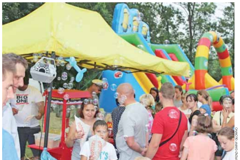
Gminne Święto Rodziny. Tak w niedzielę 3 czerwca bawiono się w Bronisławowie.

Obszerną galerię zdjęć obejrysz na www.lowiczanie.info