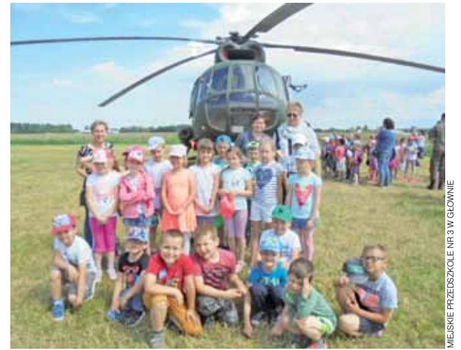
Pod skrzydłami wojskowego śmigłowca. Przedszkolaki z „Trójki” na wycieczce w Leźnicy Wielkiej.