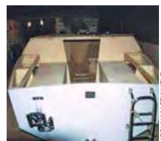
„Setka” podczas budowy.

– Chociaż ja tylko jeden port planuję „zaliczyć” – mówi w rozmowie z nami. Rejs chciałby rozpocząć w jednym z portów na