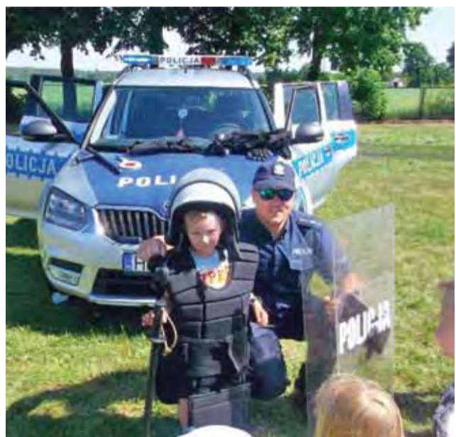
Policjanci mieli okazję przekazać wiedzę dzieciom, a najmłodsi mogli z bliska obejrzeć np. radiowóz i przymierzyć strój policjanta.

Policjanci mieli okazję przekazać wiedzę dzieciom, a najmłodsi mogli z bliska obejrzeć radiowóz, motocykl policyjny i wyposażenie służby policjantów.