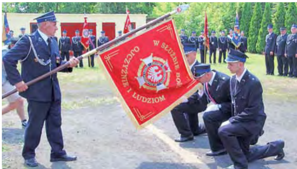
Uroczysta chwila. Przekazanie nowego sztandaru jednostki OSP w Popowie Głowieńskim.

Bardzo uroczystym momentem było wręczenie jednostce nowego sztandaru. Najpierw jednak stary sztandar został odprowadzony do izby pamięci. Ponieważ fundatorami nowego sztandaru są druhowi i druhowie jednostki OSP w Popowie Głowieńskim oraz mieszkańcy okolicznych wsi, w ich imieniu symbolicznego wbicia gwoździ w drzewiec dokonali: prezes OSP w Popowie Głowieńskim