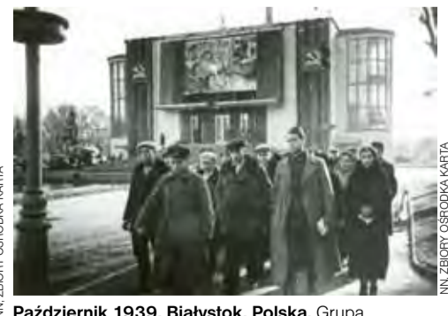
Październik 1939, Białystok, Polska. Grupa deputowanych Zgromadzenia Ludowego Białorusi Zachodniej, napis na transparenecji zawieszonym nad wejściem do Teatru Miejskiego, zamienionego na Dom Ludowy: „Pozdrowienie wybrańcom narodu, delegatom Zgromadzenia Ludowego Zachodniej Białorusi”.

■ 5 marca 1940 – władze ZSRR wydają decyzję o zamordowaniu 14.700 polskich jeńców wojennych (oraz 11.000 osób aresztowanych znajdujących się w więzieniach w zachodnich obwodach Ukrainy i Białorusi). Na jej mocy polscy oficerowie z obozów jenieckich w Kozielsku i Starobielsku oraz oficerowie, urzędnicy i ziemianie z obozu w Ostaszówce zostają rozstrzelani w lesie w pobliżu wsi Katyń, w Charkowie i w siedzibie NKWD w Kalininie (obecnie Twer).