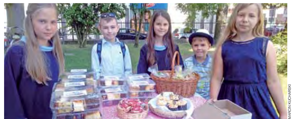
Pieniądze zebrane podczas mini kiermaszu ciast będą przeznaczone na wakacyjny wyjazd dzieci ze scholi.