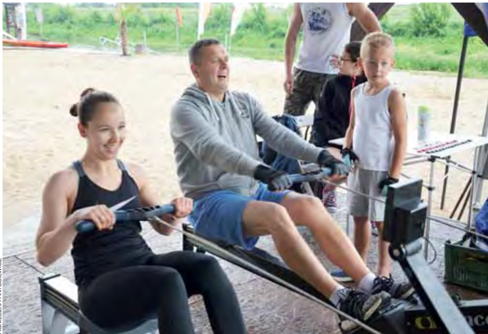
Podczas imprezy padł ważny wynik w sztafecie wioślarskiej na 100-lecie odzyskania niepodległości przez Polskę.