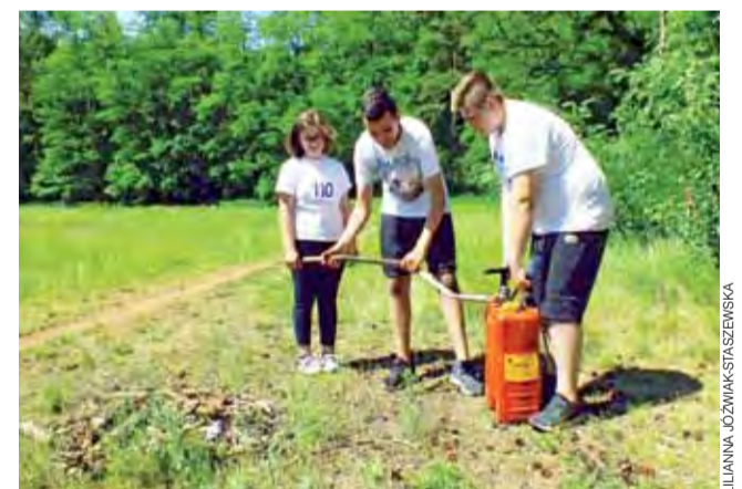
Jedno z zadań polegało na gaszeniu ogniska, co ze względów bezpieczeństwa było tylko symulacją konkretnych działań.

Impreza odbyła się 30 maja i zgromadziła młodzież szkolną z terenu gminy Stryków. We współorganizację biegu zaangażowały się jednostki OSP ze Swędowa, Bratoszewic, Kielminy i Lipki. Uczestnicy najpierw napisali test sprawdzający ich wiedzę teoretyczną, a następnie mieli do pokonania trasę o długości 1,5 km, a na niej punkty z zadaniami. Była resuscytacja, udzielanie pomocy podczas zasnęnięcia, zadławienie osoby dorosłej oraz noworodka, układanie poszkodowanego w pozycji bezpiecznej, czy bandażowanie złamania otwartego. Oprócz tego trzeba