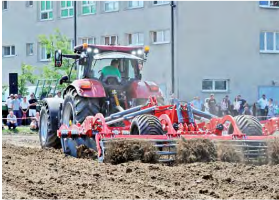
Pokazowi maszyn na Blichu przyglądało się wielu rolników.

Wielu rolników czekało na zapowiedziane prezentacje rolnictwa precyzyjnego z wykorzystaniem urządzeń i maszyn rolniczych. Park maszynowy wystawiła nie tylko szkoła, ale również, a może przede wszystkim kilka firm, które