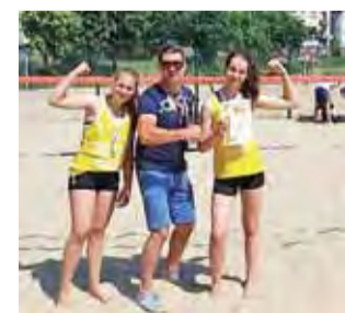
Głowieńska reprezentacja Gimnazjum Miejskiego po raz kolejny na podium.