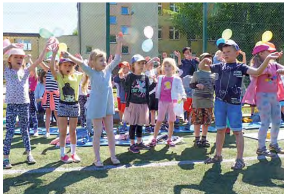
W przerwie rozgrywek sportowych dzieci z chęcią angażowały się w popisy taneczne.

Tradycyjnie, jak co roku, w sportowej olimpiadzie nikt nie poniósł porażki. Na koniec wszyscy zostali nagrodzeni. Dla dzieci przygotowano medale oraz dyplomy uczestnictwa, a placówki, które reprezentowały, otrzymały pamiątkowe puchary. aw