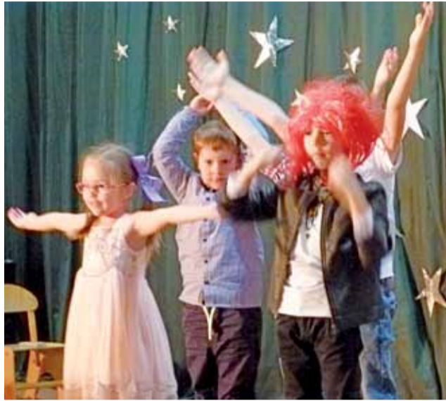
Show jak u Wiśniewskiego. Dzieci z „Osinkowa” w piosence z repertuaru zespołu Ich Troje.