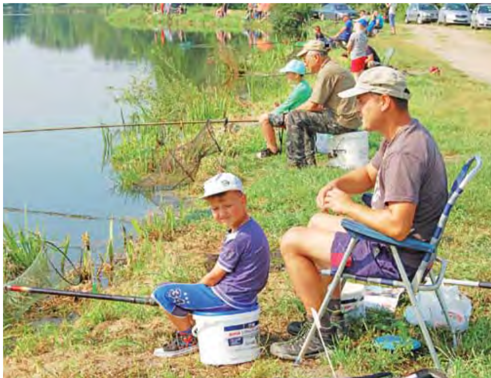
Wędkarski Dzień Dziecka nad zalewem cieszył się sporym powodzeniem.

Łowiono płocie, okonie, leszczyki, a jednej z dziewcząt udało się nawet złowić sumę o długości 39,5 cm, który okazał się być najdłuższą rybą zawodów. W trak-