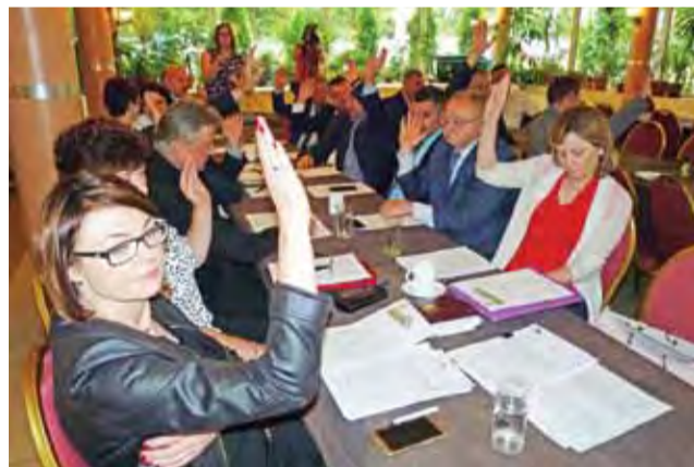
Na tym samym zgromadzeniu jednogłośnie udzielono absolutorium dla zarządu ZM „Bzura”.