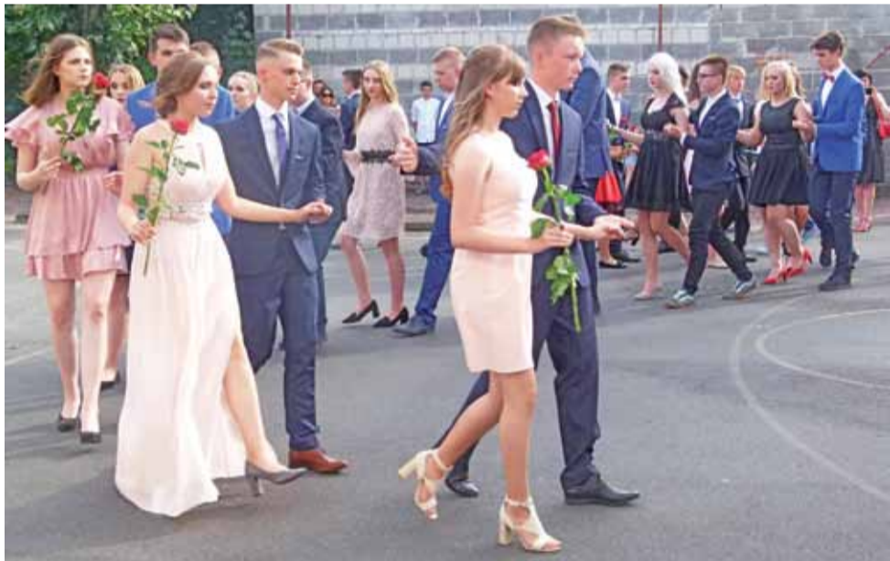
Gimbal w Gimnazjum Miejskim. Polonez na szkolnym boisku.