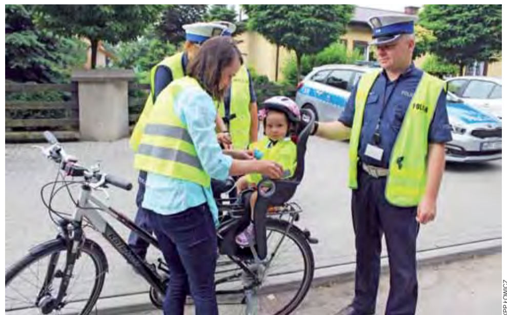
W akcji „Bezpieczny uczeń w drodze do szkoły w Kiernozi” uczestniczyli również policjanci z Łowicza.

Elementy odblaskowe mogą być na stałe przymocowane do roweru lub umieszczone na odzieży rowerzystów. opr. mak