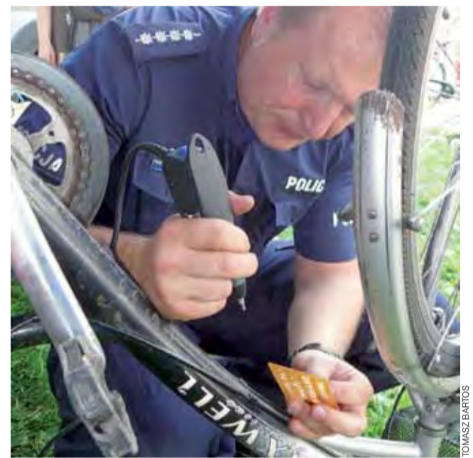
Znakowanie roweru na pikniku po Marszu dla Życia i Rodziny.

Znakowanie będzie prowadzone przez m.in. dzielnicowych na najbliższych imprezach plenerowych odbywających się w mieście i na terenie powiatu. Zainteresowani powinni zgłaszać się do nich z rowerem, dowodem osobistym oraz dowodem zakupu jednoślada. Na miejscu właściciel wypełnia też oświadczenie, że rower jest jego własnością. Znakowanie odbywa się także w komendzie po-