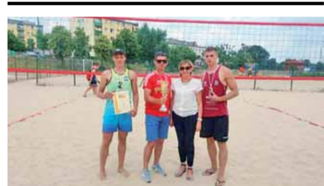
Drużyna PKLO Głowno w siatkówce plażowej zagrała świetny turniej.

Po rozegraniu eliminacji w grupach triumfowali SP 205 Łódź i SP Żelów, zaś SP 1 Głowno miało najwięcej punktów wśród drużyn na 2. miejscu, z kolei czwarta drużyna finału to gospodarz SP Buczek. Skład reprezentacji głowieńskiej szkoły to zarówno dziewczęta jak i chłopcy z klas I, II, III i IV, większość z nich to uczniowie klas sportowych SP nr 1. Finał Wojewódzki rozegrany zostanie już w najbliższy piątek, 15 czerwca, a do zawodów uczniów przygotowali nauczyciele wychowania fizycznego Marcin Moszczyński oraz Adrian Tomczyk. wp