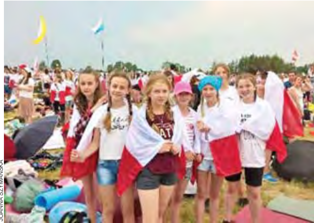
Młodzież ze Szkoły w Kocierzewie Południowym na lednickich polach.

W tym roku hasło było wyjątkowo krótkie, wieloznaczne, a przy tym wyraziste: „Jestem!”.