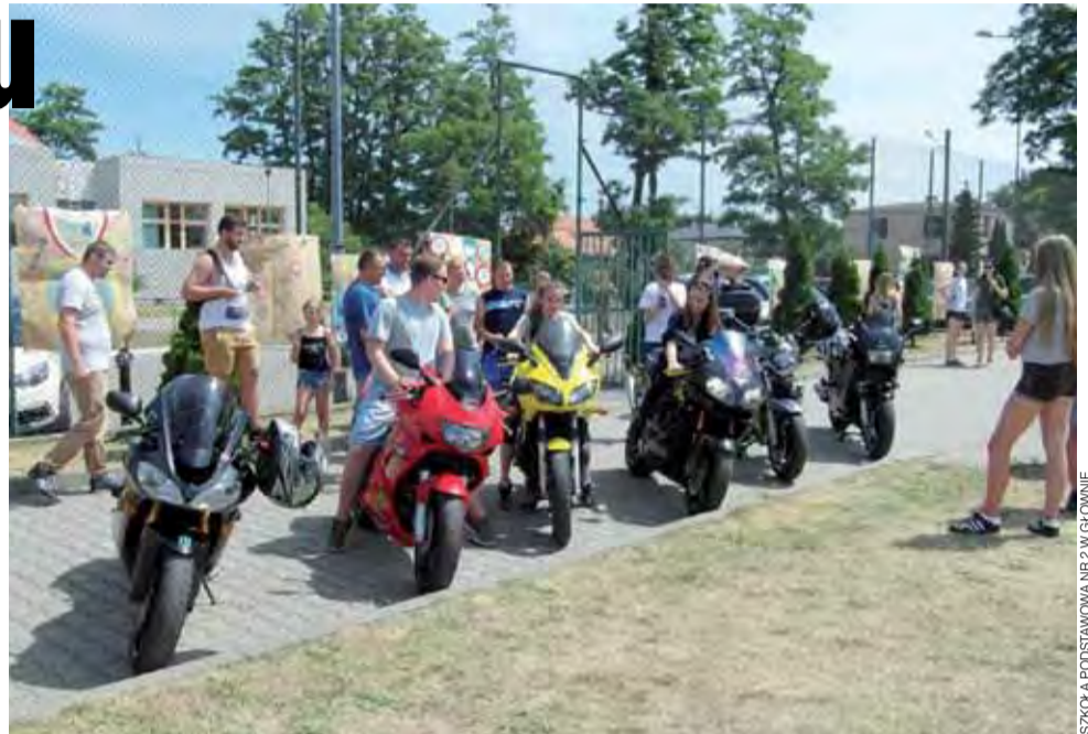
SZKOŁA PODSTAWOWA NR 2 W GŁOWNIE

Na pikniku rozstrzygnięty został konkurs plastyczny „Rodzina