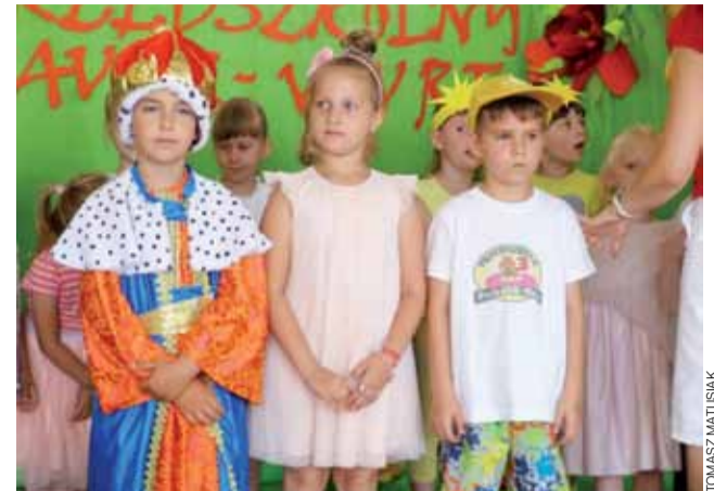
Na koniec na scenę wyszli wszyscy uczestnicy konkursu – na pierwszym planie trzyosobowy zespół gospodarzy – Przedszkola nr 3.