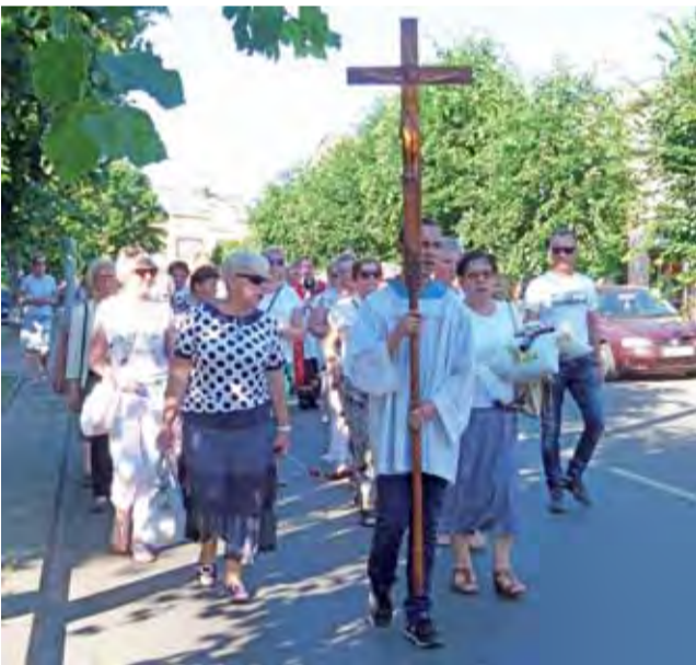
Z parafii do parafii. W piątek, 8 czerwca, w uroczystość Najświętszego Serca Jezusowego, wierni z parafii św. Jakuba w Głownie tradycyjnie po wieczornej mszy św. przeszli ulicami miasta w procesji eucharystycznej na Zabrzeżnię, do do kościoła św. Maksymiliana Kolbego. Na zdjęciu procesja na ulicy Zgierskiej, na wysokości poczty.