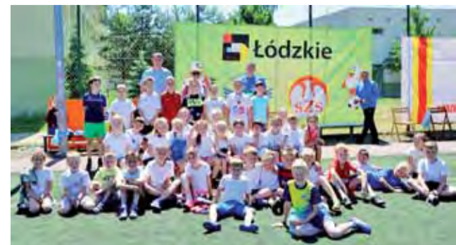
Młodsi uczniowie z Głowna grali i bawili się w Łodzi.