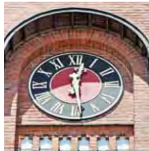
Zegar na wieży kościoła w Bąkowie Górnym.