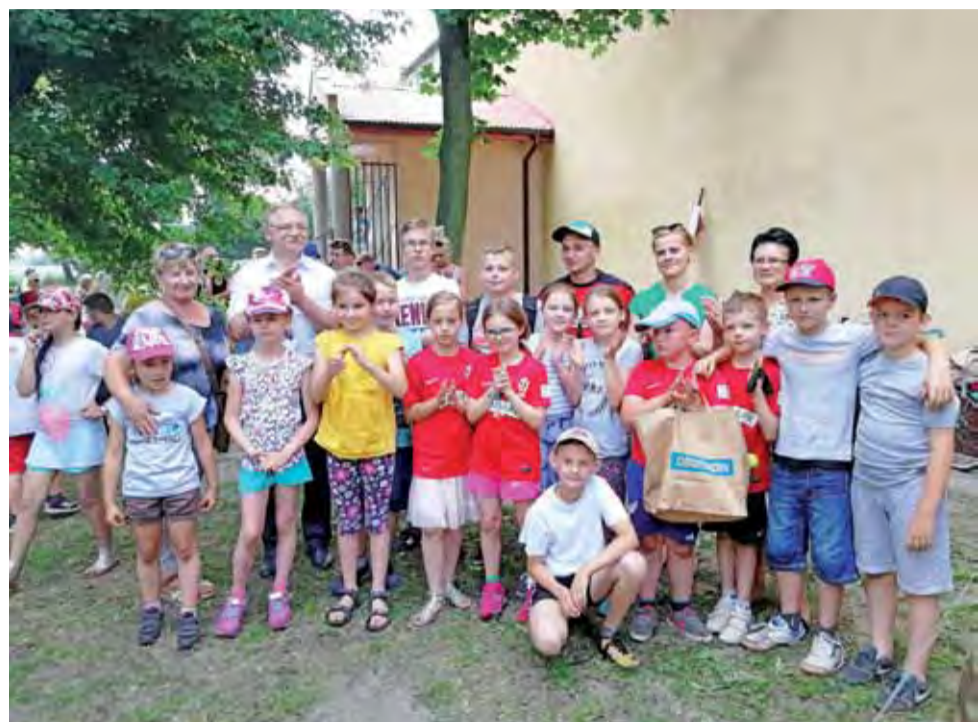
Radość z wygranej. Na zdjęciu zwycięska drużyna SP Bielawy po ogłoszeniu wyników.

Ciekaw jestem, czy inne rady zdecydowały się na podobne rokose, jak w stolicy bimbru – Chąśnie i w Łowiczu. W obu gminach rządzi PSL, który jak wiemy stoi w opozycji do obecnej władzy. Więc trzeba było PiS-owskiemu rządowi powiedzieć „weto”. Na portalu lowiczanie.info można przeczytać wpis przewodniczącego Rady Gminy Łowicz, który łaskawie daje możliwość interwencji w tej sprawie wojewodzie. Tyle, że prawdopodobnie wojewodzie nic do tego, a jeśli po 1 lipca wójtowie w Łowiczu czy Chąśnie wypłacą sobie „po staremu”, a skarbnicy gminy to zatwierdzą, to będzie ich problem. Zaś radni powinni pamiętać, że są funkcjonariuszami publicznymi z pełnymi tego konsekwencjami. ■