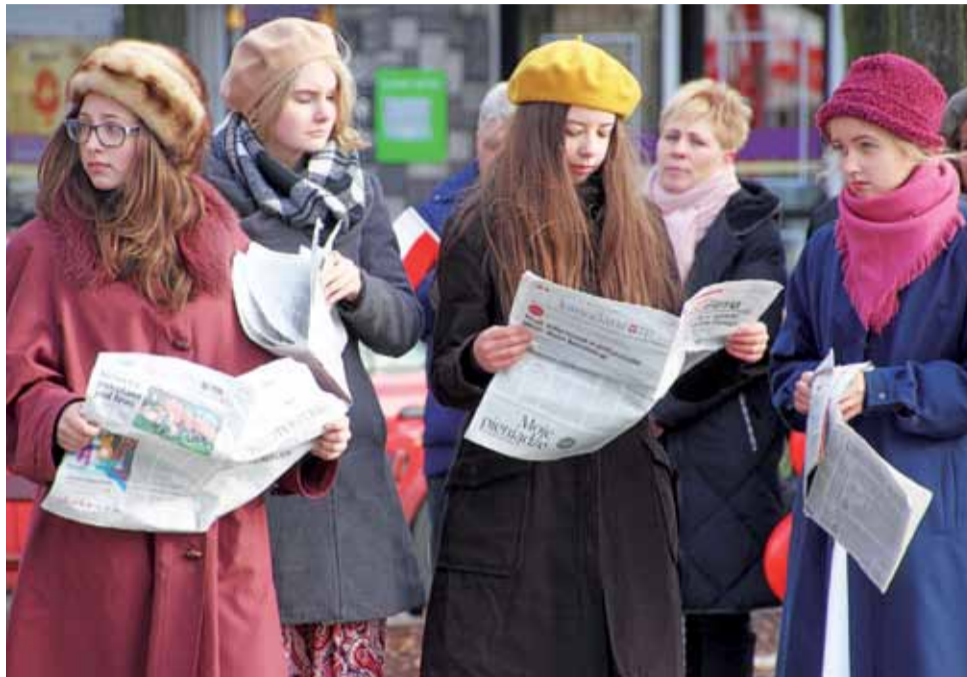
Dawni głównianie śledzący w prasie drogę Polski do niepodległości. Scena ze spektaklu teatru Eureka, wystawionego na powiatowych obchodach Narodowego Święta Niepodległości w 2017 r.