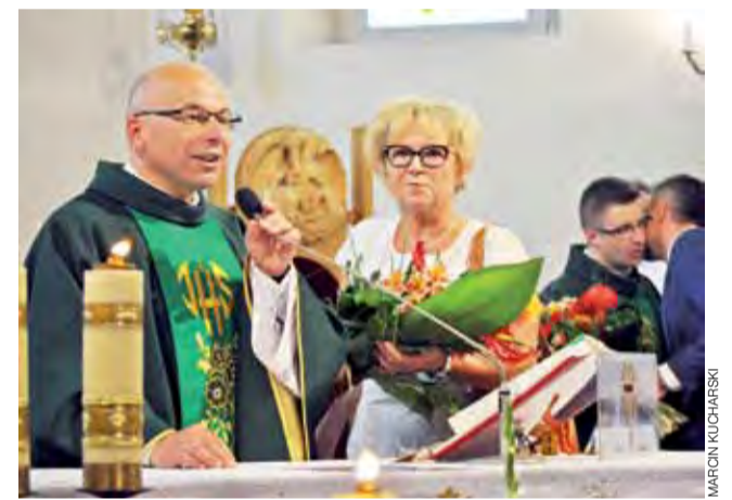
Księża przyjmowali gratulacje i kwiaty bezpośrednio po mszy św. w kościele. Później zaprosili wszystkich na poczęstunek.

Tegoroczna edycja była już dziewiątą odsłoną religijnej olimpiady. Jej celem jest szerzenie wśród młodzieży wiary i chrześcijańskiej postawy, a także kształtowanie w uczniach zdolności zdobywania oraz poszerzania wiedzy religijnej. aw