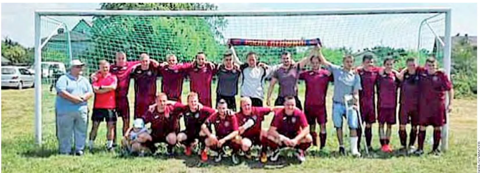
Głowieńska drużyna OSP Iskry wywalczyła mistrzostwo i awans w sezonie 2017/2018 B-klasy, gr. III.

Niesamowitą passę kontynuują z kolei gracze Sokoła Popów, którzy odnieśli 13 z rzędu zwycięstwo i nadal nie stracili nawet jed-