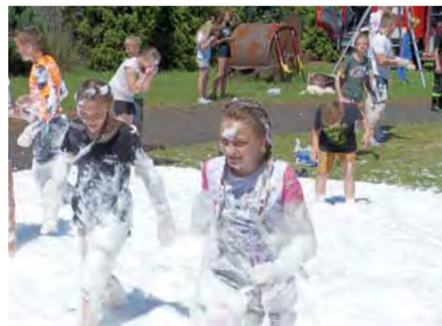
Kąpiel w pianie zagwarantowali uczniom drухowie z OSP w Karsznicach Dużych.

we proszki do wyrzucania w górę, które wkrótce pokryły większość z nich od stóp po czubek głowy. Trudno opisać emocje, jakie przez kilka minut towarzyszyły uczestnikom tej zabawy. Wywodzi się ona z Indii, gdzie towarzyszyła uroczystościom religijnym, od kilku lat, już jako wyłączny rozrywkowy, zdobywa dużą popularność w Europie, także w Polsce.