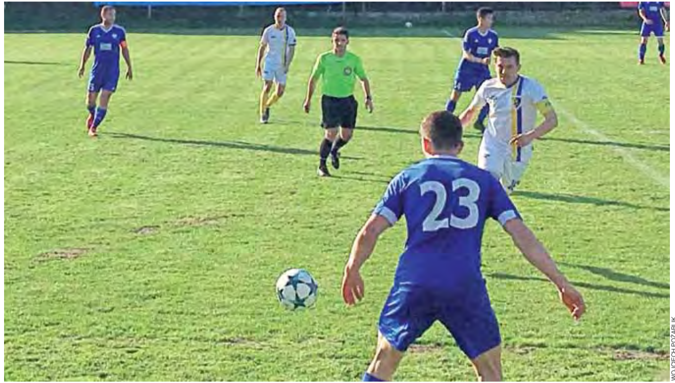
Piłkarze Strykowa (białe stroje) w ostatnich tygodniach stracili stabilizację jeżeli chodzi o grę w defensywie.

To drugi raz kiedy Zjednoczeni wypuszczają zwycięstwo z rąk. Strykowianie nie poprawią już swojej pozycji w tabeli i aktualnie znajdują się na 5. miejscu. Podopieczni trenera Łukasza Wijaty