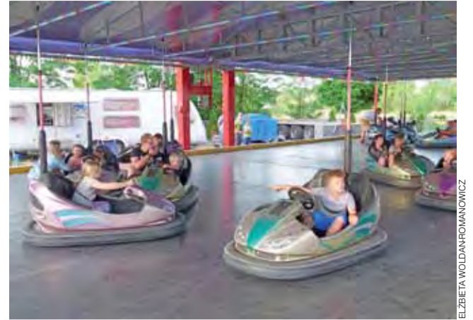
Za kółkiem. Był autodrom – była dobra zabawa.

Dni Strykowa 2018 | Za nami dwudniowe Święto Miasta