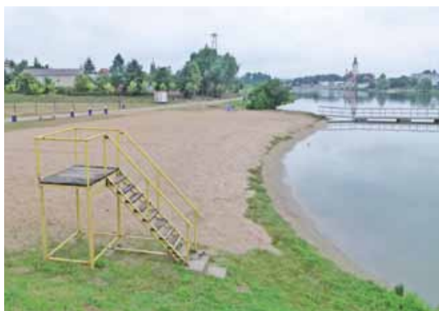
Zalew w Strykowie od strony plaży po nawiezieniu nowego piasku.

Nad bezpieczeństwem wypoczywających czuwać będzie 3 ratowników – 2 nad zalewem i 1 na przystani. Tutaj też nie obywało się bez trudności, ponieważ osoby,