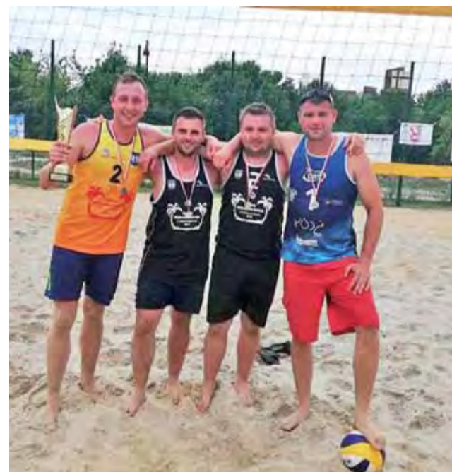
Drużyna siatkarzy reprezentująca łowicko-głowniejski region została Wicemistrzami Polski Pracowników Oświaty.