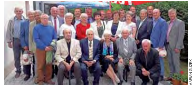
42 lata od matury i 7 lat od poprzedniego spotkania - teraz absolwenci z tej klasy chcą się, w miarę możliwości, spotykać częściej.

Dodajmy, że jubileuszowe spotkanie nie było pierwszym po maturze. Absolwenci regularnie widać się co kilka lat, by przy tej okazji uczcić kolejne jubileusze. Niektórzy z nich utrzymują ze sobą częstszy kontakt i razem świętują inne okazje, np.: wspólne uroczystości oplatkowe. Pod koniec wydarzenia wyrazili oni nadzieję, że będzie im dane w dobrym zdrowiu spotkać się za pięć lat, podczas świętowania kolejnej, już siedemdziesiątej rocznicy. aw