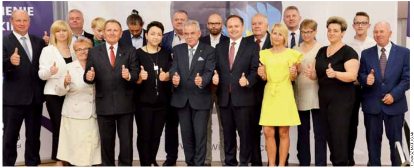
Kandydaci „Porozumienia Łowickiego”. Ilu jest wśród nich przyszłych radnych? Przekonamy się w listopadzie.