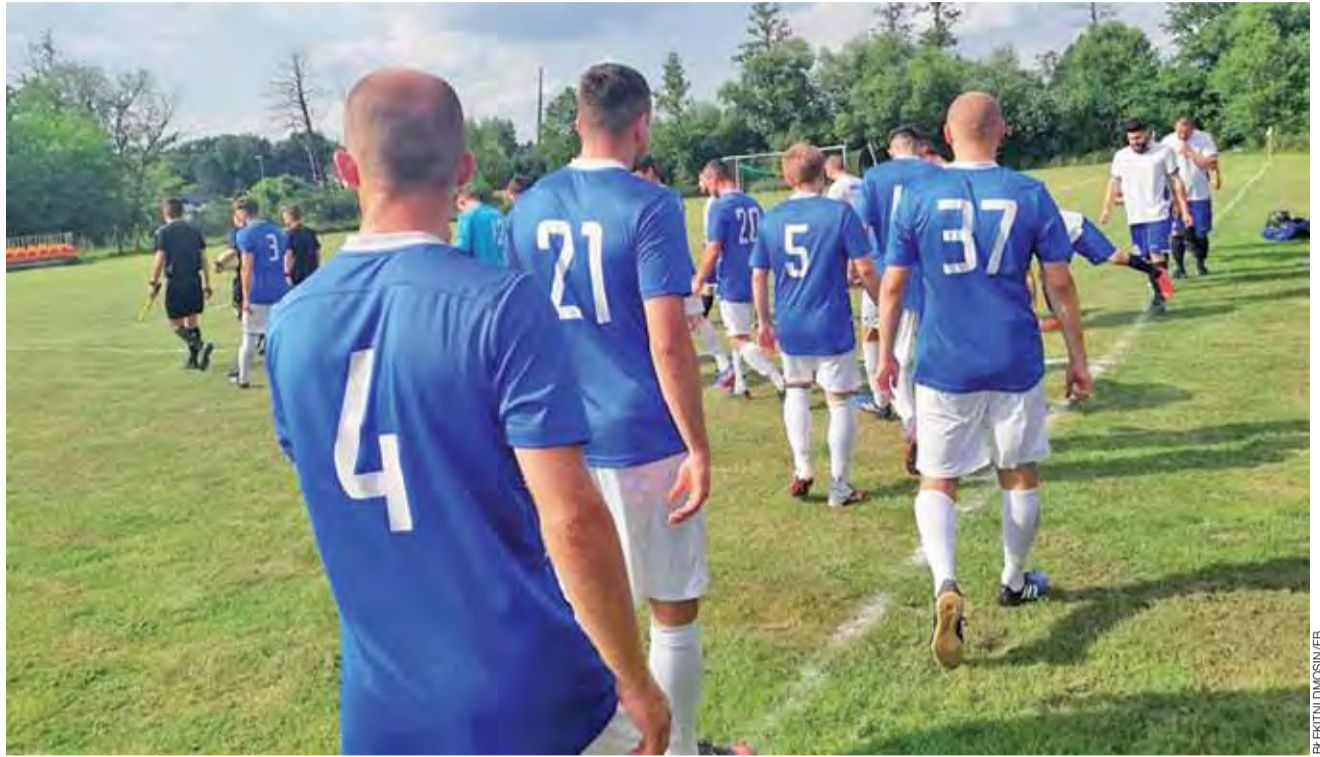
Piłkarze Sokola Popów (niebieskie koszulki) na boisku w Swędowie zakończyli udane rozgrywki 2017/2018 w A-klasie.

■ 26. kolejka: Pogoń Rogów – LKS Kalonka 5:0, Boruta II Zgierz – Sport Perfect 0:1, LKS Gałkówka – KKS Koluski 0:6, Różycza – LZS Justynów 0:1, Zamek Skotniki – Start Brzeziny 0:3, Czarni Smardzew – Włókniarz Zgierz 1:6, Huragan Swędów – Błękitni Dmosin 2:11.