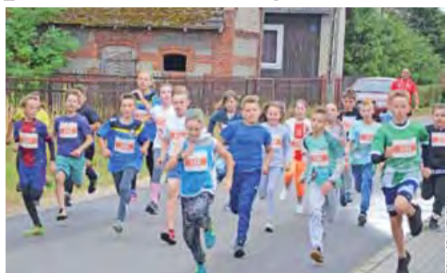
Bieg główny cieszył się najlepszą obsadą, ale wcześniej równie emocjonująca była rywalizacja w młodszych kategoriach wiekowych (na krótszych dystansach).