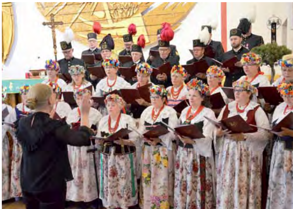
Występ chóru „Jutrzenka”. Ci, którzy mieli szczęście być na mszy świętej i nabożeństwie w Boczach Chełmońskich, muszą przyznać, że goście ze Śląska zaprezentowali śpiew na bardzo wysokim poziomie.

Warto dodać, że chór z Nakła Śląskiego działa od 1911 roku i wielokrotnie koncertował w kraju i za granicą. tm