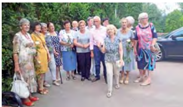
Uczestnicy spotkania koleżeńkiego zorganizowanego w 50. rocznicę zdania matury w Technikum Ochrony Roślin w Zduńskiej Dąbrowie.

uczczono chwilą ciszy. 5-osobowa delegacja uczestników spotkania udała się na cmentarz w Zduńkach, aby złożyć kwiaty.