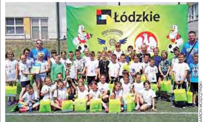
Uczniowie SP 1 Głowno z brązowymi medalami w województwie.