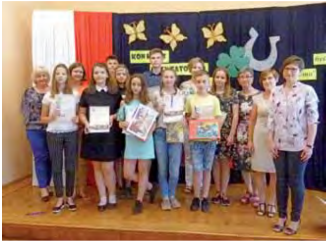
Laureaci i wyróżnieni. Pamiątkowe zdjęcie z organizatorami na zakończenie konkursu recytatorskiego poezji rosyjskiej w ZS nr 1.