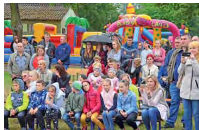
Szkolna i lokalna społeczność z zainteresowaniem obserwuje występy uczniów szkoły w Sobocie.

Ostatnim punktem programu była potańcówka w świetle gwiazd z muzyką DJ Jey Jay. tm