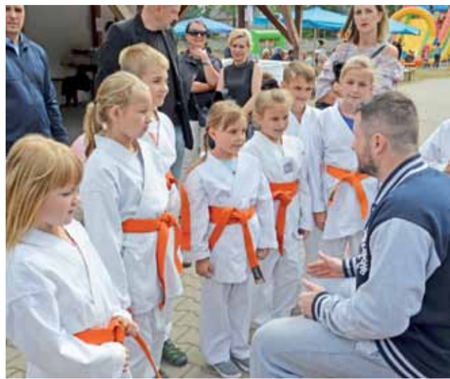
Grupa młodych adeptów karate przygotowuje się do pokazu.