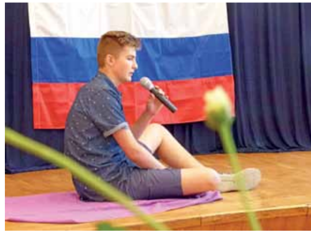
Jak na pikniku. Na zdjęciu laureat konkursu w kat. gimnazjalnej podczas prezentacji wybranego przez siebie wiersza o lecie.

Po wysłuchaniu wszystkich wyrecytowanych wierszy komisja udała się na obrady, po których ogłoszono wyniki. Oceniano m.in. pamięciowe opanowanie tekstu, dykcję i poprawność wymowy rosyjskich słów, jak i zdolność skupienia uwagi publicz-