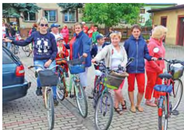
Uczestnicy rajdu przed startem z placu przy urzędzie gminy.