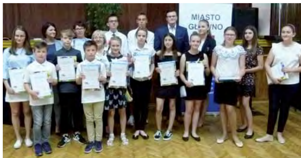
Oto najlepsi pod względem uzyskanej średniej ocen uczniowie minionego roku szkolnego w Głownie.