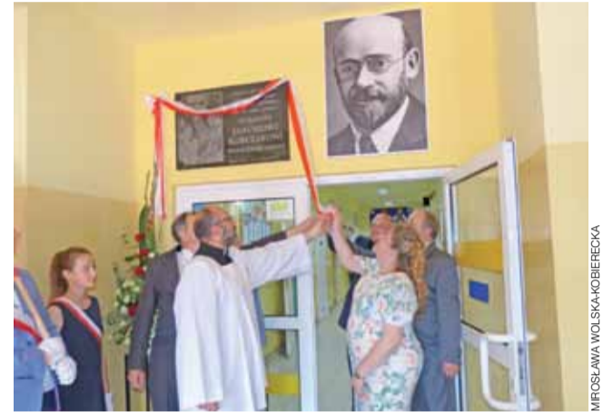
Odsłonięcie tablicy poświęconej patronowi – Januszowi Korczakowi.