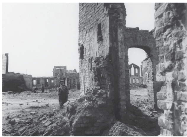
Kurów, 19 kwietnia 1940. Miasto zniszczone bombardowaniami.