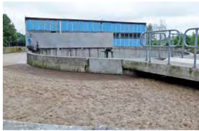
Projektowa przepustowość strykowskiej oczyszczalni ścieków, czyli 1700 m sześciennych na dobę, jest już w tej chwili w pełni wykorzystywana. Na zdjęciu jeden z biobloków z osadnikiem wtórnym.