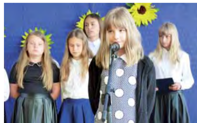
Podczas zakończenia roku szkolnego uczniowie zaprezentowali program artystyczny pod hasłem „Witajcie wakacje”.

Przekonuje jednak, że najwięcej pracy było po skończonych zajęciach, kiedy trzeba było wszystko posprzątać na następny dzień.