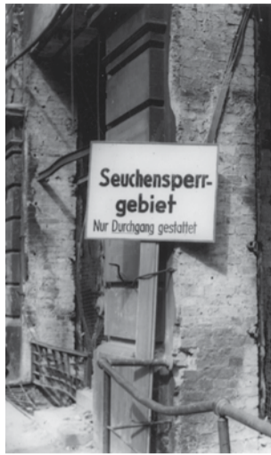
Warszawa, 4 kwietnia 1940. Tablica z napisem „Obszar zagrożony tyfusem. Dozwolony tylko przejazd” umieszczona na terenie, który miał znaleźć się w granicach getta.