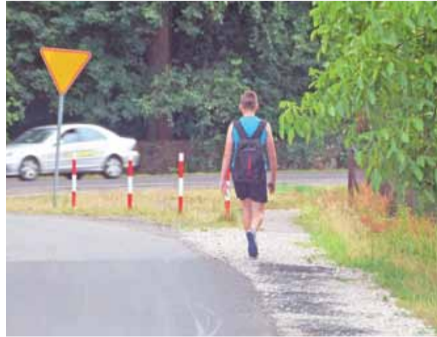
W Bratoszewicach nadal brakuje fragmentu chodnika łączącego ul. Kolejową z trasą krajową nr 14.

Komentując to radny Witold Kosmowski powiedział m.in., że