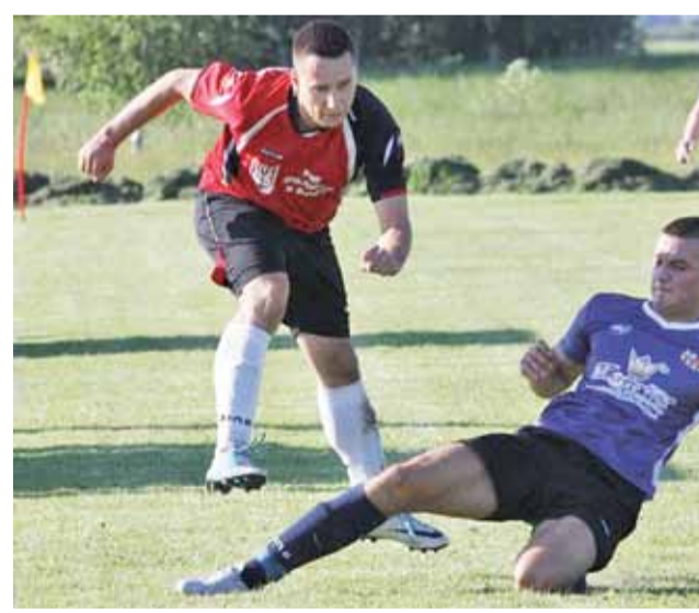
Drużyna Sokoła Popów (czerwone koszulki) buduje swoją przyszłość na obecnym sezonie, w którym pobiła kilka klubowych rekordów.

■ 22. kolejka B-klasy, gr. III: Sazan Pęczniew - Błękitni Ciosny 3:0, Struga Dobieszeków - GKS Byszew 4:4, LKS Gieczno - OSP Iskra Głowno 1:5, Sokół Popów - KS Żychlin 3:0, Olimpia Oporów - Iskra Góra Św. Małgorzaty 3:0, Expom Krośniewianka - KP Byszew 0:3.