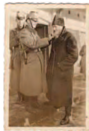
Zawiercie, listopad 1941 – sierpień 1943. Funkcjonariusz Schutzpolizei obcinający Żydowi brodę.

■ 14 czerwca 1940 – do niemieckiego obozu koncentracyjnego Auschwitz w Oświęcimiu dociera pierwszy masowy transport: ponad 700 polskich więźniów politycznych z więzienia w Tarnowie. Później w pobliżu powstaje drugi obóz – we wsi Brzezinka (Birkenau). Łącznie w Auschwitz-Birkenau Niemcy zamordowali ponad milion Żydów (oraz tysią-