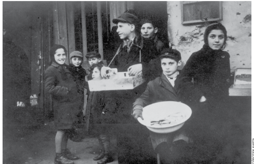
Warszawa, 1941. Dzieci handlujące w getcie.

Historia i Teraźniejszość | Czego nas uczy ostatnie 100 lat