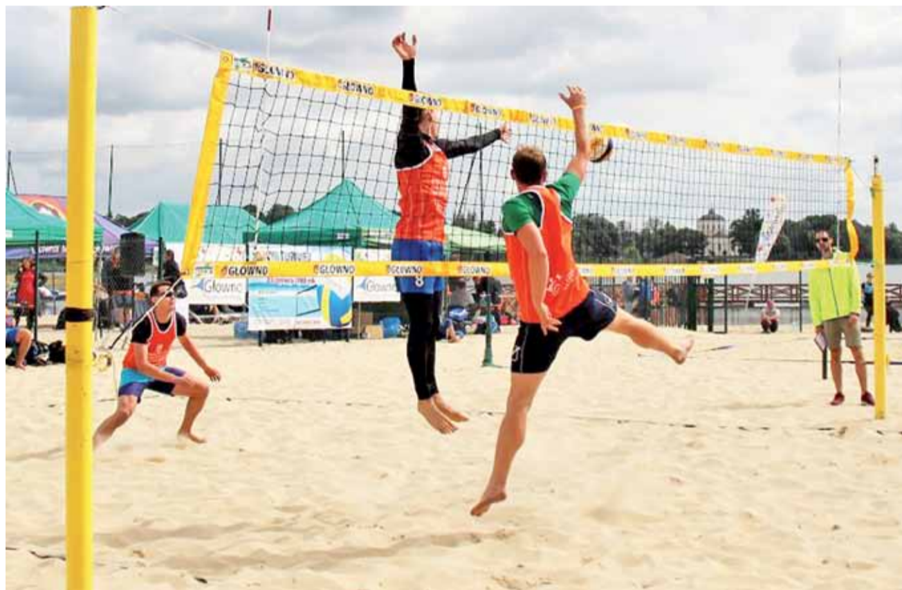
Rozgrywki siatkówki plażowej nad Zalewem Mroźyczka w Głownie od kilku lat cieszą się popularnością.