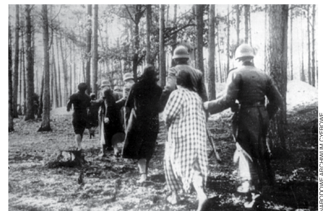
Okolice Palmir, 1940-1941. Grupa Polaków prowadzona przez niemieckich policjantów na rozstrzelanie.