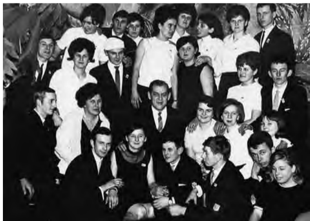
Pamiątkowe zdjęcie absolwentów z 1968 roku – to właśnie ono zostało przekazane dyrektorowi.

Dyrektor Kosmowski przedstawił gościom bogatą historię szkoły, życiorysy założycieli i patronki. Przedstawił też zmiany, jakie zaszły w placówce i na terenie jej gospodarstwa w ostatnich latach. Absolwenci zwiędli cały teren szkoły, aby zobaczyć to naocznie. Nie zapomniano o zmarłych 9 osobach z tej klasy. Ich pamięć