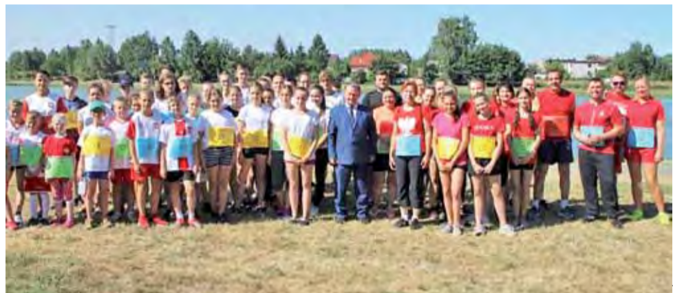
Uczestnicy Biegu dla Niepodległej stworzyli piękny biało-czerwony dywan wokół strykowskiego zalewu.