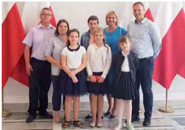
Laureaci etapu okręgowego konkursu o bezpieczeństwie pożarowym w budynku Senatu.

Na zaproszenie parlamentarzysty w warszawskim finale udział wzięło czterech laureatów etapu okręgowego, w tym okręgu, który obejmuje nasze tereny. Byli to uczniowie z Topoli Królewskiej, Góry Świętej Małgorzaty