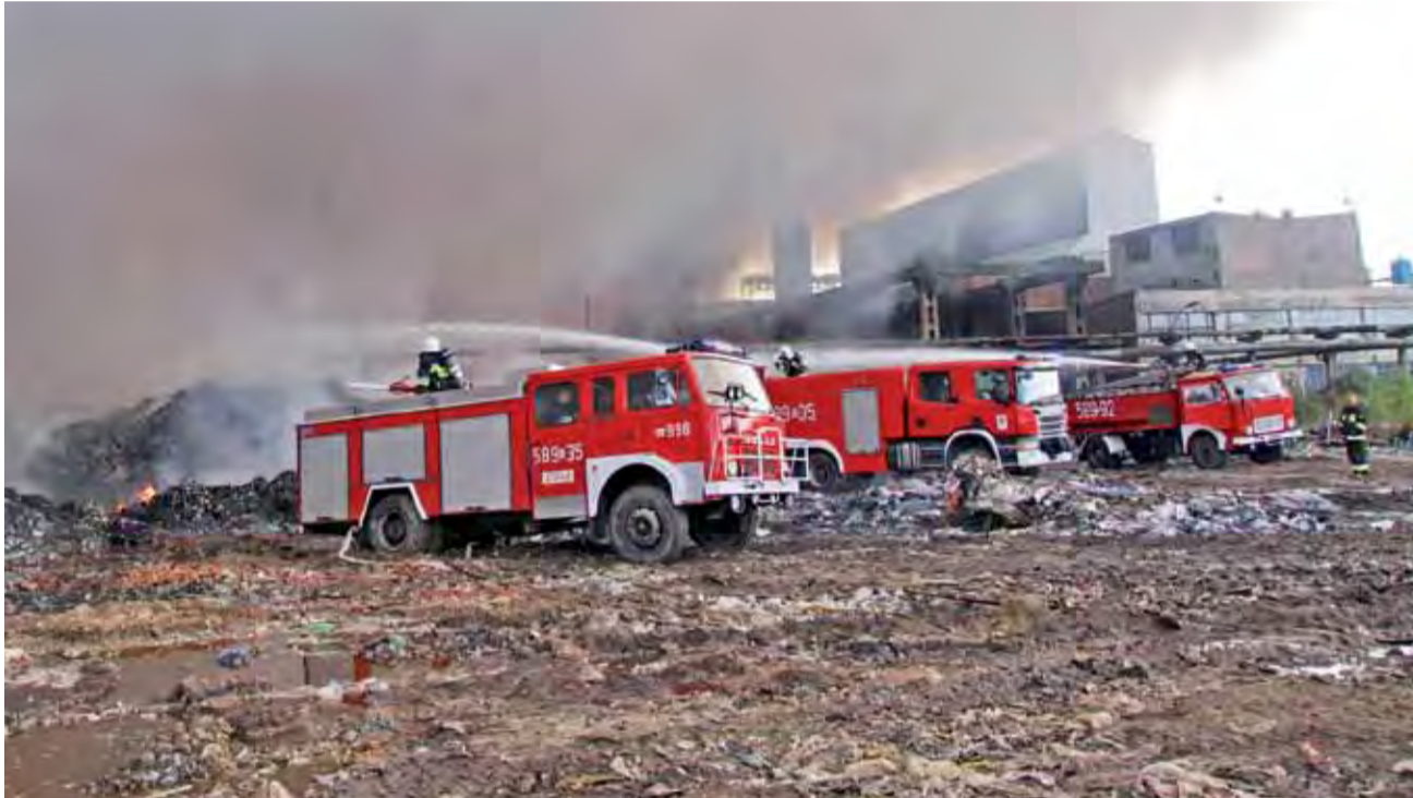
Pożar składowiska odpadów na terenie Boruty wybuchł 25 maja i był gaszony przez kilka dni.

Wnioskując po kolei punktują to, co uważają za zaniedbania starosty. W sumie opozycja wymienia siedem zarzutów, z których na pierwszym miejscu jest wydanie decyzji na zbiór odpadów na terenie Boruty bez konsultacji z radnymi czy mieszkańcami oraz brak nadzoru i kontroli nad przestrze-