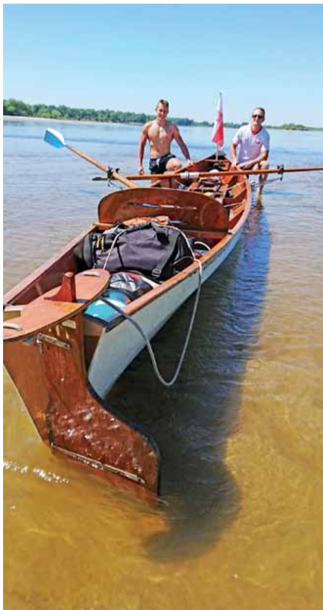
Członkowie Łowickiej Akademii Sportu przygotowują się do wyprawy na Bornholm, ćwicząc na Wiśle.

Warto podkreślić, że śmiałkowie przygotowują się do tej przygody od wielu miesięcy. Udział w wydarzeniu zaplanowali już w zeszłym roku, regularnie uczestnicząc w treningach, by zachować kondycję, a od stycznia ćwiczenia te zintensyfikowali. Gdy tylko minęły przymrozki, zdecydowali się płynąć po Wiśle, by do zmierzania się w trudnych warunkach przygotować zarówno mięśnie, jak i umysł. Obecnie raz w tygodniu starają się wziąć udział w wymagającym 15-godzinnym wiosłowaniu po Wiśle. Regularnie ćwiczą również na urządzeniach stacjonarnych. Jak przekonują, pasja wodna wymaga wielu poświęceń zarówno przed, jak i podczas wyprawy.