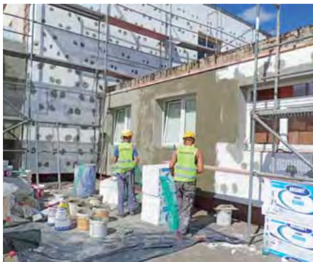
Roboty, które rozpoczęły się jeszcze przed wakacjami, najpierw objęły część szkoły znajdującą się od strony boiska.

stać zmodernizowane do 2020 roku. Całość oszacowano na ponad 7,4 mln zł, z czego dotacja pokrywa blisko 85%. W ubiegłym roku skorzystały na tym: Szkoła Podstawowa nr 1 w Strykowie, Szkoła Podstawowa nr 1 w Niesułkowie oraz OSP Kielmina. Dotacja pokryła również część kosztów wykonanej wcześniej termomodernizacji świetlicy wiejskiej w Ossem. W tym roku inwestycje objęły również: OSP Stryków, świetlicę w Bratoszewicach oraz SP w Dobrej. Na liście są jeszcze: ZS nr 1 w Strykowie oraz Urząd Miejski w Strykowie.