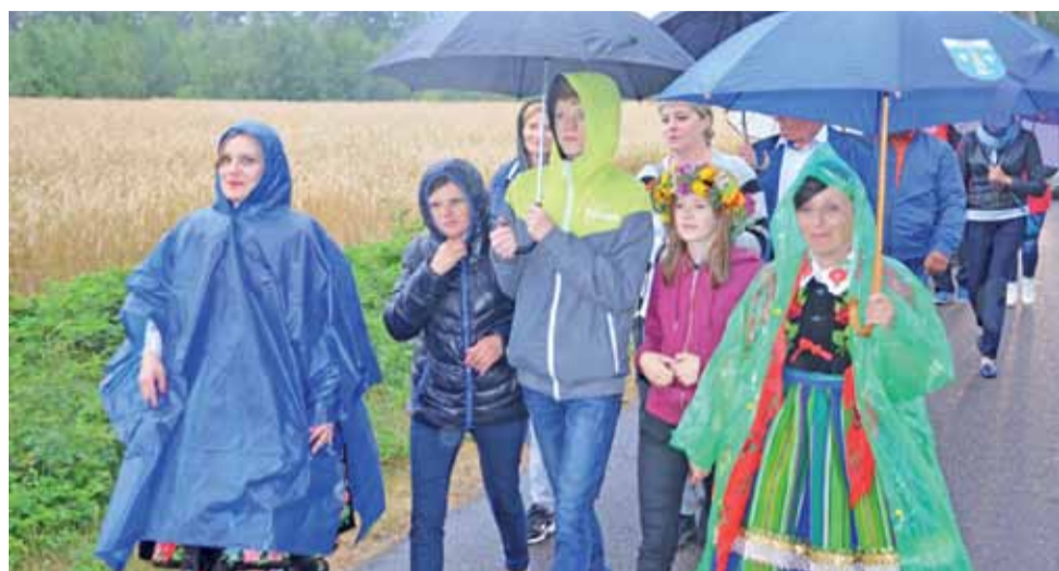
Ludowe stroje, wszechobecne kwiaty i do tego jeszcze kolorowe parasole – choć pod szarym (a później czarnym) niebem, impreza była bardzo kolorowa.

Czasu na śpiew i tańce było dużo po powrocie na teren świetlicy. Zorganizowano na przykład konkursy tańca i śpiewu, w których dominowały piosenki ludo-