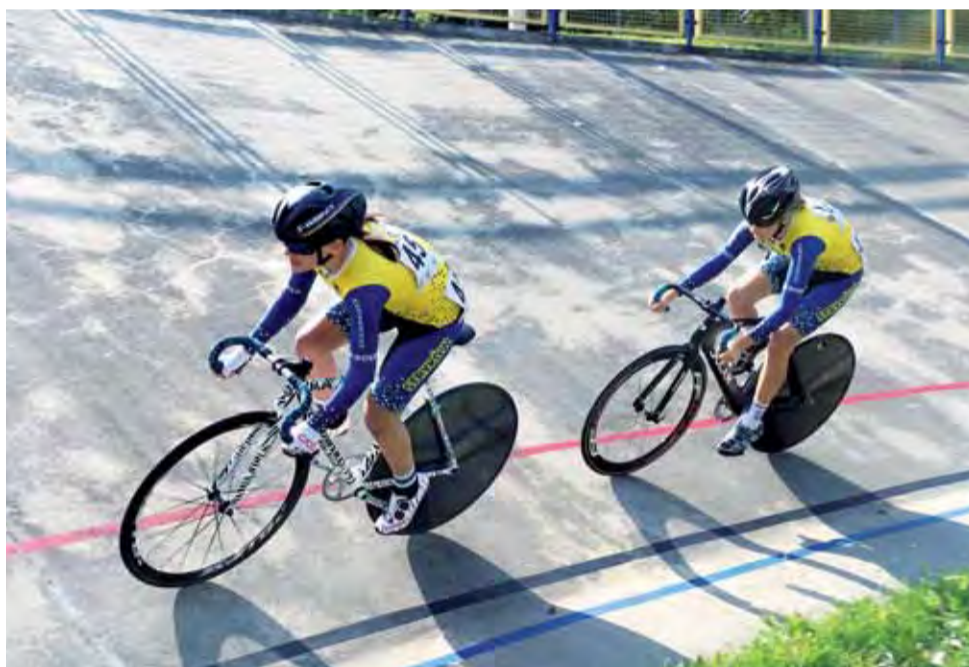
Świetna jazda zawodniczek LUKS Dwójki Daniello Sportswear Stryków podczas torowych Mistrzostw Makroregionu została nagrodzona zwycięstwem w klasyfikacji klubowej.

ledwie sekundę z GK Gliwice i 5 sekund z KS Społem Ulisse Central Łódź.