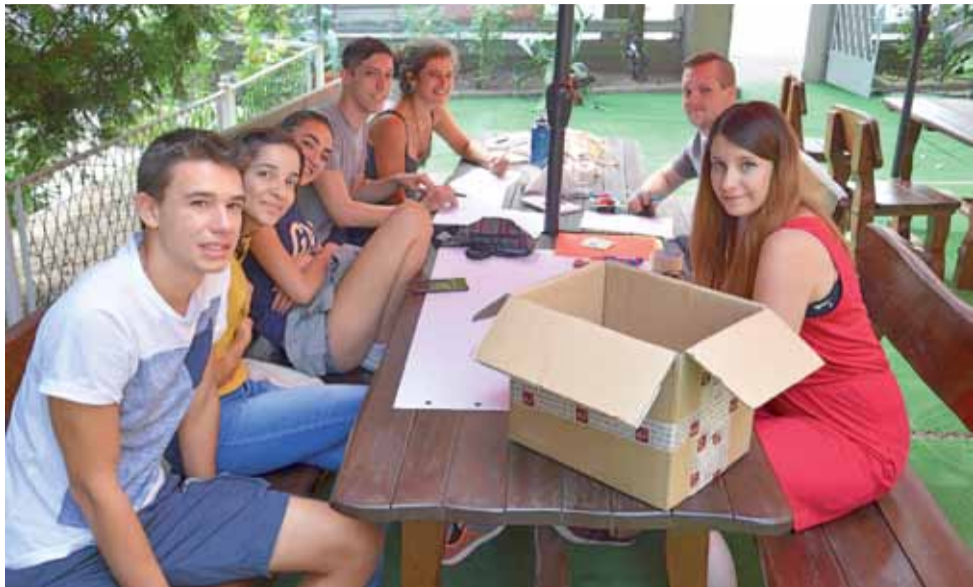
Część uczestników projektu w ogródku przy restauracji i hotelu „Polonia”.