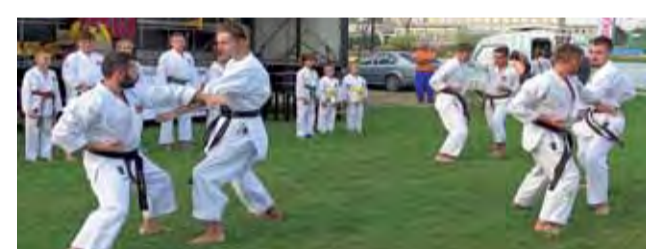
Pokaz utwardzania rąk w wykonaniu karateków Strykowa.

2018, w której czeka nas jeszcze sporo ważnych imprez. Najstarsi w kategorii junior młodszy i junior rywalizować będą podczas Mistrzostw Polski LZS i Konkurencji Neolimpijskich na torze, młodzików czeka jeszcze Puchar Nadziei Olimpijskich na torze i Międzywojewódzkie Mistrzostwa Makroregionu w konkurencjach czasowych na szosie w Bratoszewicach. Najmłodszy natomiast rywalizować będą w Mistrzostwach Polski Szkółek Kolarskich MTB w Głogowie i na torze w Pruszkowie. wp