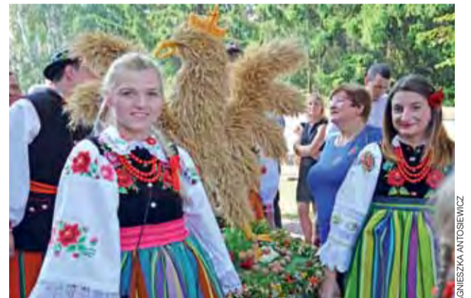
Wieniec dożynekowy miał kształt orła w koronie, który stanowił nawiązanie do obchodzonego w tym roku 100-lecia odzyskania

też wieniec dożynekowy w kształcie orła w koronie, który stanowił nawiązanie do obchodzonego