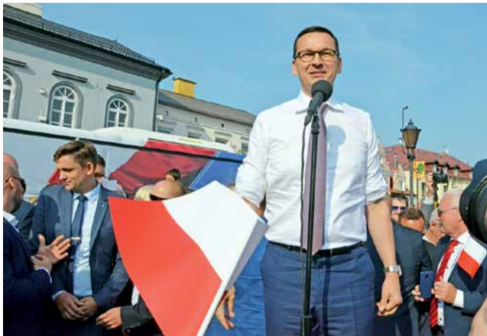
Mateusz Morawiecki przedstawił na spotkaniu w Łowiczu program PiS na jesienne wybory samorządowe.

Ponadto Marcin Kosiorek tłumaczy, że cała trasa tzw. „PiS-busa”, który w ramach kampanii przed jesiennymi wyborami