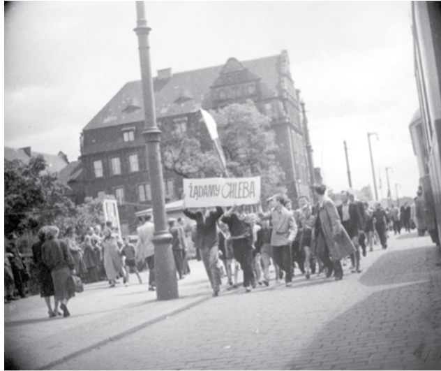
Protestujący robotnicy z transparentem: „Żądamy chleba”. Fotografie wykonane przez funkcjonariuszy UB w celu identyfikacji manifestantów (28.06.1956 Poznań).