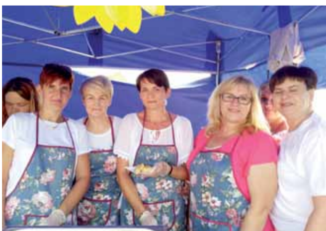
Gospodynie z KGW w Łyszkowicach jak co roku raczyły uczestników dożynek przysmakami.

Zgromadzeni na placu rolnicy tego dnia bawili się radośnie, choć w ich pamięci wciąż królował obraz tegorocznych plonów.