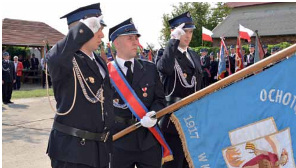
Podczas jubileuszu nastąpiło odznaczenie sztandaru jednostki Złotym Znakiem Związku Ochotniczych Straży Pożarnych Rzeczypospolitej Polskiej.

Każdy z odnalezionych grobów strażaków został przed 100-leciem jednostki udekorowany szarfą.