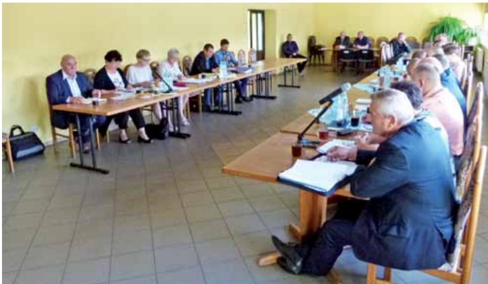
Sesja 29 sierpnia. Rada Gminy Głowno obradowała w Bronisławowie, gdzie jest dość miejsca także dla sołtysów i publiczności. Niestety – ci nie otrzymali zaproszeń.