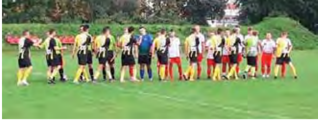
Powstaniec Dobra (żółto-czarne stroje) rozpoczął od porażki.