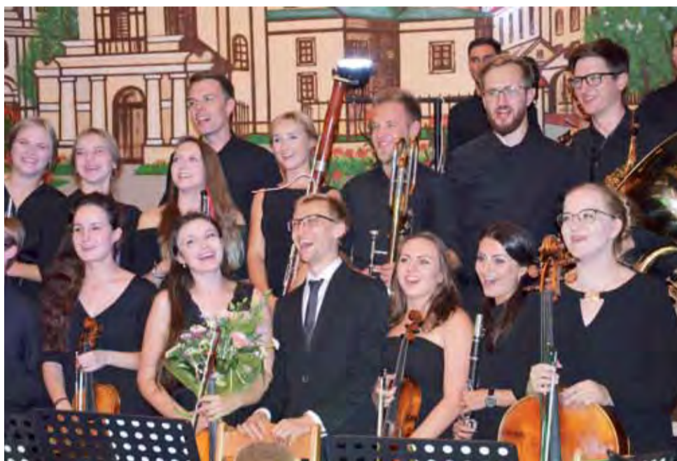
To był udany koncert, podobnie jak wszystkie poprzednie. Orkiestra „Sonus” w dobrych humorach pozuje do pamiątkowych zdjęć.

numerze Nowego Łowiczanie. Są one natury finansowej: orkiestra potrzebuje w skali roku ok. 60-80 tys. zł, by regularnie, np. 3 razy w roku koncertować i spotykać się na próbach.