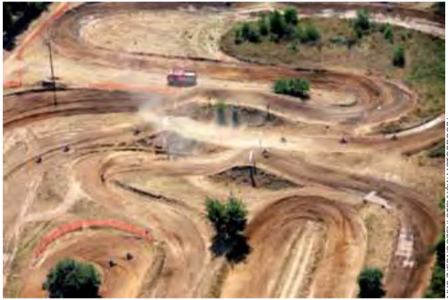
Tor motocrossowy w Strykowie wkrótce stanie się areną biegów.

Już tylko kilka dni pozostało do pierwszego w historii Strykowskiego Biegu Extreme. Impreza będzie o tyle wyjątkowo, że odbędzie się na torze motocrossowym im. Kazimierza Witczaka w Strykowie.