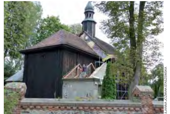
Na zdjęciu widać już część wymienionego gontu oraz prace prowadzone na jednej z krucht zewnętrznych.

XIX w. dobudowano sygnaturkę i kruchtę zewnętrzne. Kolejnym etapem rozbudowy był chór, który powstał już w XX w. Ostatnie prace remontowe parafia prowadziła we własnym zakresie ok. 30-