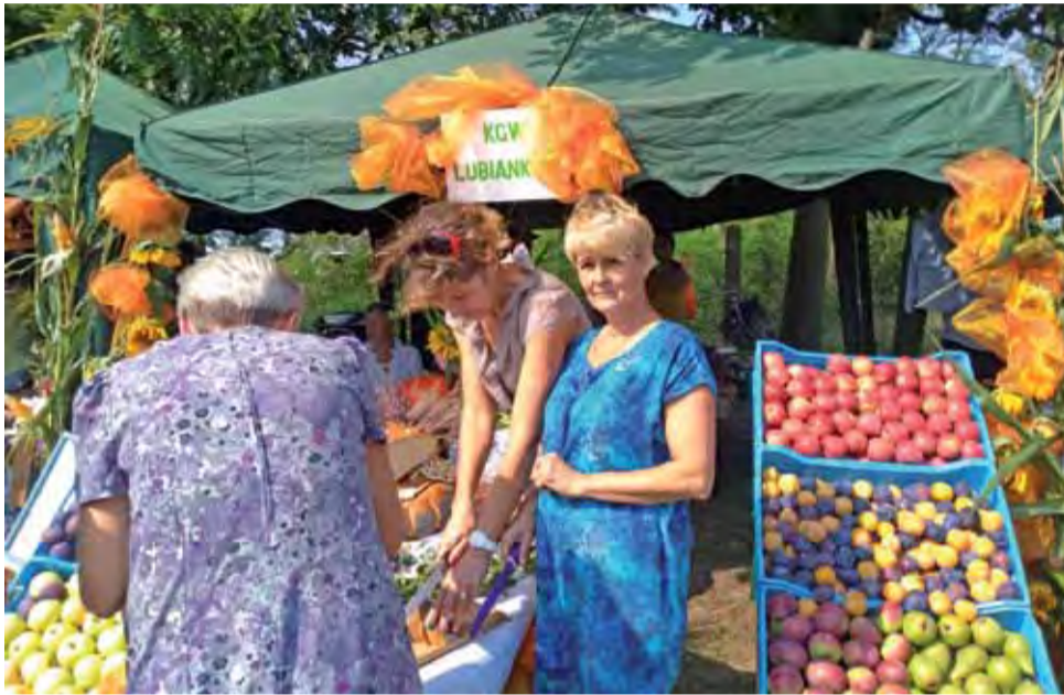
KGW Lubianków proponowało podczas dożynek świeże owoce, z których słynie ten region.