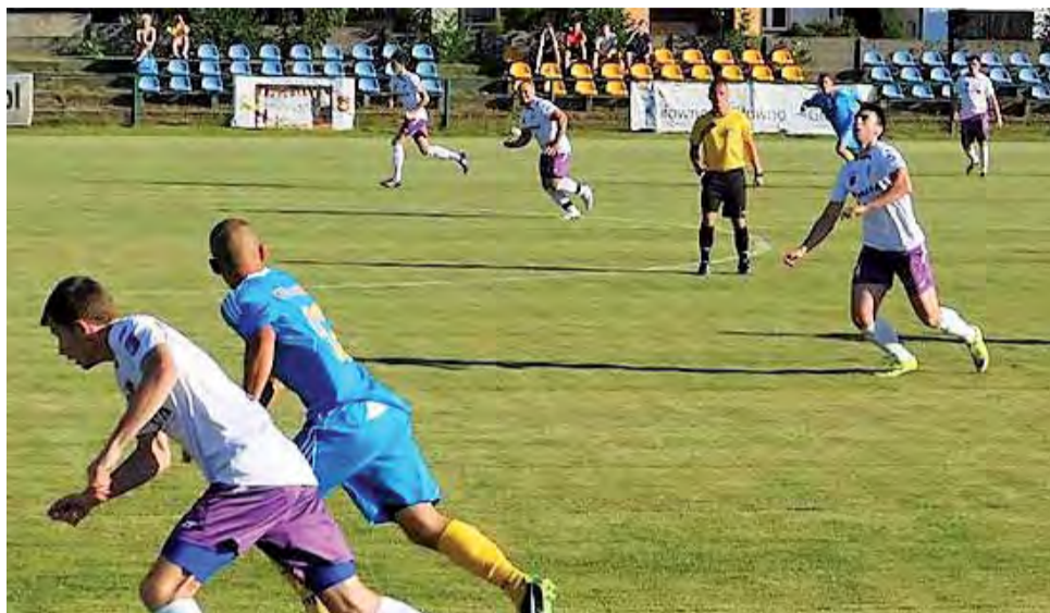
Piłkarze Stali Głowno (niebieskie koszulki) pewnie pokonali PTC Pabianice, rozgrywając swoje pierwsze spotkanie na stadionie przy ul. Kopernika 37.

Po przerwie głównianie podkręcili tempo i przez cały czas dominowali, zdobywając jeszcze trzy bramki.