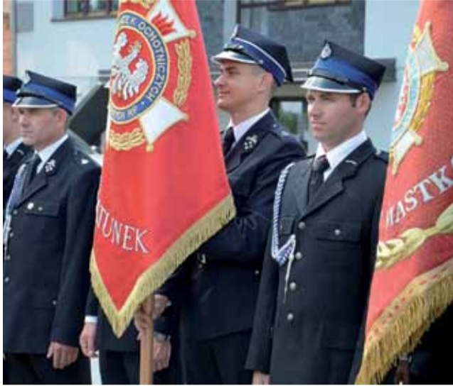
Podczas jubileuszu 90-lecia OSP Przemysłów licznie obecne były poczyty sztandarowe.

Od założenia siedziba jednostki OSP znajdowała się na terenie wsi Przemysłów. Początki jej budowy datowane są na jesień 1928 roku. Natomiast już rok później, w czerwcu, odbyło się uroczyste poświęcenie remizy i sprzętu pożarniczego, m.in. sikawki, wozu konnego czterokołowego i bosaków. – Przez pierwsze lata swojej działalności członkowie OSP gromadzili niezbędny sprzęt do ratowania mienia i życia – przy-