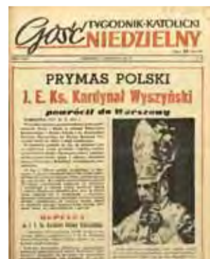
Pierwsze strony gazet w okresie „odwilży”.