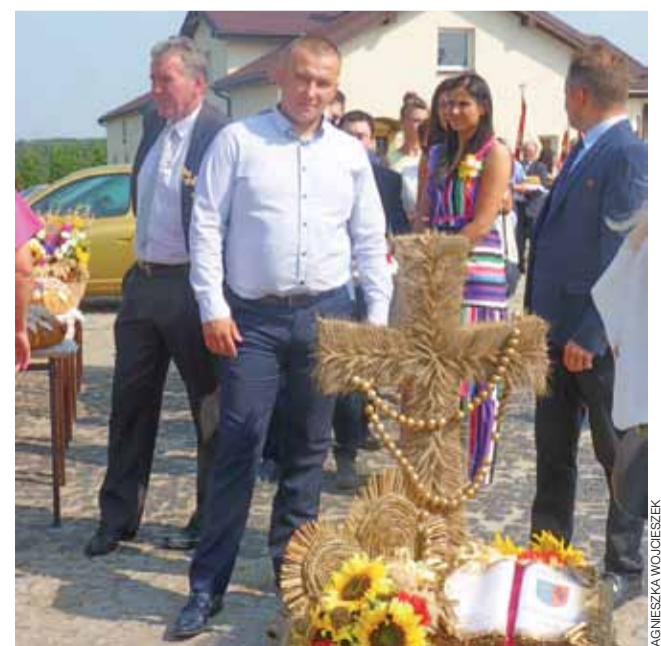
Uczestnicy tradycyjnego korowodu dożynkowego.

– Dożynki mamy w tym roku piękne. Choć plonom susza nie sprzyja, słońce cieszy w czasie zabawy. To święto wszystkich rolników, dlatego chcemy się dziś zjednoczyć i wspólnie świętować – zauważył mieszkaniec Dmosina w rozmowie z naszym reporterem. aw