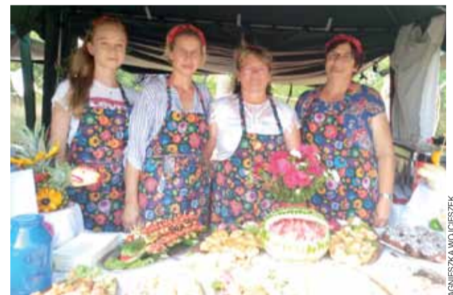
Stoisko gospodyń z KGW we Władysławie Popowskim cieszyło się dużym zainteresowaniem wśród uczestników dożynek.