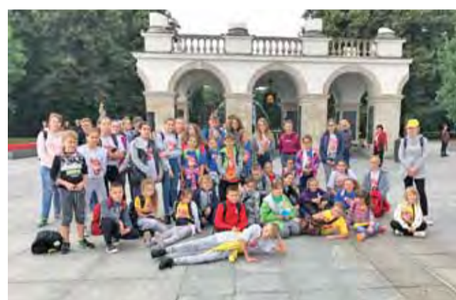
Ostatni turnus zwiedza Warszawę z muszkietierami. Na zdjęciu – przy Grobie Nieznanego Żołnierza.

Uczestnicy, pochodzący z różnych stron Polski, to dzieci z rodzin niezamożnych lub z domów dziecka. Zostali podzieleni na 8 turnusów. Dwójka z Łowicza wyjechała 26 sierpnia, a wróciła 1 września – był to ostatni turnus w tym roku. Dzieci przebywały w ośrodku wypoczynkowym w Julinku w sercu Puszczy Kampinowskiej, a jednym z punktów programu było też zwiedzanie Warszawy, w tym m.in. Centrum Nauki Kopernik, Stadionu Narodowego, Pała-