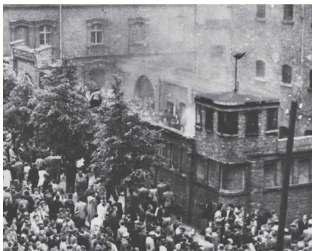
Manifestanci opanowują centralne więzienie przy ulicy Młyńskiej, godz. 9.30-11.00 (28.06.1956 r., Poznań)

Podobnie jak w latach poprzednich, będzie możliwość ostemplowania swoich książek okolicznościową pieczęcią. mwk