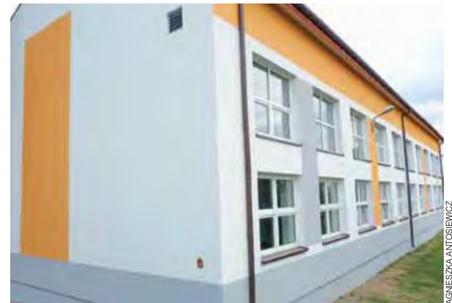
Sala gimnastyczna w Szkole Podstawowej w Łącuszewie zyskała nową elewację.

Wójt Agnieszka Wojda powiedziała nam, że prace były