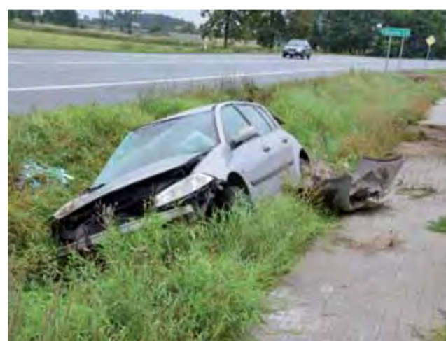
Samochód po wypadku – wyglądało bardzo poważnie.

Subaru kierował obywatel Litwy, który przed przybyciem służb samodzielnie opuścił pojazd, nie doznając obrażeń ciała. Gdy strażacy w sile dwóch zastępów dojechali na miejsce, Subaru płonęło już całe. Wartość strat oszacowano na 20 tys. zł w aucie i 1000 zł w infrastrukturze (uszkodzone bariery). ewr