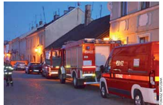
Cała Bielawska była przez kilka godzin wyłączona z ruchu, policja nie wpuszczała pojazdów, jak i pieszych.

W takich przypadkach – przypomina – potencjalna ofiara odbiera telefon, z którego wynika, że musi przygotować jakąś sumę pieniędzy i przekazać osobie, która ją odwiedzi w domu – by pomóc rzekomemu krewnemu w tarapatkach lub przeprowadzić prowokację policyjną. To wszystko są fałszywe historie, uwiarygadniane przez oszustów bardzo pomysłowo – dlatego należy zawsze mieć się na baczności, gdy ktokolwiek prosi nas o jakiegokolwiek pieniądze. Prawdziwe służby nie działają w ten sposób! ewr