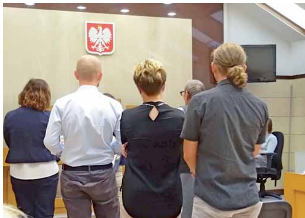
Pracownicy banków i instytucji specjalizujących się w udzielaniu pożyczek, w których oszuści zaciągali zobowiązania i otwierali konta, zostali przesłuchani przed sądem.

W tym systemie za potwierdzenie tożsamości klienta odpo-