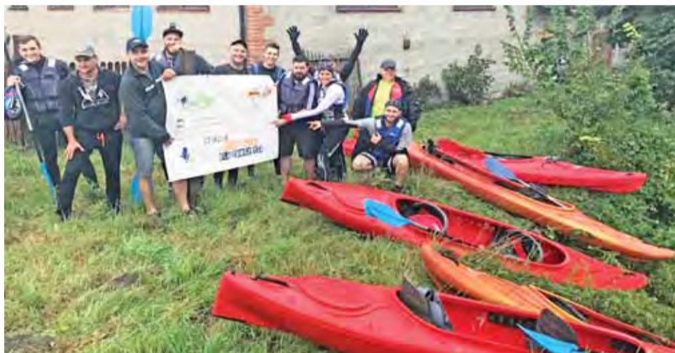
Uczestnicy III Mroga Extreme przed startem bardzo entuzjastycznie podchodzili do udziału w spływie.

Wszyscy uczestnicy otrzymali pamiątkowe certyfikaty ukończenia spływu oraz mieli zapewnioną gorącą zupę i herbatę, ponieważ pogoda tego dnia nie rozpieszczała. Celem imprezy było zapewnienie uczestnikom sprawdzenia się w ekstremalnych warunkach wśród dziewiczej przyrody przez rezerwat, w którym do pokonania było w zależności od stopnia trudności kilkanaście-kilkadziesiąt spiętrzeń wody, omijanie siedzib bobrów czy niezliczonej ilości powalonych pni drzew. Organizatorem III Mroga Extreme był Yacht Club Głowno, Aglomeracja Łódzka oraz Hufiec ZHP Głowno, który w tym roku obchodzi 100-lecie istnienia. wp