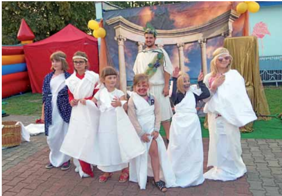
Jak modelki. Uczestniczki konkursu na projektowanie antycznych tunik. Kreacje powstały bez szycia, tylko przez drapowanie i wiązanie tkaniny.

Dzieci w towarzystwie animatorów ubranych w stroje mitologicznych bóstw (m.in. Zeusa i Hery) poprzez zabawę chłonęły wiedzę o antyku. Z kolorowego papieru wykładały mozaiki i zdobiły farbami butelki stylizowane na starożytne wazy, fotografowały się na tronie Zeusa i na tle panoramy Akropolu. Odwołaniem do współczesności był konkurs na skomponowanie z przygotowanych wcześniej składników sałatki greckiej, najbliższej oryginalnej. Większość drużyn poradziła so-