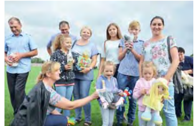
W turnieju wsi można było wygrać różne nagrody, np. gołębia, geś, maskotki i inne.

Wyegrany został też turniej wsi. Uczestników było mniej niż to bywało w minionych latach,