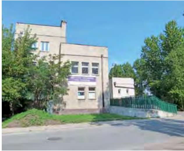
Budynek przychodni POZ i specjalistycznej. Grupa Zdrowie ma w planach otwarcie w Głownie poradni kardiologicznej.

Prezes spółki Szpital Głowno Grupa Zdrowie Dariusz Wojtasik powiedział nam, że wkrótce uruchomiona zostanie nowa, klimatyzowana pracownia USG, zakupiono już nowy sprzęt na oddział chirurgiczny, planowane jest sprowadzenie do Głowna (zakup