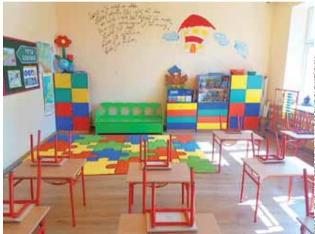
Aż miło będzie się uczyć. Odświeżona sala edukacji wczesnoszkolnej.

Jeszcze przed podpisaniem umowy z Danetpilem, skalkulowano, że koszt wybudowania zaplecza dla boiska piłkarskiego „Iskry”, obejmującego budynek z 3 szatniami, łazienkami i magazynkiem, a także 2 wiaty i demonstrowaną trybunę z 52 siedzeniami oraz wykostkowanie terenu, wyniesie około 360 tys. zł. Pierwotnie rada miała zarezerwowane na ten cel 125 tys. zł własnych środków. Umowę ostatecznie podpisało na 369 tys. zł brutto. ewr