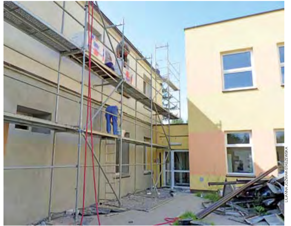
Termomodernizacja starej części szkoły. Końcowym efektem mają być nie tylko oszczędności, ale również ujednolicenie wyglądu całego obiektu.

Wszystkie meble jeszcze nie dojechały. Szkoła na realizację niektórych zamówień czeka od 2 miesięcy. Część pomocy naukowych będzie montowanych dopiero w pierwszym tygodniu powrotu uczniów do szkoły, ale jak mówi dyrektor Małgorzata Wielgus, prace będą przeprowa-