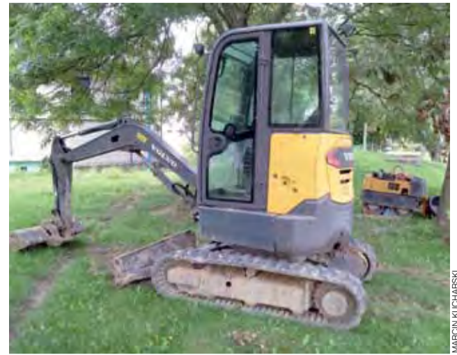
– Tak wygląda park maszynowy wykonawcy robót – żartuje pracownik oczyszczalni.

Problemy z CP2 zaczęły się zresztą zaraz po podpisaniu umowy. Spółka wystąpiła do ratusza z żądaniem udzielenia cesji, w związku z problemami finansowymi, jakie przeżywała. Było to