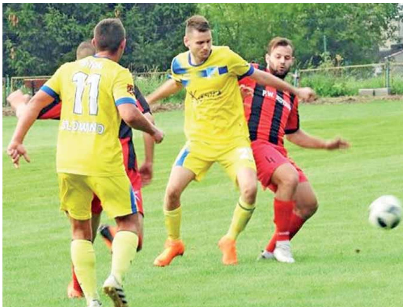
Piłkarze Stali Głowno (żółte stroje) doznali drugiej ligowej porażki. Znacznie lepszy od doświadczonych głownian okazał się beniaminek Start.

W pierwszej połowie głownianie ciągle byli w grze. Po zmianie stron wrodek z bramkami otworzył się na dobre.