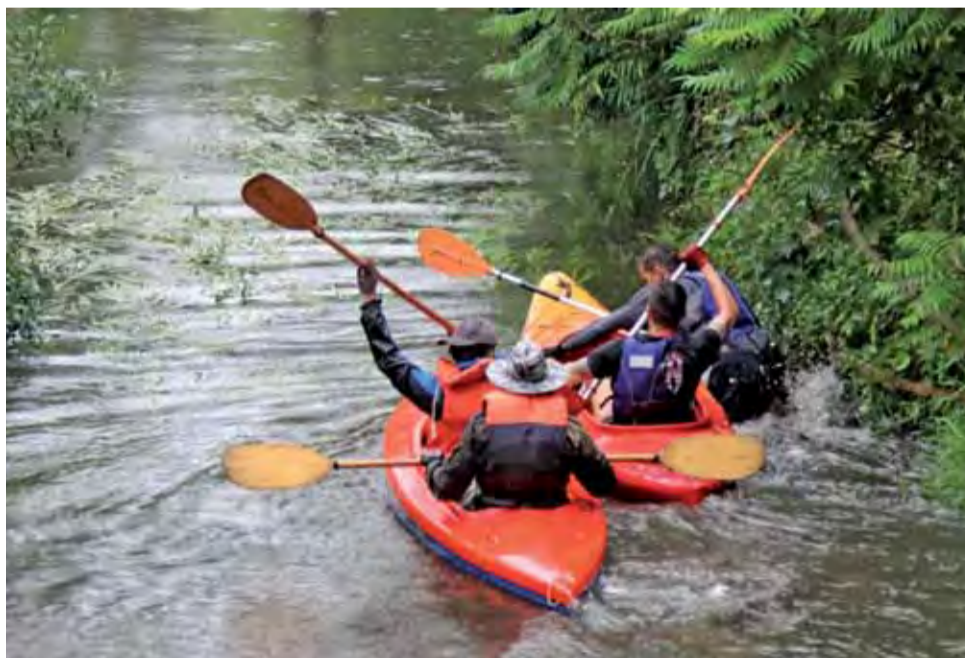
Rywalizacja na trasie z Dmosina do Głowna rzeką Mrogą od wielu lat dostarcza niezapomnianych wrażeń.

Tym razem do startu przystąpiła mniejsza niż zapowiadano liczba zawodników, których być może odstraszyły warunki pogodowe. Przy moście na Borki w gminie Dmosin pojawiło się 17 dwuosobowych załóg, które rywalizowały na ponad 5-km trasie w kierunku Głowna. Uczestnicy musieli zmierzyć się z kilkunastoma spiętrzeniami wody oraz powalonymi drzewami, tarasującymi koryto rzeki i tamami wodnymi. Przepłynięcie niektórych odcinków było niemożliwe i konieczne było często przedzieranie się kajakiem przez trawy i pora-