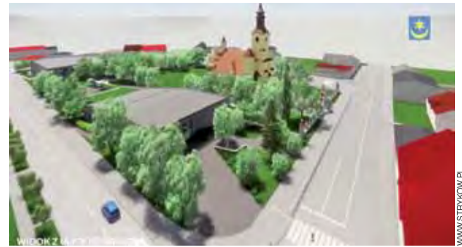
Wizualizacja Centrum Kultury w Strykowie. Widok z ulicy Kościuszki.

Urząd Marszałkowski został już poinformowany, że gmina Głowno nie skorzysta z dotacji – nie grożą jej z tego tytułu żadne konsekwencje i nie zamyka to jej drogi do ubiegania się o wsparcie z tego samego źródła w roku następnym.