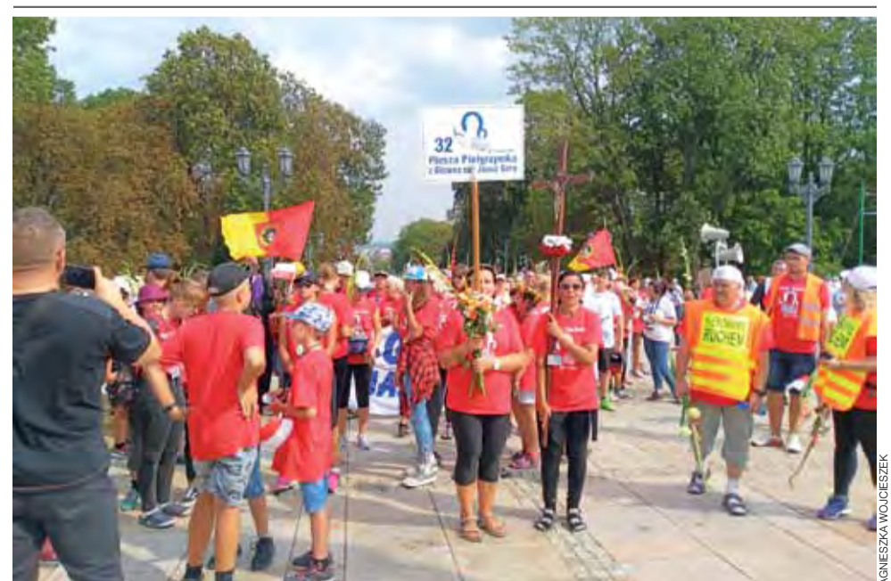
Uczestnicy 32. Pieszej Pielgrzymki z Głowna na Jasną Górę dotarli do celu w piątek, 24 sierpnia.

RZUT OKIEM | PIELGRZYMI Z GŁOWNA NA JASNEJ GÓRZE