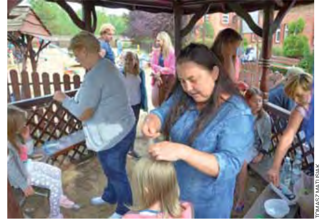
Plecenie warkoczy czy malowanie twarzy – to jedne z wielu atrakcji przygotowanych dla najmłodszych parafian.

W budynku dawnej szkoły w Stępowie zorganizowano poczęstunek. Zrobiono też oryginalną dekorację. Gości witał słomiany rolnik z żoną oraz ciągnik z przyczepą, wszystko zrobione z bel słomy różnej wielkości. dag