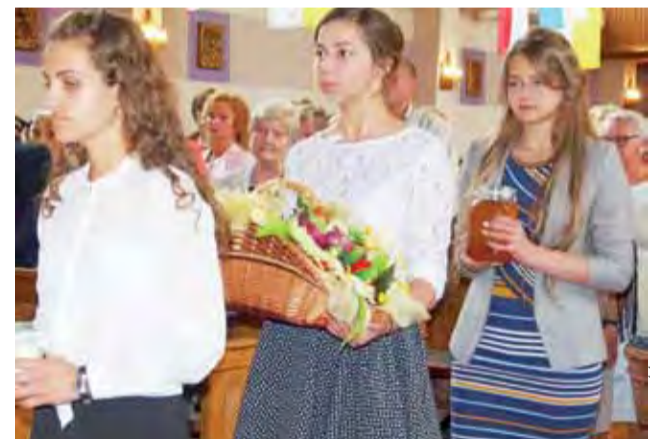
Procesja z darami ołtarza, w której licznie uczestniczyła młodzież z parafii Bobrowniki.

Tradycyjną oprawę nabożeństwa dożynkowego stanowiły wieńce przyniesione do kościoła