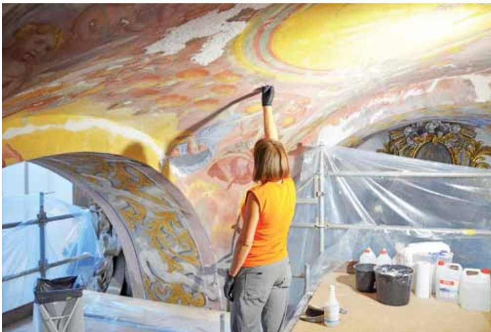
Prace konserwacyjne prowadzone są obecnie w II i III przęsle nawy zachodniej.

Na sklepieniu przęsła drugiego ukazana jest scena eschatologiczna, w przęsle trzecim natomiast, ze względu na duże ubytki i późniejsze przekształcenia, trudna do określenia scena uzdrawiania chorych. Warto zauważyć, że malowidła na ścianach zostały częściowo skute, zaś po części zamalowane w latach 30-tych XIX wieku w związku z wykuvaniem okien.