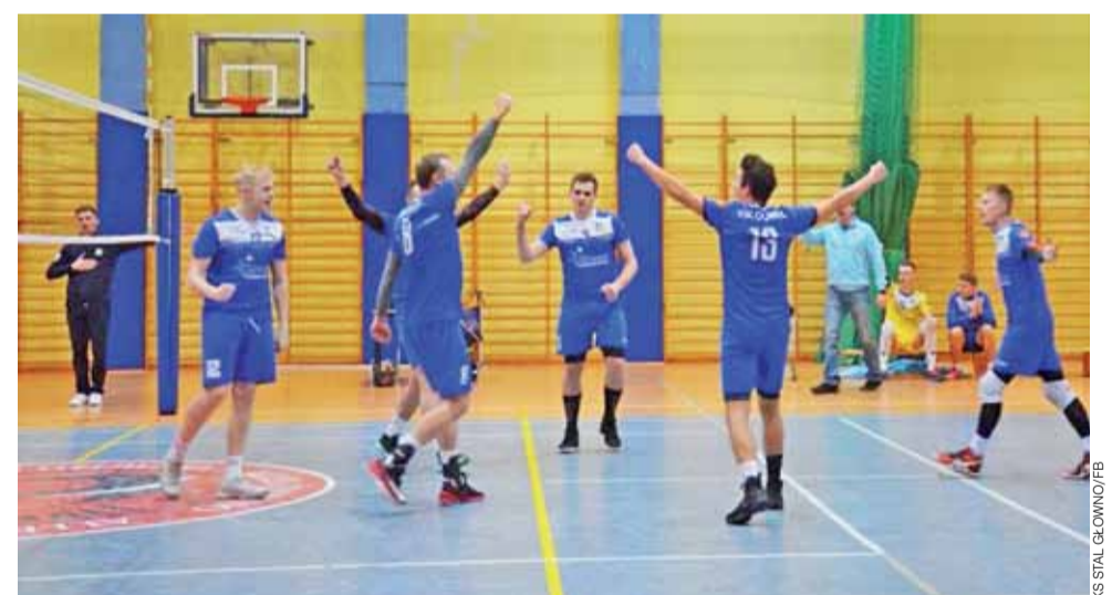
Siatkarze Stali Głowno (niebieskie stroje) zamierzają walczyć w tym sezonie o ścisłą czołówkę.

zł wpisowego. Zawody rozgrywane będą na oznakowanej trasie toru motocrossowego. Więcej informacji można uzyskać na profilu Ochotniczej Straży Pożarnej w Strykowie na Facebook'u oraz w godzinach zapisów w biurze. wp