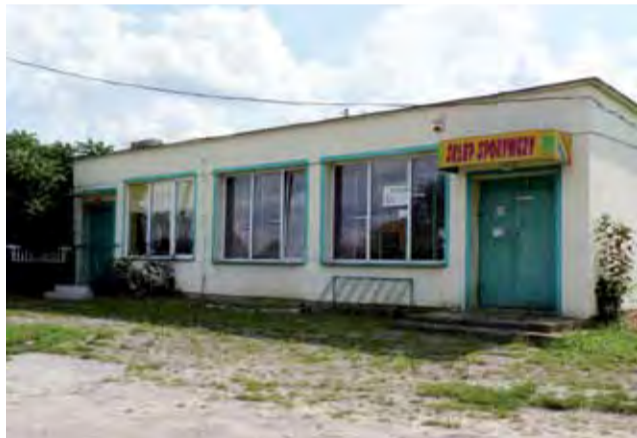
Jeden z obiektów, który zostanie przebudowany z pomocą unijnej dotacji – świetlica w Szczecinie.

W Szczecinie zaplanowana została przebudowa i rozbudowa obiektu dotychczas wykorzystywanego tylko częściowo. Obec-