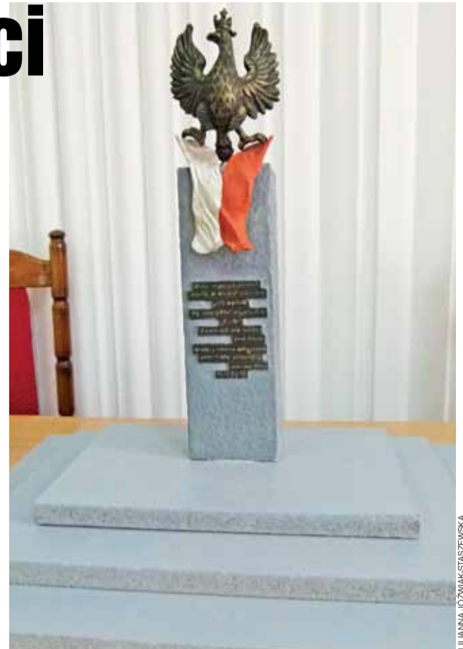
Makieta strykowski pomnika na 100-lecie odzyskania niepodległości przez Polskę.

Mimo już zaangażowanych środków, na tą chwilę wygląda na to, że pomnik stanie w przyszłości w szczerym polu. Choć projekt zamienny zagospodarowania terenu oraz pozwolenie na budowę u zbiegu Cichej i Rolni-