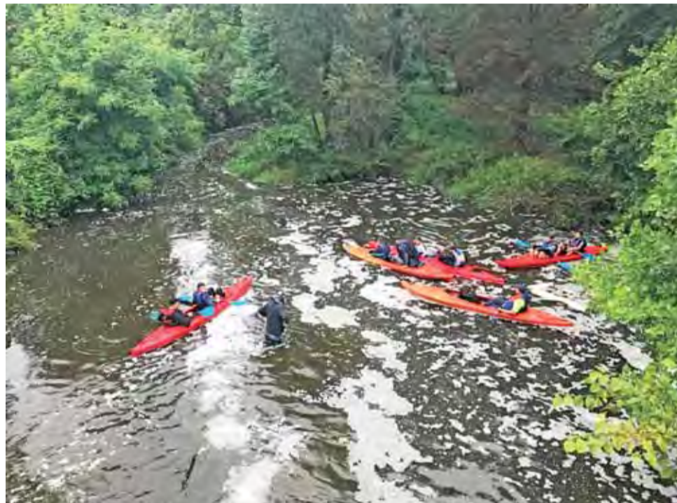
Walka z żywiołem na rzece Mrodze. Podczas tegorocznego spływu niektórzy robili to po kilkadziesiąt razy.

Najbardziej ekstremalne doznania towarzyszyły kajakarzom