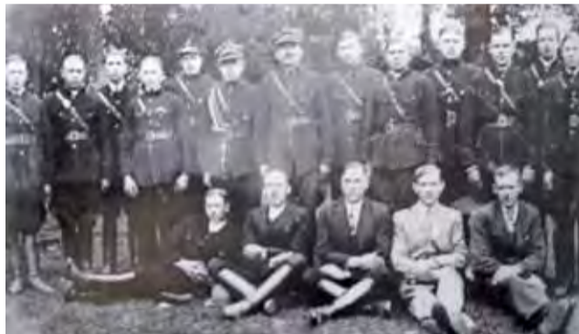
OSP w Krępie w 1935 roku.

W późniejszym czasie druhowie również angażowali się w życie lokalnej społeczności, dbając o bezpieczeństwo mieszkańców oraz biorąc udział w uroczystościach państwowych czy kościelnych. Istotnym wydarzeniem w stuletniej historii jednostki były obchody 85. rocznicy powstania OSP, kiedy to z okazji jubile-