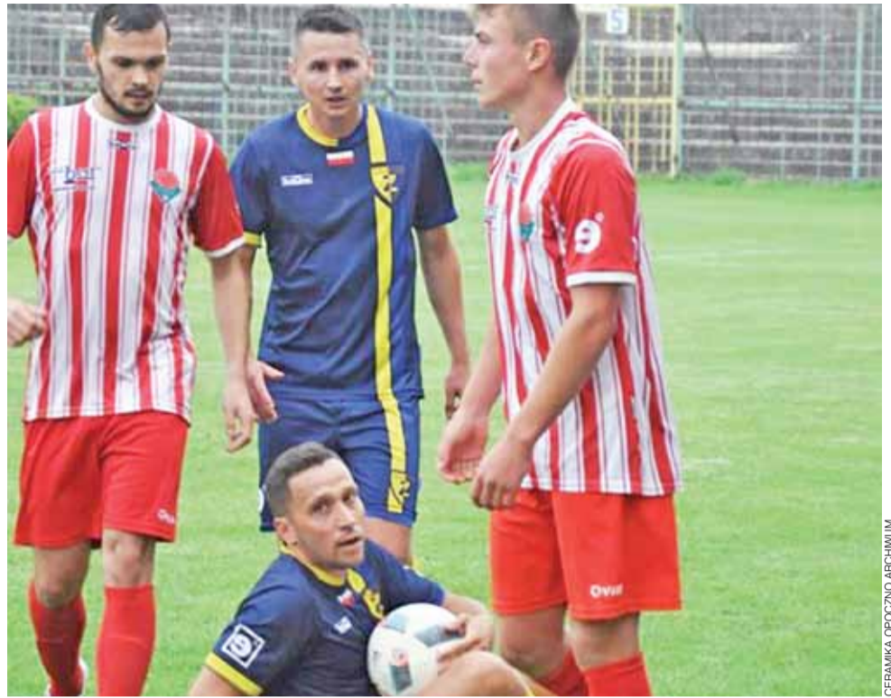
Ceramika – Zjednoczeni. W poprzednim sezonie opocznianie byli górą, tym razem zwycięstwo odniósł Stryków.

■ 3. kolejka: Żelów – KS Kutno (19 września), Radomsko – Ner 5:1, Orkan – Pełkan II 6:1, Pogoń – Sieradz 0:0, Kwiatkowie – Boruta 3:2, Działoszyn – Omega 2:4, Ceramika – Zjednoczeni 1:4, Stal – Pilica 1:0, Andrespolia – pauza.