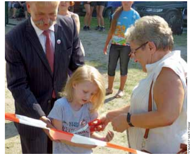
Ostatnie cięcie symbolicznej wstęgi należały do przedstawicieli mieszkańców osiedla.

Strefa powstała w ramach budżetu partycypacyjnego Łowicza dla Osiedla Nowe Miasto, kosztowała blisko 94 tys. zł. tm