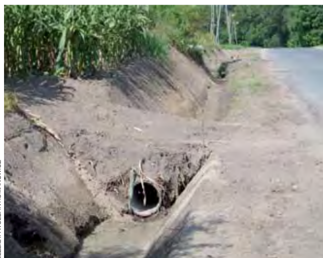
Efekt prac odwodnieniowych przy powiatówce w Ziewanicach.