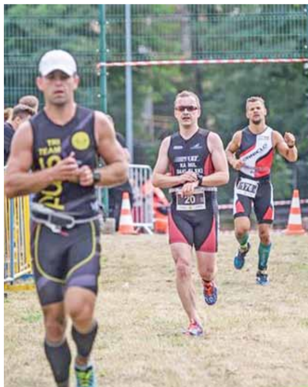
Biegacze w Strykowie rywalizowali już nad zalewem i w centrum miasta.

W imprezie wystartować mogą dzieci do lat 16 oraz kategoria 16+. W przypadku dzieci do 7 lat muszą one wystartować przynajmniej z jednym opiekunem, natomiast osoby niepełnoletnie będą