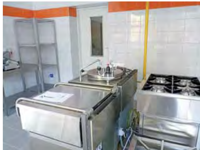
Nowa kuchnia wyposażona już niemal w całość.

Od września w szkole łącznie z przedszkolakami uczyć się będzie ok. 240 uczniów. Jest to liczba blisko 2,5-krotnie większa niż w roku 2000. Zwiększa się również liczba nauczycieli i innych pracowników szkoły, których obecnie jest już 40, a jeszcze niedawno potrzebą było 20. Po budowie sali gimnastycznej, którą do użytku oddano 4 lata temu, nowej części oddawanej do użytku obecnie, szkoła ma w planach również trzeci etap rozbudowy, który objąłby budowę dodatkowych przestrzeni dla klas młodszych. Obecne pomieszczenia są na tyle ciasne, że udaje się je wykorzystywać głównie do zajęć edukacyjnych, z miejscem na rekreację jest duży kłopot. ■