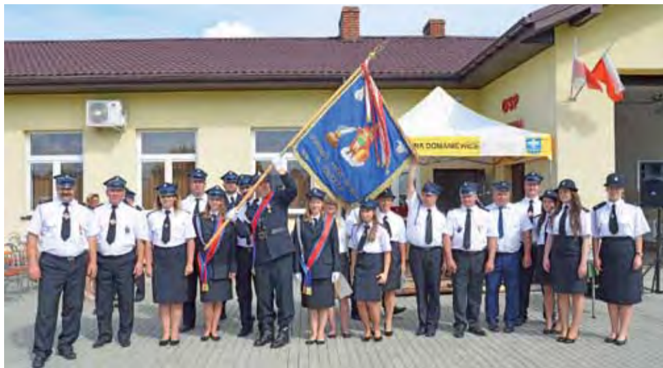
Druhowie z OSP w Krępie świętują stulecie powstania jednostki.

Powstanie lokalnej jednostki możliwe było również dzie-