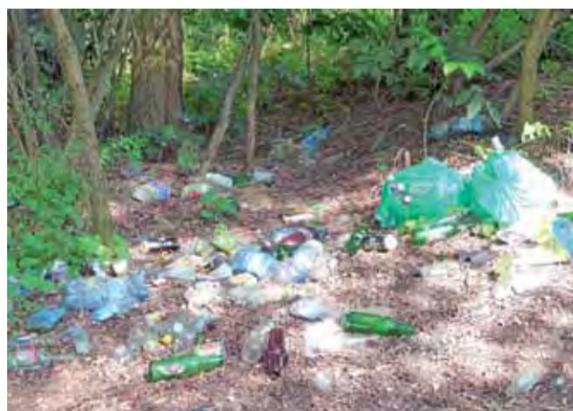
Tak wygląda bliskie sąsiedztwo Orlika i osiedla bloków przy ul. Sikorskiego w Głownie. Stan na 24 sierpnia.

„Wieści z Głowna i Strykowa” miały patronat medialny nad całym cyklem, a zdjęcia z poszczególnych pikników można cały czas znaleźć w naszym serwisie lowiczanie.info w zakładce Głowno/Stryków. ewr