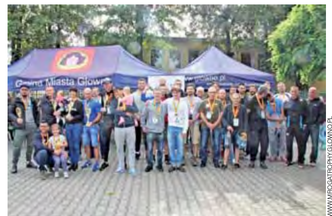
Nagrodzeni uczestnicy Mroga Trophy mimo chłodu byli szczęśliwi.

go WOPR. Więcej informacji na stronie www.mrogatrophy.glowno.pl, gdzie dostępna jest również fotorelacja z imprezy. wp