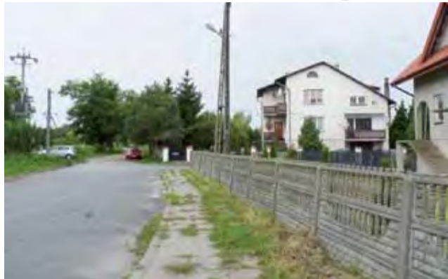
GDDKiA wskazała za niezbędne wykonanie rozbudowy skrzyżowania ulicy Cegielnianej z DK 14.

Generalna Dyrekcja Dróg Krajowych i Autostrad uznała pierwszą propozycję za niewystarczającą