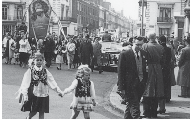
Wielka Brytania, Londyn, 22 kwietnia 1956 r. Antysowiecka demonstracja emigrantów z Europy Środkowo-Wschodniej.