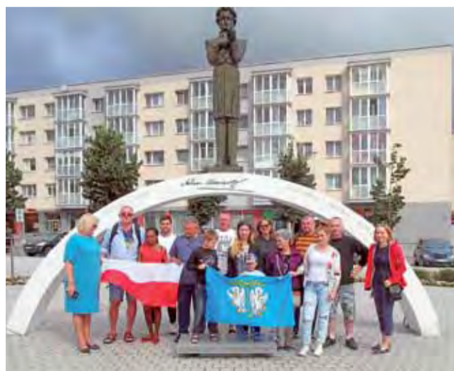
Osoby odwiedzające Soleczniki bardzo często bywają też przy pomniku Adama Mickiewicza.

Celem wyjazdu było nie tylko zwiedzanie i odwiedziny zaprzyjaźnionych osób. Z Łowicza do Solecznik trafiła też pomoc w różnych formach i przygotowana przez różne osoby. – Stowarzyszenie Dać Szansę oraz łowickie PCK przekazały mnóstwo konserw dla tamtejszego Domu