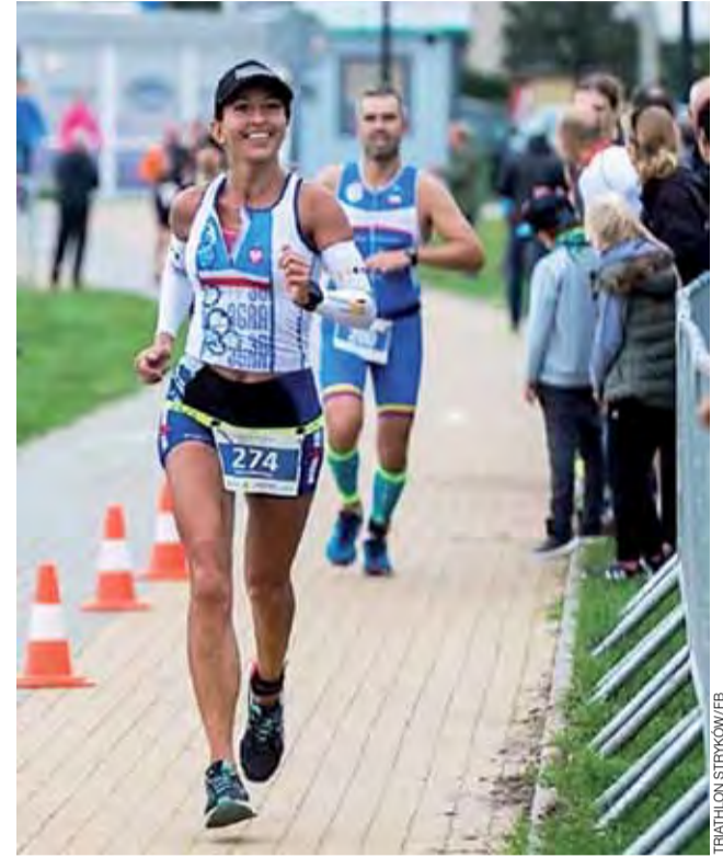
Finisz Triathlonu Stryków tradycyjnie mieścić się będzie przy przystani.

Zgłoszeń dokonać można jedynie za pośrednictwem formularza internetowego na stronie www.triathlonstrykow.pl lub bezpośrednio u operatora imprezy www.inessport.pl. Po dokonaniu opłaty startowej będzie można zmierzyć się odpowiednio z 950 m pływania, 45 km jazdy rowerem i 10,5 km biegu dla 1/4 oraz połowę krótszą trasą dla 1/8. Zawodnicy etap pływacki rozegrają na strykowskiem zalewie, rowerem pojedą trasą ze Strykowa przez Cesarę, Bartolin, Sierżnię i z powrotem do Strykowa (runda 11 km), gdzie wyruszą na pętle biegowe o długości 5,250 km w kierunku Sosnowca i wokół zalewu do mety