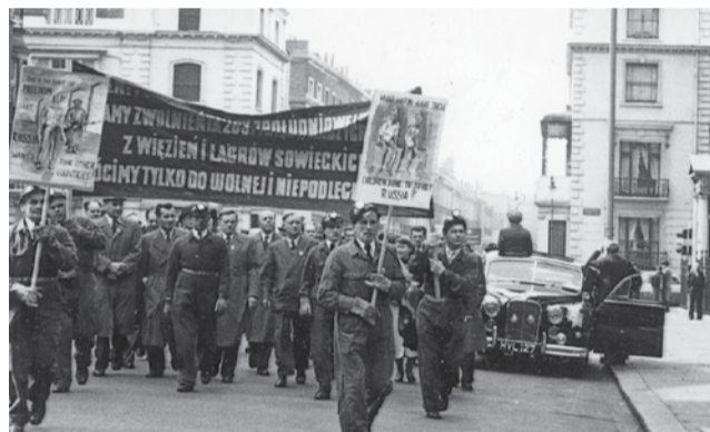
Wielka Brytania, Londyn, 22 kwietnia 1956 r. Przemarsz polskich emigrantów niosących plakaty przedstawiający wychudzone polskie dzieci. Na drugim planie demonstranci niosą transparent z napisem „Żądamy zwolnienia (...) z więzień i łagrów sowieckich. Wrócimy tylko do wolnej i niepodległej [Polski]”.

■ 25 lutego 1956 – w czasie XX Zjazdu Komunistycznej Partii Związku Radzieckiego I sekretarz KPZR Nikita Chruszczow wygłasza tajny referat, w którym opisuje zbrodnie stalinowskie. Oskarża Stalina o wymordowanie tysięcy członków partii, stosowanie terroru, masowe aresztowania, deportacje tysięcy ludzi i budowanie kultu własnej osoby. Treść