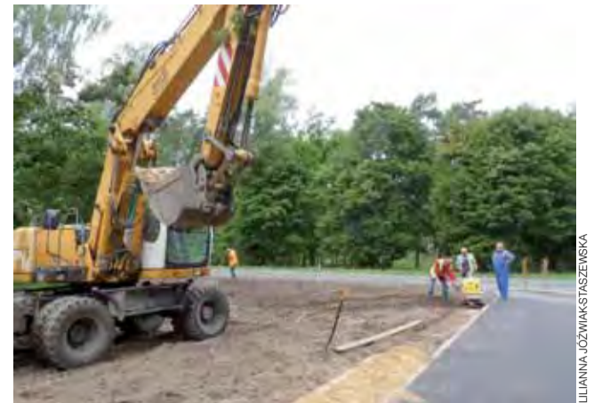
Gotowy jest już asfaltowy zjazd z trasy. Trwają ostatnie prace ziemne.

Wiadomo natomiast, że kłopoty z uzyskaniem pozytywnej opinii w GDDKiA mogą wydłużyć termin oddania całości projektu kompleksu szkolno-sportowego nawet do połowy października.