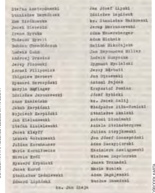
Sygnatariusze „Listu 59” z 1975 roku.