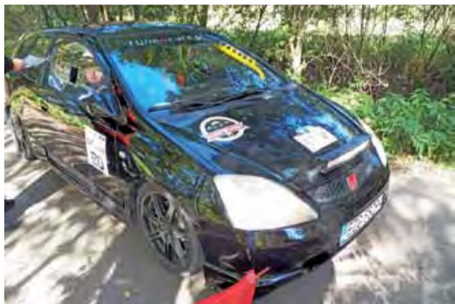
Mariusz Mokras z pilotem Konradem Jankowskim przed startem do 1 odcinka w klasie 4, gdzie zajęli ostatecznie 2. miejsce.