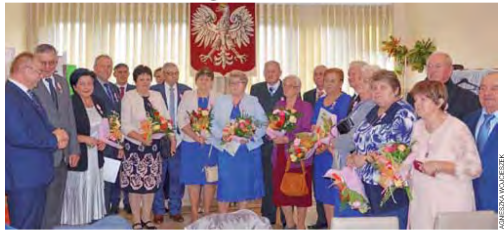
U honorowani medalami małżonkowie chętnie pozwolili do wspólnych zdjęć.

Naszemu reporterowi w tym szczególnym dniu udało się po-