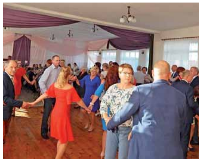
Zabawa w odremontowanej sali w Karsznicach.