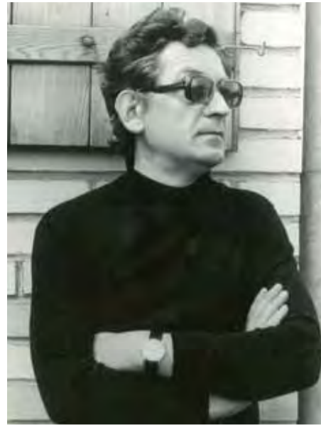
Czarny Bryńsk, 1975-1976. Zdzisław Najder, założyciel Polskiego Porozumienia Niepodległościowego.

mieszkańcem naszego miasta lub okolicy, albo stąd pochodzi, tu rozpoczynała naukę, emocjonalnie bądź rodzinie czy towarzysko jest nadal z tą ziemią związana. Nasze wywiady (obecny jest kolejnym) mają na celu pokazać nam Polskę jaką jest obecnie i jacy są Polacy – jak wygląda nasze życie A.D. 2018. Każdego z naszych rozmówców pytamy o inny wycinek naszej rzeczywistości, by całość stworzyła, widziany z łowickiej perspektywy, obraz naszego kraju. Redakcja