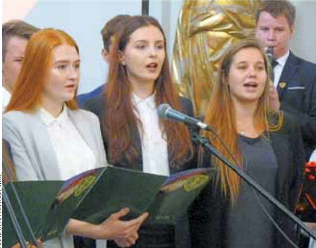
Koncert „Dla Niepodległej” w Muzeum w Łowiczu.