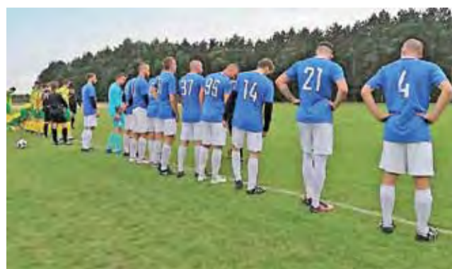
Błękitni Dmosin mają szansę na dalekie zajście w pucharach.

■ II runda PPOŁ: Termy Ner Poddebice – Andrespolia Wiśniowa Góra 2:1, Jutrzenka Bychlew – Bzura Ozorków 2:1, AKS SMS Łódź – Stal Głowno 4:2, Victoria Rąbień – Sokół Aleksandrów Łódzki 1:2, Sokół Popów – ŁKS II Łódź 1:9, Witonianka Witon – KS Sand Bus II Kutno 3:2, Błękitni Dmosin – UKS SMS Łódź 5:0, Zawisza Rzgów – MKP Boruta Zgierz 4:2, GKS Ksawerów – Sokół II Aleksandrów Łódzki 0:3 (wo), KKS Kolaszki – RTS Widzew II Łódź 3:1, Start Brzeziny – Włókniarz Pabia-