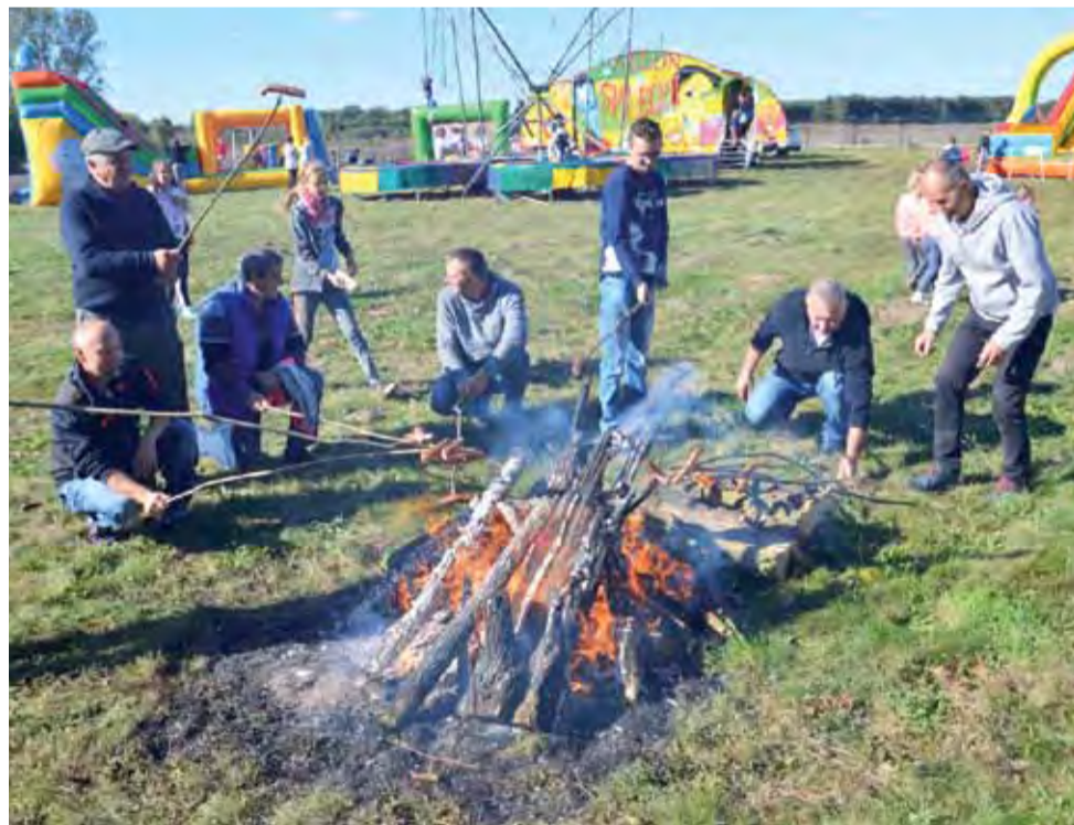
Najlepsza integracja jest przy ognisku – przekonują mieszkańcy zgromadzeni na festynie.

Żłobek powstaje w wynajmowanym wolnostojącym obiekcie o powierzchni blisko 180 mkw, w którym półtora roku temu swoją działalność zakończył sklep z farbami. Założycielka żłobka jest mieszkanką Sadówki, wcześniej prowadziła gospodarstwo rolne oraz pracowała w pierwszej tego typu placówce, która powstała w Strykowie. O sobie mówi, że bardzo lubi dzieci i pracę z nimi, dlatego postanowiła założyć własny żłobek. Starania o dotacje na jego prowadzenie póki co nie powiodły się. str. 4