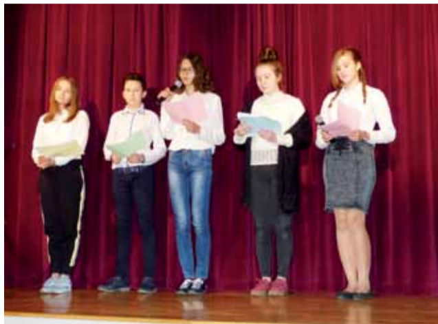
Uczniowie z SP w Nowych Zdunach przedstawili wiersze o dawnych i współczesnych Zdunach.

Mówił on o I wojnie światowej i okolicznościach, jakie doprowa-