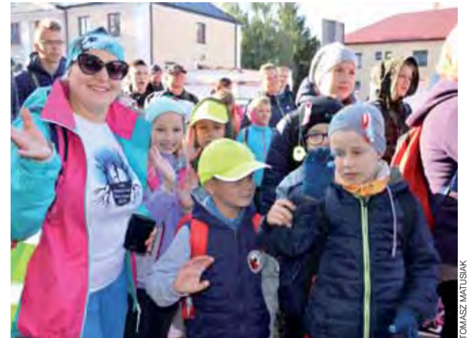
Uczestnicy rajdu zebraли się przed budynkiem Urzędu Gminy Łowicz.

W sobotni wieczór w Gzinie bawili się około 50 osób. tm