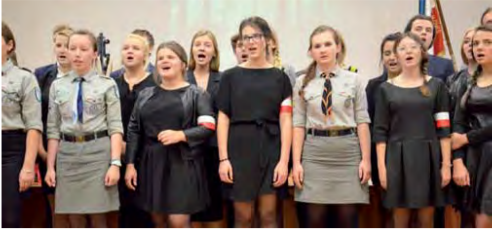
Młodzież z II LO jak co roku zaśpiewała pieśni związane z Szarymi Szeregami, w tym ich hymn.

Łowicz | Zjazd Stowarzyszenia Szarych Szeregów