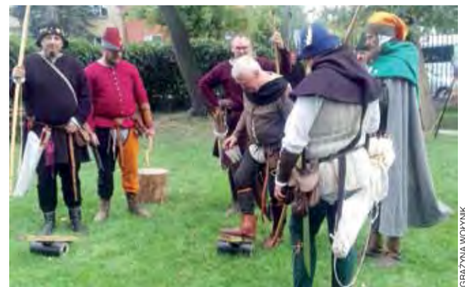
Jedną z atrakcji imprezy było łucznicstwo historyczne.