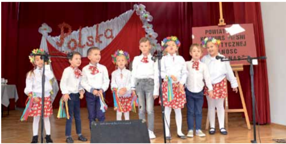
Podopieczni Przedszkola w Domaniewicach zachwycili publiczność swoim talentem i oryginalnymi strojami.

Znane melodie, m.in.: „Płynie Wisła, płynie”, „Krakowiaczek jeden”, „Tu wszędzie jest moja ojczyzna” czy „Jestem Polakiem” publiczność mogła usłyszeć w wykonaniu podopiecznych przedszkoli oraz uczniów placówek edukacyjnych z całego powiatu. Zdecydowana większość