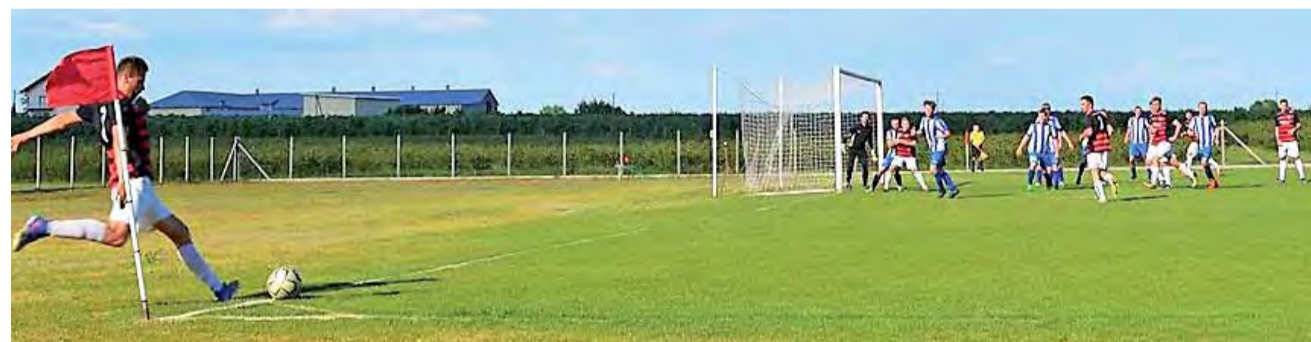
Zespół Błękitnych Dmosin (czarno-czerwone stroje) zamierza powalczyć o awans do klasy okręgowej.