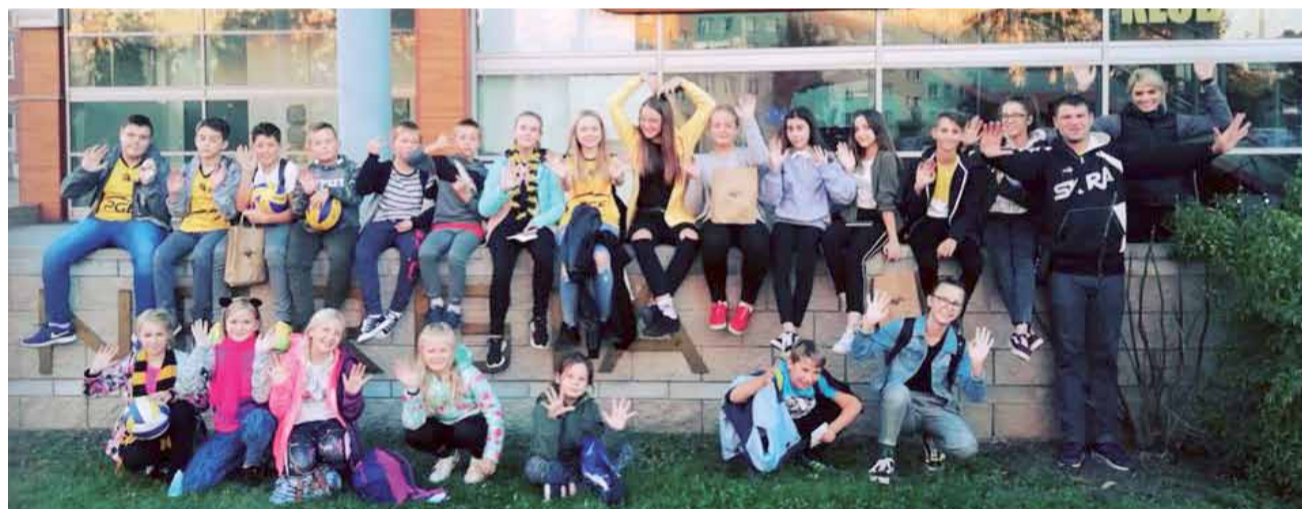
Uczniowie SP 1 Głowno przed halą PGE Skry Bełchatów.

ników był swędowianin Łukasz Majchrzak. Mieszkaniec Gminy Stryków pobił rekord życiowy na jednej ze swoich ulubionych tras i z wynikiem 20 min. 54 sekund zajął wysokie 15. miejsce w klasyfikacji open wśród wszystkich uczestników. wp