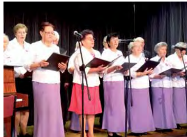
Program składający się z patriotycznych utworów wykonał Zespół Wokalny Seniorów „Wrzos”.

Wykład zakończył wymienieniem pamiętek z odzyskania niepodległości, jakie pozostały w Łowiczu i okolicach. A są to: sala