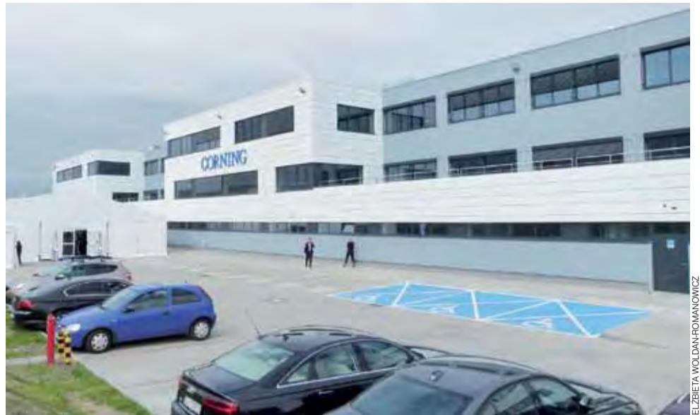
Imponująca inwestycja. Nowy zakład produkcyjny Corninga w Strykowie.