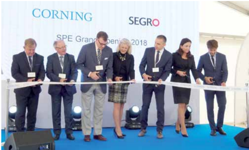
Przecięciu wstęgi dokonali dyrektorzy Corning z Polski i USA, przedstawiciele władz Łodzi i Strykowa i rektor PL.