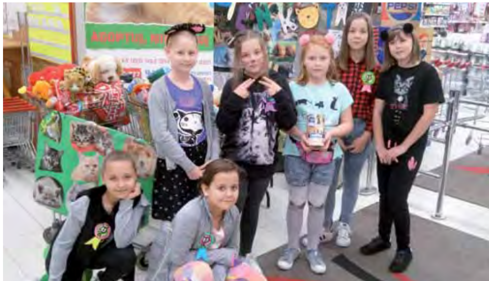
Dzieci ze Szkoły Podstawowej nr 2 w miniony weekend mogły Stowarzyszeniu Cztery Łapy z Łowicza zbierać ponad 196 kg karmy dla zwierząt. Jak będzie w tym tygodniu?

W akcji udział wezmą dzieci ze świetlicy Szkoły Podstawowej nr 2 w Łowiczu, które darczyńców nagrodzą własnoręcznie zrobionymi laurkami i „medalami”. Podobną akcję w poprzedni weekend w markecie Intermarkhè przeprowadziło łowickie Stowarzyszenie