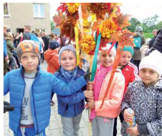
Na starcie. Pierwszaki z SP 1 z rajdowym totemem gotowe do wyjścia na szlak.

Na mecie, czyli na szkolnym dziedzińcu, na wszystkich czekała gorąca grochówka i poczęstunek w postaci owoców, w przygotowanie którego włączyli się rodzice. Klasy otrzymały też nagrody za udział w rajdzie. ewr