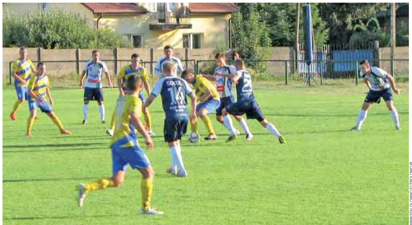
Piłkarze Stali Głowno (żółto-niebieskie stroje) są w czołówce V ligi, ale dogonić liderów będzie im bardzo trudno.

Drużyna z Głowna nadal zajmuje 5. miejsce w tabeli Łódzkiej Klasy Okręgowej. Samotnym liderem jest teraz ŁKS II Łódź, który rzutem na taśmę zwyciężył w Rosanowie i wykorzystał pierw-