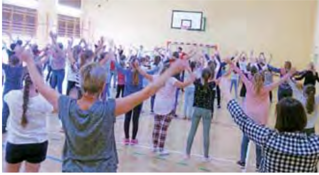
Szkolna społeczność w Niesułkowie wykonywała wspólnie ćwiczenia.

W wielu miejscach w Polsce EPS był obchodzony na różny sposób. Na szczęście lokalnym