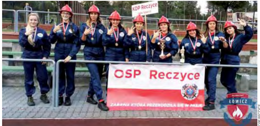
Drużyny z OSP Reczyce nie ukrywały swojej radości z tak wysokiego miejsca w rankingu.