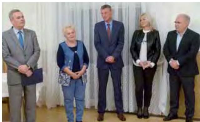
Kandydaci Koalicji Obywatelskiej do Rady Powiatu Zgierskiego.

– Idziemy pod szyldem Platforma. Nowoczesna Koalicja Obywatelska, czyli udało się stworzyć zjednoczoną opozycję. Przypominam, że oprócz Platformy i Nowoczesnej, w naszych szeregach również jest Inicjatywa Polska Barbary Nowackiej (...). To jest istotne, żeby faktycznie nie rozpraszać się, bo tylko i wyłącznie wspólnymi siłami te wybory możemy wygrać. Ja wierzę, że każdy z was, kto startuje i nie startuje, zrobi wszystko, żeby tą podłą zmianę zatrzymać – mówił poseł