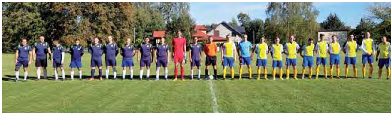
Zespół Strugi Dobieszków (z lewej) jest na najlepszej drodze do awansu do A-klasy.

miejsca w różnych wyścigach. W najstarszej grupie juniorek młodszych (15-16 lat), która miała