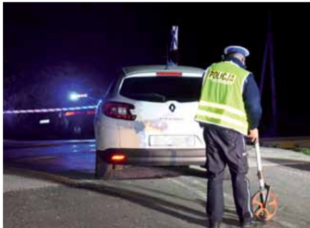
Działania policji na miejscu kolizji.

Przejazd był nieprzejezdny na czas działań służb porządkowych, przyczyny zdarzenia ustalała policja oraz komisja badania wypad-