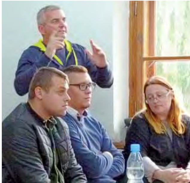
Głos z ul. 11 Listopada. Mieszkaniec dopytywał, co powinno być priorytetem – budowa kanalizacji tam, gdzie wciąż jej brakuje czy utwardzanie dróg w innych częściach miasta?

Mieszkaniec posesji narożnej, położonej u zbiegu Granicznej i Rataja, przedstawił historię ponad 20-letnich starań lokalnej społeczności o budowę kanalizacji sanitarnej, zainicjowanych w 1996 r., a potem wzmożonych po 2010 – jak dotąd bez skutku. Kolejne interwencje urząd łągodził obiet-