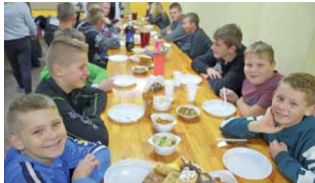
Stół dla młodszej części uczestników zabawy.

Na zewnątrz rozpalono duże grill, ale ponieważ wieczór był już chłodny, cała impreza odbyła się w środku strażnicy. Były