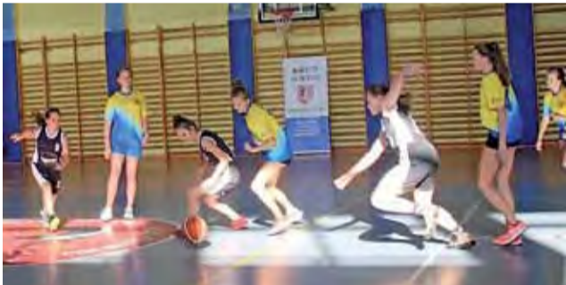
Mecze koszykówki w Głownie odbyły się w ramach Turnieju Szkół.

W Europejski Tydzień Sportu mocno zaangażowała się także Szkoła Podstawowa w Niesułkowie. Nauczyciele zespołu ds. promocji zdrowia i aktywności fizycznej przygotowali dla uczniów dwie akcje. Jedną z nich był rajd pieszy wg przygotowanych tras wzdłuż najbardziej znanych punktów i przez malowniczą scenę lasów. Ponadto trzy dni w tygodniu prowadzona była akcja Cała szkoła ćwiczy razem. Podczas niej uczniowie, nauczyciele i pracownicy szkoły wspólnie wykonywali ćwiczenia w rytm muzyki, co bardzo wszystkim się podobało i pobudziło ich do jeszcze bardziej wyjącej pracy w trakcie zajęć szkolnych.