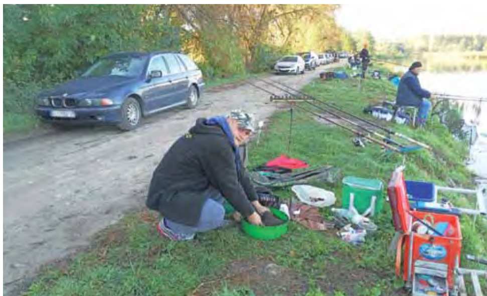
Najpierw zanęcić, a potem wędkować – zdjęcie wykonano podczas przygotowań do wędkowania.

Kolejne zawody organizowane przez koło PZW Łowicz zaplanowano na 21 października. Będą to tym razem zawody spinningowe. Rozegrane zostaną także na zalewie za lasem w Łowiczu. opr. mak