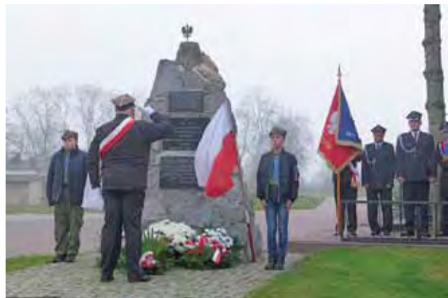
Świąteczny poranek 11 Listopada. Pod pomnikiem w Dmosinie kwiaty składa przedstawiciel koła kombatantów.

Na pierwszej z nich, lekcji historii, uczniowie SP w Kołacinie we współpracy z uczniami SP w Dmosinie wystawili program ukazujący losy Polaków od pierwszego zaboru aż do odzyskania niepodległości i powrotu