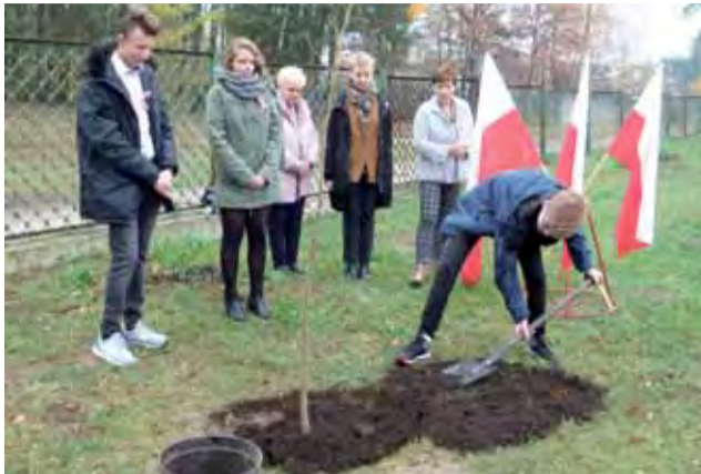
Historyczna chwila. Sadzenie drzewka wolności przy ZSLG w Głownie.

Poruszająca jest świadomość, że kapsuła, która może zostać otwarta dopiero za 100 lat, jest pomostem między teraźniejszością a odległą przyszłością, a wkopane dziś drzewo – będzie żywym pomnikiem jubileuszu stulecia Niepodległej.