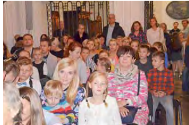
Koncertu wysłuchała licznie zgromadzona widownia, na której zasiadli przede wszystkim rodzice i bliscy młodych muzyków.

polskich kompozytorów bywa czasem tak piękna, jak i trudna, ale wiele kompozycji powstało z myślą o tym, by mogły je grać