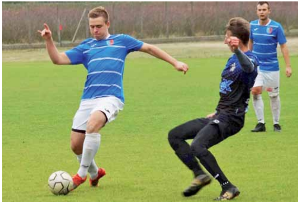
Błękitni Dmosin (niebieskie koszulki) przegrali najważniejszy mecz rundy jesiennej.

■ Następna, 13. kolejka A-klasy, gr. II odbędzie się w dniach 17-18 listopada: LKS Kalonka – Błękitni Dmosin, Włóknarz Zgierz – Sport