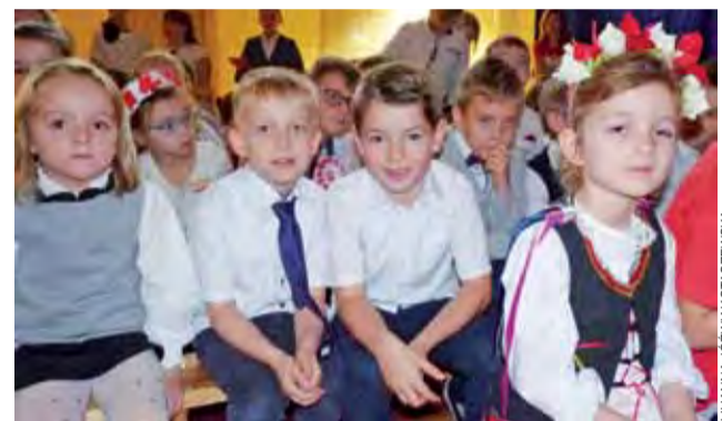
Uczniowie przyszli do szkoły nie tylko na galowo – nie zabrakło też ludowych akcentów.

Akademii, która zgromadziła nie tylko uczniów i nauczycieli, ale również przedstawicieli środowiska lokalnego, uświetniła inscenizacja słowno-muzyczna „Droga do Niepodległości” w wykonaniu uczniów klas VI-VIII oraz szkolnego chóru. Oprócz wielu patriotycznych pieśni, uczniowie zaprezentowa-