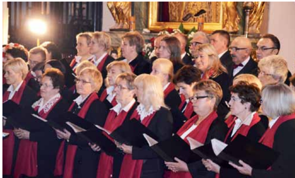
Pieśń „Boże coś Polskę” w wykonaniu chórów była najlepszym wprowadzeniem do ogólnej myśli spektaklu.