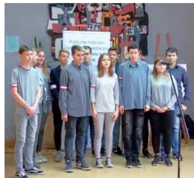
Uczniowie Liceum Katolickiego prezentowali publiczności m.in. pieśni patriotyczne, pochodzące z okresu I wojny światowej.

Jeszcze przed patriotycznym spotkaniem w szkole, wcześniej tego samego dnia, gminne uroczystości 11 Listopada zainaugurowało o godz. 8.30 złożenie kwiatów pod pomnikiem wzniesionym w 10. rocznicę odzyskania przez Polskę niepodległości. Odbyło się to w asyście pocztów sztandarowych SP w Dmosinie. Koła Kombatantów oraz jednostek Ochotniczej Straży Pożarnej. str. 31