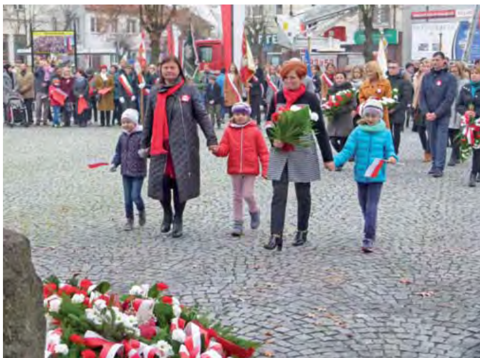
Żywa lekcja patriotyzmu. W składaniu kwiatów pod obeliskiem na Placu Wolności, obok dyrektorek miejskich przedszkoli nr 1 i 3, wzięły udział dzieci z tych placówek.

„Wolność, to nie cel, lecz szansa by spełnić