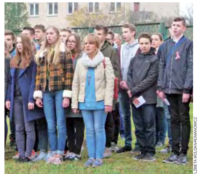
„Marsz, marsz Dąbrowski...”. Hymn dla Niepodległej w piątek, 9 listopada, o godz. 11.11, zaśpiewali m.in. uczniowie Zespołu Szkół Licealno-Gimnazjalnych w Głownie.

Hymn państwowy śpiewały także dzieci w przedszkolach, na przykład w Miejskim Przedszkolu nr 3 w Głownie, które z tej okazji odwiedziliśmy. str. 31