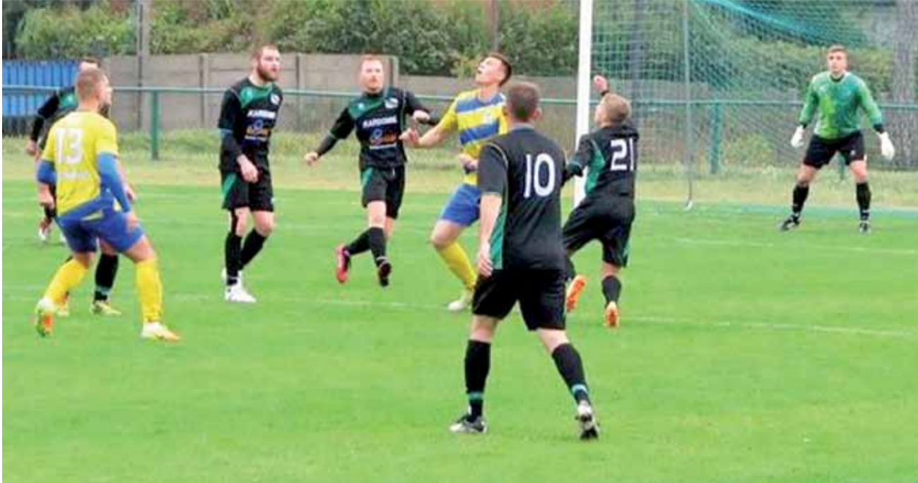
Głowieńscy piłkarze Stali (żółto-niebieskie stroje) nie dali wysoko notowanemu Włóknarzowi Pabianice żadnych szans.