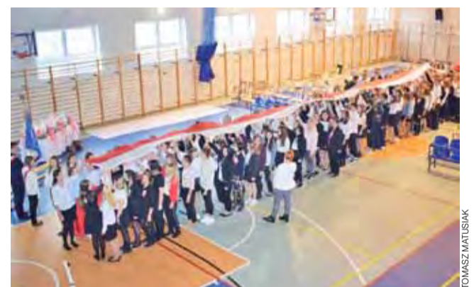
W Zespole Szkół Ponadgimnazjalnych nr 3 w Łowiczu, podczas śpiewania pełnego tekstu Mazurka Dąbrowskiego w piątek o 11.11, uczniowie trzymali w górze długą prawie na całą salę gimnastyczną, biało-czerwoną flagę. Później grupa uczniów zaprezentowała też ciekawy układ choreograficzny z szarfami w narodowych barwach, a następnie inscenizację na temat czasów walk o niepodległość. tm