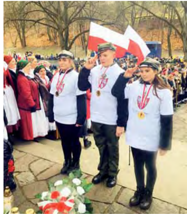
Uroczystości patriotyczne na Rossie, w których uczestniczyli głowieńscy harcerze.