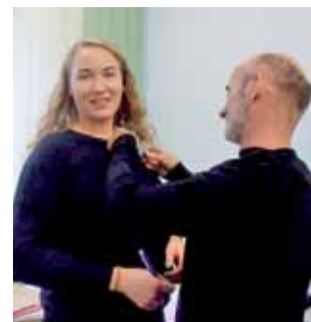
Dyrektor nieborowskiej biblioteki dekoruje okolicznościowym znaczkiem jedną z pracownic Urzędu Gminy.