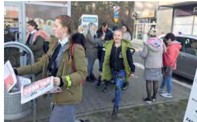
Jednym z zadań było wcielenie się w „gazeciarzy” i rozdawanie mieszkańcom okolicznościowych gazet – biuletynów.

jeszcze mi się nie zdziwiło i chyba długo nie zdziwi.