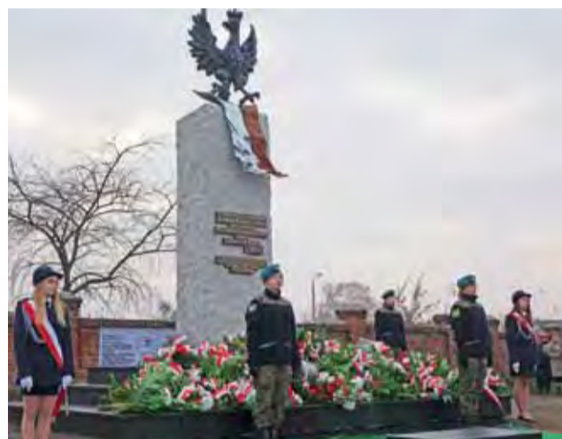
Wartę honorową przy pomniku objęła klasa mundurowa ZS nr 1 w Bratoszewicach oraz druhy OSP.