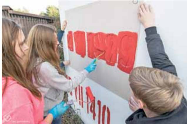
Mural z ważnymi dla każdego Polaka datami powstał dzięki uczestnikom V Gry Miejskiej na jednym z garaży bloków przy ul. Sikorskiego.

Postacie te miały być zaprezentowane z innej strony niż na lekcjach historii w szkole, uczestnicy mogli poznać wiele mniej znanych faktów i ciekawostek, jak na przykład to, że Piłsudski