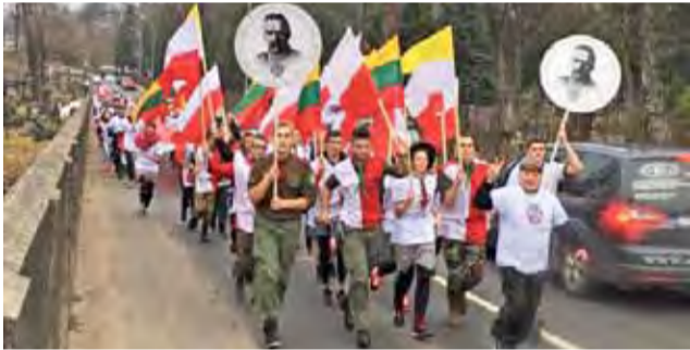
Głowieńscy harcerze wbiegają z flagami na cmentarz na Rossie.

Po pokonaniu blisko stu kilometrów harcerze wbiegli na metę przy cmentarzu na Rossie i tam wzięli udział w uroczystościach patriotycznych. – To wspaniałe wydarzenie. Po raz pierwszy głowieński Hufiec ZHP uczestniczył w nim w 1998 roku. Wtedy w sztafecie biegło zaledwie 5 osób, a po dwudziestu latach jest ich już 50. Pamiętam lata, kiedy uczestników było blisko stu. Kto raz był z nami w Wilnie, z pewnością wróci w kolejnych latach – zapewnia komendant. aw