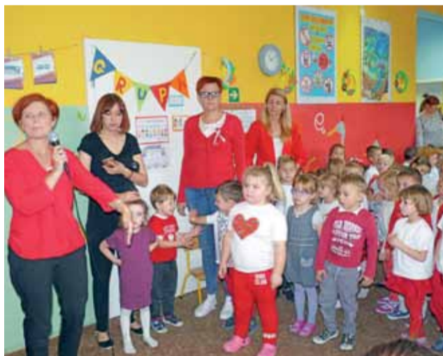
Miejskie Przedszkole nr 3 w Głownie śpiewa hymn narodowy.

W tym samym przedszkolu w ramach świętowania 100-lecia niepodległości Polski już dzień wcześniej, 10 listopada, odbyło się też przedstawienie „Mały Polak”, w którym to dzieci prezentowały wiersze i pieśni patriotyczne. ljs