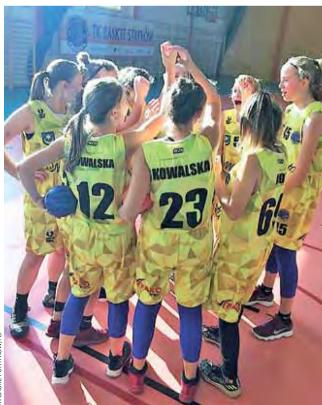
Strykowskie koszykarki cieszą się po udanym występie w hali w Dąbrowce Dużej.