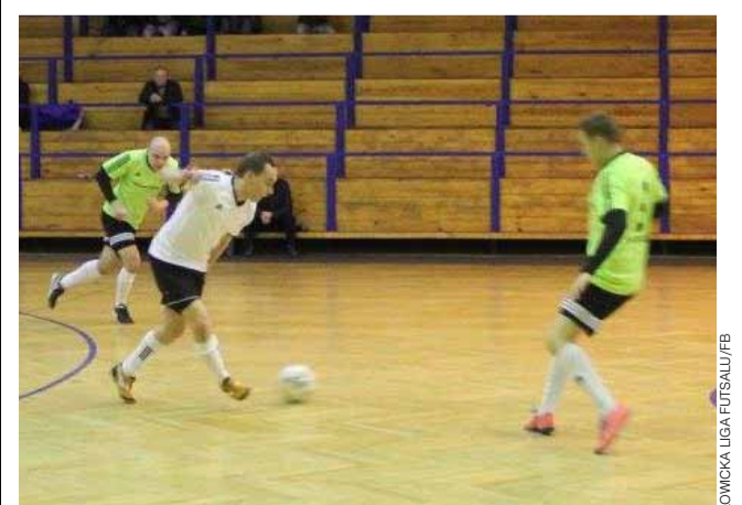
Fantazja Głowno (białe koszulki) będzie występować kolejny już sezon w Łowickiej Lidze Futsal.

Start ligi przewidziano na 17-18 listopada lub 25 listopada. Do tej pory przewiduje się udział 48 drużyn w czterech ligach, a wśród nich dwie ekipy Błękitnych Dmosin (II Liga) i Fantazji Głowno (I Liga).