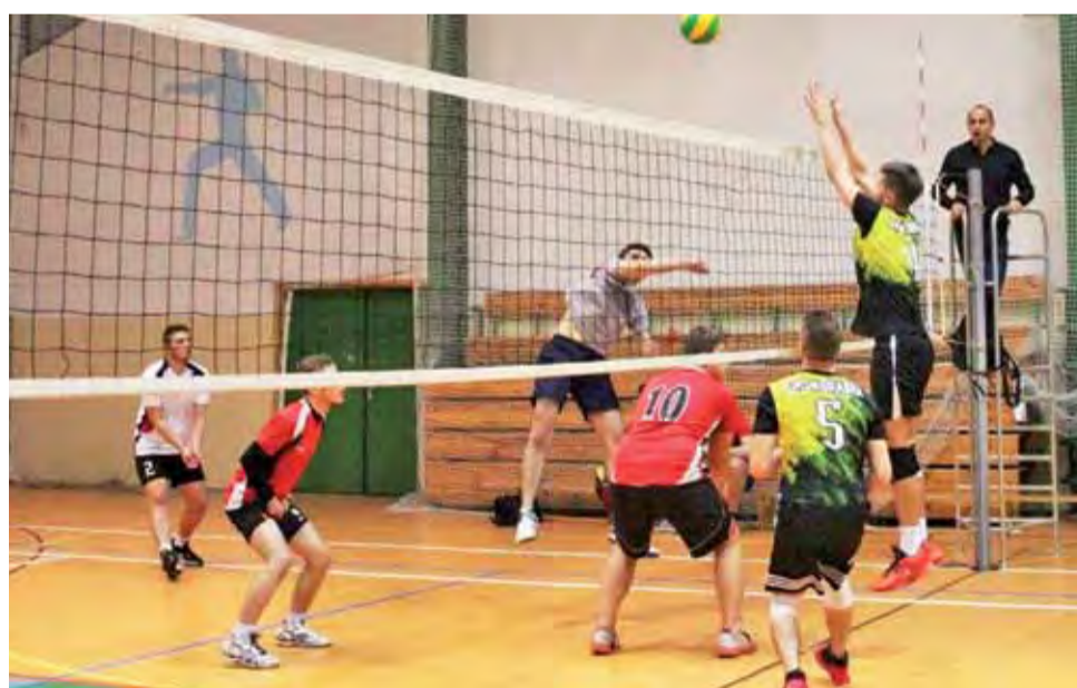
Mnichy z Południa Głowno (czerwonoczerwone koszulki) wygrali pierwszy mecz w XX SAM Łowicz.

Inauguracyjna kolejka XX SAM Łowicz w łowickiej Hali OSiR zakończyła się bardzo szyb-