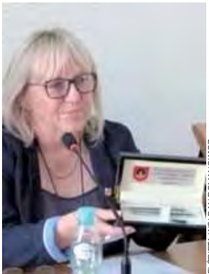
Pamiątki na koniec kadencji. Radni Rady Miejskiej w Głownie otrzymali na ostatniej sesji takie zestawy piśmiennicze.