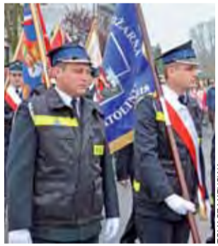
Strażacy prowadzą pochód z kościoła pod pomnik w parku gminnym.