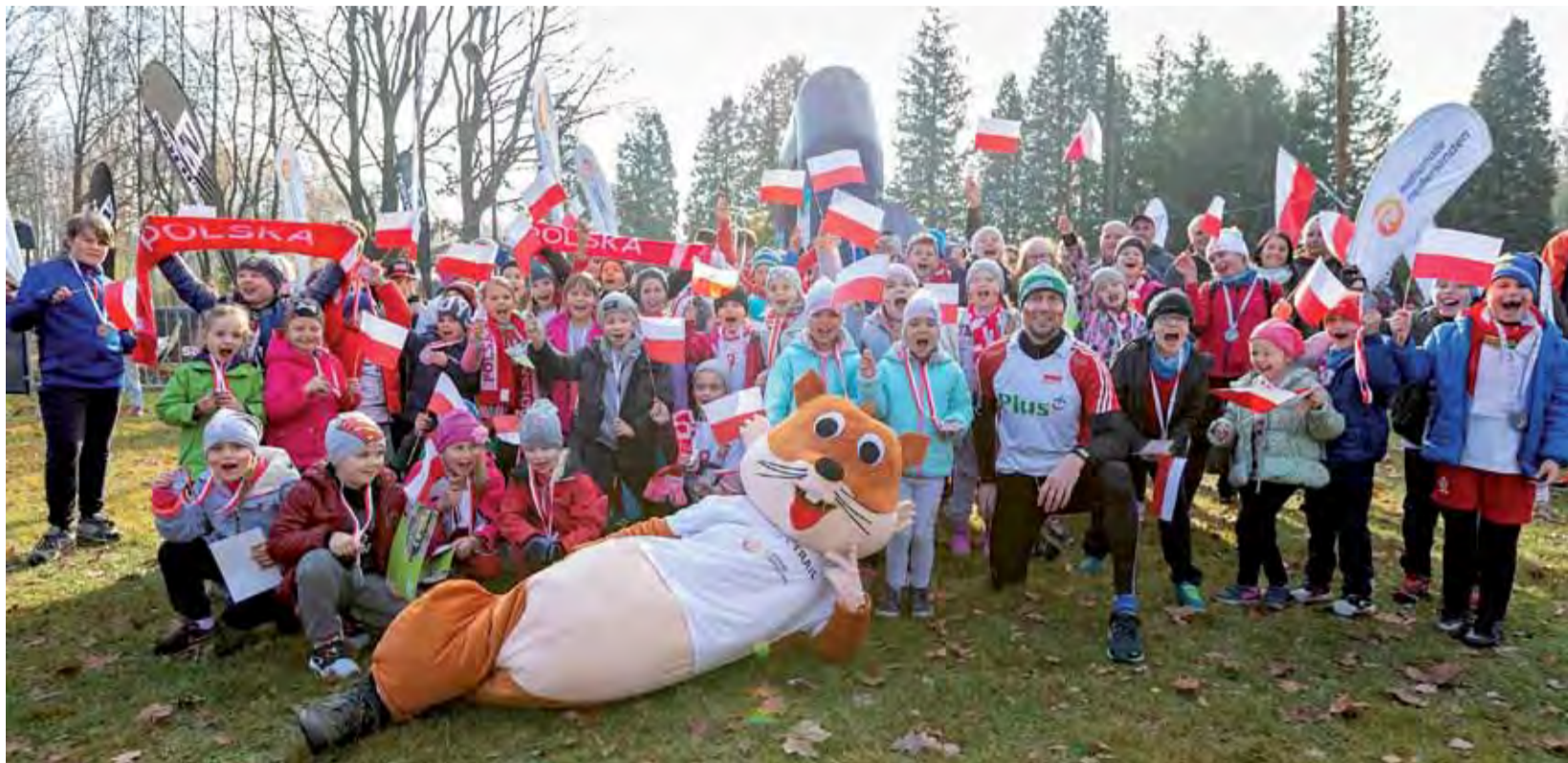
Uczniowie Szkoły Podstawowej w Bratoszewicach licznie uczcili 100-lecie Niepodległości podczas biegów City Trail Junior w Łodzi.

Bieganie | 100-lecie Odzyskania Niepodległości