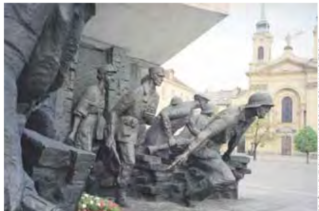
Warszawa, 1996-1997. Pomnik Powstania Warszawskiego na placu Krasińskich.