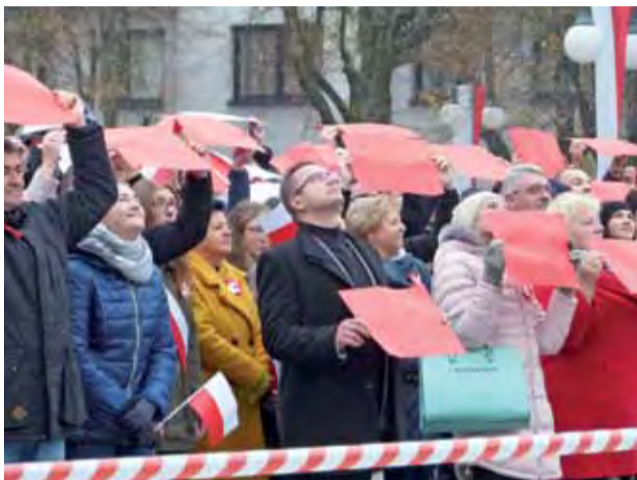
Uwaga, zdjęcie! Głównianie ustawiają się do stworzenia „żywej flagi”.

W XVIII wieku pękło imperium pełne swobód, a sąsiedzi rozerwali je między siebie, likwidując z mapy Europy Rzeczpospolitą. Przez ponad wiek całe pokolenia Polaków śniły o wolno-