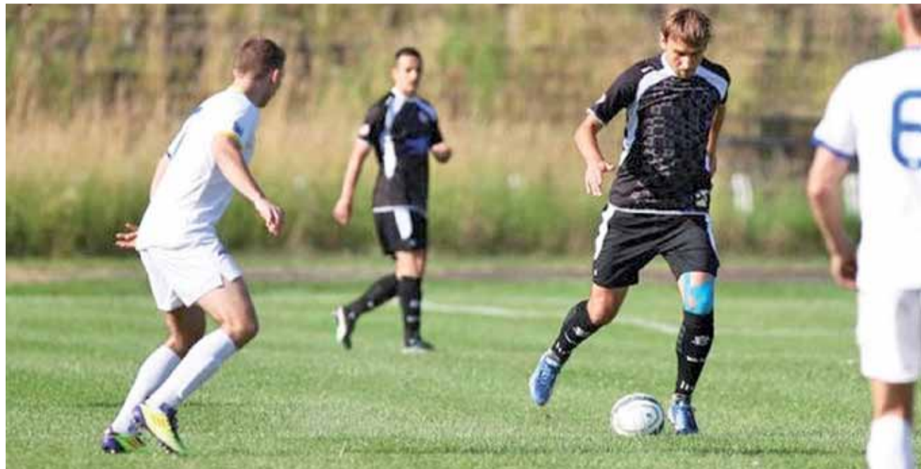
Piłkarze Zjednoczonych Stryków (białe stroje) udanie zakończyli pierwszą część sezonu 2018/2019 w IV lidze.

Derby powiatu od wielu lat rządziły się swoimi prawami. W ostatnich czasach Zjednoczeni zawsze byli postrzegani w roli faworytów, ale często mieli problem z pokonaniem teoretycznie słabszej drużyny ze Zgierza. Przed sobotnim spotkaniem zajmujący 6. miejsce w tabeli strykowianie także byli znacznie wyżej rozsta-