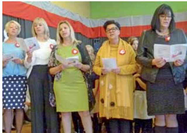
Występ – niespodzianka. Oto część nauczycielskiego chóru, stworzonego dla wykonania piosenki „Gdzie są kwiaty z tamtych lat”.