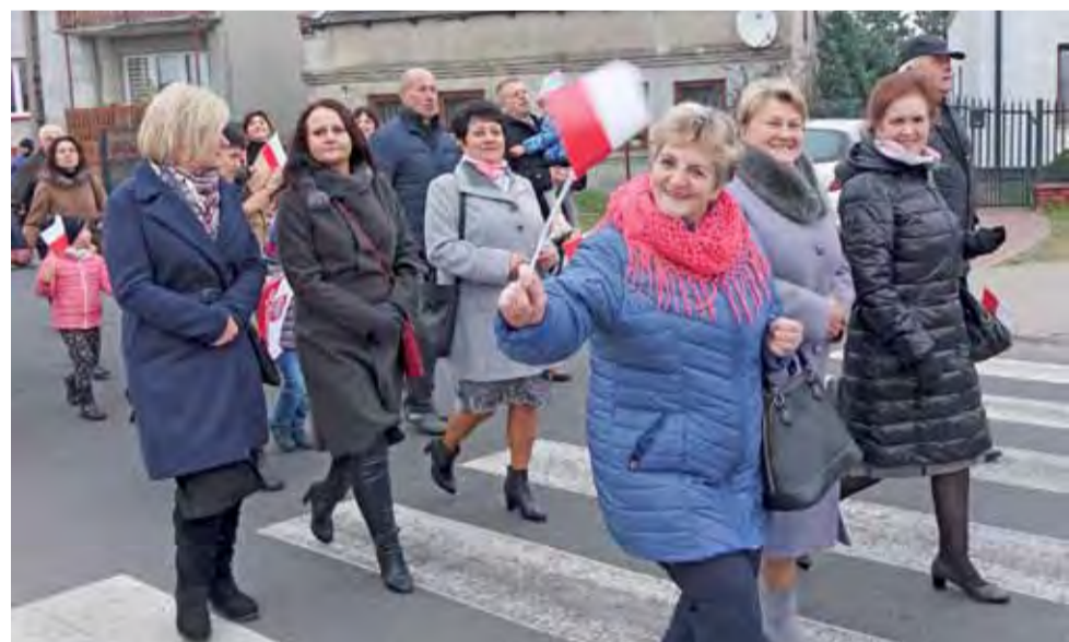
Uczestnicy pochodu idący pod nowy pomnik chętnie pozowali do zdjęć, radośnie wymachując chorągiewkami.