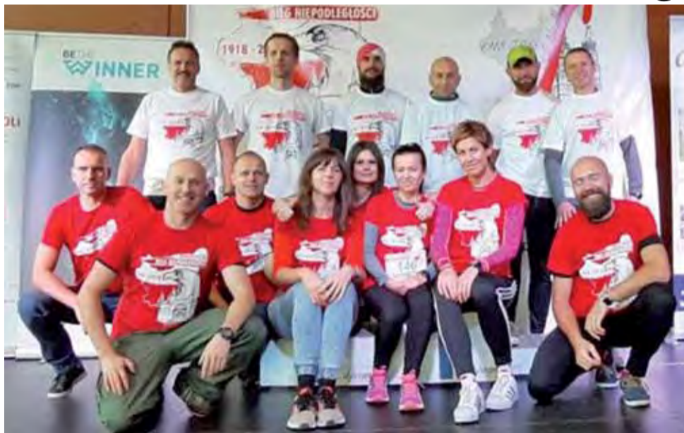
Ekipa KS Głowno w Biegu wystartowała podczas Biegu Niepodległościowego w Krakowie.

Miła atmosfera panująca na miejscu i słoneczna pogoda zdołała zmotywować głównian jeszcze mocniej do rywalizacji biegowej i uczczenia tak ważnego wydarzenia. Po odegraniu hejnału mariackiego i hymnu państwowego uczestnicy wyruszyli na trasę. Start i meta zlokalizowane zostały na Krakowskich Błoniach, a trasa poprowadzona bulwarem nadwiślańskim, tak aby nie zakłócała komunikacji miejskiej.