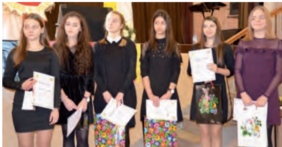
Konkurs związany z Dniem Papieskim podzielony jest na recytatorski i poezji śpiewanej. Na zdjęciu laureatki tego drugiego.

Warto przypomnieć, że Tipos Topes to cykliczny projekt, który zadebiutował w 2001 roku pod patronatem Łowickiego Ośrodka Kultury. Program zawsze jest tak dobierany, aby oscylował wokół promocji alternatywnych form kultury i sztuki współczesnej, z akcentem na muzykę i film. aa