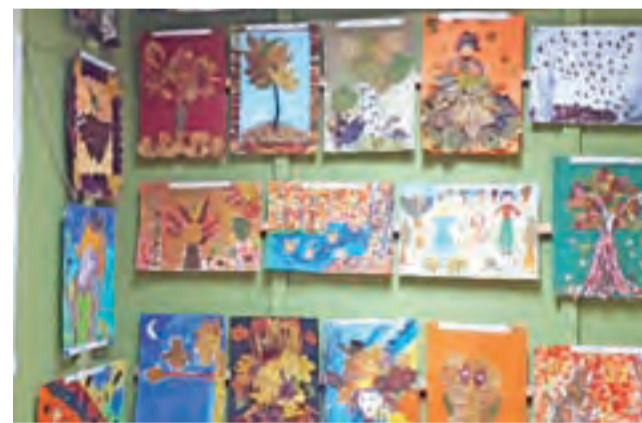
Pokonkursową wystawę m.in. prac plastycznych można oglądać do końca listopada.