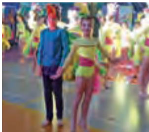
Uwagę publiczności zwracali ciekawe stroje tancerzy z zespołu Mała Parada z Jędrzejowa.

Podsumowanie artystycznego wydarzenia oraz uroczyste wręczenie nagród odbyło się w niedzielę ok. godziny 15.00. Listę nagrodzonych prezentujemy w ramce obok. Dla najlepszych przygotowano atrakcyjne nagrody, m.in. 3 czeki po 500 euro na międzynarodowy festiwal taneczny Top Art Festiwal do jednego z państw Europy. Czeki otrzymały: