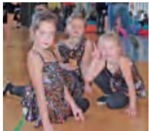
Przed występem młodzi tancerze ćwiczyli układy, ale tuż po nim chętnie pozowali do zdjęć.

zespół Impuls z Kieleckiego Teatru Tańca oraz grupa Art Station ze Skierniewic. Trzeci czek trafił do MOK-u w Głownie za organi-