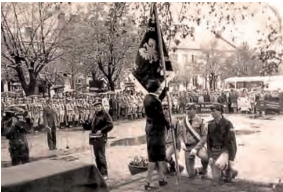
Jedno z najstarszych zdjęć, jakie podziwiać można na wystawie, przedstawia patriotyczne uroczystości na Placu Wolności w Głownie. Datuje się je na lata 50-te XX wieku.

– Włożyliśmy w przygotowanie wystawy mnóstwo pracy, ale dziś wiemy, że wysiłek ten się opłacał. Ludzie chętnie przychodzą ją oglądać, bo każdy chce zobaczyć