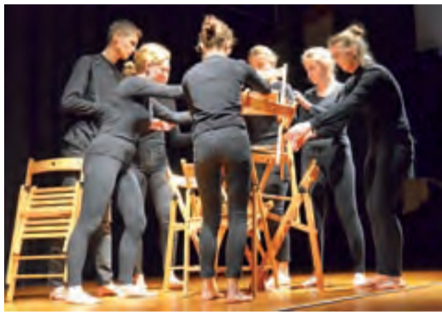
Członkowie grupy teatralnej Some z Elbląga jako jedyni przygotowali pantomimę.