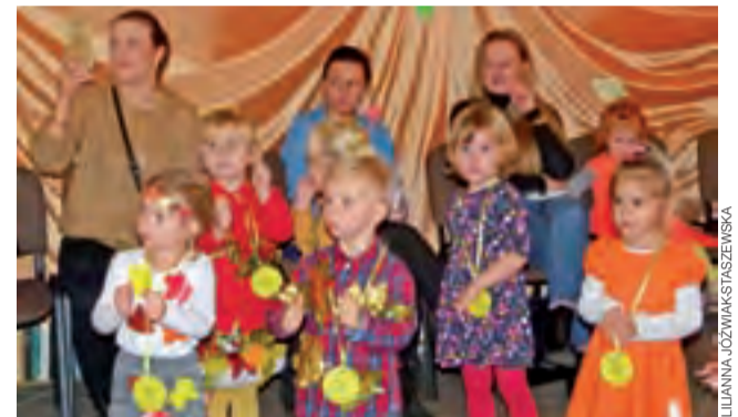
Każdy z pasowanych przedszkolaków otrzymał medal, który dumnie nosił do samego końca balu.

Organizatorem wtorkowego spotkania jest miejscowa filia Gminnej Biblioteki Publicznej w Kozłu, która na nie zaprasza wszystkich mieszkańców Kozła i okolic. Uczestnicy prelekcji będą mieli również okazję zapoznać się z eksponatami zgromadzonymi w szkolnej Izbie Pamięci otwartej przy okazji ubiegłorocznych obchodów rocznicy Bitwy nad Bzurą. ijs