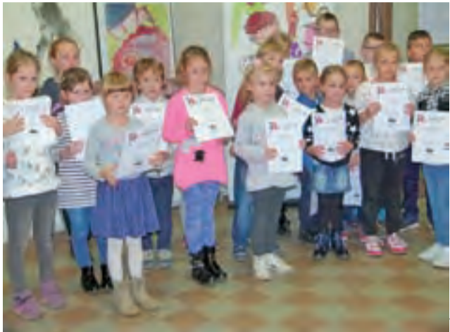
Podsumowanie „Grafikaliów 2018”. Na zdjęciu uczestnicy warsztatów biało-czerwonych, dzieci z grup plastycznych w MOK.