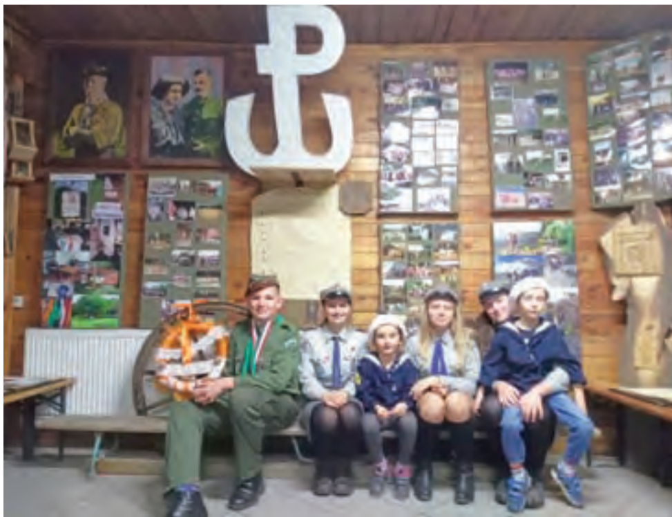
Głowieńscy harcerze na tle ściany wypełnionej dawnymi harcerskimi fotografiami, które sami wybierali.