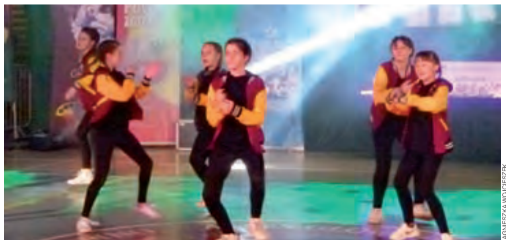
Taniec nowoczesny dzięki swojej dynamice wzbudził wiele emocji w publiczności.

Dodajmy, że uczestnicy prezentowali swoje umiejętności zespołowo oraz solo, zaś oceniani byli przez czteroosobowe jury