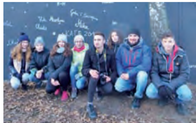
– Jest chłodno, ale piękny efekt prac wynagradza wszelkie trudności – powiedzieli naszemu reporterowi wolontariusze uczestniczący w akcji w sobotę, 17 listopada.