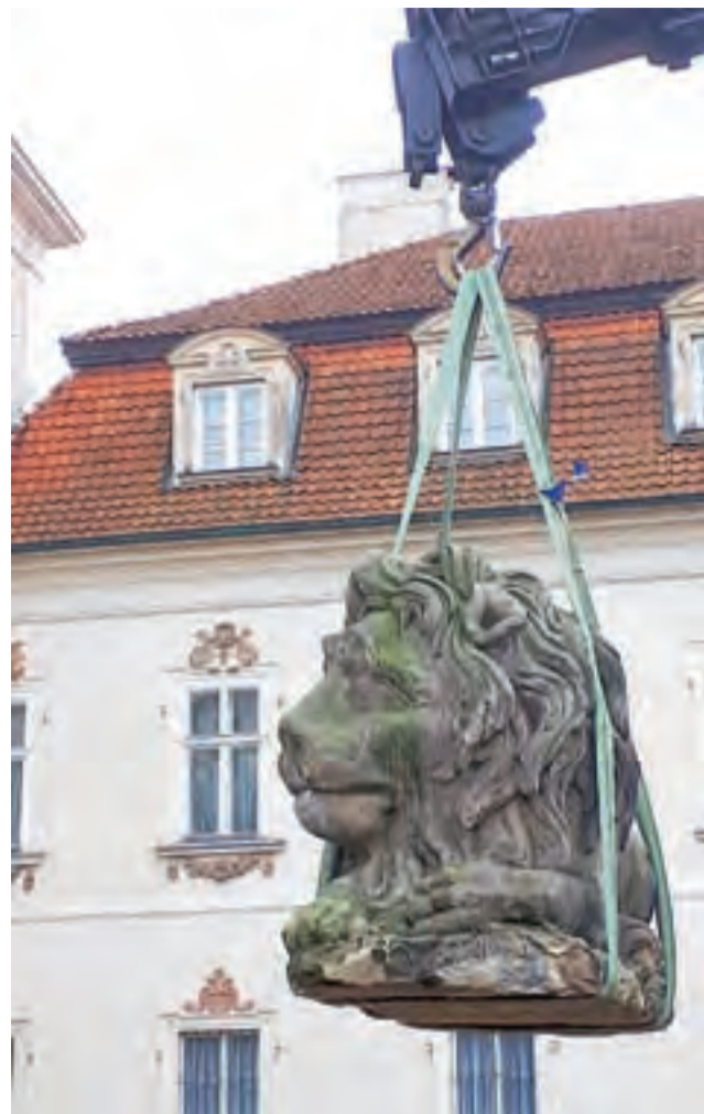
Jeden z nieborowskich lwów w czasie demontażu, w tle pałac Radziwiłłów.