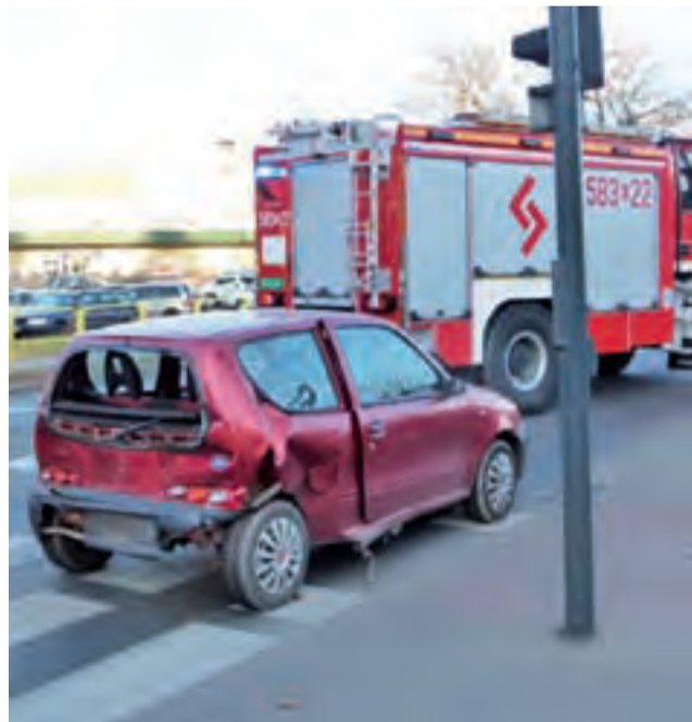
Uszkodzony Fiat Seicento tuż po kolizji.

Dodajmy, że wygrana w prestiżowym konkursie umożliwi laureatowi dalszą naukę w zakresie studiów lingwistycznych na koszt Federacji Rosyjskiej. aw