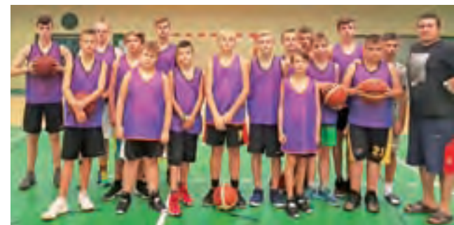
Zespół GTK podczas obozu szlifował nie tylko formę koszykarską.