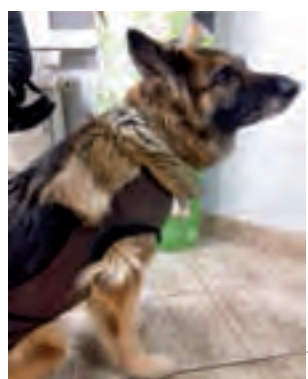
Bella, na leczenie której zbierane są grosiki, jest 12-letnią suką po operacji onkologicznej.

W ramach akcji przekazane zostały do szpitala również książki, zbierane w kilku przedszkolach i szkołach w Łowiczu, okolicach oraz półki na nie do zamontowania na ścianach. mwk