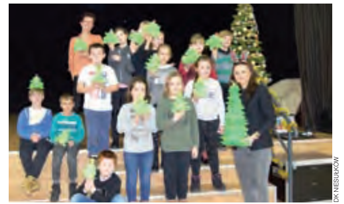
Puszyste choinki wykonali uczniowie Szkoły Podstawowej w Niesułkowie.

Tym, którzy w ostatnich dniach wzięli udział w warsztatach zorganizowanych przez niesułkowski Dom Kultury, sztuka wykonywania oryginalnych ozdób świątecznych już nie jest straszna. 5 grudnia dorośli uczyli się tutaj, jak wykonać bombkę decoupage, natomiast 12 grudnia uczniowie Szkoły Podstawowej w Niesułkowie dekorowali nie tylko bombki, również tworzyli nowoczesne choinki z piórek. Ogromny nakład pracy i wykazana przy niej cierpliwość młodym artystom wynagrodziły efekty widoczne na zdjęciu. ijs