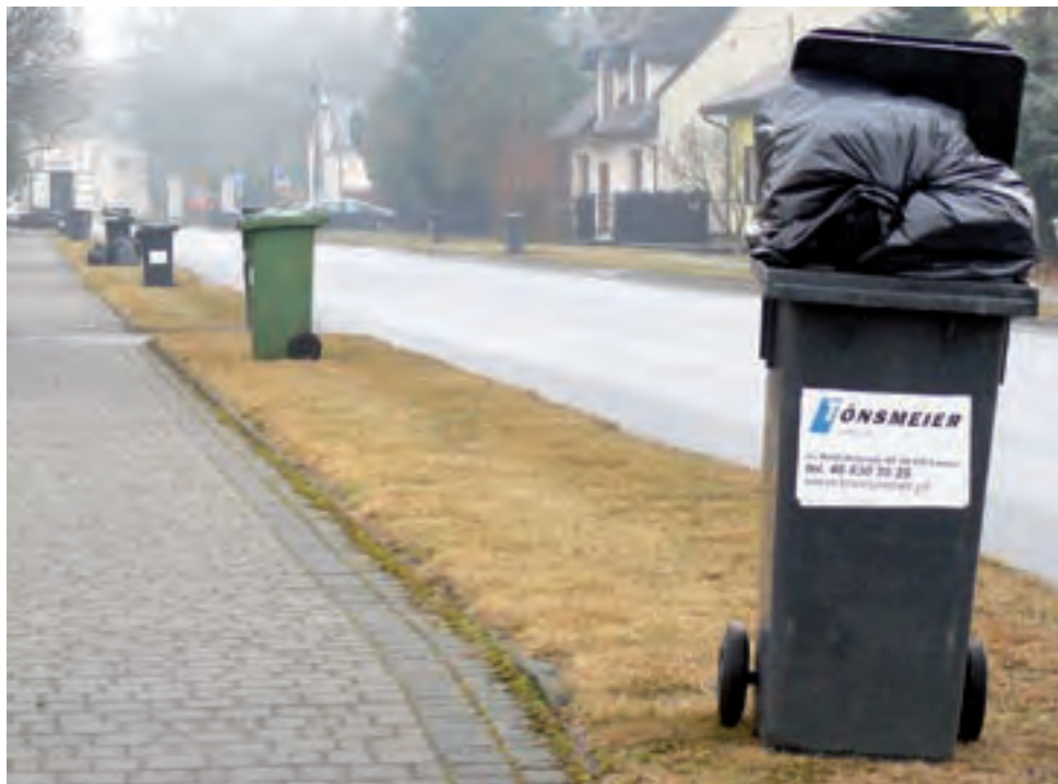
Kosze na śmieci ustawione wzdłuż Alei Legionów w Nieborowie.

nić, nie mamy alternatywy. Nie-sprawiedliwym jest to, że obowiązek przyjęcia uchwały spada na radnych, podczas gdy wysokość przyjmowanych stawek tak naprawdę od nich nie zależy.