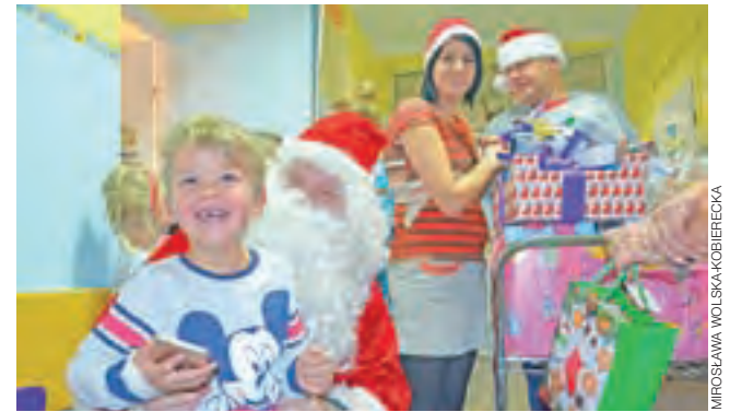
Mikołaj – co widać na zdjęciu – wywołał na twarzach dzieci uśmiech. I na tym organizatorom akcji najbardziej zależało.

Jeszcze w ten sam dzień, późnym wieczorem, na Facebooku GOK Bolimów pojawiła się informacja, że Szkolny Klub Wolontariatu zebrał podczas wydarzenia kwotę 1.836,20 zł. aa