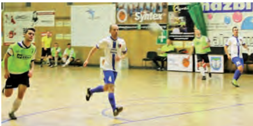
Błękitni Dmosin (biało-niebieskie stroje) przegrali pierwszy mecz.

■ Następna, 9. kolejka odbędzie się w dniach 14-15 grudnia: TKKF Dzikusy II Łódź – Liberto VIP Gwarant, mi...mi... – Dream Team Manekin, XLVII LO Łódź – BestYeah, Stal Volley Głowno – FitFejm, Delia Cosmetics – Jutrzenka Bychlew, Wyborowe – pauza.