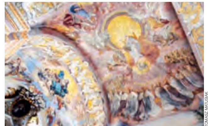
Jeszcze w lipcu konserwator mówił o bliżej nieokreślonej „scenie eschatologicznej”. Po odkryciu całości może już z całą pewnością stwierdzić, że to scena z Apokalipsy św. Jana.

Najdłużej czekaliśmy na odkrycie fresku w nawie bocznej, na zachodniej ścianie kościoła, w miejscu, gdzie przez lata znajdował się ołtarz Przemienienia Pańskiego, który wymaga konserwacji. Po odnowieniu zostanie przeniesio-