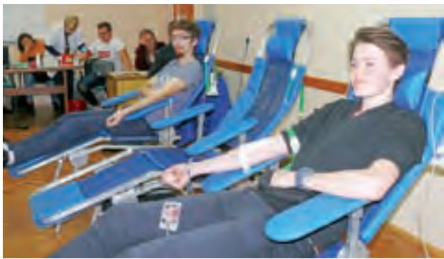
Uczniowie Zespołu Szkół na Blichu w czasie poboru krwi 10 grudnia.

Oddział łowicki PCK nie rezygnuje jednak w kolejnych latach z organizowania w listopadzie