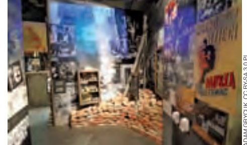
Fragment wystawy poświęcony aprowizacji.