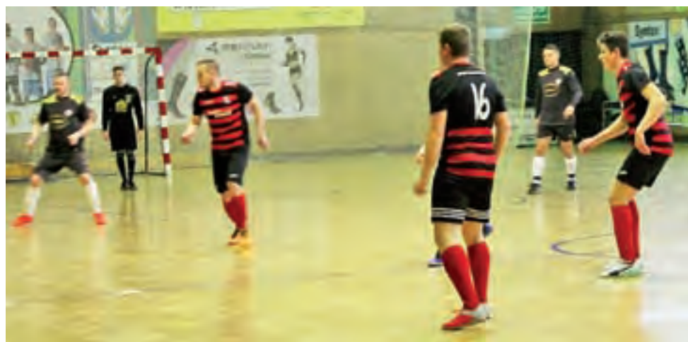
Druga drużyna Dmosina (czarno-czerwone stroje) świetnie sobie radzi na nowym dla siebie szczeblu ŁoLiF.