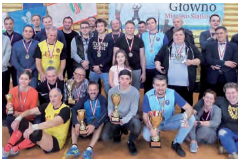
Uczestnicy XXV Samorządowego Turnieju Piłki Siatkowej podczas rozgrywek w głowieńskiej hali.