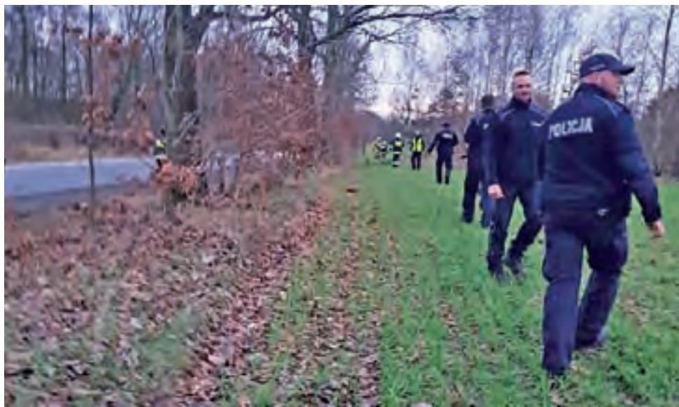
Poszukiwania wzdłuż drogi Dmosin-Nagawki.

Wszystko zaczęło się po godz. 14, gdy policja otrzymała sygnał od rodziny, że 33-latek, ok. godz. 13., oddalił się z miejsca zamieszkania, a to co przedtem powiedział, spowodowało u najbliższych w obawy, że jego życie i zdrowie może być zagrożone, że może trągnąć się na swoje życie.