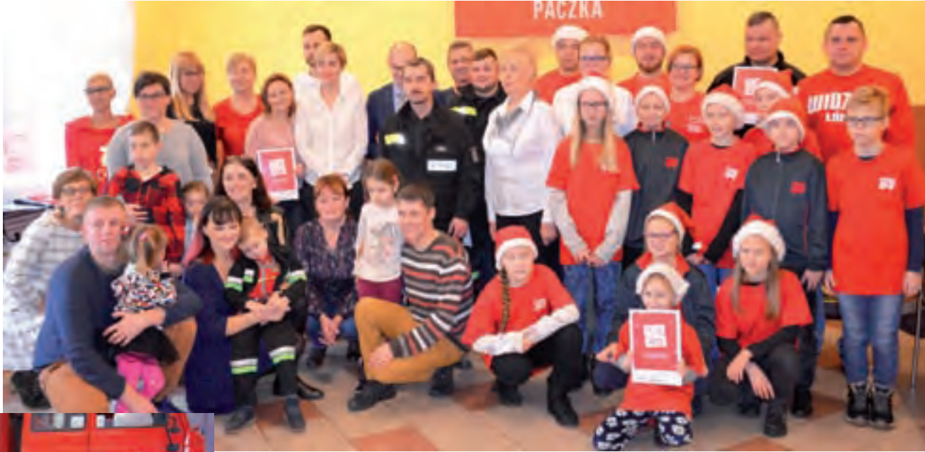
Po części oficjalnej w OSP Stryków, osoby zaangażowane w tegoroczną Szlachetną Paczkę zrobiły sobie pamiątkowe zdjęcie.

Mimo tej trudnej sytuacji, nie załamuje się i wierzy, że przyjdzie taki czas, że nie będzie zależny od