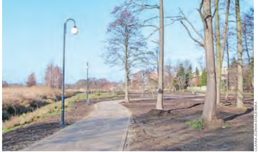
Odcinek ścieżki biegnącej bezpośrednio nad Moszczenicą.