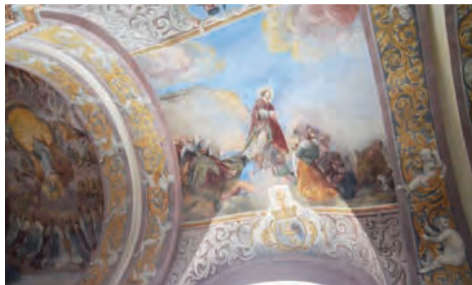
Trudno z całą pewnością stwierdzić, który święty uzdrawia chorych na tym malowidle.

Odsłonięte malowidło przedstawia scenę ekstazy św. Teresy z Avili. Wielka mistyczka z XVI