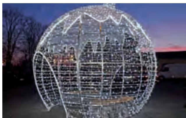
Bombka 3D w ubiegłych latach cieszyła oczy na Pl. Łukasieńskiego.

Drugi aneks, bez przedłużenia terminu, w miniony poniedziałek, 10 grudnia, zawarły już nowe władze gminy i dotyczy on barier ochronnych oraz ułożenia nawierzchni granitowej przy przepustach. Wynegocjowana cena to 13.726,80 zł. ijs