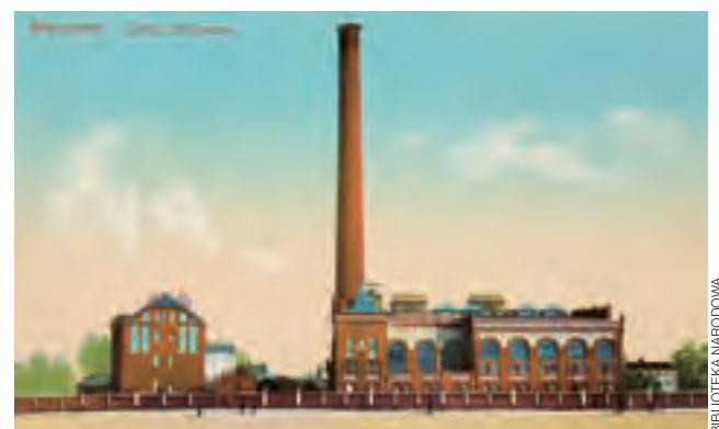
Pocztówka z początku XX w. ze zdjęciem budynku elektrowni tramwajowej w zbiegu ulic Przykopywej i Grzybowskiej na warszawskiej Woli, w 2004 roku zaadaptowanej na Muzeum Powstania Warszawskiego.

Niepodległość to nie tylko stan prawny i faktyczny, odnoszący się do państwa i narodu. To także realny kształt tego narodu, jego świadomości. To wszystko, co trwanie państwa legitymizuje, co kontynuuje go jako moralną jakość, ale także to – a jest to ważne szczególnie w dzisiejszym świecie – co o naro-