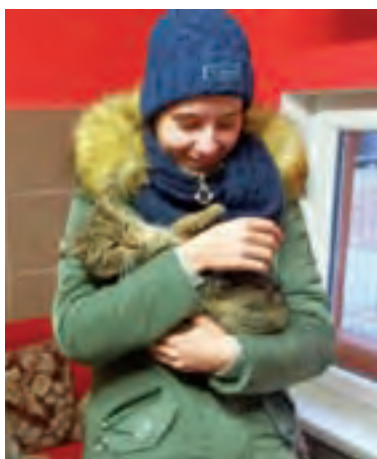
Uczniowie, którzy zawieźli do schroniska prezenty, mieli okazję pomóc w opiece nad zwierzętami.