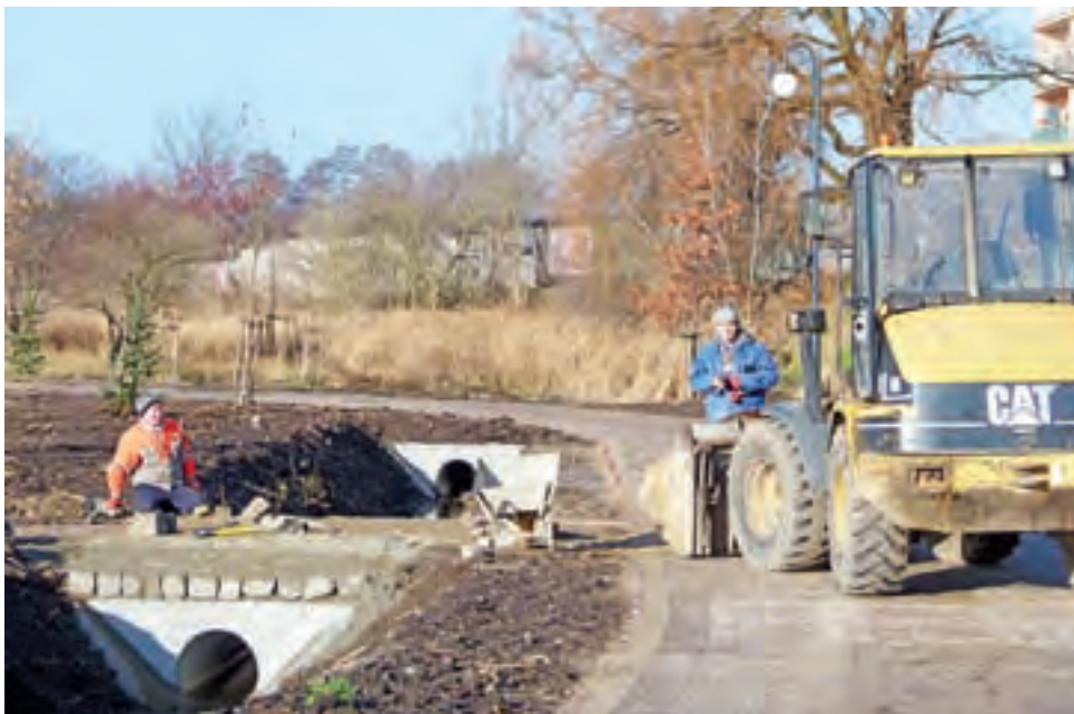
Prace brukarskie w ubiegłym tygodniu finiszowały.

Przypomnijmy, że park nad Moszczenicą to realizowany od 2017 roku zamysł poprzednich władz gminy Stryków, który miał