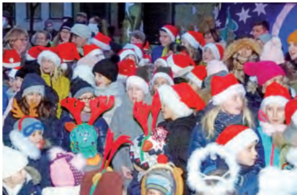
Piknik rozpoczęło Aniołkowe Granie, podczas którego dzieci wykonały kilka świątecznych piosenek.

Nad animacjami umilającymi czas po występach czuwali skrzat