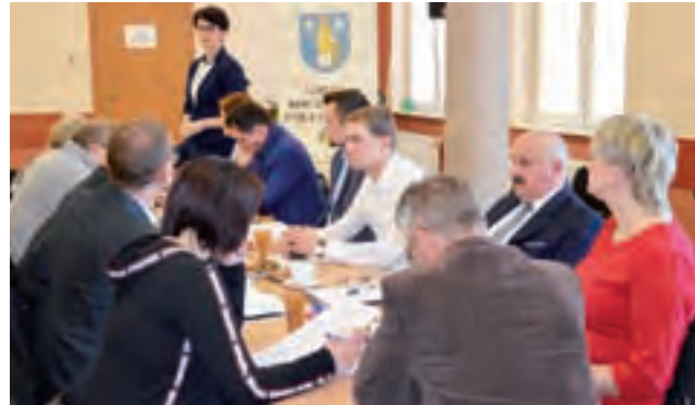
Na sesji Rady Gminy Kocierzew Płd. podwyżka za śmieci została przyjęta, ale tylko 4 głosami „za”, przy 2 przeciwnych i 9 wstrzymujących się.

Obecnie w województwie łódzkim obowiązuje plan gospodarki odpadami dla województwa łódzkiego na lata 2016-2022 (z uwzględnieniem lat 2023-