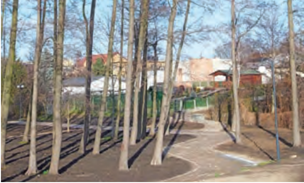
Widok na ścieżki spacerowe od strony drogi krajowej nr 14.