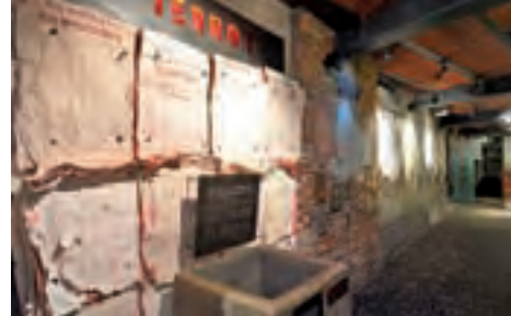
Ekspozycja Muzeum Powstania Warszawskiego.