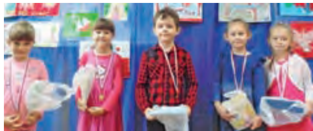
Laureaci konkursu patriotycznego. Oto autorzy nagrodzonych prac.