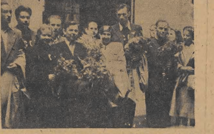
Tenisści radzieccy przed „Grand Hotelem” w Łodzi

BERLIN (PAP). — Jak podaje dziennik „Neues Deutschland”, w Niemczech Zachodnich odbywają się intensywne przygotowania militarne. W celu uzbrojenia Niemiec Zachodnich imi: talisai amerykańscy wykorzystują klikę zdrajców narodu niemieckiego w Bonn.