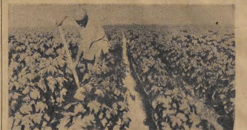
Czasowy kanał na plantacji bawełny w kolchozie im. Stalina (Turkmenia).

Nowy system ma na celu stworzenie obfitości produktów rolnych na potrzeby mas pracujących. Jest on wymownym dowodem pokojowych dążeń kraju radzieckiego. Dążenia te odpowiadają dążeniom wszystkich uczciwych ludzi na całej kuli ziemskiej, którzy kładą dziś swe podpisy pod Apellem Sztokholmskim.