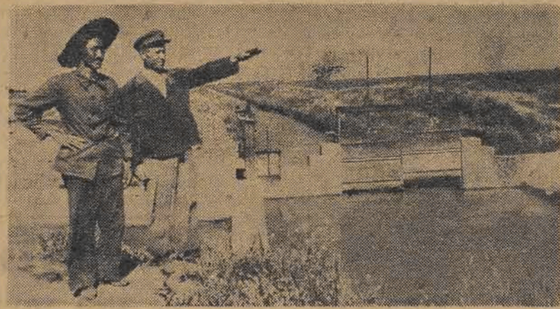
System irygacyjny w kolchozie „Gwiazda Polarna” (obwód Taszkiencki)

podniesie poziom kultury rolnictwa socjalistycznego