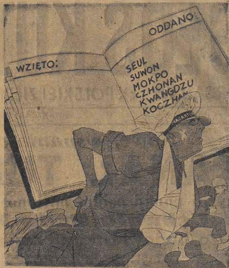
Amerykańska „podwójna buchalteria” (Krokodil).

W budowie wielkich urządzeń weźmie udział cały kraj radziecki. Niebawem entuzjazm ogarnie milionowe masy pracujące ZSRR, które na troskę partii bolszewickiej i rządu radzieckiego odpowiadają nowymi sukcesami produkcyjnymi we wszystkich dziedzinach socjalistycznego budownictwa.