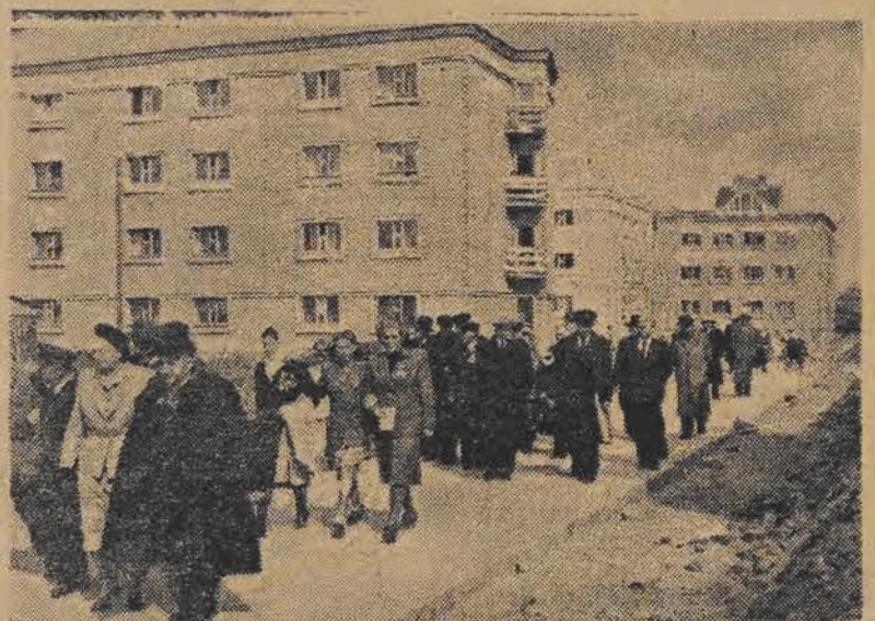
Wycieczka kolchoźników radzieckich przebywających w Polsce zwiedziła Warszawę. Na zdjęciu — uczestnicy wycieczki na robotniczym osiedlu mieszkaniowym Muranów C.

PRAGA (PAP) — Jak donosi korespondent Agencji Telepress z Nowego Jorku, duch bojowy wojsk południowo - koreańskich tak dalece upadł, że Amerykanie rozpuszczają oddziały południowo - koreańskie i wcielają poszczególnych żołnierzy do jednostek amerykańskich. Do każdego południowego Koreańczyka przydzielony jest żołnierz amerykański, który ma obowiązek śledzenia go na każdym kroku.