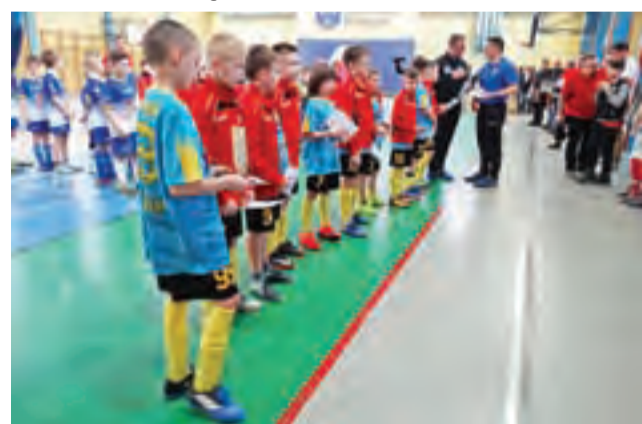
Drużyna chłopców KS Żychlin (rocznik 2008) brała udział w Turnieju Halowej Piłki Nożnej Termy Cup w Uniejowie.