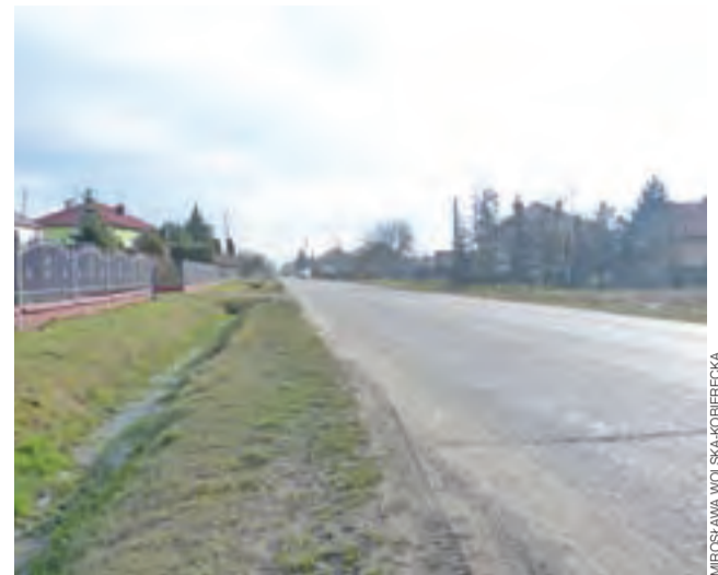
Janowice, położone między Bednarami a Nieborowem