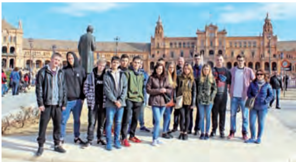
Grupa 16 uczniów i 2 nauczycieli z ZS w Żychlinie podczas zwiedzania Sewilli.

To pierwsza grupa uczniów ZS, którzy w ramach programu Erasmus+ byli na praktykach w Hiszpanii. Kolejna grupa, 10 informatyków i 8 mechaników, wyjedzie 19 maja i wróci 3 czerwca. Ostatnia, trzecia grupa 14 uczniów, mechaników samochodowych, pojedzie na praktyki zawodowe do Sewilli w lipcu. ■