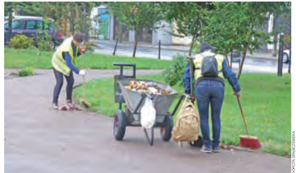
W 2018 roku Powiatowy Urząd Pracy w Kutnie dostał dużo mniej pieniędzy na aktywne programy walki z bezrobociem, a to oznacza, że UG w Żychlinie zatrudni dużo mniej pracowników w ramach robót publicznych niż w roku 2017.

Samorządowcy z powiatu kutnowskiego bardzo preferowali zatrudnienie w ramach robót publicznych, bowiem na pracę mogły liczyć osoby długotrwale bezrobotne, a tych w każdej z gmin jest najwięcej. Dodatkową zachętą był fakt, że efektywność zatrudnienia wynosiła tylko 10 proc., co