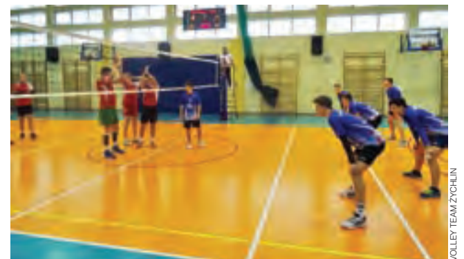
Spotkanie drużyny Akademii Siatkówki Volley Team Żychlin, grającej w III lidze mężczyzn KALS.