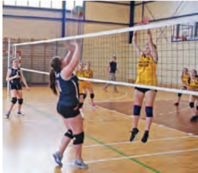
Rozgrywki siatkarskie dziewcząt pomiędzy drużynami Gimnazjum Żychlin a Gimnazjum Strzelce.