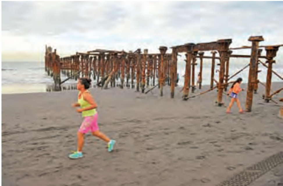
Plaże w Ameryce Środkowej, choć ciekawe, świecą często pustkami. Turyści omijają ten Salwador szerokim łukiem.

krwawe, a kto tylko rozmazane i nieczytelne. Walka o newsa jest tu na wysokim poziomie, a krew i tragedia mają swoją wysoką pozycję. Spoglądam jednak z balkonu kawiarni i widzę codzienność. Dziadek zabawia prześliczną wnuczkę, licealiści całują się na ławce, ktoś robi selfie z kotem, a świadkowie Jehowy zagadują dyskretnie kolejnych zaskoczonych przechodniów. Nie ma o tym w gazetach, nie mówią o tym w telewizji. Temat się nie sprzedaje, firma nie kupi reklamy, pan, pani, państwo nie przełączą na wiadomości i nie sięgną po tytuł. Lepiej rzucić mięso, mięso zawsze się sprzedaje. Świat latino jest przecież mięsożerny... ■