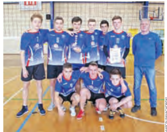
Reprezentacja chłopców Gimnazjum w Żychlinie wywalczyła 1. miejsce.