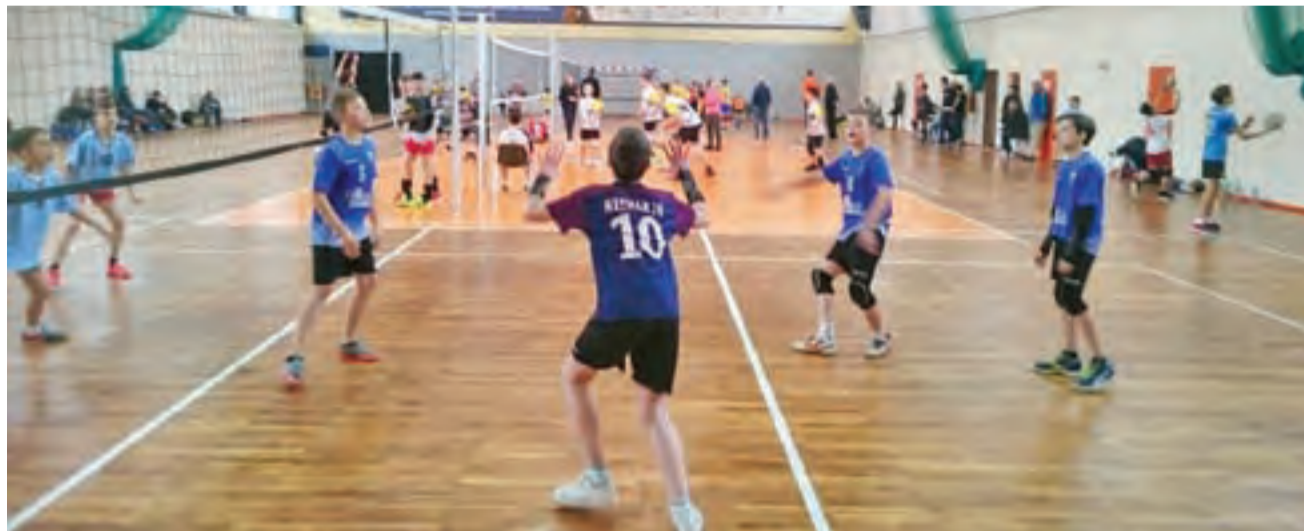
Młodzi siatkarze Volley Team Żychlin wzięli kolejny raz udział w lidze mini siatkówki woj. łódzkiego

Nowy Łowiczanie Tygodnik Ziemi Łowickiej członek Stowarzyszenia Gazet Lokalnych