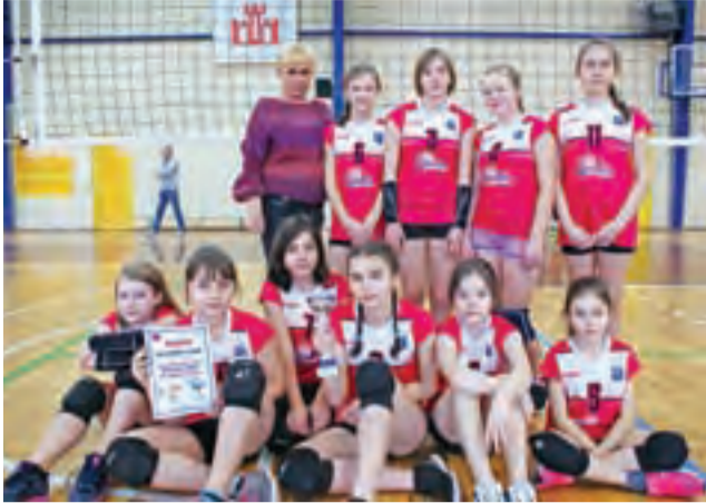
Reprezentacja dziewcząt Szkoły Podstawowej Nr 2 w Żychlinie wywalczyła pierwsze miejsce w Finale Powiatowym w mini piłce siatkowej.