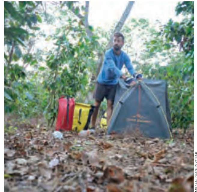
Nocleg w ogrodzie kawowym to jedna z częstych atrakcji podróży po Ameryce Środkowej.

Droga prowadzi mnie gładko przez Sonsonate i przepięknie położone Jezioro Coatepeque, do jednego z trzech, największych miast kraju, Santa Ana. Nazwę wzięło od najwyższego, liczącego 2381 m n.p.m., jednego z trzech mieszczących się po sąsiedzku wulkanów. W mieście mają swoje siedziby uczelnie, zarabia się tam spore pieniądze, a w parkach i na basenach spędza się spokojnie czas. Życie, choć w polskim ministerstwie trudno w to pewnie uwierzyć, płynie tu standardowo przyjemnie. By wyjaśnić jednak, skąd bierze się zła fama kraju, wchodzę rano do pierwszej z brzegu kawiarni i sięgam po pierwszy z brzegu dziennik. „Ciągnęli jego ciało za samochodem!” – krzyczy z pierwszej strony gorący tytuł. Fotografia wymowna: ciało z foliową torbą na głowie i rękoma przywiązanymi do stóp powrozkami leży na ulicy. Z reklamówki wylewa się krew, jeansy starte od bioder w dół. Obok policjant z dochodzeniówki notuje coś w swoim dzienniku. Ktoś widocznie nie zapłacił, ktoś zapomniał o terminie, ktoś myślał, że jest cwańszy. Narcos znów na fali. Komentant wypowiada się na temat zwłok, a fotografie przybliżają wstrząśniętym czytelnikom obraz tego, co mogło się tam wydarzyć. Odwracam stronę. To samo. Kon-