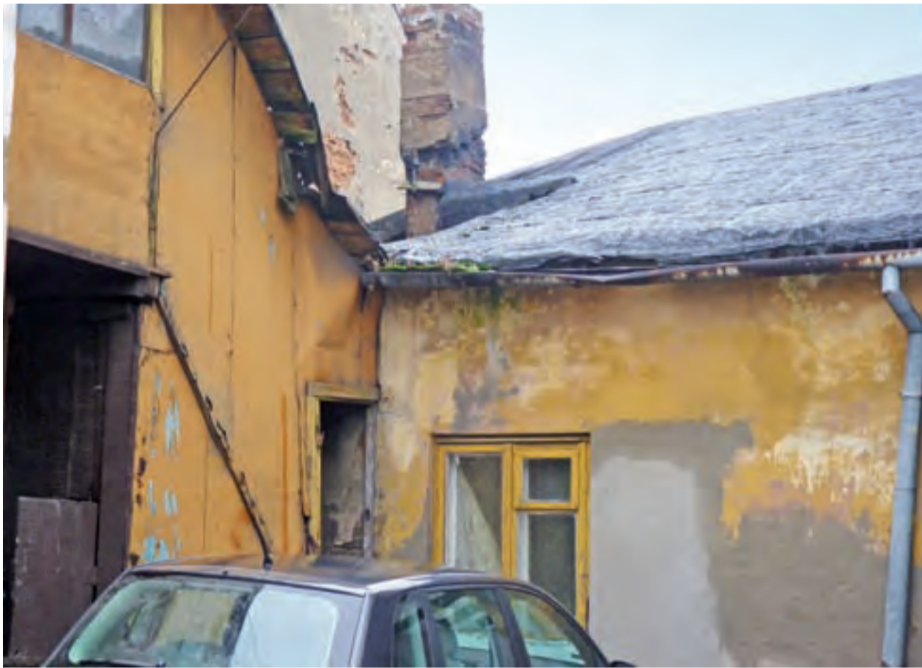
Kamienica pomiędzy Jana Pawła 17 i 29 Listopada 24 grozi zawaleniem. Mieszkańcy proszą o interwencję, by nie doszło do nieszczęścia. Tylko patrzeć jak fragment tynku spod rynny runie na ulicę.