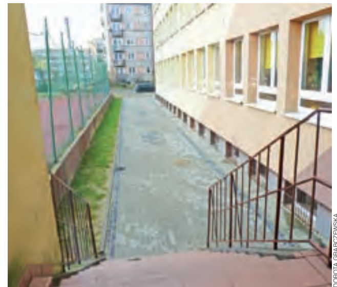
Spacerownik z kostki polbrukowej zrobiono od strony wschodniej ZSP nr 2 po odwodnieniu piwnic.

Z badań w ramach diagnostyki nowotworu piersi uczestniczą kobiety w wieku 50-69 lat. Badania mammograficzne są wykonywane za darmo, a pacjentkom zwracany jest koszt dojazdu. Badania cytologiczne wczesnego wykrywania raka szyjki macicy wykonywane za darmo u kobiet w wieku 25-69 lat, zwracany jest koszt dojazdu. dag