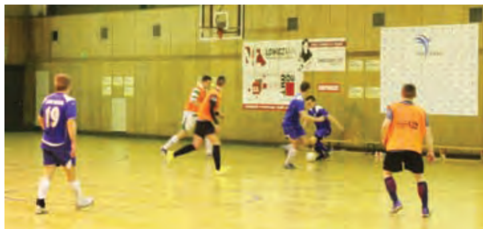
Zespół Jurny Gladiator Żychlin zakończył rozgrywki w II Julomax łowickiej lidze futsalu na siódmym miejscu.