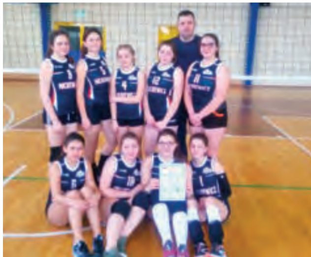
Reprezentacja dziewcząt Gimnazjum w Żychlinie.

Tytuł mistrzowski zdobyli po raz kolejny uczniowie Gimnazjum z Żychlina (po raz szósty z kolei i po raz dziesiąty w ciągu ostatnich jedenastu lat) i to oni reprezentować będą powiat kutnowski w turnieju półfinałowym mistrzostw województwa w Rawie Mazowieckiej.