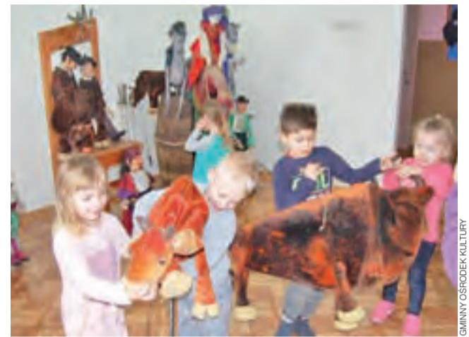
Dzieci chętnie oglądają wystawę lalek i dekoracji z Arlekina.