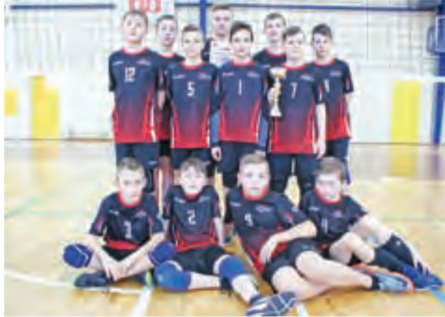
Reprezentacja chłopców Szkoły Podstawowej Nr 2 w Żychlinie, która zajęła również pierwsze miejsce.