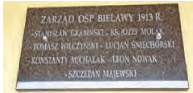
Pierwszy zarząd OSP Bielawy uwieczniony. Na murze strażnicy zamontowano tablicę, którą odsłonięto i poświęcono 3 lutego.

Podczas zebrania sprawozdawczego, które odbywało się 3 lutego w sali konferencyjnej Urzędu