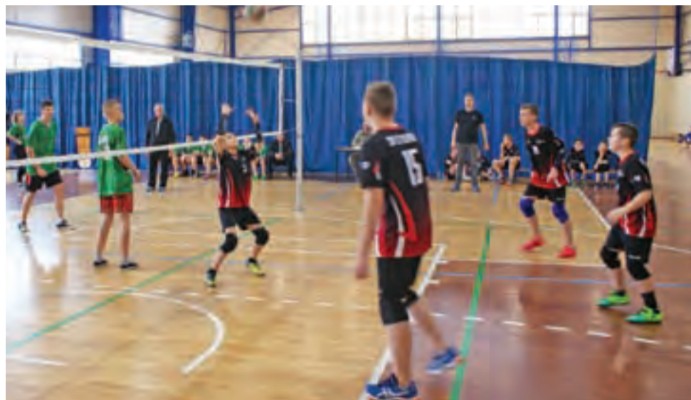
Meczów chłopców podczas Finału Powiatowego w mini siatkówce.