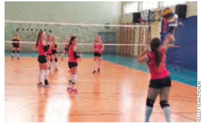
Drużyna Volley Team Żychlin podczas sobotniej kolejki Ekstraklasy KALS kobiet wygrała obydwa mecze, tym samym awansując na trzecie miejsce w tabeli.