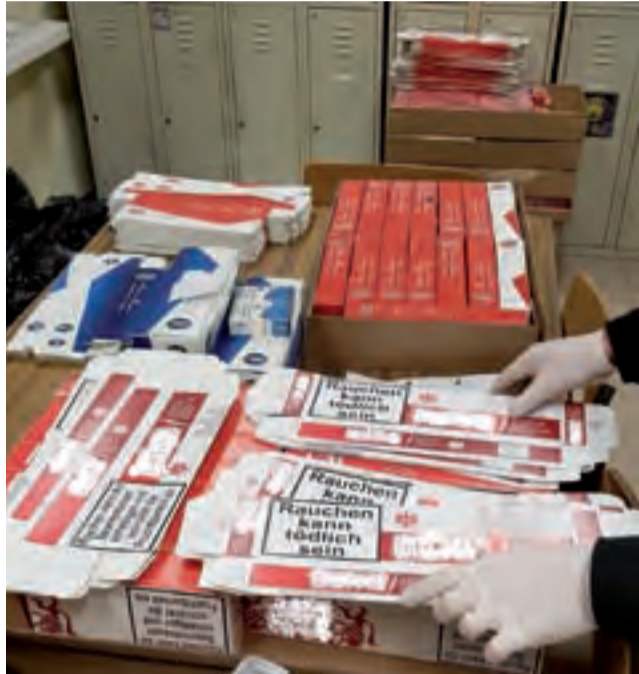
Za transport trefnych papierosów został zatrzymany 35-letni mieszkaniec gminy Żychlin.

– 5 marca 2018 r. pół godziny po północy dyżurny kutnowskiej komendy otrzymał zgłoszenie, że na jednej z ulic w Kutnie dwie osoby chowają do srebrnego auta kartonowe pudełka ukryte w krzakach – informuje Edyta Machnik, rzecznik KPP w Kutnie. – Na miejsce natychmiast został skierowany patrol policji, który zatrzymał do kontroli kierowcę srebrnego pojazdu. Funkcjonariusze