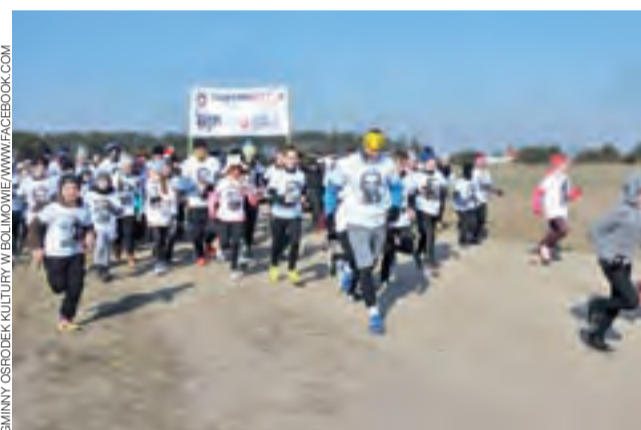
Uczestnicy biegu Tropem Wilczym w Bolimowie ruszyli na trasę.

komendanci bądź przedstawiciele wszystkich współpracujących ze szkołą służb mundurowych. Kadeci zaprezentowali przed gośćmi swoje najważniejsze dokonania i sukcesy oraz zdobyte w ciągu nauki w szkole umiejętności. tm