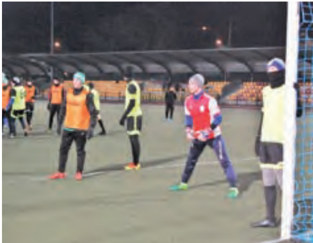
Mimo niekorzystnej temperatury juniorzy Pelikana zagraли z Mazovią.