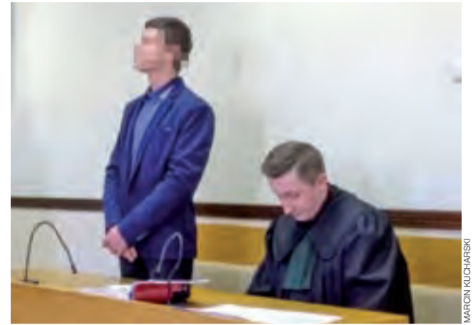
Oskarżony o zabicie psa odmówił składania wyjaśnień przed sądem. Odpowiadał wyłącznie na pytania swojego adwokata.