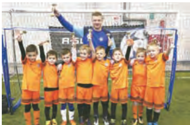
Gracze Soccer Kids 2010 z pamiątkowymi statuetkami.