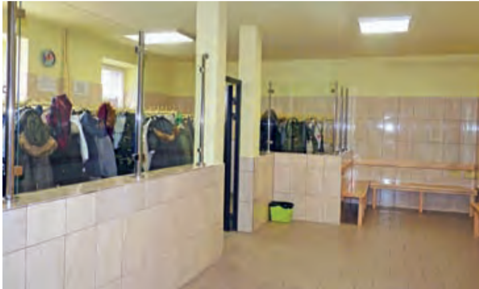
Tak wygląda pierwsza wyremontowana szatnia w budynku przy ulicy Łukaszińskiego.

Stare tynki zostały skute, ułożone nowe. Na wysokość ok. 2 m ściany wyłożono glazurą, łatwą w utrzymaniu w czystości. Zamontowano oświetlenie LED. Wybu-