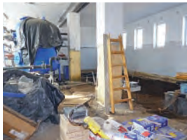
Tak wygląda w środku modernizowana Stacja Uzdatniania Wody w Głuchowie, której budowa miała zakończyć się do 28 lutego.