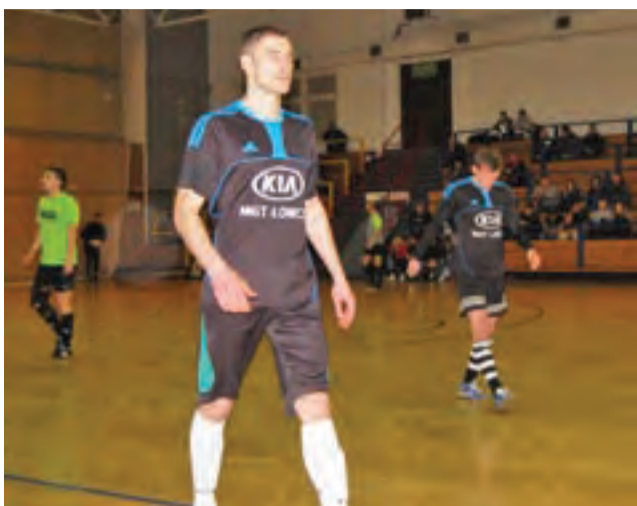
Drużyna KIA Łowicz wygrała w tym sezonie wszystko co tylko mogła wygrać.

W Wielkim Finale nie brakowało emocji. Jako pierwsi na prowadzenie wyszli nieoczekiwanie Blokiersi, których na prowadze-