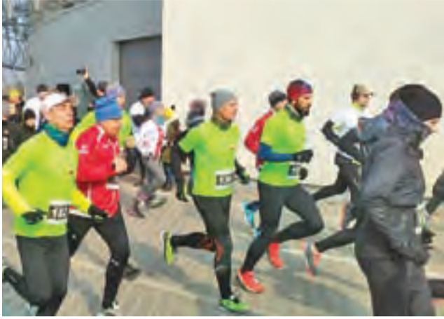
Rozbiegani Żychlin na trasie 6-kilometrowego IV Biegu Wilczym Tropem w Plocku.