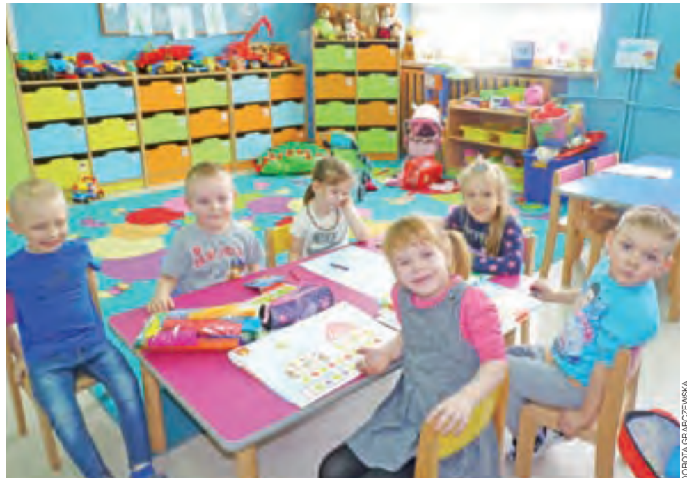
Miejsc w żychlińskich przedszkolach nie zabraknie. W SP w Grabowie w oddziale przedszkolnym będzie od września 100 miejsc dla przedszkolaków. Na zdjęciu przedszkolaki z najmłodszej grupy w Grabowie.

Do 13 kwietnia rodzice muszą potwierdzić na piśmie wolę pobytu dziecka w placówce. dag