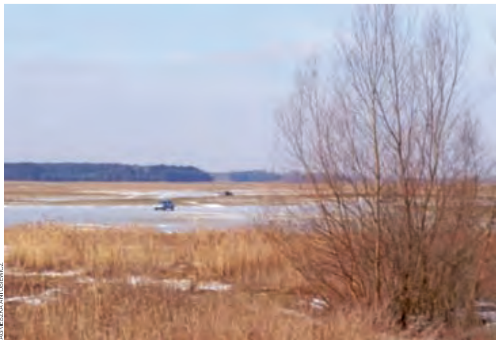
Samochody jeżdżące na lodzie na rozlewiskach Bzury w okolicach mostu na DK 14.

Policja nie jest w stanie monitorować wszystkich takich terenów, dlatego komendant apeluje o zdrowy rozsądek i przestrzega przed jazdą po zamrzniętych rozlewiskach – która w jego ocenie – jest wyrazem braku odpowiedzialności. mwk