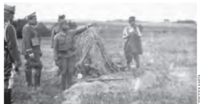
Okolice Warszawy, sierpień 1920. Gen. Józef Haller (drugi z lewej) na stanowiskach Poznańskiej Dywizji.

■ 16 sierpnia 1920 – z rozkazu Naczelnego Wodza Józefa Piłsudskiego wojska polskie rozpoczynają kontruderzenie na tyły Frontu Zachodniego wojsk bolszewickich. Maurycy Zamoyski