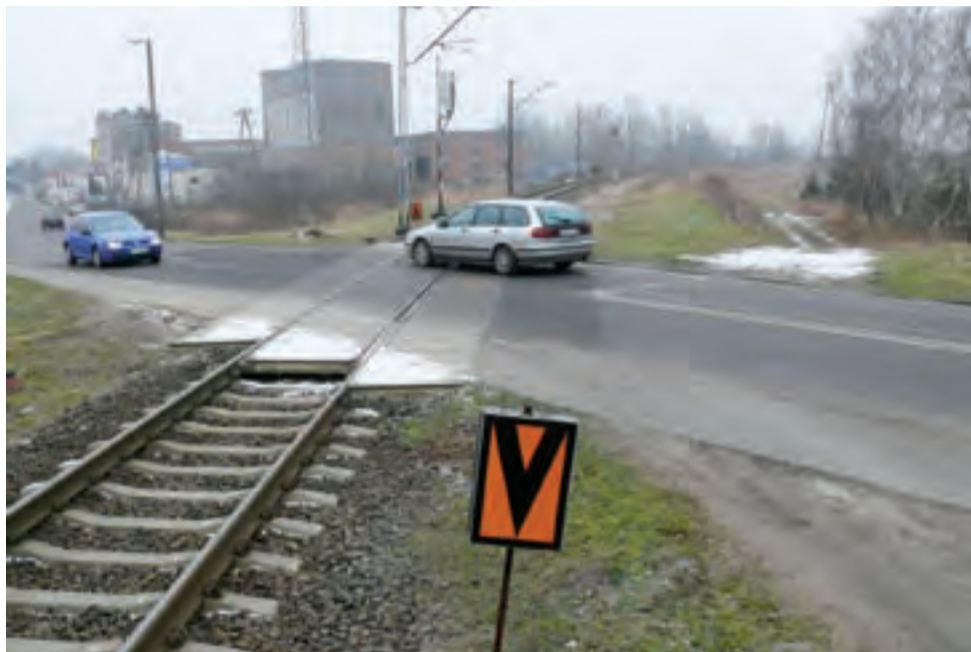
Tory, jak i przejazd kolejowy w ul. Klickiego, zostaną przesunięte o 40 m na wschód, wówczas powstanie miejsce, w którym mogłoby się zmieścić skrzyżowanie z nową drogą (na zdjęciu po drugiej stronie ulicy).