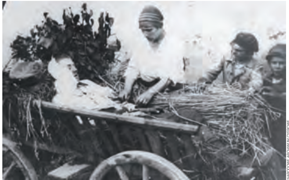
Okolice Radzimina, 15 sierpnia 1920. Kobieta opatruje żołnierza rannego podczas walk polsko-bolszewickich.