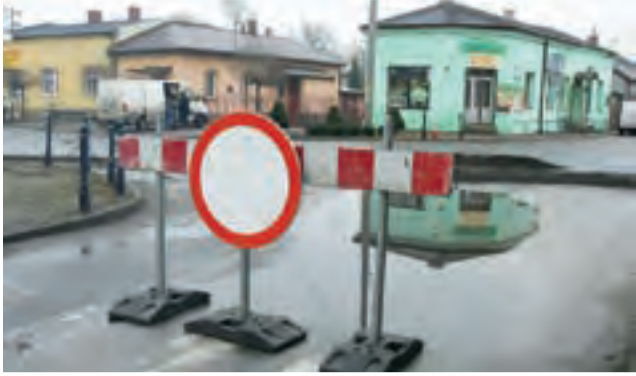
Centrum Bielaw. Droga jest odcinkowo wyłączana z ruchu.