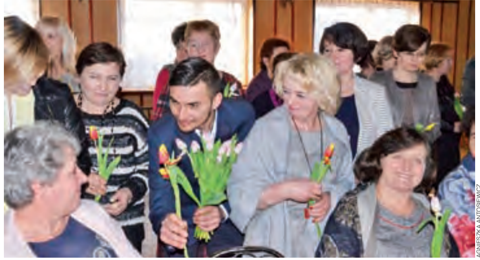
Podczas spotkania KGW w Złakowie Kościelnym delegacja druhowów złożyła paniom wizytę i każdej z nich wręczyła po tulipanie.

Organizatorem spotkania jest KGW, ale miejscowa straż dofinansowuje zakup prezentów dla kobiet. Komitet organizacyjny do ostatniej chwili utrzymywał w tajemnicy co jest w tajemniczych pudełkach, a ich wręczenie odbyło się dopiero podczas imprezy. W tym roku każda z pań otrzymała komplet talerzy. Wśród gospodyń dało się usłyszeć, że to bardzo trafiony prezent. aa