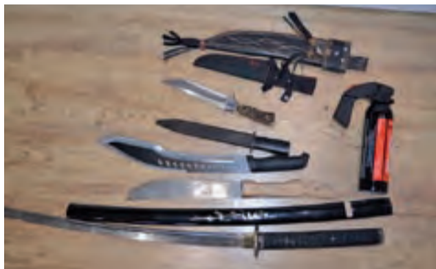
Maczety, noże, gaz paraliżujący oraz kamizelki kuloodporne zabezpieczono podczas przeszukań samochodów i mieszkań.

Ta sama Warmińsko-Mazurska Straż Graniczna w kwietniu 2017 roku zlikwidowała również wytwórnice papierosów w Woli Kałkowej w gminie Bedno, o czym pisaliśmy wtedy obszernie na łamach NŁ. Wówczas zabezpieczono towar o wartości 2,5 mln zł,