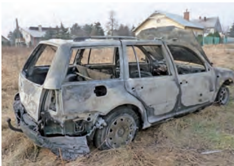
Volkswagen Golf należący do mieszkańca Łowicza całkowicie spłonął w Oporowie.

Niestety, ogień strawił dokładnie cały samochód. Na szczęście młodym ludziom podróżującym autem nic się nie stało. W poniedziałek po południu wrak pojazdu