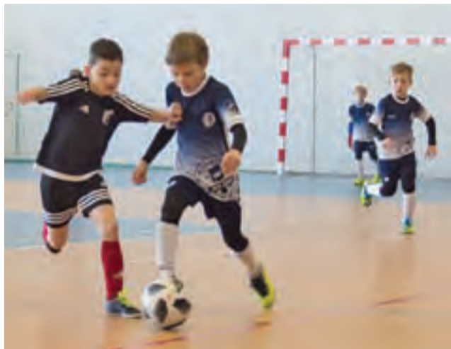
W niedzielnym turnieju Soccer Kids Cup najlepsi okazali się gracze UKS SMS Łódź.