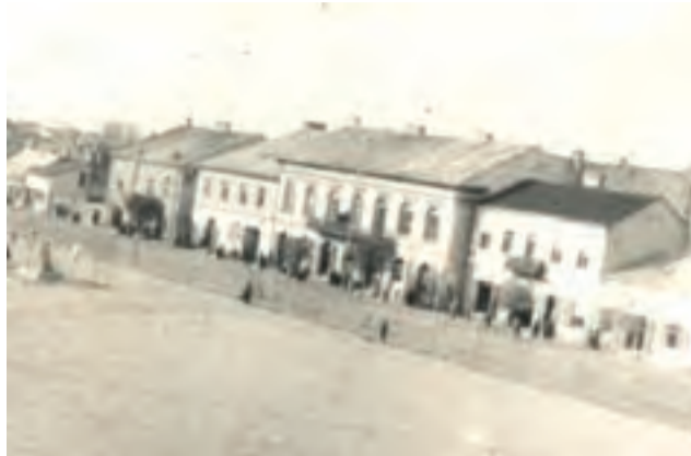
Nowy Rynek w pierwszych latach okupacji niemieckiej. Widać plot oddzielający główną przestrzeń rynku od getta żydowskiego.

Zaledwie 80 lat temu i Polska i nasze miasto wyglądały odmiennie – składały się w znacznym procencie z ludzi innych kultur i wyznań, wśród których byli przede wszystkim Żydzi.