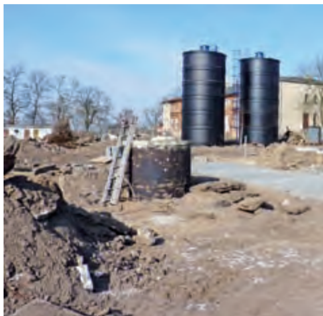
Teren wokół modernizowanej SUW w Głuchowie, jak i w Orłowie Parceli, to wciąż duże place budowy.

Roboty wykonuje firma Markostal, która na plac budowy weszła dopiero pod koniec września. Aura od początku nie sprzyjała wykonawcy. Najpierw były ulewne deszcze, które uniemożliwiały wykonywanie jakichkolwiek