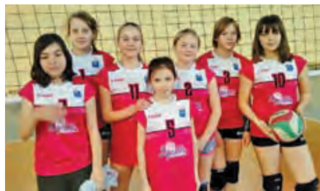
Reprezentacja Akademii Siatkówki Volley Team Żychlin z SP Nr 2 w Żychlinie w wojewódzkich rozgrywkach mini siatkówki "4" dziewcząt.