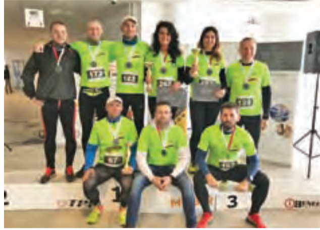
Grupa Rozbieganych Żychlin biorąca udział w tegorocznym Biegu Wilczym Tropem w Plocku.