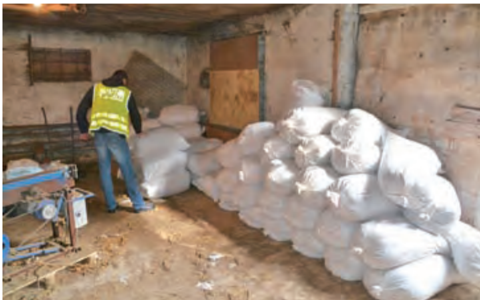
Rozpracowywanie łódzkiej grupy przestępczej rozpoczęło się od akcji zlikwidowania kontrabandy w powiecie zgierskim i grójeckim w lipcu 2016 roku. Wtedy zabezpieczono towar o wartości ponad 10,5 mln złotych.

Członkowie rozbitej grupy przestępczej, za pośrednictwem założonych przez siebie firm z siedzibami na terenie Niemiec i Litwy, sprowadzili do Polski, z Bułgarii i Litwy ponad 165 ton li-