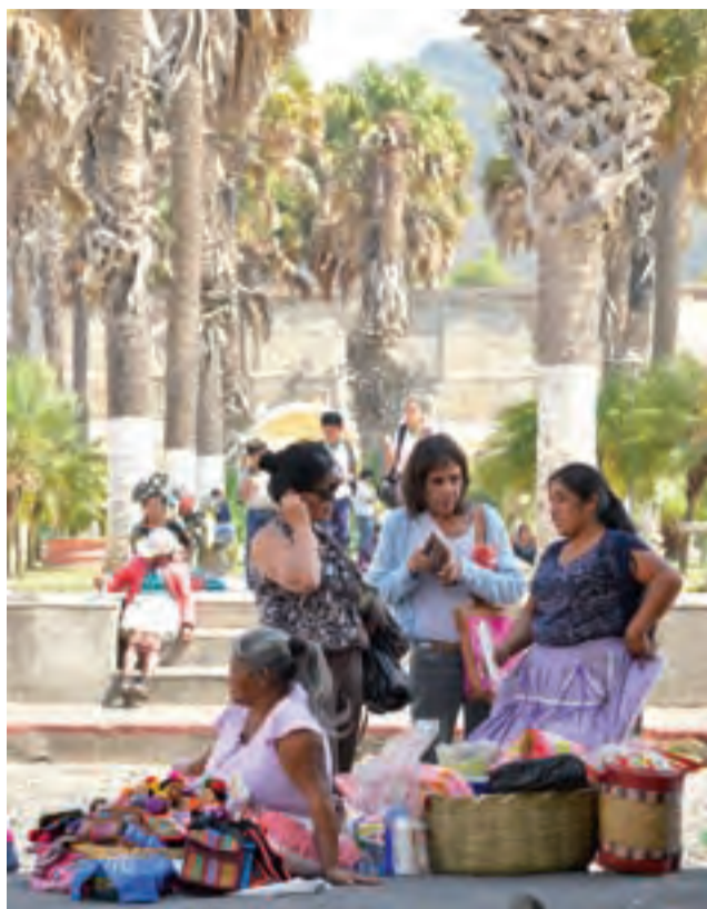
Uliczny handel rzadko podlega kontroli. W ruchliwych miejscach można kupić zarówno rękodzieło, jak i najdoskonalsze smakowite przekąski.

A to brak pozwolenia rządowego na wjazd (dodajmy, że nie ma czegoś takiego jak pozwolenie rządowe na wjazd), to znów ksero paszportu (koniecznie za amerykańskiego dolara), sprawdzanie książeczki szczepień (jak nigdy), czy wpisywanie na listę zdrowia (kierowców transportujących bydło)... Wymyślać można tu godzinami. Dopóki nie będzie zgodzić się pod stołem, dopóty będziesz siedział kolego na betonowej ławce. Pierwszy wjazd zawsze jest najtrudniejszy. Za każdym kolejnym, może (choć nie musi) być już tylko lepiej.