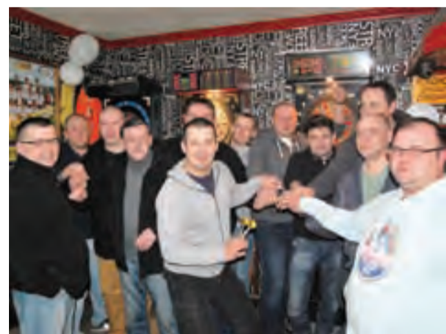
I znowu tłoczno zrobiło się podczas turnieju w darta.

■ Następny mecz: 2018.03.09 (pt.), godz. 18.00: KS Pelikan II Łowicz – KS Stal Głowno (V liga)