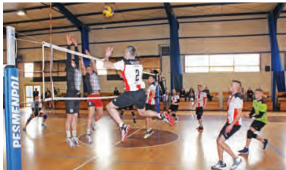
Spotkanie siatkarskie pomiędzy Volley Team Żychlin a Albatros Płock podczas sobotniego turnieju, rozegranego w żychlińskiej hali sportowej.

Szczawin Kościelny 2:1 (25:27, 25:21, 26:24)