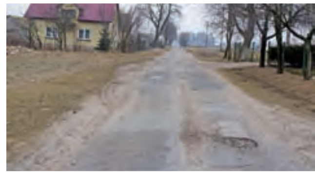
Samorządowcy dołożyli ponad 500.000 zł do remontu drogi Grabie – Oleszcze, która teraz jest w fatalnym stanie.

Krzysztof Anyszka, kierownik ds. inwestycji, wyjaśniał, że kosztorys inwestycyjny na modernizację tej drogi to kwota 1.185.475 zł. – Pomimo że dokładamy ponad 525.000 zł i zabezpieczamy łącznie 998.211 zł, to i tak wynik przetargowy jest poniżej kosztorysu inwestorskiego – mówił. Poza tym, ceny usług wykonawczych z każdym miesiącem idą w górę. Rok temu unieważniliśmy przetarg, a w tym roku i tak rozstrzygnięcie