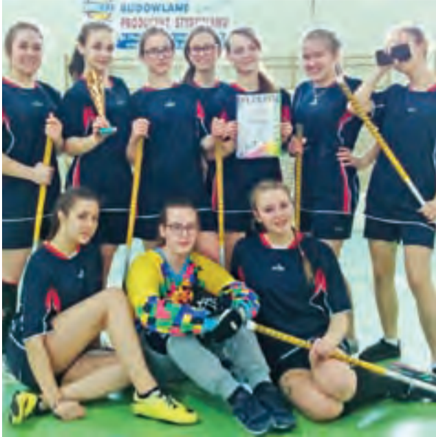
Reprezentacja dziewcząt Gimnazjum w Pacynie, która zajęła trzecie miejsce podczas Mistrzostw w Unihokeju w Gostyninie.