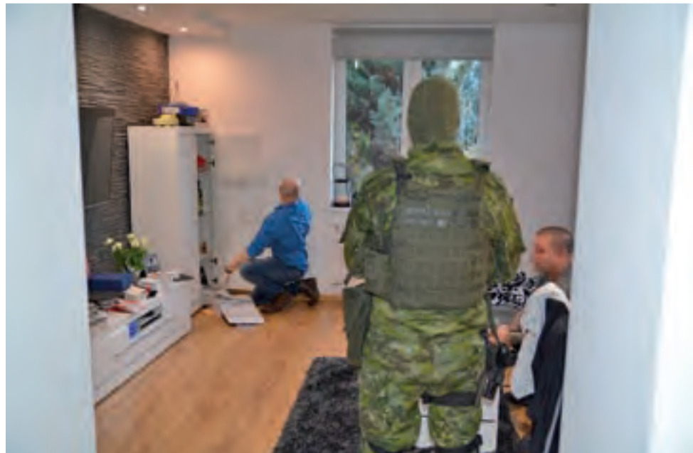
Funkcjonariusze Warmińsko-Mazurskiego oddziału Straży Granicznej podczas przeszukania i zatrzymania jednego z liderów zorganizowanej grupy przestępczej w Konstantynowie Łódzkim.

W tym roku święta Wielkanocne przypadają w dniach 1-2 kwietnia, w sobotę 31 marca będzie święcenie pokarmów, zaś Niedziela Palmowa przypada 25 marca. dag