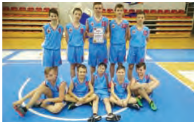
Drużyna chłopców z SP Nr 2 w Żychlinie, którzy zagraли w finale powiatowym w mini-koszykówce w Kutnie.