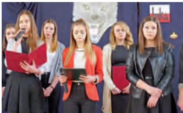
Uczniowie ZSP nr 4 w Łowiczu podczas apelu z okazji Narodowego Dnia Pamięci Żołnierzy Wyklętych.

Uczniowie uczcili pamięć Żołnierzy Wyklętych programem wierszy i piosenek patriotycznych, wykonanych przy akompaniamencie akordeonu i gitary. Mocno wybrzmiało w nich, że w czasach kiedy komuniści pozbywali się ostatnich obrońców niepodległej Polski, wielu partyzantów poległo z bronią w ręku, a innych więziono i poddawano okrutnym torturom. Część z nich zasiadała na ławie oskarżonych w pokazowych procesach, których wynik był z góry przesądzony – natychmiastowa kara śmierci.