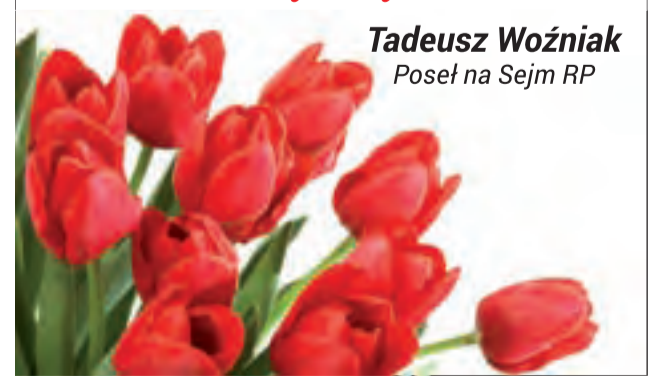
Tadeusz Woźniak Poseł na Sejm RP