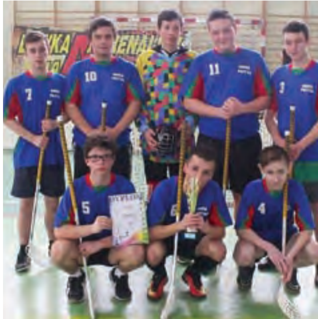
Reprezentacja chłopców Gimnazjum w Pacynie, która zajęła pierwsze miejsce podczas Mistrzostw w Unihokeju w Gostyninie.

Sport szkolny | Mistrzostwa Powiatu w Unihokeju Szkół Gimnazjalnych