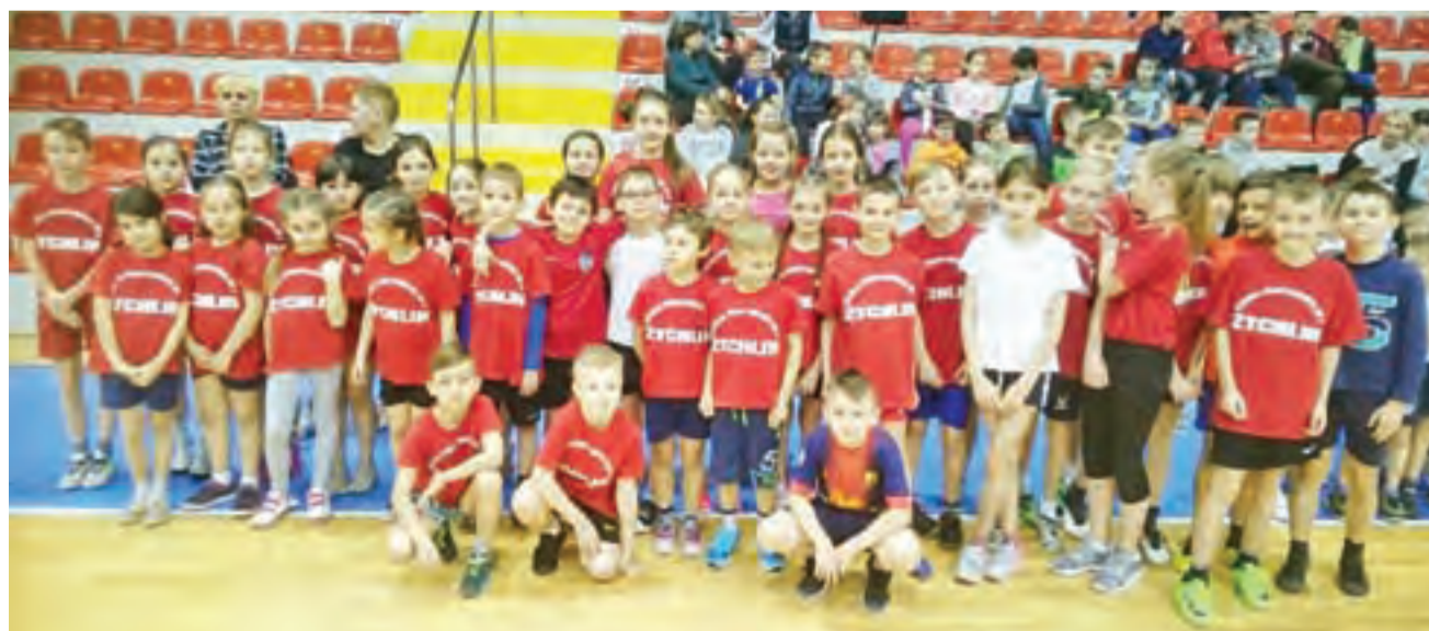
Reprezentacja Szkoły Podstawowej Nr 2 w Żychlinie podczas finału powiatowego konkursu gier i zabaw w Kutnie.

Szkołę Podstawową Nr 2 w Żychlinie reprezentowali: klasa I: