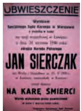
Powojenne obwieszczenie o wykonaniu kary śmierci za zadenuncjowanie Żydów.

– Myślę, że odpowiedź musielibyśmy podzielić na dwie części. Na tę obojętność, czy niechęć aktywnego pomagania, bardzo duży