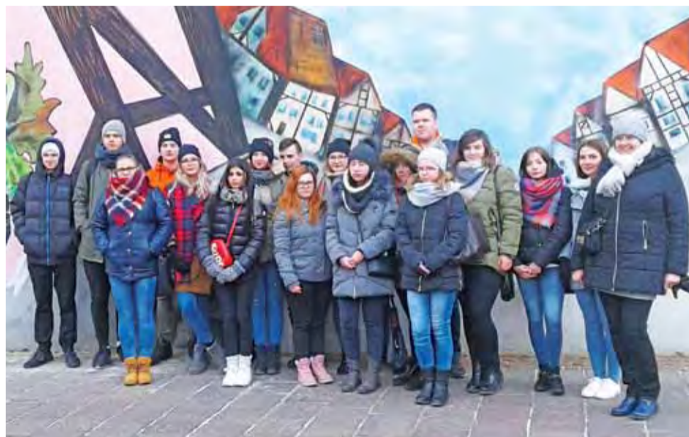
Grupa z ZSP nr 3 w Nienburgu (Dolna Saksonia), mieście, w którym znajduje się ośrodek DEULA.

W Wolfsburgu, w mieście fabryki Volkswagena, zwiedzając hotel pięciogwiazdkowy Superior Plus, mieli możliwość poznania wyposażenia apartamentów dla VIP-ów, obejrzenia muzeum pojazdów oraz nowoczesnego salonu sprzedaży.