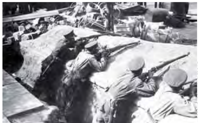
Warszawa, 12-15 maja 1926. Wojsko w okopach podczas przewrotu majowego.

Premier Wincenty Witos Marszałek Rataj przybył do Wilanowa już późną nocą. W rozmowie z nami oświadczył, że nie należało na naszą decyzję, jednak widzi beznadziejność dalszej walki, która, w warunkach wytworzonych, poza rozlewem krwi nic przynieść nie może. Jeśli prezydent i rząd zdecydowali się na ustąpienie, to on mógłby się podjąć pośrednictwa między rządem i Piłsudskim, mimo że dla niego będzie to sprawa bardzo ciężka i przykra. Po złożeniu tego oświadczenia wyszedł, zostawiając nas w pokoju samych. Po jego wyjściu rozpoczęła się ożywiona i szeroka narada. [...] Prezydent Wojciechowski zdecydował się bez namysłu na swoje ustąpienie i doradzał rządowi, ażeby zrobił to samo. Wilanów, 14 maja 1926