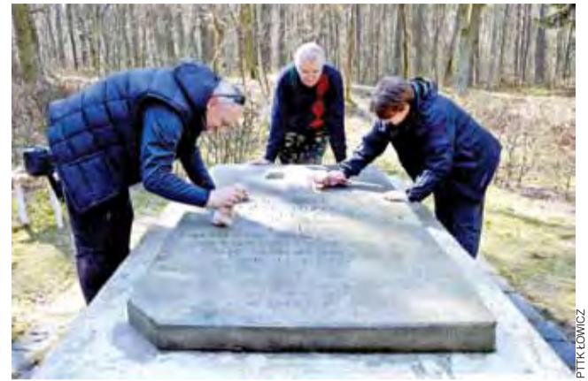
Członkowie łowickiego PTTK oczyszczają mogiłę bojowników PPS.