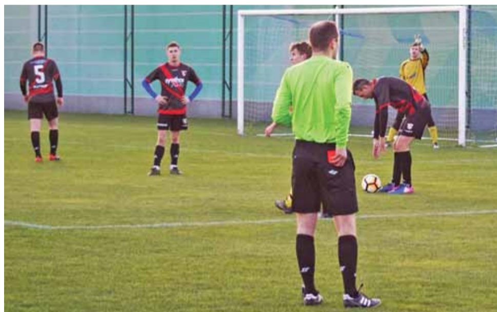
Piłkarze GKS Bedno przegrali 1:0 w wyjazdowym spotkaniu z zespołem Termy Uniejów.

Gospodarze uzyskali przewagę którą udokumentowali strzeleństwem gola w 86 minucie meczu.