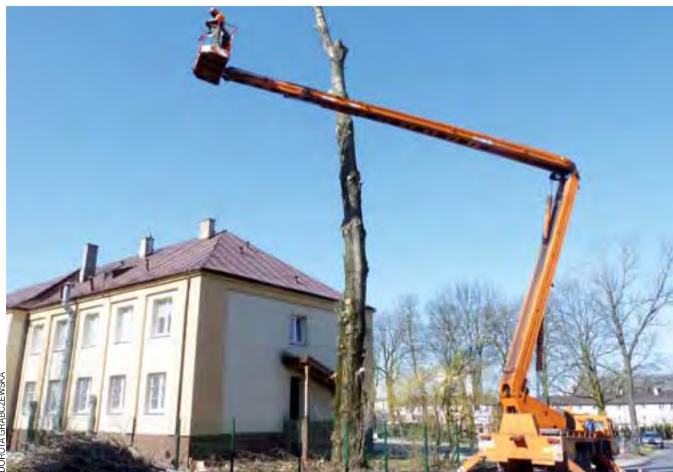
Wycięcie 27-metrowej topoli wymagało sprowadzenia specjalistycznego podnośnika.

W piątek, 6 kwietnia, firma z Gostynina, na zlecenie Starostwa Powiatowego w Kutnie, wycięła 27-metrową topolę rosnącą tuż przy drodze powiatowej, w ulicy Jabłonkowej oraz w bezpośrednim sąsiedztwie wyremontowanego hotelowca Cukrowni Dobzelin.