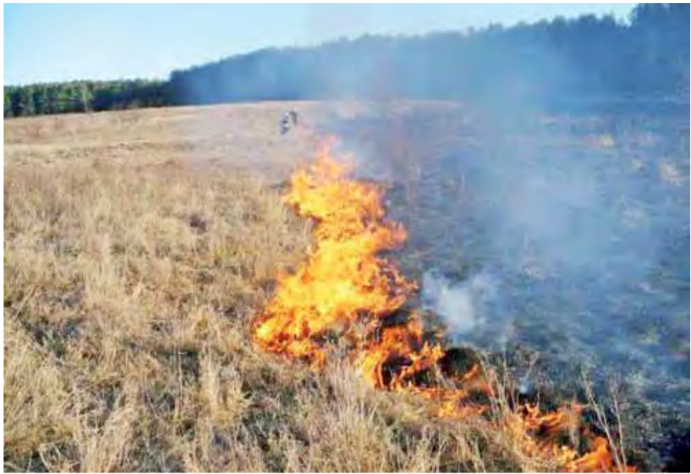
Przy silnym wietrze pożary suchych traw mogą szybko się rozprzestrzeniać.