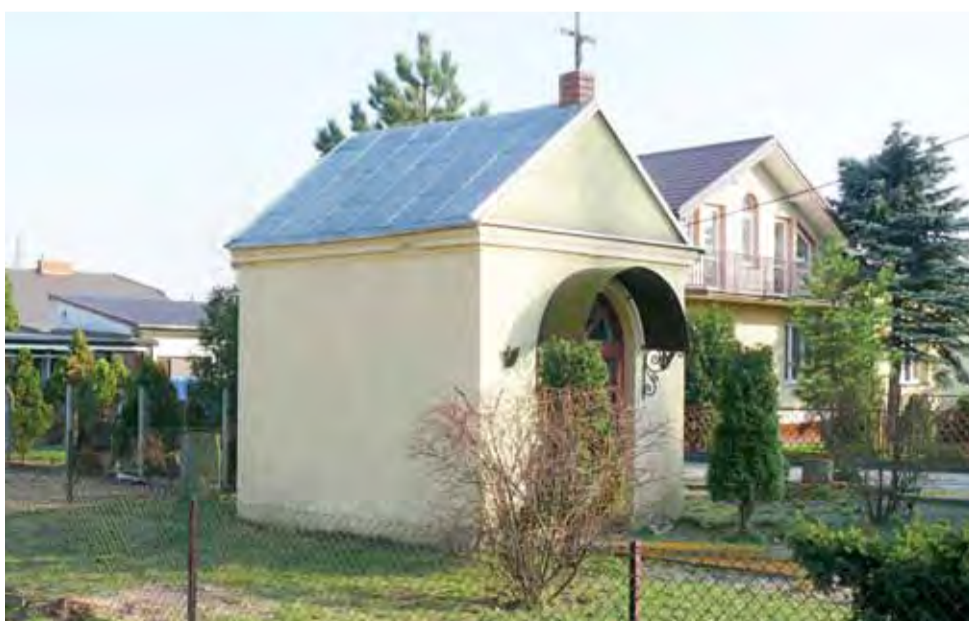
Kapliczka przy ul. Jana Pawła II w Łowiczu, już bez drzew, które rosły po jej obu bokach.