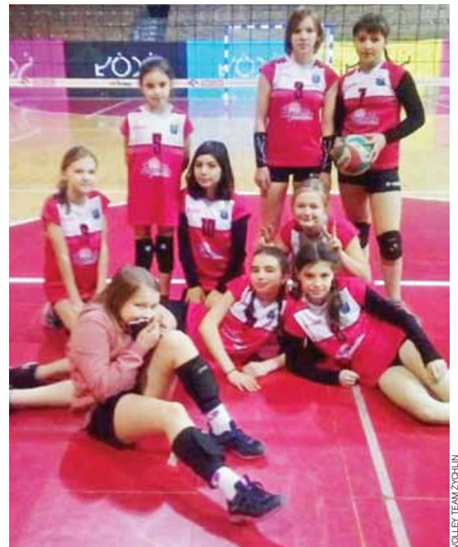
Drużyna młodziczek Volley Team Żychlin awansowała do półfinału wojewódzkiego w mini siatkówce dziewcząt.