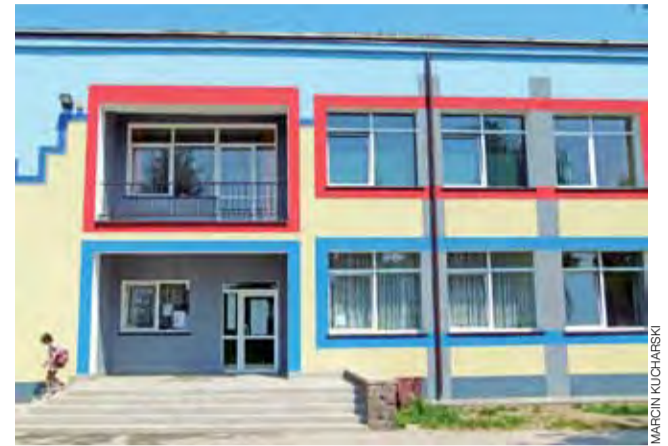
Budynek Szkoły Podstawowej w Osmolinie został przed kilkoma laty docieplony.