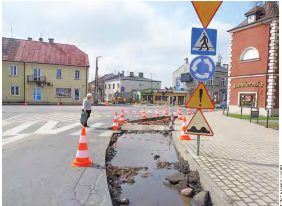
Prace na rondzie zaczęły się we wtorek. Teraz trwają roboty przy robieniu 4 bocznych wysepek, które zostaną wyłożone kostką brukową.

– Wtedy zorganizujemy ruch wahadłowy, ustawimy przenośną sygnalizację świetlną. Szacuję, że utrudnienia potrwają ok. 2 tygodni. Gdy będziemy układać nową nawierzchnię asfaltową, ruch zostanie wyłączony całkowicie na 2 dni. Będą zorganizowane objazdy. I etap inwestycji będzie kosztować prawie 261 tys. złotych. Prace zgodnie z umową mają się zakończyć do 18 maja. dag