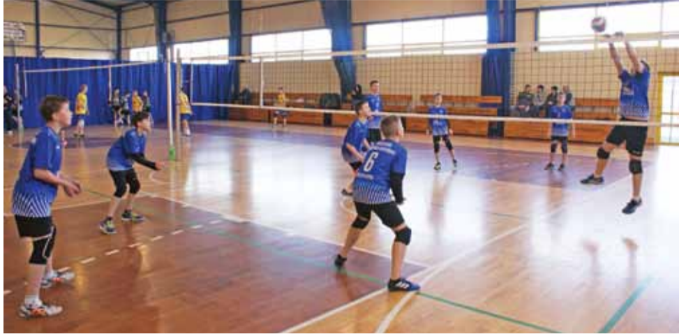
W czwartym turnieju rundy zasadniczej wojewódzkiej ligi mini siatkówki chłopców rywalizowały dwa zespoły Volley Team Żychlin.