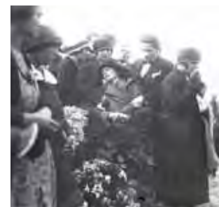
Warszawa, maj 1926. Pogrzeb ofiar przewrotu majowego.