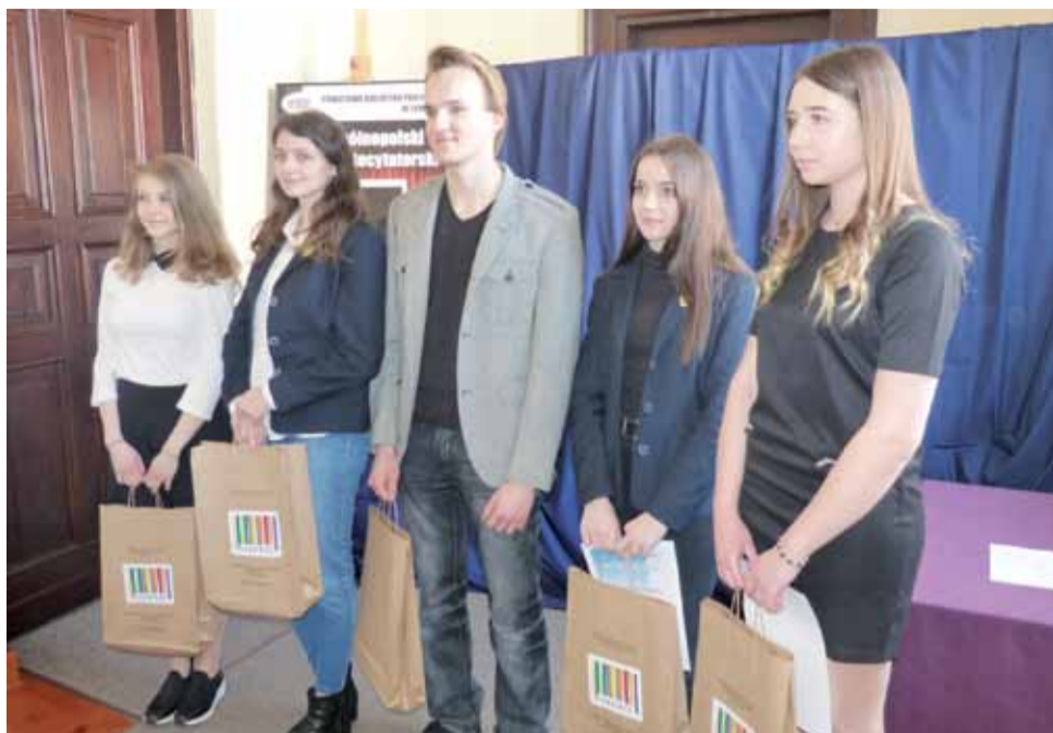
Laureaci powiatowych eliminacji do 63. Ogólnopolskiego Konkursu Recytatorskiego.

Przed ogłoszeniem werdyktu aktor mówił uczestnikom, co w ich występach mu się podobało, a co nie. Udzielił im też – każdemu z osobna, ale w obecności pozostałych – ciekawych rad, dotyczących nie tylko występu na scenie, ale też prezentowania się podczas publicznych występów. Niektórym osobom radził, aby mówiły głośnie, zachęcał