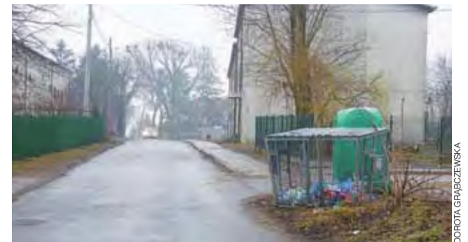
Kontener na plastikowe butelki niebezpiecznie wystaje na jezdnię.

Przypomnijmy, że niezależnie od dofinansowania z rządowego programu, realizacja inwestycji jest wpisana do budżetu gminy Żychlin. Na realizację przedsięwzięcia zabezpieczono kwotę 350.000 zł. Jeśli uda się pozyskać dofinansowanie, to samorząd będzie mógł zrealizować inną inwestycję poprawiającą jakość życia mieszkańców. dag