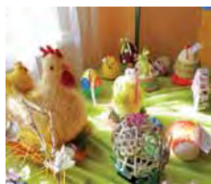
Dzieci starsze na konkurs wykonywały jaja przestrzenne. Pomysłów na ich wykonanie było wiele.