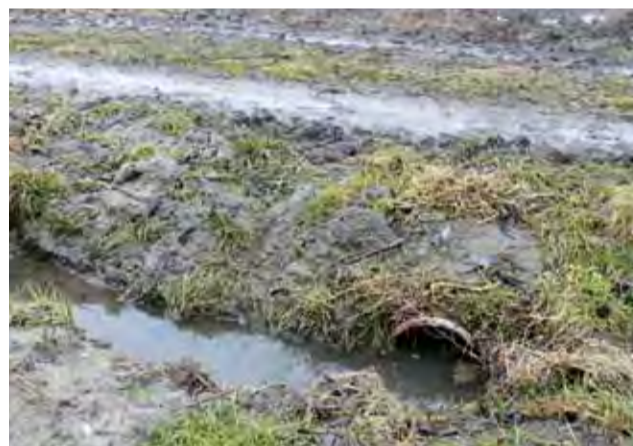
Plastikowa rura wkopana w poprzek drogi, która odprowadza wodę.