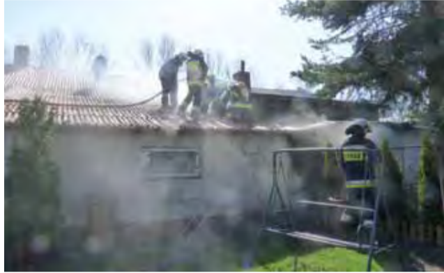
Strażacy z OSP Żychlin w aparatach tlenowych gasili pożar w budynku przy ul. Cichej.

– Na miejscu okazało się, że zapaliły się sadze w kominie – mówi