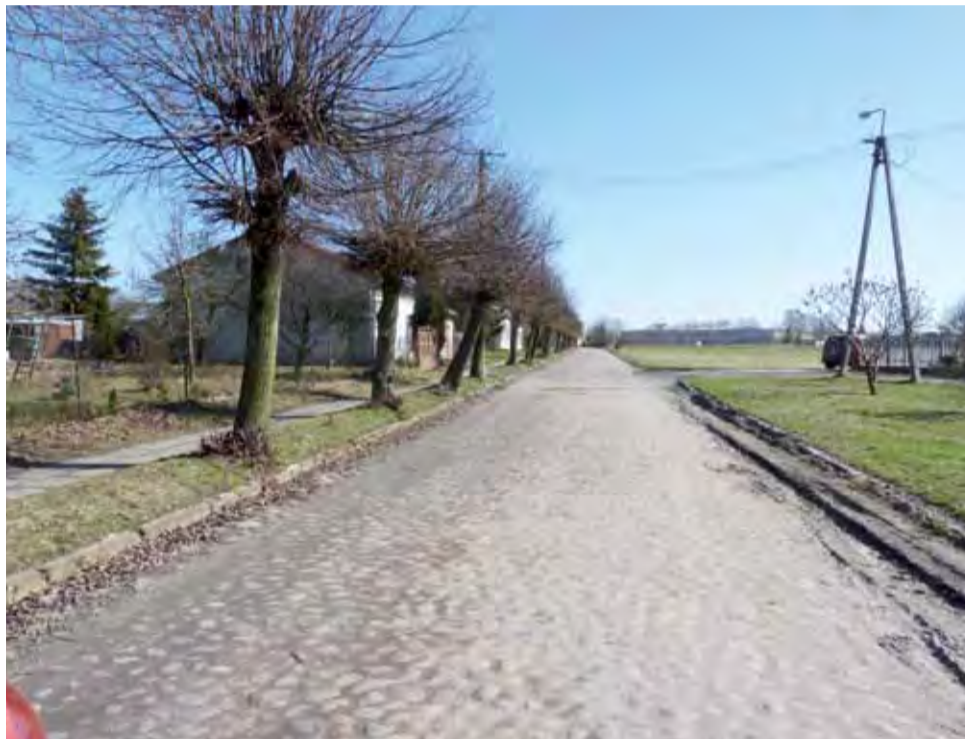
Samorządowcy z Żychlina składają wniosek na modernizację ulicy Dobrzeleńskiej, na dofinansowanie w ramach rządowego programu.

Urząd Wojewódzki w Łodzi wskazuje, że będą uwzględniane trzy priorytety: modernizowana droga ma poprawiać dostępność