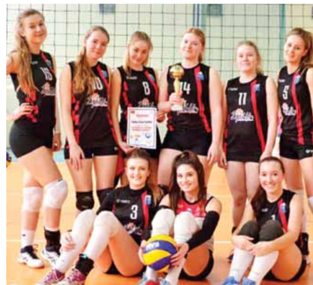
Drużyna Volley Team Żychlin podczas VII Wiosennego Turnieju Piłki Siatkowej Kobiet.