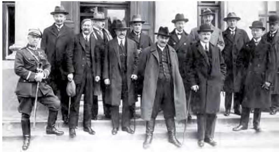
Warszawa, 11 maja 1926. Gabinet Wincentego Witos (stoi na najniższym stopniu, drugi z prawej).

– Podatnicy generalnie podchodzą z ograniczonym zaufaniem do urzędu ze względu na to, że widzą i tą drugą stronę medalu: wiele niesusznych kontroli, kończących się wysokimi ustaleniami w sytuacji, gdy materiał dowodowy nie uprawniał do dokonania takich ustaleń. Aparat skarbowy ma dość dużą swobodę interpretacyjną stanu faktycznego i prawnego – i to na tę nieufność wpływa. Przepisy podatkowe są nieprecyzyjne i niejasne, dlatego zdarza się, że urzędnik zinterpretuje daną sytuację inaczej niż podatnik – a nawet inaczej niż ten sam urząd jakiś czas temu. str. 26