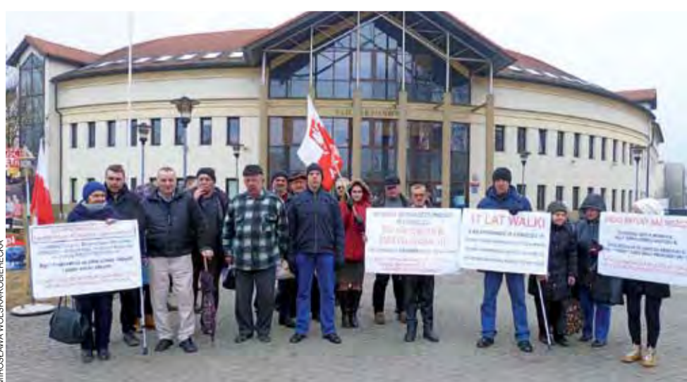
Z miesiąca na miesiąc rośnie grupa osób, które biorą udział w protestach pod Sądem Rejonowym w Łowiczu.

Warto jednak dodać, że karta parkingowa nie jest dokumentem dla pojazdu, a jedynie dla osoby, która nie musi mieć prawa jazdy. Może korzystać z pojazdu jako pasażer. Skarżący 85-latek posiada prawo jazdy. mwk