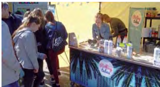
Na przygotowanie tajske lodys trzeba było poczekać co najmniej kilkanaście minut.

Piąty „sezon wyprzedażowy”, ja co roku, rozpoczął się grillem. Kiełbaski trzeba było przynieść we własnym zakresie. mak