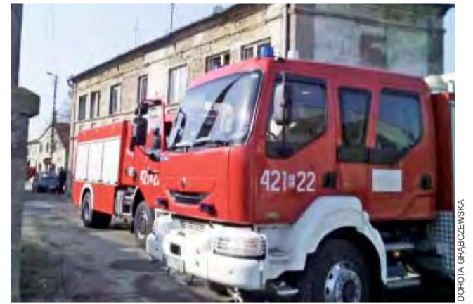
Podpalenie było przyczyną pożaru pustostanu przy ul. Kościuszki. Ogień ugaszono w zarodku.

je się, że mogli znać układ budynku, w tym piwnicy i garażu, przez który się dostali. Nie mieli też powodów, aby obawiać się psów, bo państwo G. mają zwierzęta łagodne, więc one nikogo nie zaalarmowały, że dzieje się coś niepokojącego. Gdyby nawet były bardziej czujne i agresywne, to wątpliwe, czy sąsiedzi by usłyszeli, ponieważ państwo G. mieszkają wprawdzie wśród innych zabudowań, ale sąsiednie domy są oddalone co najmniej o 50 m i w jednym z nich mieszka starsza osoba. Aby zapewnić sobie bezpieczeństwo na przyszłość, rodzina rozważa lepsze zabezpieczenie domu np. zamontowanie alarmu. mwk