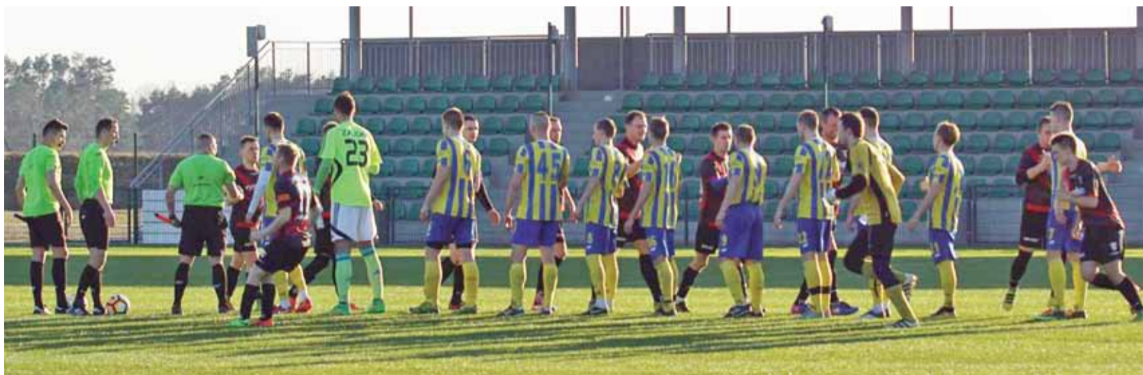
Drużyny rozgrywające mecz 19. kolejki łódzkiej ligi okręgowej: GKS Bedno i Termy Uniejów.