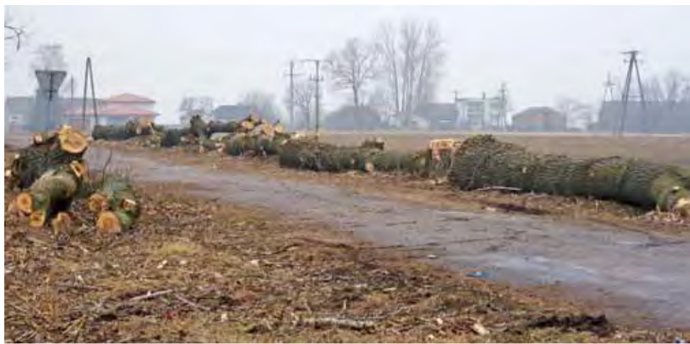
Na zlecenie Starostwa Powiatowego w Kutnie wycięto 446 topól wzdłuż dróg powiatowych. Jesienią będą nowe nasadzenia.

Za ściętymi topolami w gminie Bedlno nikt nie płacze. Po każdej wichurze w gminie były powyrwane drzewa, które uszkadzały budynki gospodarcze, mieszkalne, tarasowały drogi i zrywały linie energetyczne. Do usuwania szkód trzeba było angażować wiele osób i wydatkować olbrzymie pieniądze. Do tego dochodzi-