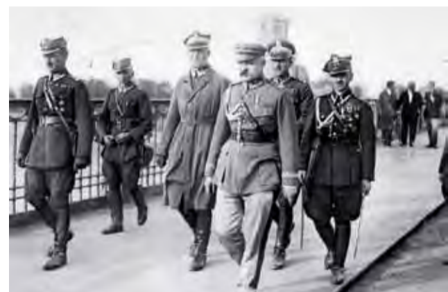
Warszawa, 12 maja 1926. Marszałek Józef Piłsudski w otoczeniu oficerów udaje się na spotkanie z prezydentem Stanisławem Wojciechowskim na moście Poniatowskiego.

Wincenty Witos (były premier, przywódca PSL „Piast”) Przesilenie trwało bardzo długo. Towarzyszyły mu chaos, zamieszanie wzmagające się z każdym dniem coraz bardziej. Z całego kraju dochodziły coraz gorsze i coraz bardziej niepokojące wiadomości. Atmosfera zaczęła się robić niezwykle gorąca. Wszystko się niemal w oczach za-