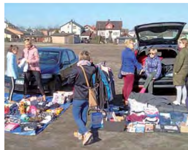
Kolejna wyprzedaż garażowa na Górkach zaplanowana jest 12 maja.

Impreza odbyła się pod patronatem miasta, które nieodpłatnie udostępniło teren, pomogło promować wydarzenie oraz zapewniło wywóz nieczystości i posprzątanie terenu po zlocie. Foodtrucky zajęły mniej więcej jedną czwartą Nowego Rynku. Szkoda, że tuż obok „straszyla” swoim wyglądem płyta po zdemontowanym lodowisku, na co zwrócili nam uwagę czytelnicy. mak