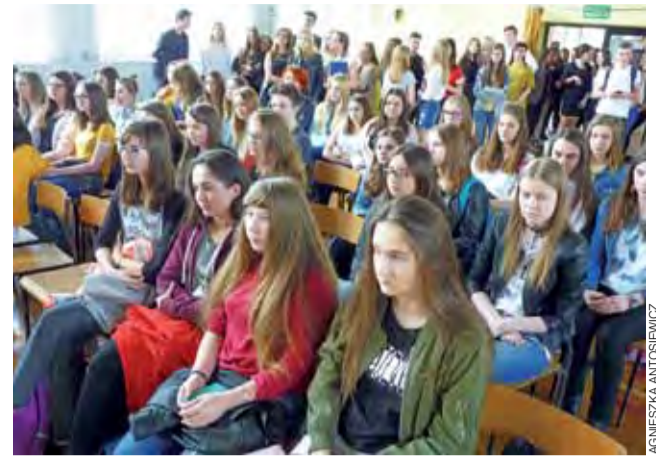
Uczniowie klas gimnazjalnych licznie wzięli udział w Dniu Otwartym w ZSP 4.

Wniosek o paszport można złożyć w wydziale paszportowym urzędu wojewódzkiego lub punkcie paszportowym. Według szacunków MSWiA w tym roku może być wydanych ok. 18.000 paszportów dla 18-latków z pakietami niepodległościowymi. tm