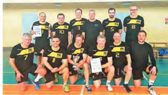
W Kutnie w super formie zaprezentowały się dwa zespoły Łowickiej Amatorskiej Grupy Siatkówki.

– Ja się bardzo cieszę, że wystawiliśmy dwa zespoły. Przed turniejem chęć do gry zgłosiło aż 12 naszych zawodników. To było spore zaskoczenie, bo często mamy kłopoty, aby zebrać 8 graczy. Pomysł z dwoma ekipami okazał się bardzo dobry. Wszyscy sobie dużo pograli, były emocje i dobra zabawa, a to przecież naj-