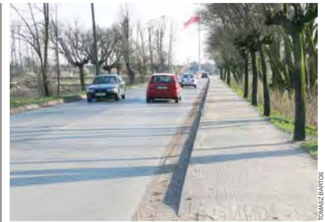
Piach zalegający wzdłuż krawężnika na ulicy Kaliskiej tworzy grubą warstwę.

– Jakies rozwiązanie znajdziemy, aby pozbyć się tej wody – zapewnia jednak wójt. tb