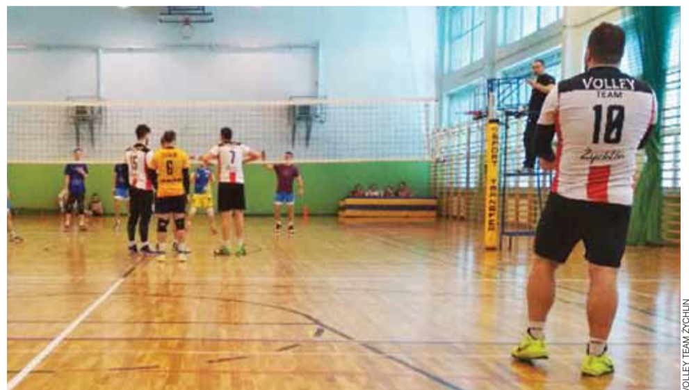
Mecz siatkarzy Volley Team Żychlin podczas szóstej edycji Turnieju Piłki Siatkowej o Puchar Wójta Gminy Naruszewo.

Nowy Łowiczanie Tygodnik Ziemi Łowickiej członek Stowarzyszenia Gazet Lokalnych