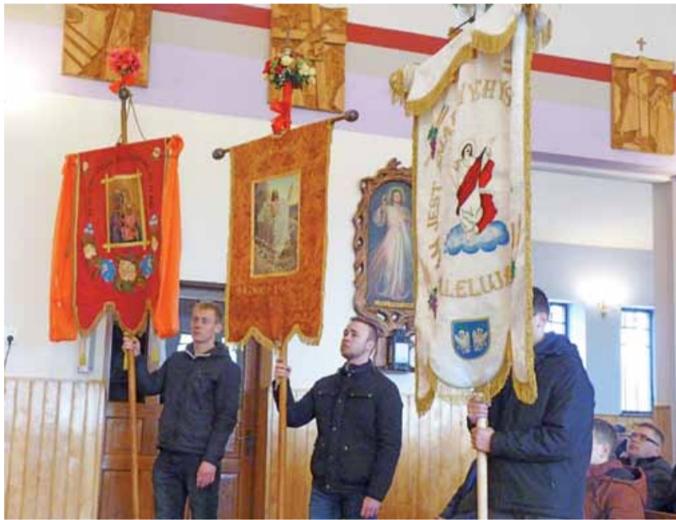
Msza święta chorągwiarzy w kościele pw. św. Rocha w Boczku Chełmońskim.

Następnie idą na mszę chorągwiarzy do kościoła. aa