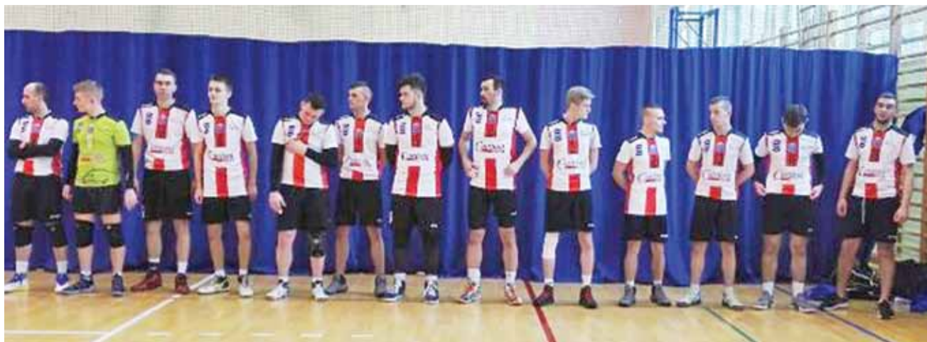
Drużyna Volley Team Żychlin brała udział w Otwartych Mistrzostwach w Piłce Siatkowej Klubów Amatorskich Warszawa 2018.