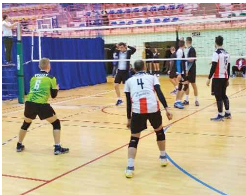
Siatkarze Volley Team Żychlin podczas meczu na warszawskich Otwartych Mistrzostwach w Piłce Siatkowej Klubów Amatorskich.

■ Volley Team Żychlin – Canariños Gdańsk 1:1 (17:25, 25:16) – mecz wygrany małymi punktami