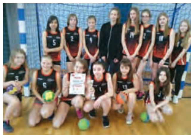
Reprezentacja dziewcząt Szkoły Podstawowej Nr 2 w Żychlinie podczas finału powiatowego w piłce ręcznej klas siódmych.