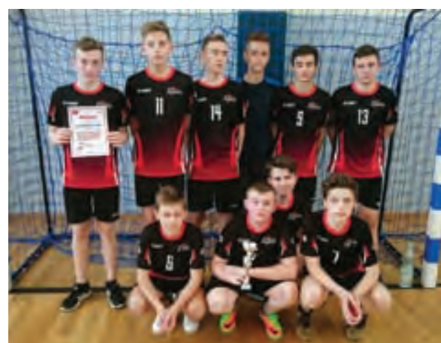
Reprezentacja chłopców SP Nr 2 w Żychlinie podczas finału powiatowego w piłce ręcznej klas siódmych rozgrywanego w Kutnie.