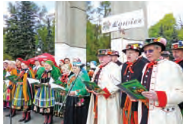
Zespół Śpiewaczy Ksierzki z Łowicza podczas występu pod Dzwonem Wolności w Cytadeli w Poznaniu 24 kwietnia 2016 r., podczas Dni Ułana.

Zespół Ksierzki dwukrotnie gościł z patriotycznym występem na Święcie Ułana w Poznaniu, na zaproszenie wspomnianego towarzystwa. Było to w 2016 i 2017 roku. Wcześniej – w 2014 roku – Ksierzki spotkały się z ułanami w Ziewanicach w gminie Głowno, dokąd przyjeżdżają oni rokrocznie konno około 300 km, aby oddać cześć żołnierzom poległym na naszym terenie we wrześniu 1939