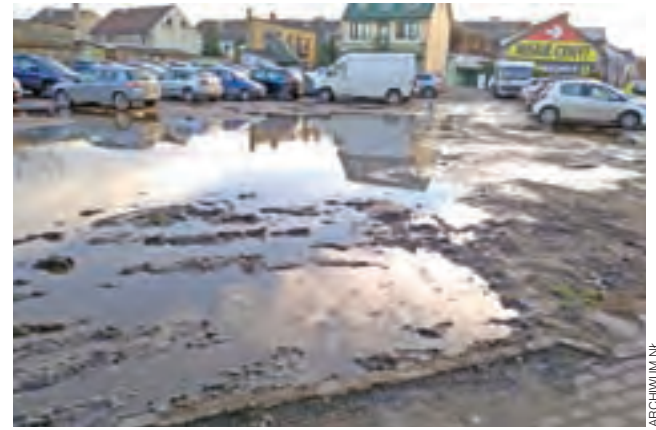
Stan parkingu u zbiegu ul. Podrzecznej i Koziej w grudniu 2017 roku.

■ że lepiej byłoby rozbudować parking na Błoniach. Może tak, on przyda się w weekendy, ale nie będzie służył tym, którzy – a tacy jesteśmy prawie wszyscy – chcieliby podjechać jak najbliżej do sklepu. Te 200 metrów sprawa jednak różnicę. Tak jak niemal nikt nie parkuje na placu za