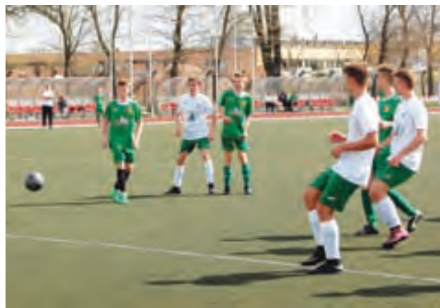
Pelikan 2002 (białe koszulki) nie dał szans Pogoni Belchów.

– Chłopakom należy się duże brawa za profesjonalne podejście i za to, że nie zlekceważyli przeciwnika i granie do samego końca o punkty, bo jak widać przełożyło się to na dobry wynik. Ale cieszy również gra i bardzo ciekawe wykańczanie oraz budowanie akcji od samej bramki. Oby tak da-