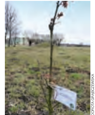
Dęby zakupione przez starostwo w Kutnie posadzono na łąkach za mostkiem łączącym osiedle Wyzwolenia i Łąkowa. Sadzonki pochodzą z Nadleśnictwa Kutno.

Na wiosnę, gdy ruszy wegetacja (a dęby puszczają pąki stosunkowo późno), zostanie doko-