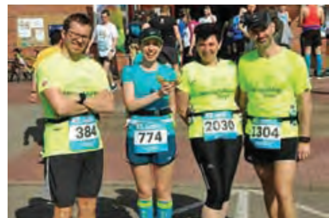
Reprezentanci Łowicza w Dębnie.