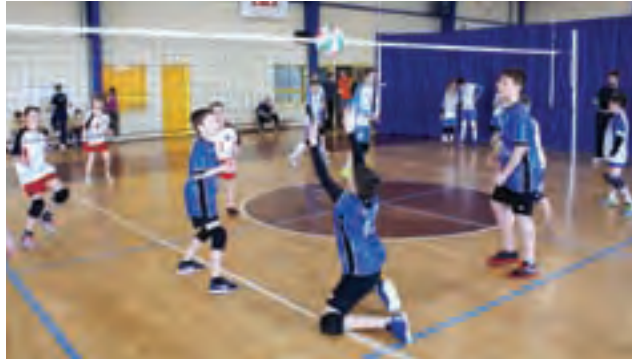
Czwarty turniej rundy zasadniczej wojewódzkiej ligi mini siatkówki chłopców odbył się w żychlińskiej hali sportowej.

■ Grupa D: Volley Team Żychlin III – Kontra Łódź II 2:1, SP 137 Łódź II – Bzura Ozorków III 0:2, Volley