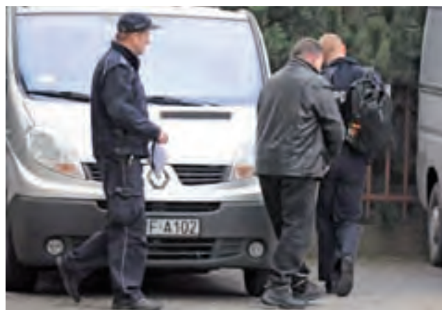
Łotysz był doprowadzany na rozprawę z Zakładu Karnego w Łowiczu, gdzie przebywał a areszcie tymczasowym od roku i 3 miesięcy.

Przypomnijmy, że 46-letni obywatel Łotwy przez kilka miesięcy zajmował na pozór opuszczoną posesję w Kalenicach, w której zainstalował system urządzeń do nielegalnego poboru paliwa. W styczniu ubiegłego roku proceder zakończyła wspólna akcja policjantów z Łowicza i Komendy Wojewódzkiej Policji w Łodzi. Na miejscu zabezpieczono 8 tys. litrów spuszczonego paliwa oraz – co podkreślali przedstawiciele concernu paliwowego specjalistyczne oraz firmy eksploatującej rurociąg – urządzenia do odpompowywania paliwa z rurociągu. Paliwo z Kalenic nadawało się do utylizacji, gdyż koncert nie mógł sobie pozwolić na to, żeby niepełnowartościowy produkt trafił na rynek.