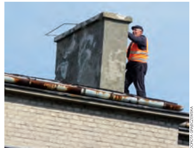
Pracownicy poprawiają kominy, później położą papę termozgrzewalną.

Na rzeczywiste efekty funkcjonowania fotowoltaiki trzeba będzie jednak poczekać do 2019 roku, bowiem we wrzeźniu efektywność funkcjonowania OZE jest dużo mniejsza, gdyż dni słonecznych jest coraz mniej. dag