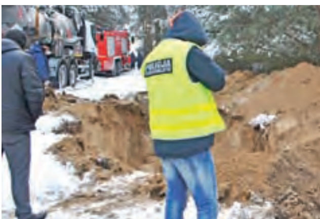
Policjanci natrafili na instalację służącą do kradzieży paliwa przypadkowo.

99-400 Łowicz Jastrzębia 95 46/837-14-10 46/837-15-89