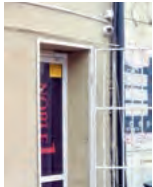
Klienci wchodzący do salonów byli obserwowani przez kamery, tutaj przykład z ul. Zduńskiej w Łowiczu.

Dokonując zatrzymań w Łowiczu celnicy nie mieli łatwego zadania. – Po wejściu do pomieszczeń funkcjonariusze zastali włączone automaty, na których akurat rozgrywano gry hazardowe. Po chwili jednak urządzenia zostały zdalnie wyłączone, a monitory zostały albo wygaszone, albo zamiast dotychczasowych symboli gier, pojawiła się na nich strona jednej