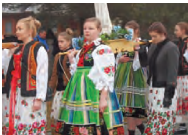
Łowiczanki na procesji rezurekcyjnej w Murzasichlu.