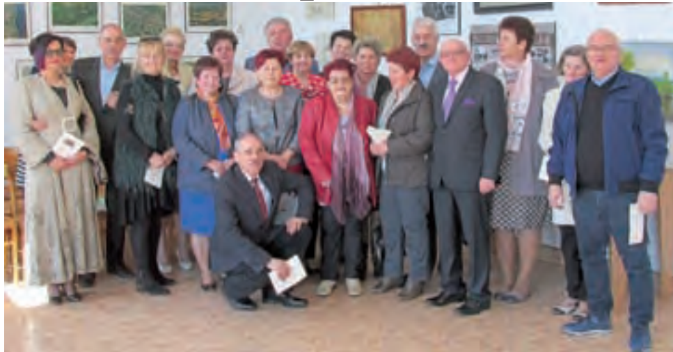
Absolwenci klasy IV A o profilu matematyczno-fizycznym LO w Zdunach (rocznik 1978) w sali politechnicznej, z której obecnie korzysta technikum w Zduńskiej Dąbrowie.

Część nieoficjalną, pełną wzmnień i sentymentalnych wspomnień, kontynuowali w restauracji „U Julka” w Zdunach. Warto dodać, że absolwenci tej klasy spotykają się regularnie od momentu