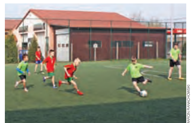
Powiatowe rozgrywki półfinałowe w piłce nożnej chłopców. Mecz reprezentacji SP Nr 1 w Żychlinie przeciwko SP Nr 2 w Żychlinie.