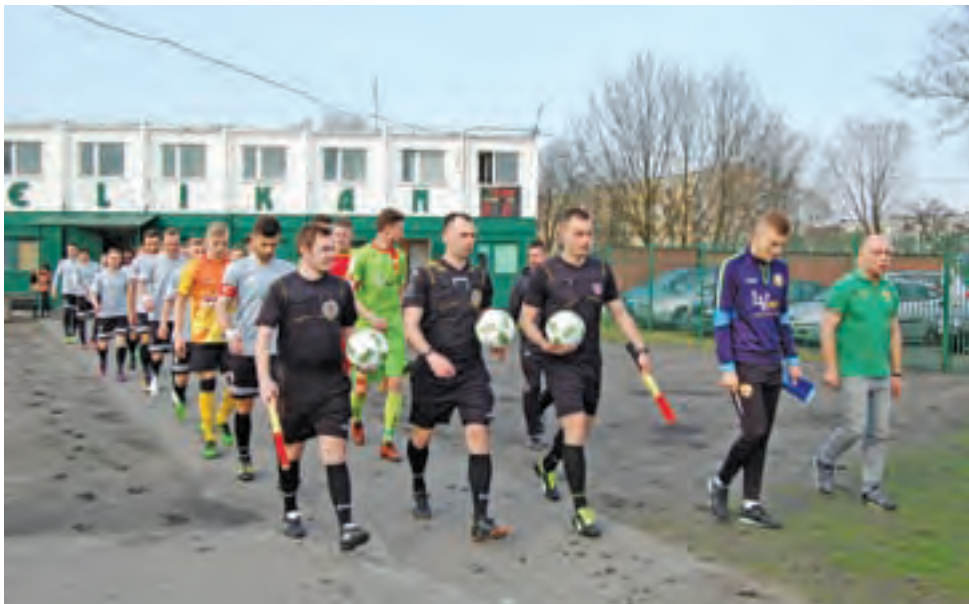
Po raz pierwszy w tym roku Pelikana zagra na Starzyńskiego 6/8 mecz o punkty.

Kibice, którzy środowe popołudnie postanowili spędzić na Starzyńskiego nie mieli czego żałować. Dostali emocjonujące widowisko, w którym piłkarze nie