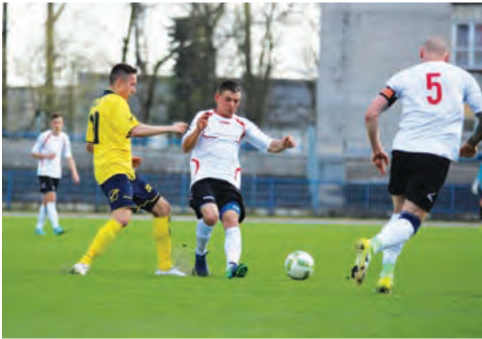
Piłkarze KS Kutno rozegrali dwie kolejki łódzkiej IV ligi.

■ Unia Skierniewice – Zjednoczeni Bełchatów 3:0 (walkower)