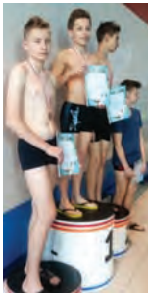
Młodzi pływacy dumni ze swoich osiągnięć.