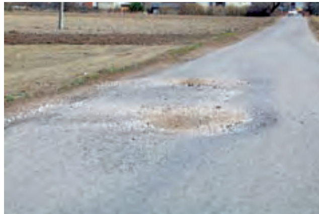
Droga gminna do Bielaw. Tędy prowadzi objazd, wyznaczony na czas przebudowy bielawskiego odcinka DW 703. Stan na 5 kwietnia.

Pytania o organizację ruchu podczas przebudowy DW 703, o możliwość wprowadzenia wahadła i świateł, a także o zakres odpowiedzialności za uszkodzenie dróg gminnych w okresie obowiązywania objazdów wysłaliśmy zarówno do Eurovii, jak i do Zarządu Dróg Wojewódzkich w Łodzi.