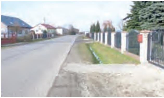
Mieszkańcy Julianowa oczekują od lat na budowę chodnika przy drodze powiatowej. Teraz mają nadzieję, że on w bliskiej przyszłości powstanie.

Nie zaplanowano jednak oczekiwanej przez gm. Nieborów i jej mieszkańców budowy chodnika, o którą zabiegano od 15 lat. Jak nam wtedy mówili mieszkańcy, wcześniej ich zbywano tym, że chodnik nie będzie robiony, gdyż planowany jest większy remont drogi. Gdy już podjęto decyzję o jego przeprowadzeniu, okazało się, że nie został on uwzględniony – ze względu na koszty.