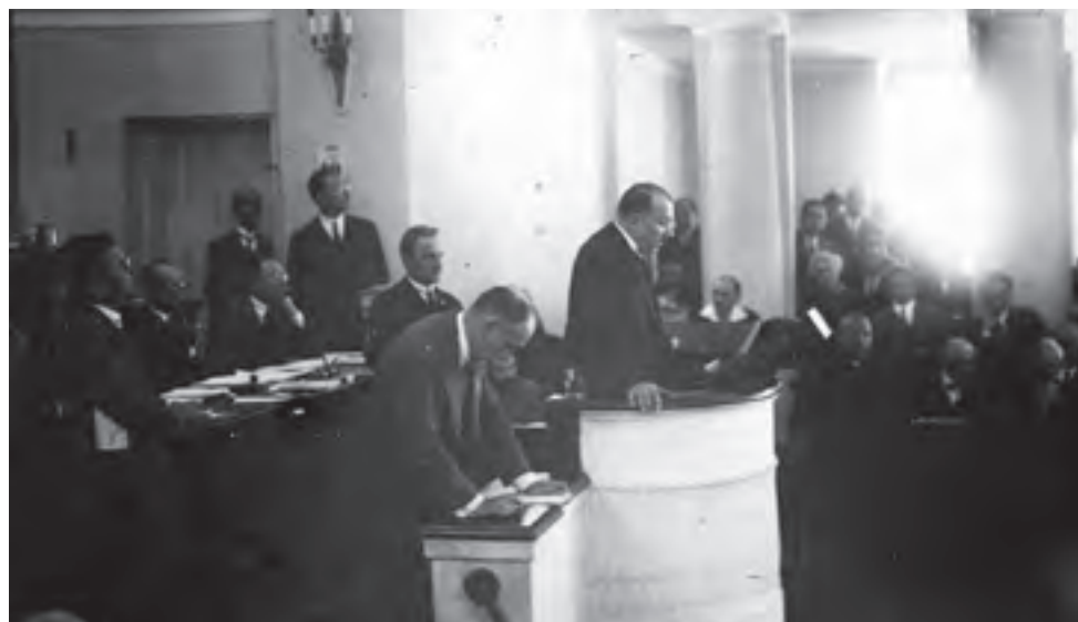
Warszawa, lipiec 1926. Premier Kazimierz Bartel odczytuje swoje exposé.