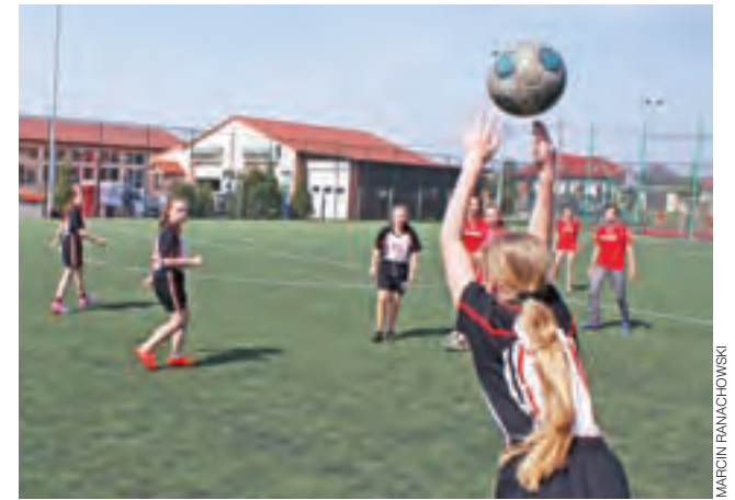
Jeden z meczów piłki nożnej dziewcząt w ramach półfinału powiatowego rozegrany na orliku w Żychlinie.