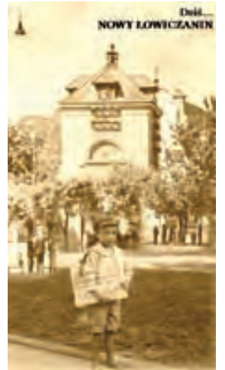
Gazeciarz z „Łowiczaniem”.

„Kiedyś starsza Pani, dziś już babciusia... opowiadała mi historię... może to bajka?, ale ja w nie wierzę i lubię słuchać... opowiadała o małym chłopcu z blond włosami, który był gazeciarzem i sprzedawał „Łowiczanie”... chłopiec miał później wnuczkę, dziewczynkę z loczkami i też blondynkę... Ona marzyła aby zostać dziennikarką... tak sobie myślę... czy dziennikarka pisząca pod pseudonimem „DG”... to może Ona?... też jest blondynką... a może to wszystko bajka?... musiałem ją tu odtworzyć ze strzępów starych fotografii... Nie wiem jak Państwo, ale ja kocham takie stare historie, owiane tajemnicą. (oczywiście każda zbieżność, nazw i inicjałów jest całkowicie przypadkowa)”.