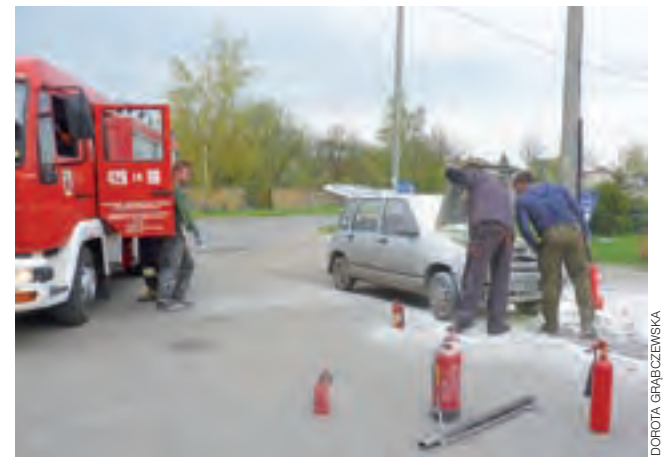
Pracownicy Okręgowej Stacji Kontroli Pojazdów za pomocą gaśnic proszkowych ugasili płonącego Fiata Tipo, zanim dojechali strażacy z OSP Żychlin.