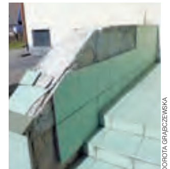
Po zimie z murków przy schodach prowadzących do GOK Bedno odpadły płytki.

– Rzeczywiście po zimie płytki w wielu miejscach odpadły. Wy-