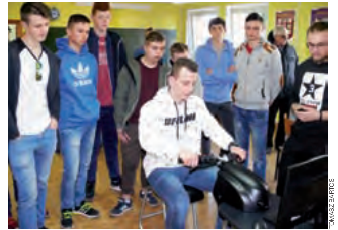
Uczniowie jednej z klas Technikum Mechanizacji Rolnictwa szkoły blichowskiej sprawdzali swoje umiejętności na symulatorze jazdy motocyklem.

– Można się domyślać, że oskarżony był pionkiem w tym procederze. Może nie powiedział o innych, bo się boi o życie i zdrowie? Jest obcy na tym terenie – przekonywał przydzielony z urzędu adwokat. Sam oskarżony powiedział łamaną polszczyzną (podczas procesu obecny był też tłumacz), że był tylko zwykłym pracownikiem i nie wiedział, co działo się na terenie posesji w Kalenicach. mak