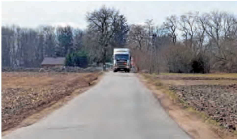
Gmina Bielawy. Objazd remontowanej DW 703 wyznaczony dla pojazdów o masie całkowitej do 3,5 tony.

Zła sytuacja jest zwłaszcza na wąskich drogach w Chruślinie Nowym oraz na objęzdzie z Bielaw do 703 w kierunku Brzozowa (od ul. Podrzecznej w lewo i dalej prosto), gdzie asfalt został w wielu miejscach dosłownie rozjechany, a pobocza zarwane.