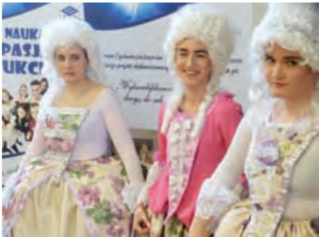
Uczennice II LO prezentują się w fantazyjnych sukniach i kostiumach sprzed przeszło 200 lat.

Atrakcją była prezentacja strojów dworskich z epoki oświecenia – męskiego i trzech damskich, które przywdziało czworo uczniów. Kierująca kołem prof. Agnieszka Kobrzycka wyjaśniała, że są to jedynie rekonstrukcje strojów, wykonane ze współczesnych materiałów. W odróżnieniu od np. Wielkiej Brytanii, rekonstrukcje czasów oświecenia nie cieszą się w Polsce szczególną popularnością, jak chociażby średniowiecze – stąd też trudniej o oryginalne materiały. Profesor mówiła też, że choć kreacje wydają się oświeceniowe, to są niekompletne. Na dworze francuskim omawianej epoki