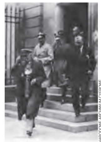
Warszawa, 26 czerwca 1929. Minister Spraw Wojskowych Józef Piłsudski opuszcza gmach sądu po złożeniu zeznań przed Trybunałem Stanu.