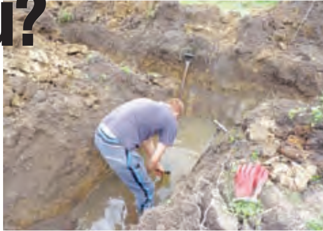
Pracownik Spółki Wodnej Ziemi Żychlińskiej w trakcie oczyszczania rury melioracyjnej z korzeni.