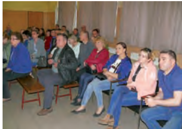
Mieszkańcy słuchali tłumaczeń burmistrza i przedstawiciela Hellyar Plastics, zapewnienia o braku szkodliwości część z nich uznała za mydlenie oczu.

Procesowi produkcji nie towarzyszy proces spalania, dlatego też zakład nie będzie miał dymiących kominów, nie będzie wytwarzał odpadów produkcyjnych – jedy-