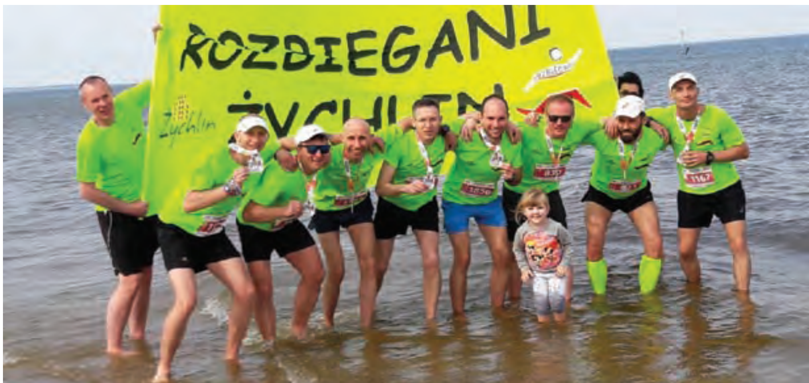
Ekipa Rozbieganych Żychlin po pokonaniu dystansu maratonu w Gdańsku.