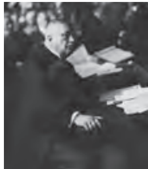
Warszawa, 26 czerwca 1929. Były minister skarbu Gabriel Czechowicz na ławie oskarżonych podczas procesu przed Trybunałem Stanu.

■ Wicepremier Kazimierz Bartel w przemówieniu sejmowym