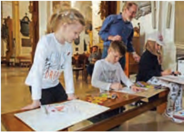
Dzieci z grupy „Akwarelki” podczas pleneru malarskiego w katedrze.