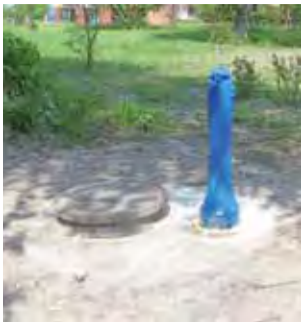
Koło rzeki Studwi przed mostem powstaje kolejny skwer.