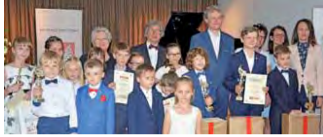
Podczas I Festiwalu Pianistycznego „Dźwięki Mazowsza” prezentowali swe umiejętności uczniowie szkół muzycznych.

Wystąpiło 32 uczniów szkół muzycznych. – Poziom, który