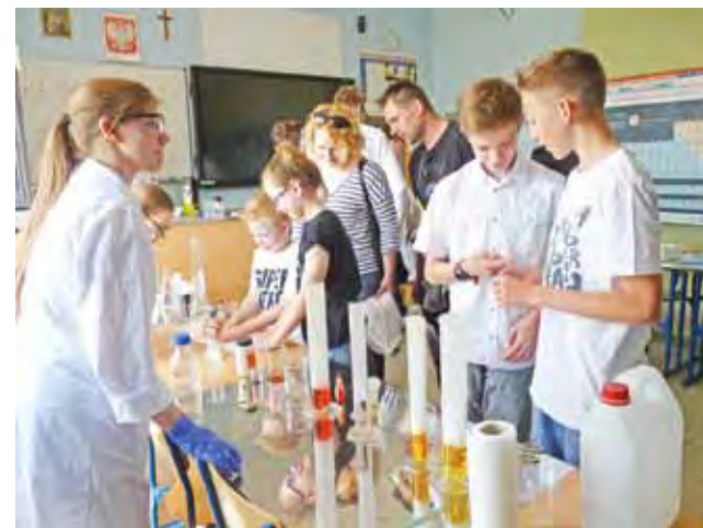
Uczniowie przygotowali dla odwiedzających szkołę ciekawe doświadczenia chemiczne.

Łowicz | Dzień Otwarty w Szkołach Pijarskich