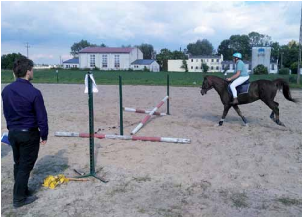
Podczas tegorocznej Agromajówki w Zduńskiej Dąbrowie można będzie m.in. podziwiać piękno koni, poznać sporty konne oraz turystykę z nimi związaną.