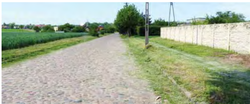
Za kilka miesięcy ulicę Dobrzelińską pojedziemy po asfalcie.

– Niezależnie od rozstrzygnięcia konkursu na rządowe środki, zdecydowaliśmy, że do końca maja ogłosimy przetarg na wykonanie zadania – mówi Zbigniew