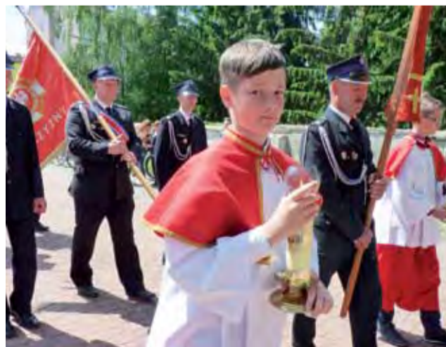
W niedzielę, 20 maja, w parafii Świętego Ducha w Łowiczu obchodzona była uroczystość odpustowa Zesłania Ducha Świętego, potocznie Zielone Świątki. Po mszy św. odprawionej o godz. 12.00 wokół kościoła przeszła procesja eucharystyczna z asystą m.in. strażaków, lektorów i ministrantów oraz dziewczynek syjących kwiaty. aa