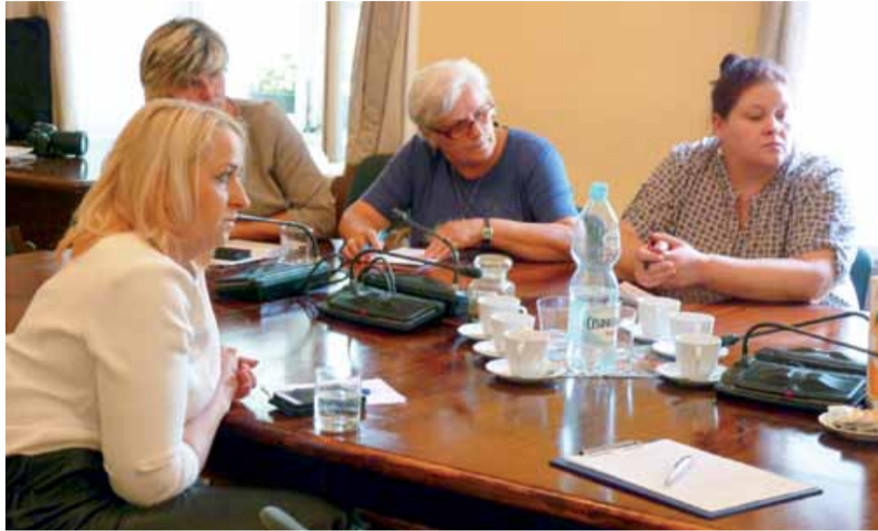
W spotkaniu uczestniczyły przedstawicielki KGW z naszego powiatu.

Główny wniosek płynący ze spotkania był taki, że Koła Gospodyń Wiejskich powinny wystrzegać się w swojej ak-