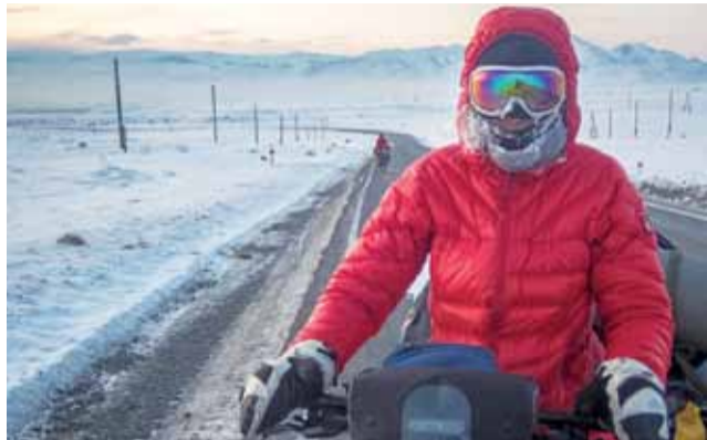
40-stopniowe mrozy panujące zimą na Syberii nie zachęcają nie tylko do jazdy rowerem, ale i do wychodzenia z ciepłego domu (Bike Jamboree).

Warto zaznaczyć, że wszystkie atrakcje związane z imprezą są darmowe. Wstęp na wszystkie pokazy oraz wydarzenia towarzyszące jest wolny. Podobnie jest ze wspomnianym campingiem. Wszyscy, którzy w kolejny długi