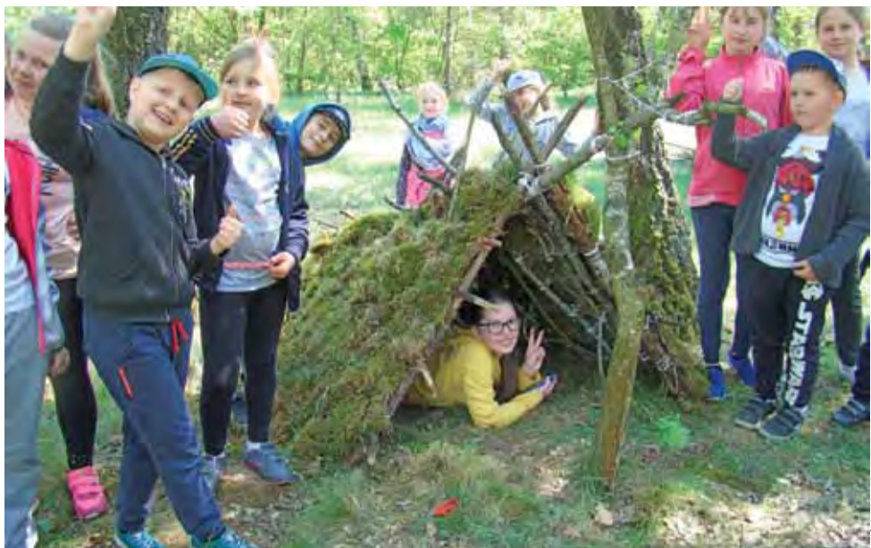
Zuchy i harcerze z SP w Żeronicach w ramach zajęć zbudowali szałas w lesie.