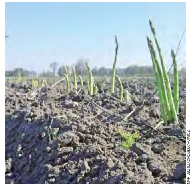
Tak wyglądają dojrzałe szparagi na polu przed ścięciem.

Szparagi od dawna uchodziły za przysmak kojarzony z luksusem. Były też cenione jako afrodyzjak. Współcześni dietetycy jak najbardziej potwierdzają, że ta roślina zasługuje na uwielbienie – jest skarbnicą witamin i składników mineralnych, a przy tym 100 gramów to tylko 18 kcal. ■