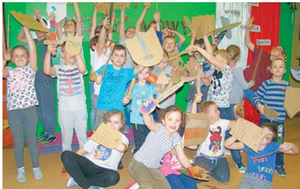
Opowieści o Rycerzach Okrągłego Stołu zainspirowały zuchów i harcerzy, by zrobić rycerskie miecze i tarcze.

Żeronicze | Zbiórka zuchowo-harcerska w SP Żeronicze