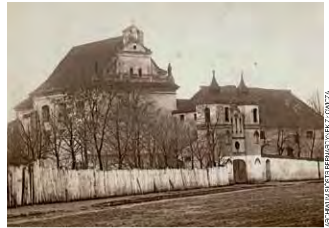
Zespół klasztorny po bernardynkach – tak wyglądał na początku XX wieku.

Po zakończeniu II wojny światowej sierociniec przekształcono w Dom Dziecka p.w. św. Teresy, a później zorganizowano internat dla dziewcząt, w którym siostry pracowały do 1961 roku, kiedy komunistyczne władze odsunęły je od pracy wychowawczej. W 1962 roku, za zgodą Pryma-