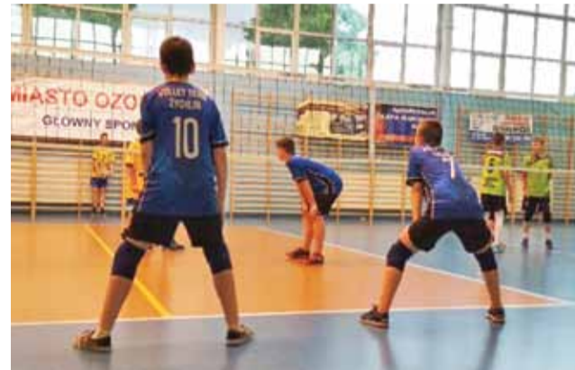
Jedno ze spotkań siatkarskich „trójki” Volley Team Żychlin podczas finału wojewódzkiego Kinder+Sport.

Tabela grupa B: 1. Wifama Łódź I 6 pkt. 2. Lechia Joker Glinka Academy