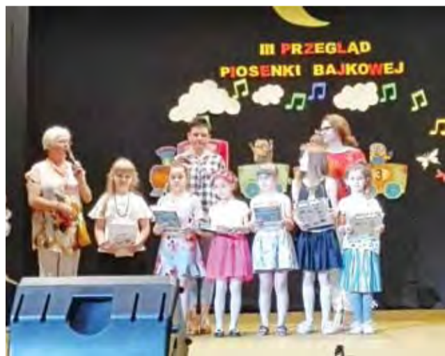
Laureaci Przeglądu Piosenki Bajkowej z klas III zaprezentują się na święcie Żychlina.