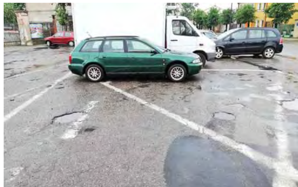
Samochód zaparkowany na „kopercie” przed jednostką OSP w Żychlinie.