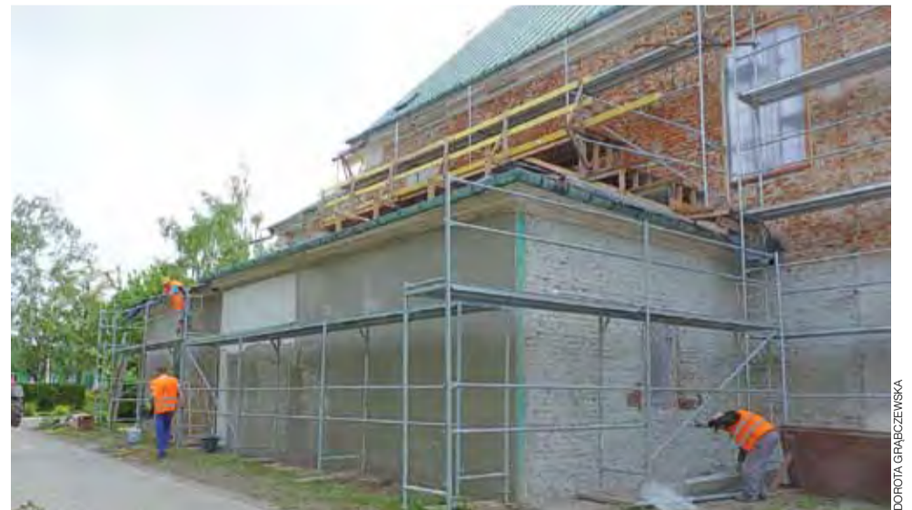
Firma Elvis rozpoczęła układanie nowego tynku na kościele. Ma do ułożenia 800 m 2 nowego tynku.

To oznacza, że jest to praca 4 razy 800 m 2 . Każda z warstw musi dobrze wyschnąć, by układać kolejną. Budowlancy nie mają łatwego zadania, bowiem praca odbywa się z przerwami na pogrzeby, czy też na białe tygodnie dzieci komunijnych.