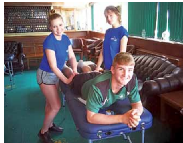
Podczas stażu Techników Masażystów w klubie piłkarskim Plymouth Argyle F.C.

Stażysty mieli również możliwość uczestniczenia w typowym treningu piłkarskim oraz obserwowania treningu zawodników po kontuzjach. Oprócz ćwiczeń praktycznych mieli także zajęcia teoretyczne z zakresu anatomii i fizjologii wysiłku oraz usprawniania po urazach sportowych na boisku.