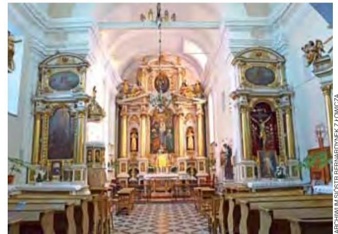
Barokowe wnętrze kościoła bernardynek w Łowiczu.

sa Polski Stefana Kard. Wyszyńskiego, w kościele bernardynek zaprowadzona została całodzienne adoracja Najświętszego Sakramentu.