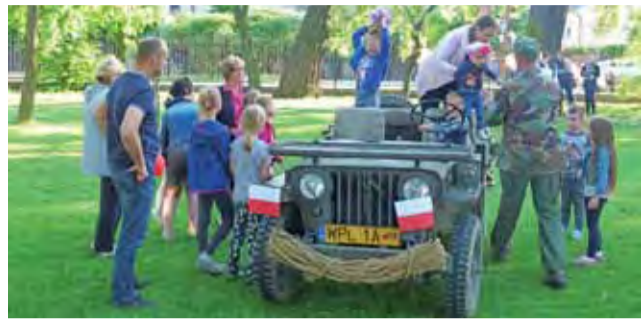
Wokół Jeepa Willysa zatrzymywały się sporo osób.