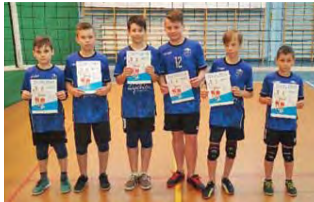
Zespoły Volley Team Żychlin zakończyły rozgrywki Mistrzostw Mini Siatkówki „Trójek” Chłopców o Puchar Kinder+Sport.