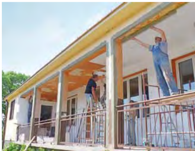
Trwają prace przy remoncie tarasu.

Obecnie trwają jeszcze prace na tarasie, który został m.in. ocieplony styropianem. Te działania