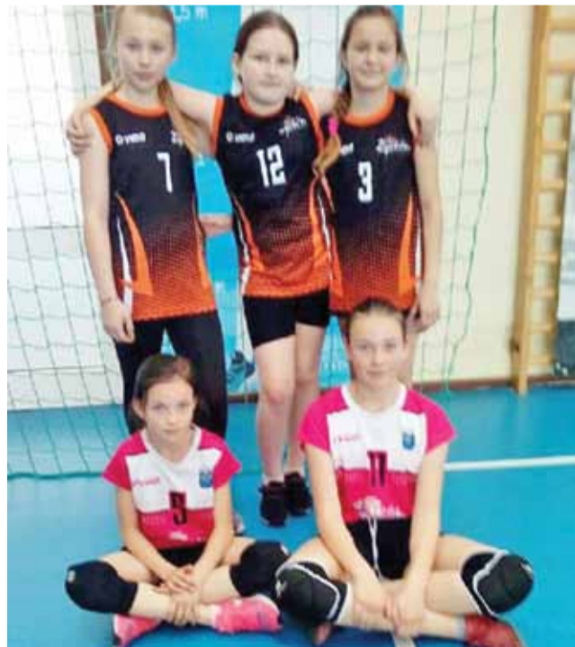
Dziewczęta Volley Team Żychlin podczas półfinału wojewódzkiego w mini piłce siatkowej „dwójek” o Puchar Kinder+Sport w Łasku.

Wyniki meczów grupy D: Volley Team Żychlin I – Libero I Pajęczno 2:1; Volley Team Żychlin I – Łaskowia V Łask 2:0; Volley Team Żychlin I – MOS III Wierzchlas 2:0; Volley Team Żychlin I – Lechia 13 II Tomaszów Mazowiecki 2:0.