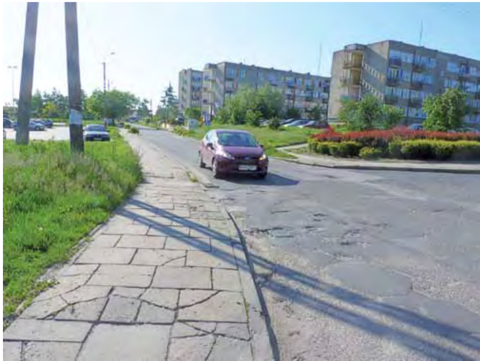
Czy powiatowa ulica Żeromskiego w Żychlinie doczeka się w tym roku modernizacji?