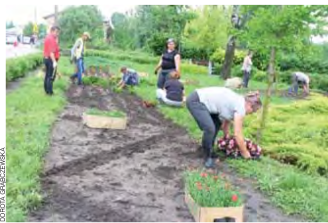
W czwartek na miejskich rabatach sadzono kolorowe kwiaty. Wysadzono 3500 sadzonek.

Firma uzupełni masą bitumiczną gorącą 1375 m 2 dziur o głębokości do 10 cm oraz 400 m 2 wyrw o głębokości 5 cm. Po zalaniu wyrw masą, wykonawca krawężdzie wyrw pokryje emulsją asfaltową i grysem. Firma ma wziąć się do pracy w ciągu 7 dni po podpisaniu umowy, najpóźniej do 30 czerwca wszystkie pozimowe dziury mają zniknąć. dag