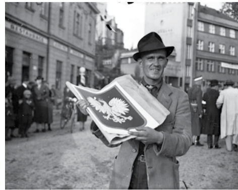
Orłowa, październik 1938. Sprzedawca kartonów z polskim godłem podczas uroczystości po zajęciu Zaolzia.

Oprócz łowickiego seminarium, organizatorami wydarzenia były także Papieski Wydział Teologiczny w Warszawie – Collegium Ioaennum oraz Wojewódzki Ośrodek Doskonalenia Nauczycieli w Skierniewicach. tm