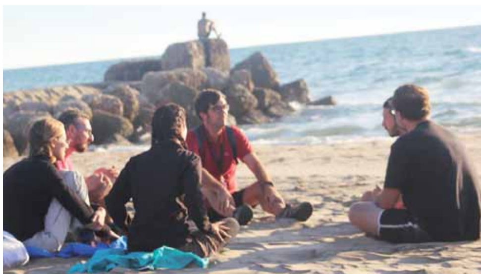
Zajęcia w Apenińskiej Szkole Żywej Filozofii nie odbywają się w żadnej auli.

w Włoszech. Jesienią ubiegłego roku wprowadził się do kamienego domku w Trevi Nel Lazio. Choć zajmuje się głównie szkołą, nie zaprzestał całkiem pisania i publikowania, wciąż ma nowe pomysły, które realizuje. Obecnie pracuje na przykład nad komiksem, którego bohaterami będą słynni filozofowie.