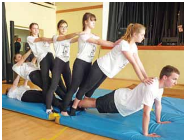
W sali gimnastycznej można było oglądać widowiskowe pokazy akrobatyki.