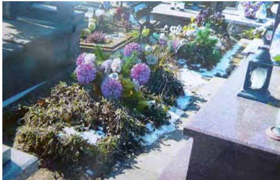
Na cmentarzu w Żychlinie jest pochowany powstaniec 1863 roku Kacper Wójciński.

Jadwiga zmarła w 1867 roku, 7 lat po ślubie, w wieku 25 lat.