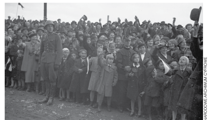
Karwina, październik 1938. Polscy mieszkańcy miasta podczas defilady po zajęciu Zaolzia.