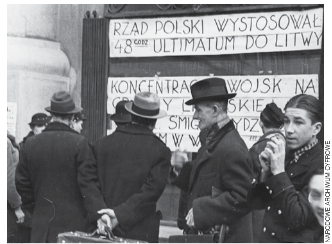
Kraków, marzec 1938. Komunikat o ultimatum wystosowanym przez rząd polski do rządu litewskiego.

2 października 1938 – Czechosłowacja przyjmuje polskie warunki dotyczące oddania Zaolzia (części Śląska Cieszyńskiego znajdującej się za Olzą). Oddziały Wojska Polskiego, witane owacyjnie przez polską społeczność, zajmują zwrócone ziemie. Warszawa, 9 października 1938