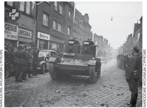
Czeski Cieszyn, październik 1938. Defilada polskich wojsk po zajęciu Zaolzia.