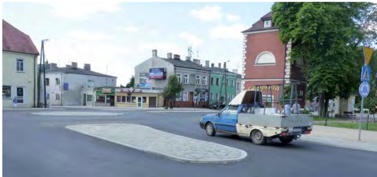
Budowa ronda w centrum Żychlina zakończona. Koniec utrudnień, jest estetycznie i bezpiecznie. Brakuje tylko pasów dla pieszych.