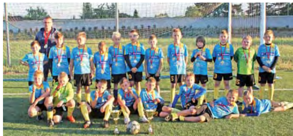
Drużyny KS Żychlin 2008/2009: KS Żychlin I i KS Żychlin II wraz z trenerem.