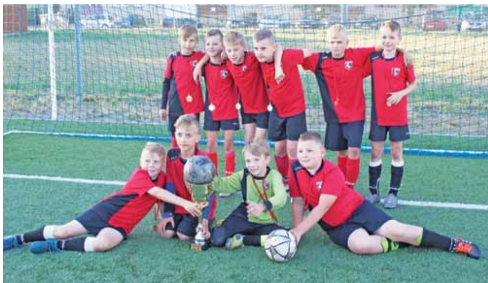
Drużyna GKS Bedno 2008/2009 z pucharem za zajęcie drugiego miejsca w Turnieju Piłki Nożnej Chłopców „Gramy dla Niepodległych”.