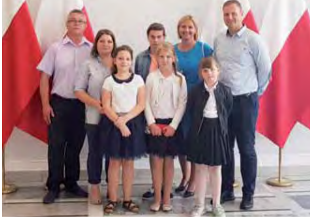
Laureaci etapu okręgowego konkursu o bezpieczeństwie pożarowym w budynku Senatu.

Na zaproszenie parlamentarzysty w warszawskim finale udział wzięło czterech laureatów etapu okręgowego, w tym okręgu, który obejmuje nasze tereny. Byli to uczniowie z Topoli Królewskiej, Góry Świętej Małgorzaty