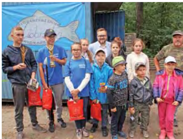
Uczestnicy Młodzieżowych Zawodów Wędkarskich w Dobrzelinie.