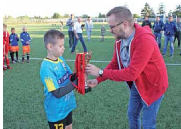
Wręczenie pucharu dla KS Żychlin I rocznik 2008/2009.