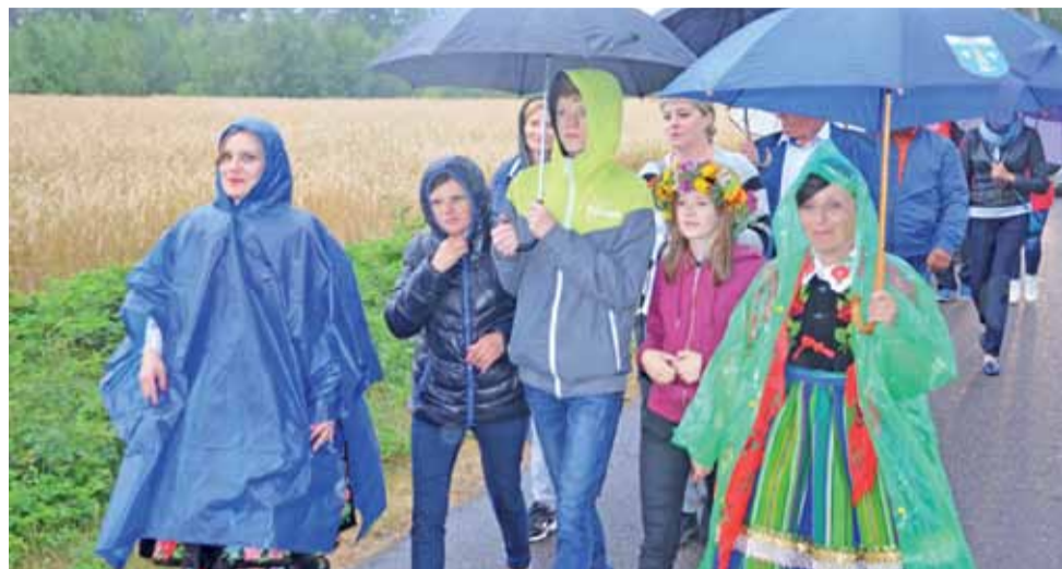
Ludowe stroje, wszechobecne kwiaty i do tego jeszcze kolorowe parasole – choć pod szarym (a później czarnym) niebem, impreza była bardzo kolorowa.

Czasu na śpiew i tańce było dużo po powrocie na teren świetlicy. Zorganizowano na przykład konkursy tańca i śpiewu, w których dominowały piosenki ludo-