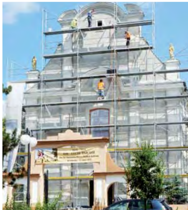
Urząd Marszałkowski w Łodzi stwierdził błąd w postępowaniu przetargowym. Teraz prace ponownie trwają.