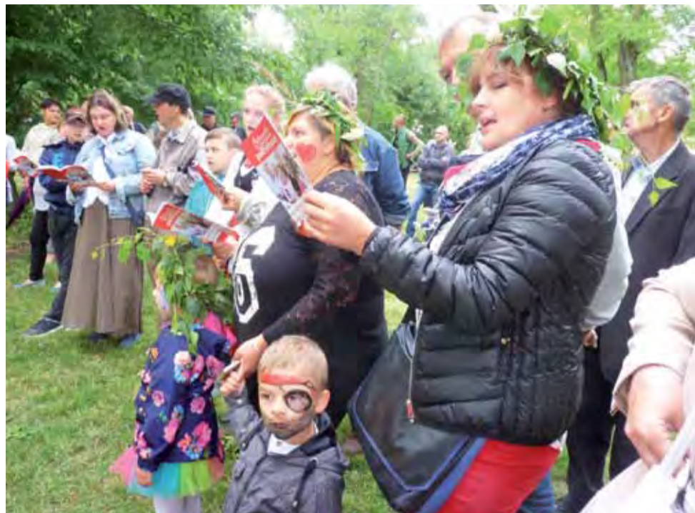
Zwieńczeniem tegorocznych wianków dworskich było wspólne śpiewanie pieśni patriotycznych.

Dobrzelin | Biało-czerwone Wianki Dworskie