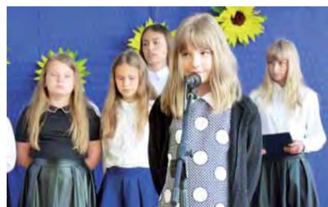
Podczas zakończenia roku szkolnego uczniowie zaprezentowali program artystyczny pod hasłem „Witajcie wakacje”.

Przekonuje jednak, że najwięcej pracy było po skończonych zajęciach, kiedy trzeba było wszystko posprzątać na następny dzień.