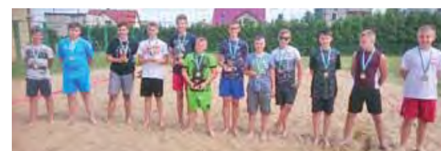
Siatkarze biorący udział w Gminnym Turnieju Piłki Siatkowej Chłopców.