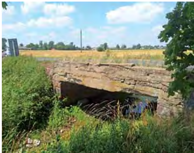
Most w Bąkowie od dawna wymaga gruntownego remontu.

Powiat otrzymał na ten cel dotację w wysokości 1 195 000 złotych z Ministerstwa Infrastruktury. Chodzi o środki finansowe, pochodzące z programu modernizacji tego typu obiektów. W ramach programu można było ubiegać się o dotację w wysokości 50% kosztu modernizacji. Po rozpatrzeniu wniosków okazało się, że środków na dofinansowanie Ministerstwo posiada więcej niż chętnych ubiegających się o ich przyznanie, dlatego ostatecznie kwotę tę zwiększono do 66%, czyli wspomnianego 1 195 000 złotych.