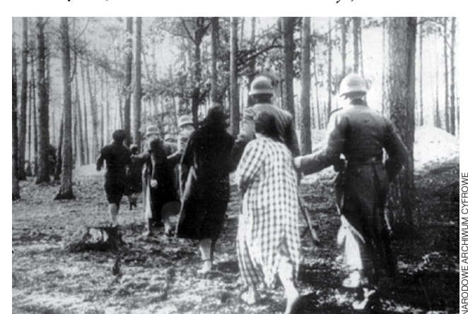
Okolice Palmir, 1940-1941. Grupa Polaków prowadzona przez niemieckich policjantów na rozstrzelanie.

■ Zygmunt Klukowski (ordynator szpitala) w dzienniku