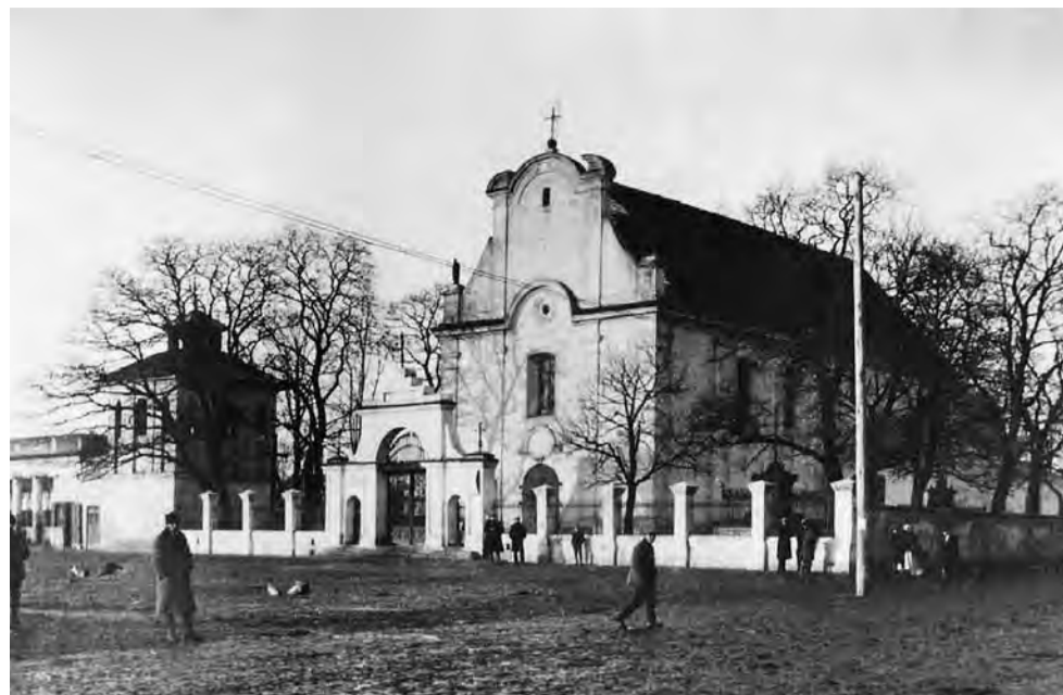
Kościół w dwudziestolecu międzywojennym. Bez wieżyczki z grobowcami za ogrodzeniem, które Niemcy usunęli podczas okupacji w czasie II wojny światowej.

Żychlin | Historia parafii – wpleciona w historię miasta