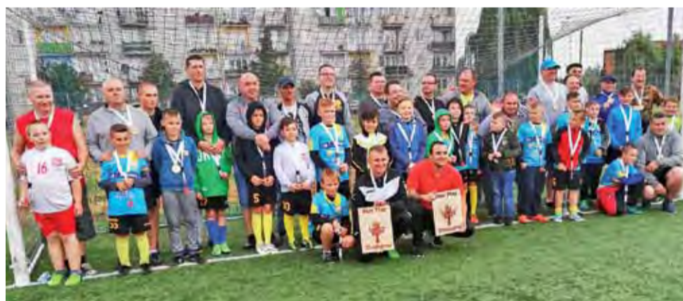
Młodzi zawodnicy KS Żychlin wraz ze swoimi ojcami podczas Dnia Ojca zorganizowanego przez KS Żychlin.