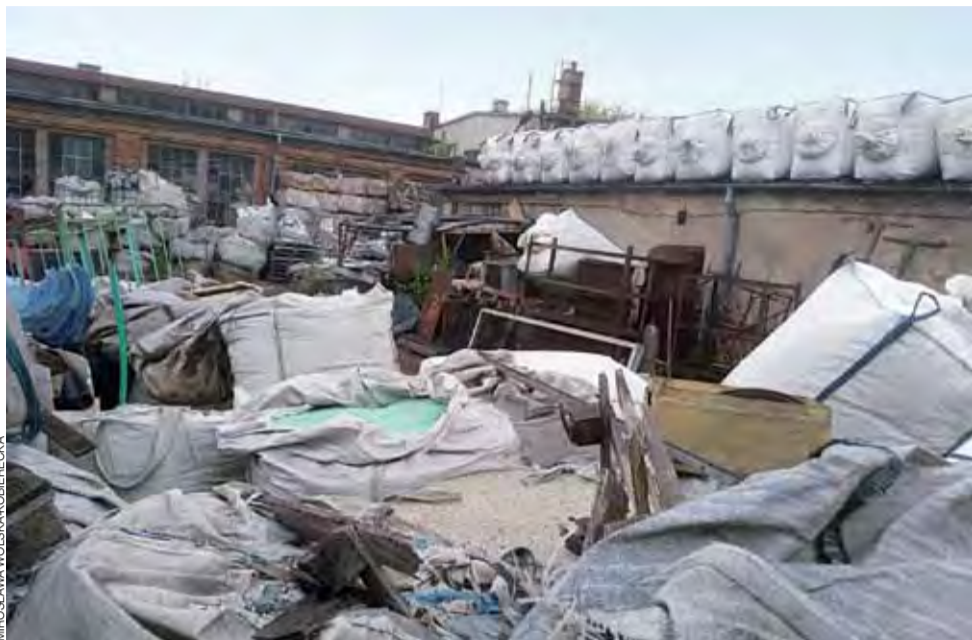
PSP planuje kontrolę także na terenie firmy przy ul. Nadburzańskej, która zajmowała się recyklingiem. Właściciel został już wcześniej ukarany mandatem za nieprawidłowe składowanie odpadów. Tak obecnie wygląda ten teren.