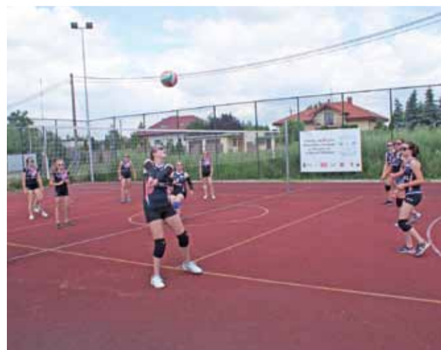
Mecz pomiędzy dziewczętami Gimnazjum Żychlin a drużyną Gimnazjum w Domaniewicach podczas półfinału wojewódzkiego.

Sport Szkolny | Finał Powiatowej Orlikowej Ligi Mistrzów