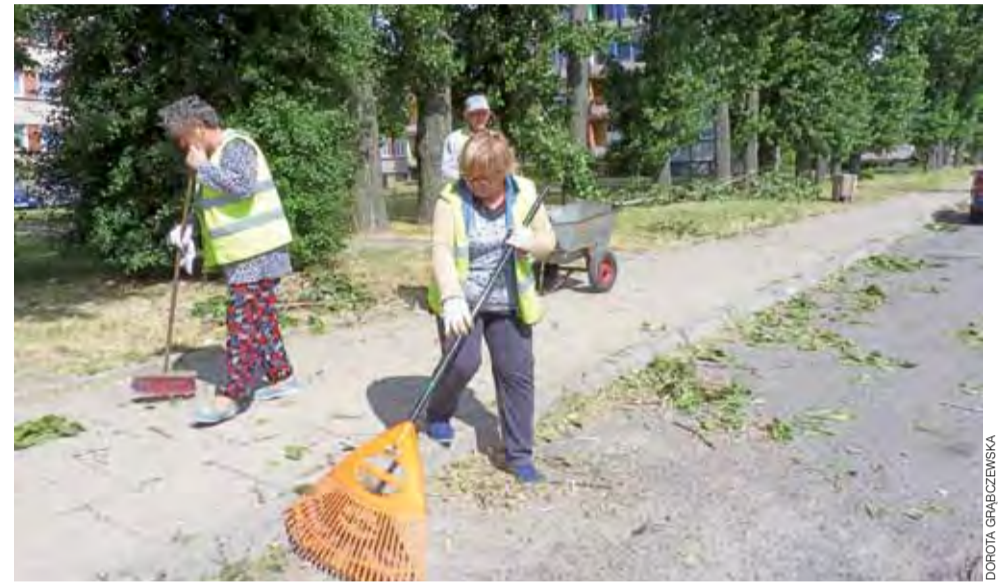
Wichura z czwartku na piątek oszczędziła Żychlin, choć i tu były połamane drzewa i gałęzie. Od rana do pracy przystąpili pracownicy z robót publicznych.

– W gminach Żychlin, Oporów i Bedlno strażacy interwenio-