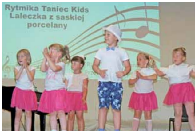
W układzie tanecznym dzieci uczestniczące w zajęciach rytmiki w domu kultury.