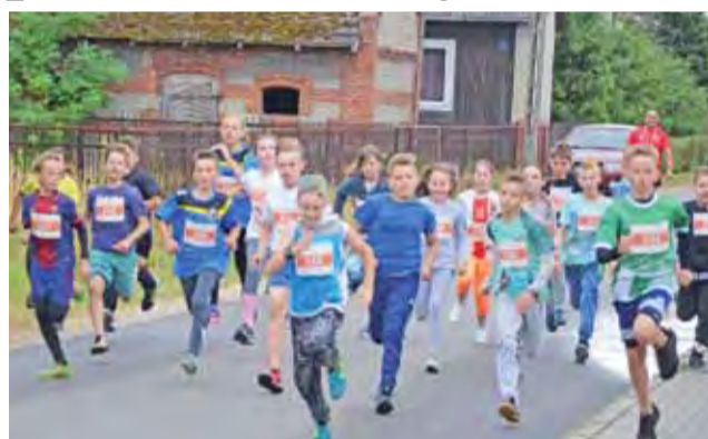
Bieg główny cieszył się najlepszą obsadą, ale wcześniej równie emocjonująca była rywalizacja w młodszych kategoriach wiekowych (na krótszych dystansach).