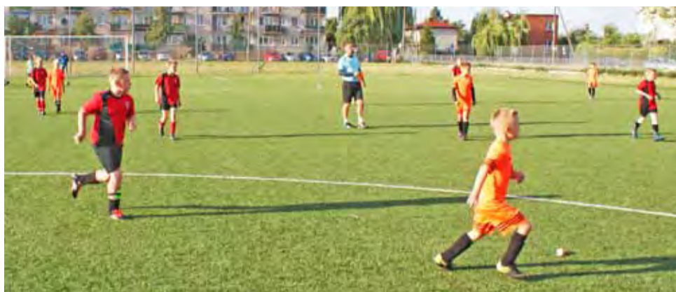
Jeden z meczów rozegranych przez chłopców rocznika 2008/2009 podczas turnieju piłki nożnej na stadionie miejskim w Żychlinie. Spotkanie GKS Bedno z Soccer Kids.