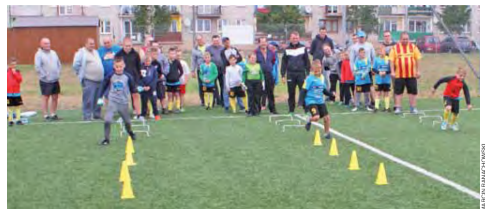
Rywalizacja młodych futbolistów i ich ojców