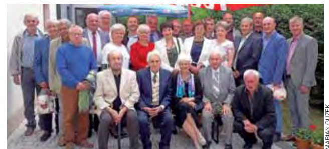
42 lata od matury i 7 lat od poprzedniego spotkania - teraz absolwenci z tej klasy chcą się, w miarę możliwości, spotykać częściej.

Dodajmy, że jubileuszowe spotkanie nie było pierwszym po maturze. Absolwenci regularnie widują się co kilka lat, by przy tej okazji uczcić kolejne jubileusze. Niektórzy z nich utrzymują ze sobą częstszy kontakt i razem świętują inne okazje, np.: wspólne uroczystości oplatkowe. Pod koniec wydarzenia wyrazili oni nadzieję, że będzie im dane w dobrym zdrowiu spotkać się za pięć lat, podczas świętowania kolejnej, już siedemdziesiątej rocznicy. aw