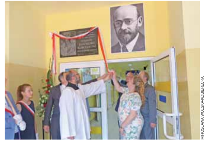
Odsłonięcie tablicy poświęconej patronowi – Januszowi Korczakowi.