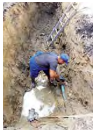
Usuwanie awarii na wodociągu wody surowej przy ulicy Waryńskiego trwało kilka godzin.

Awaria nastąpiła na stosunkowo nowym odcinku sieci wody surowej, na złączeniu rur wodociągowych. Po południu awaria została usunięta. Jak mówią pracownicy zakładu wodociągów i kanalizacji, to drobna awaria, której skutków mieszkańcy nie odczuli. dag