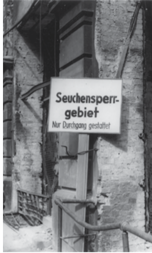
Warszawa, 4 kwietnia 1940. Tablica z napisem „Obszar zagrożony tyfusem. Dozwolony tylko przejazd” umieszczona na terenie, który miał znaleźć się w granicach getta.