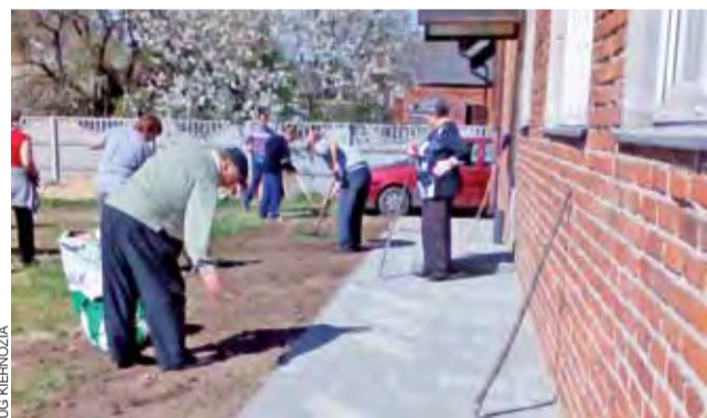
Plac przyległy do lokalu stowarzyszenia został przez członków stowarzyszenia zagospodarowany, tj. odgruzowany, ogrodzony, obsiany.

Za pozyskane pieniądze wyremontowane mają zostać m.in. siedziska przy boisku, ogrodzenie, budynek gospodarczy i szatnie oraz zamontowane zostaną nowe piłkochwyty. Poprawiony ma zostać też stan murawy.