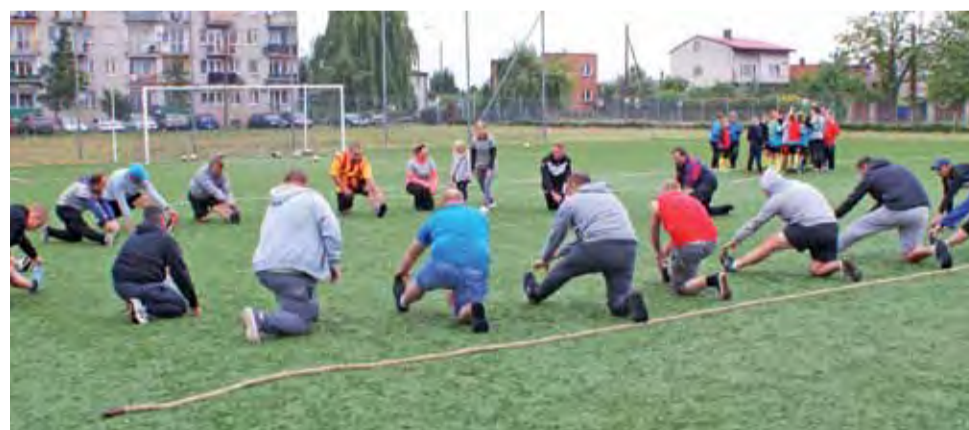
Rozgrzewka ojców młodych piłkarzy KS Żychlin.

Tatusiowie przeciągali linę, kręcili hula hop, pomagali dzieciom skaczącym w workach i brali z nimi udział w wielu innych konkurencjach, były też zagadki umy-