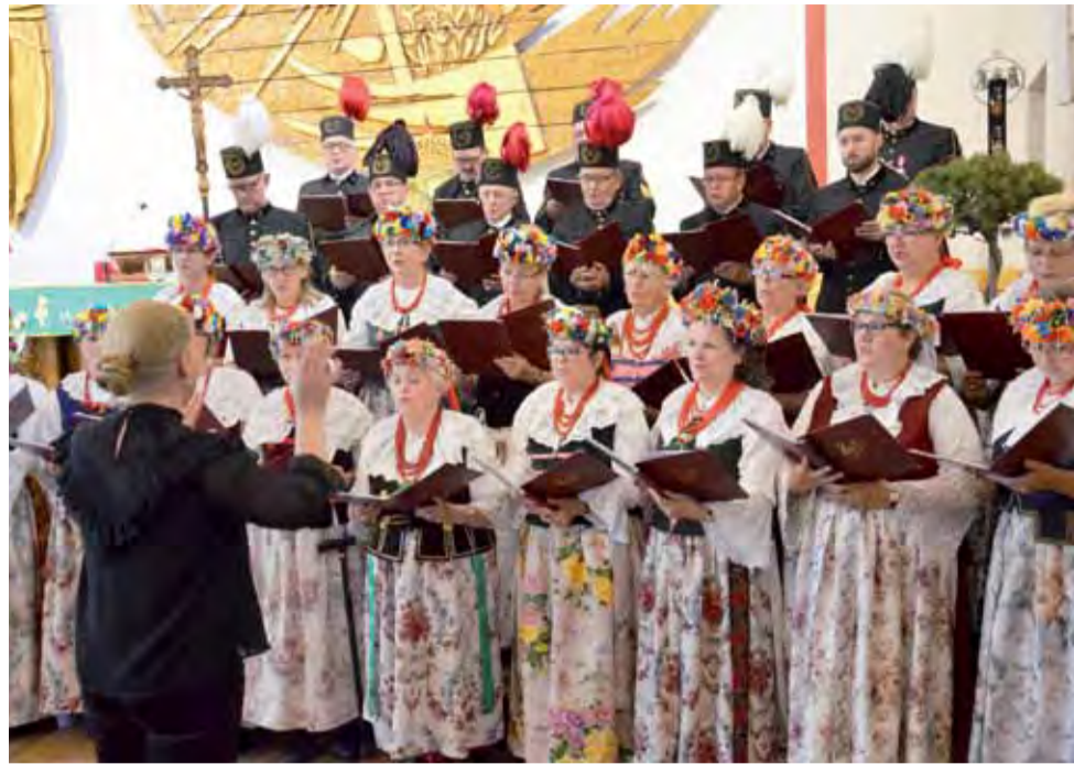
Występ chóru „Jutrzenka”. Ci, którzy mieli szczęście być na mszy świętej i nabożeństwie w Boczach Chełmońskich, muszą przyznać, że goście ze Śląska zaprezentowali śpiew na bardzo wysokim poziomie.

Warto dodać, że chór z Nakła Śląskiego działa od 1911 roku i wielokrotnie koncertował w kraju i za granicą. tm