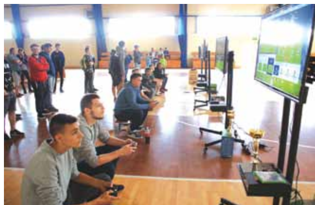
Zawodnicy e-sportu FIFA 2018 rywalizowali na pięciu stanowiskach.

Każdy z uczestników zawodów otrzymał pamiątkowy medal,