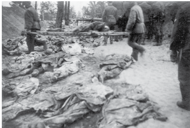
Katyn (ZSRR), 1943. Ekshumacja mogił polskich oficerów.