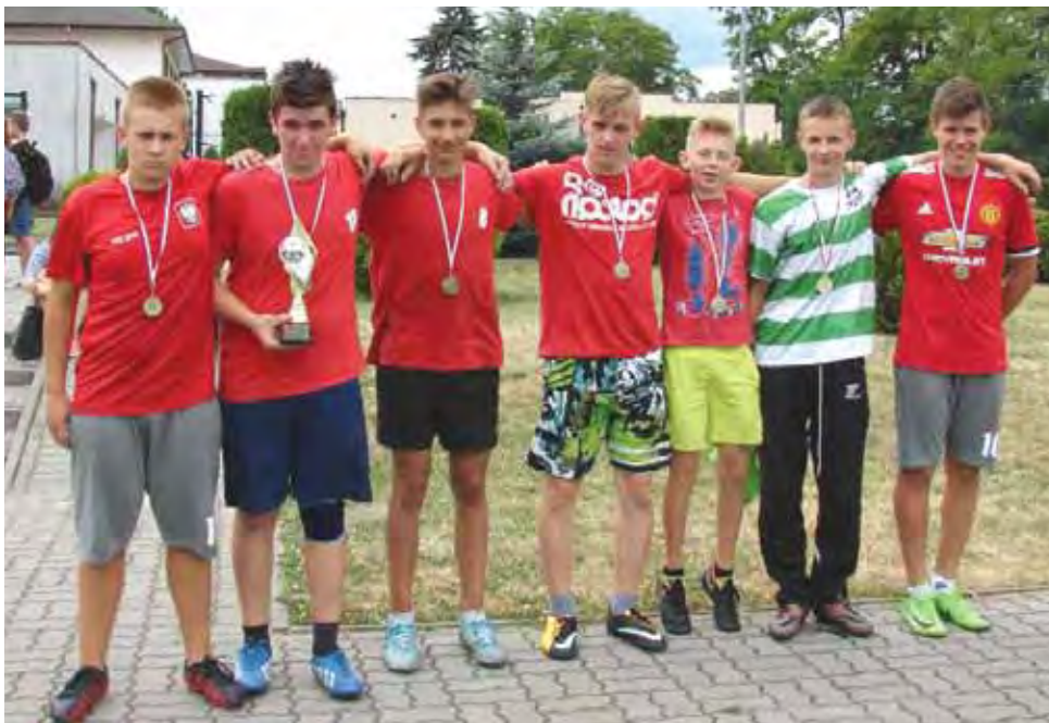
Zwycięska drużyna młodych piłkarzy w Turnieju Międzyklasowym w Strzelcach.