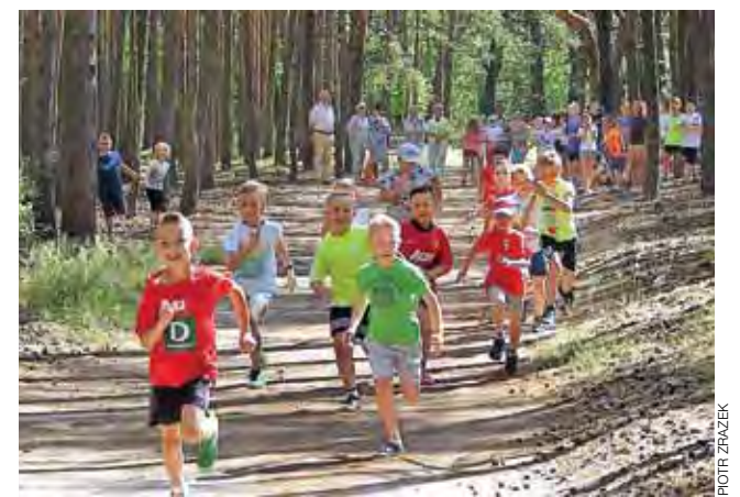
Uśmiech na ustach biegaczy jest bezcenny.

Dodatковым punktem programu podczas Dnia Zdrowia był konkurs wiedzy o zdrowiu, w którym wzięły udział wszystkie kla-