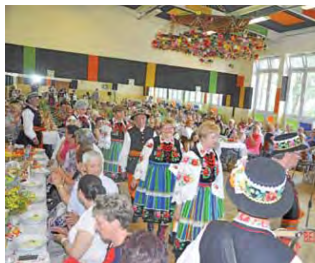
W inauguracji brali udział seniorzy z trzech gmin.

Centrum Aktywności Seniora to projekt przygotowany przez Stowarzyszenie Wspieranie Społeczne „Ja-Ty-My” z siedzibą w Łodzi w współpracy z działającym w Łowiczu Zakładem Aktywności Zawodowej. Projekt ma na celu aktywizację osób po 60. roku życia, dlatego obejmuje bogatą ofertę zajęciową, dostosowa-