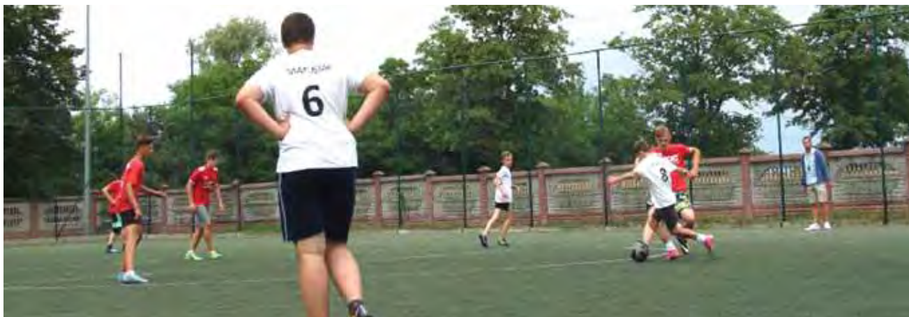
Jedno ze spotkań rozegranych podczas turnieju w piłkę nożną w Strzelcach.

Nowy Łowiczanie Tygodnik Ziemi Łowickiej członek Stowarzyszenia Gazet Lokalnych