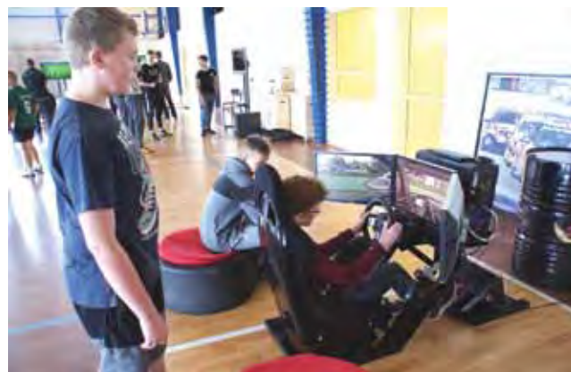
Kibice przybyli na żychlińskie zawody e-sportu mieli możliwość zagrania na symulatorze F1.