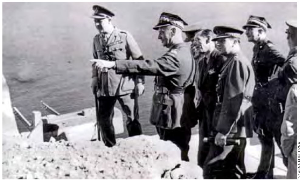
Gibraltar, 4 lipca 1943. Jedno z ostatnich zdjęć gen. Władysława Sikorskiego.

o zerwaniu przez Sowiety stosunków dyplomatycznych z rządem polskim. [...] „Daily Worker” szaleje: rząd polski to profaszyści, antysemita, antybrytyjski, antysowiecki, w zmoiwie z hitlerowcami itp. [...] Min. Eden powiedział, że sprawę można by załagodzić, gdyby gen. Sikorski osobiście odwołał wezwanie skierowane do Czerwonego Krzyża i publicznie oświadczył, iż wycofano zarzuty. Minister [Spraw Zagranicznych Wielkiej Brytanii Anthony] Eden usilnie nalegał na wykończenie tych warunków „taktuicznych”. Generał Sikorski stanowczo odmówił.