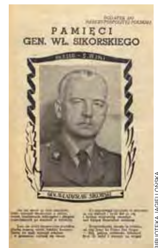
Okladka dodatku do czasopisma „Rzeczpospolita Polska” z lipca 1943 roku po śmierci gen. Władysława Sikorskiego.