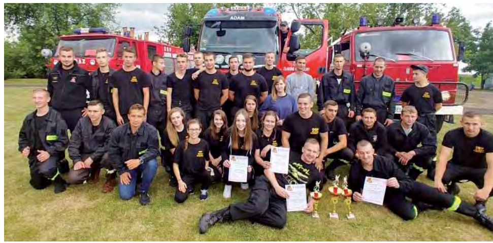
Wspólne zdjęcie reprezentacji OSP Złaków Kościelny (dwie drużyny męskie oraz kobieca) wraz z męską drużyną z Retek.

II miejsce w kategorii męczyzn zajęła drużyna z Retek, uzyskała ona łączny wynik 113,8 pkt., na III miejscu znalazła się drużyna z Wiskienicy Dolnej, która uzyskała wynik 120,9 pkt. Przypomnijmy, że w ubiegłym roku strażacy z tej jednostki zajęli pierwsze miejsce, zdobywając 109,3 pkt. W niedzielę najlepiej