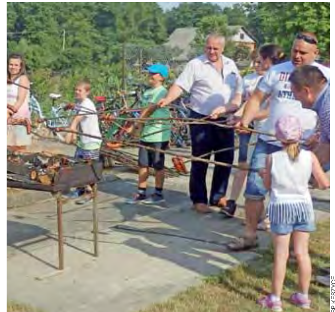
Pieczenie kiełbasek nad grillem zamienionym na ognisko było jedną z atrakcji festynu rodzinnego przy SP Kęszycy.

Uczennica uważa, że za 45 lat gmina rozwine się pod kątem ekologii. – Na dachach będą kolektory słoneczne, zaś przy domach będą elektrownie wiatrowe – opowiada nam o swojej wizji. W jej wyobrażeniu powstanie też o wiele więcej miejsc, gdzie będzie można się spotkać z przyjaciółmi i rodziną, a będą to np. kino czy restauracja. aa