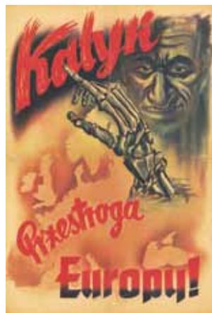
Niemiecki plakat propagandowy z 1943 roku dotyczący zbrodni katyńskiej.

■ 26 kwietnia 1943 – ZSRR zrywa stosunki dyplomatyczne z Polską i przestaje uznawać rząd polski na uchodźstwie. Jako powód podaje wiarę polskich władz w hitlerowską propagandę dotyczącą zbrodni katyńskiej.