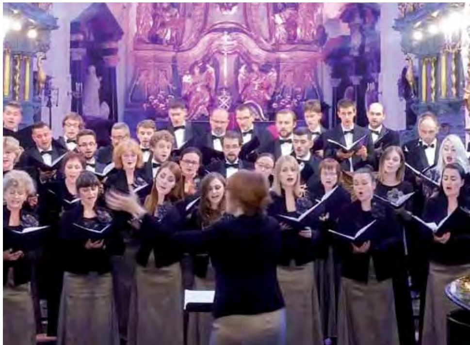
Chór Filharmonii Łódzkiej w łowickiej bazylice katedralnej zainaugurował w w niedzielę Wędrówny Festiwal Kolory Polski.

Wykonanie utworu było ukłonem w stronę Łowicza, w którym niedzielny koncert zainaugurowana została 19. edycja Wędrównego Festiwalu Kolory Polski, w programie którego jest 18. koncertów na terenie województwa łódzkiego. Koncert chóru sprawił, że świątynia wypełniła się po brzegi miłośnikami muzyki poważnej. Wielu z nich specjalnie przejechało tego dnia do Łowicza z Łodzi, Zgierza, Warszawy, a nawet dalszych