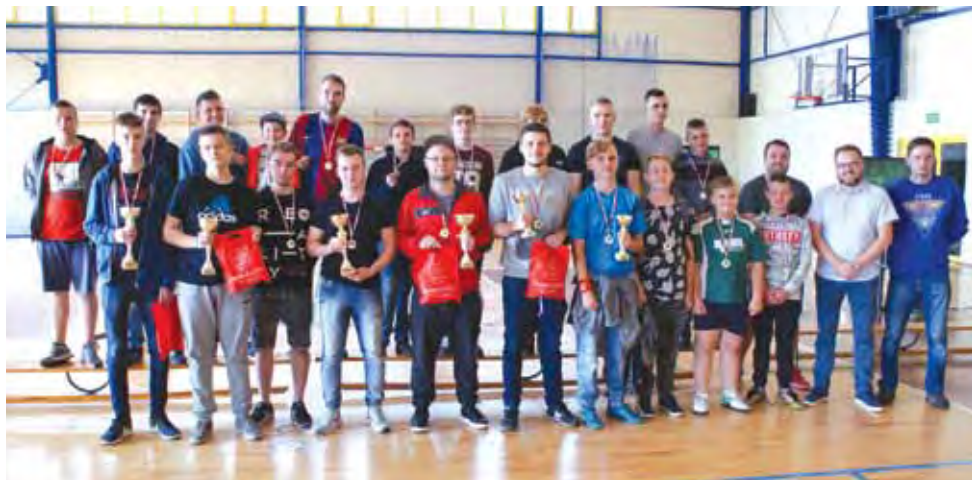
Uczestnicy e-zawodów FIFA 2018 zorganizowanych w Żychlinie.