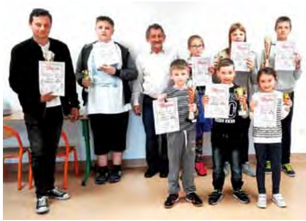
Zawodnicy ze Zdun po rozegranym turnieju o Mistrzostwo Gminy.

Ośmiu młodych szachistów wystąpiło w II Mistrzostwach klubu w szachach klasycznych. Zawody były bardzo wyrównane, gdyż aż 3 juniorów zdobyło po 4,5