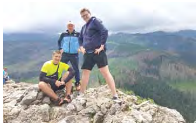
Górskie wycieczki też mają wpływ na formę sportowców.