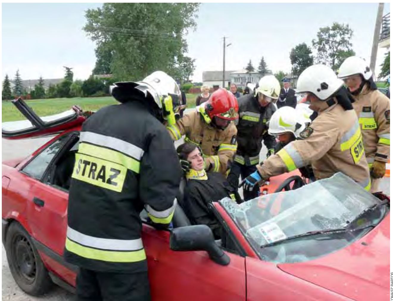
Po zakończeniu uroczystości jubileuszowych strażacy z Pilaszkowa zaprosili gości na pokaz ratownictwa technicznego.