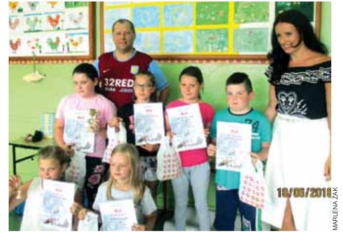
W szachy grają też dziewczęta. Na zdjęciu grupa z GOK Domaniewice.

Pierwsze miejsce w turnieju dla zawodników początkujących padło