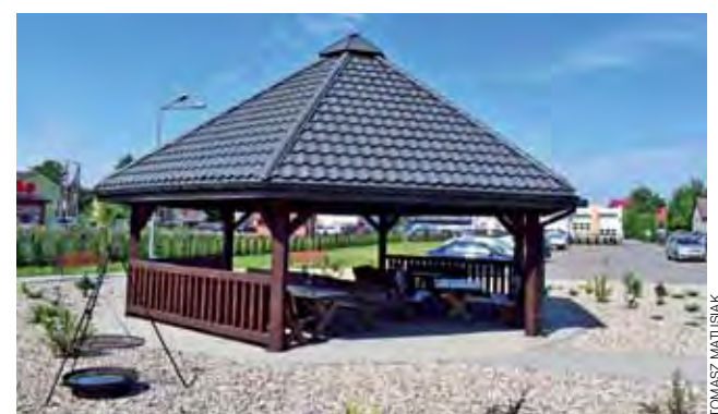
Altana przy GOKiS w Łyszkowicach. Czy firma użyła takiego drewna tej jakości, o którą chodziło?

O sprawie powiadomiła właściwe organy inna firma, także z gminy Łyszkowice, która w tamtym roku również składała ofertę na wykonanie zlecenia, ale jej oferta była zdecydowanie wyższa (67 tys. zł przy 47,5 tys. zł oferowanych przez późniejszego