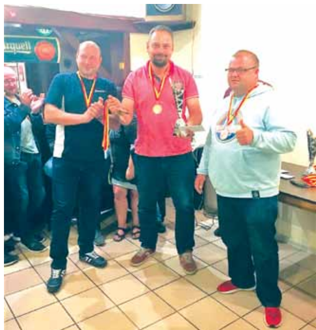
Zadowoleni po gali podsumowującej I ligi ŁSD.