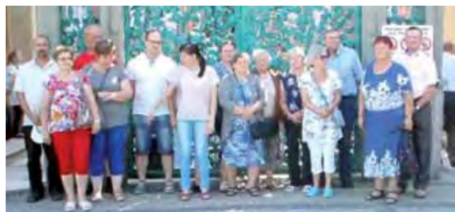
Członkowie wycieczki z gminy Bolimów przy wejściu do sanktuarium w Św. Lipce.

Zgłoszenia można nadsyłać do 21 września na adres GOK w Domaniewicach (ul. Główna 3, 99-434 Domaniewice) lub mailowo na gokdomaniewice@wp.pl. Sam konkurs „Wolność jest w nas” odbędzie się 24 września. Laureaci wystąpią także w GOK na koncercie z okazji 100-lecia odzyskania niepodległości, przewidzianym na 11 listopada w GOK. ki