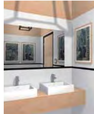
Tak będzie wyglądała toaleta męska po modernizacji.

Planowane w najbliższym czasie prace zostaną wykonane w ramach projektu „Modernizacja Kina Fenix – zmieniamy się dla widzów”. W pierwszym półroczu