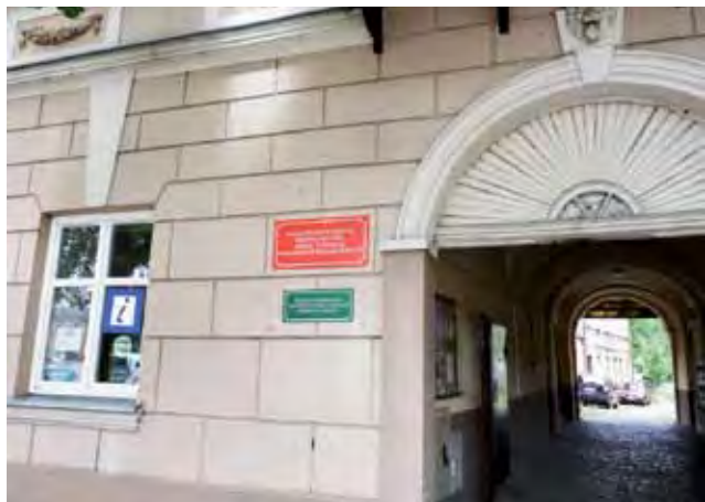
Miejski Punkt Informacji Turystycznej przy Starym Rynku. Łowiczanie dobrze znają to miejsce, ale czy trafią tu turyści?

Uważa on, że udało się dla tego punktu znaleźć właściwą lokalizację. Obiekt ten znajduje się w sąsiedztwie biura PTTK, a jego bliskość sprawia, że za jednym zamachem dostępna jest dla turysty