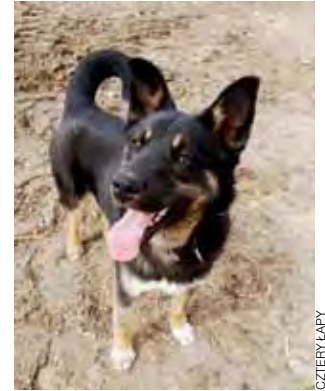
Stowarzyszenie Cztery Łapy poszukuje psa Dolar, który w dziwnych okolicznościach zniknął z przytuliska.