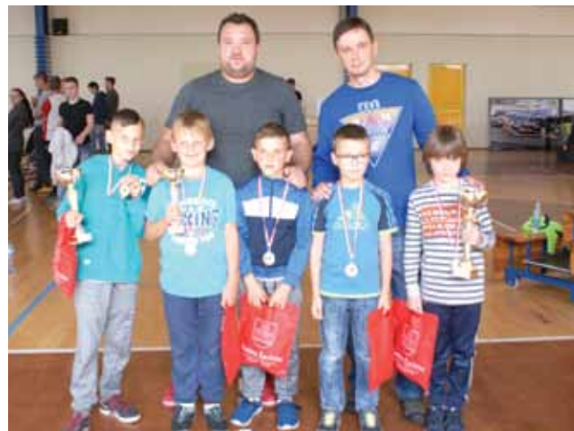
Zawodnicy e-sportu FIFA 2018 w najmłodszej kategorii 10 lat.