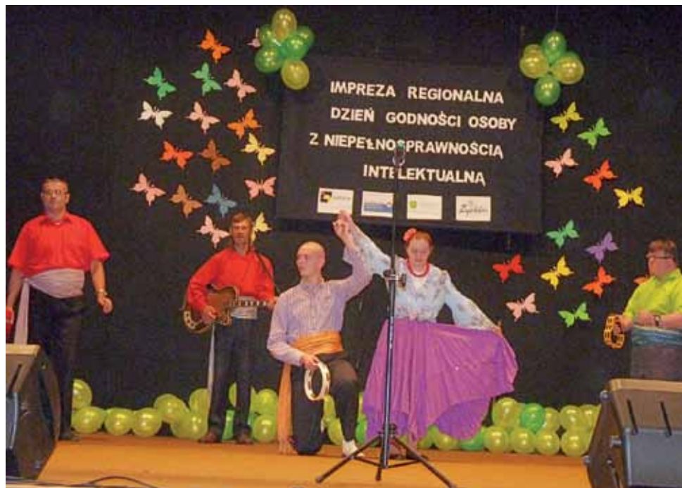
Na scenie ŻDK w cygańskim tańcu wystąpili podopieczni WTZ Caritas Diecezji Łowickiej.

sandrów Łódzki, WTZ Parma, Środowiskowy Dom Samopomocy w Aleksandrowie Łódzkim, Środowiskowy Dom Samopomo-