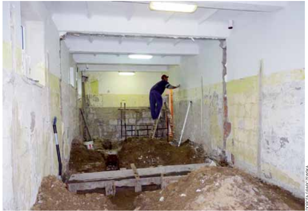
Tak wygląda pomieszczenie wzdłuż sali gimnastycznej, w której dotychczas były sanitariaty. Wyburzono ściany i zrobiono głębokie wykopy pod instalację wodno-kanalizacyjną

We wszystkich remontowanych pomieszczeniach sanitarnych zostanie wymieniona instalacja centralnego ogrzewania. Bezpowrotnie znikną stare fawieri.