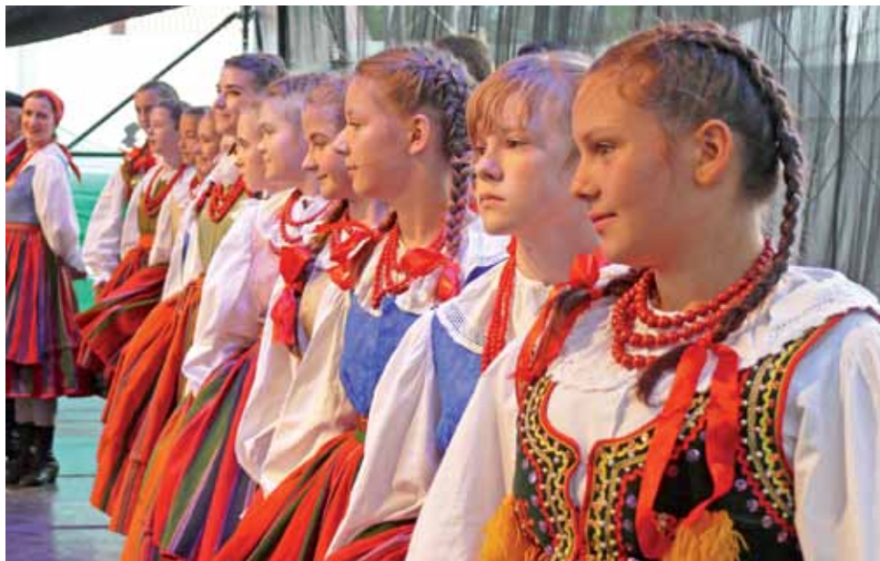
Najmłodsze pokolenie zespołu Sanniki – kilkunastoletnie dziewczęta w niedzielę głównie śpiewały.