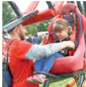
Jedna z atrakcji festynu w Chąśnie – zrykoskop lub inaczey symulator przeciężeń.

Tradycyjnie na festynie nie brakowało stoisk oferujących zabawki dla dzieci oraz jadło. Koła Gospodyń Wiejskich z terenu gminy zaferowały bawiącym się gruchówkę i czerwony barszcz. Ta pierwsza zupa przygotowana zo-