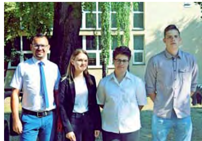
Laureaci konkursu „Policjanci w służbie historii”.