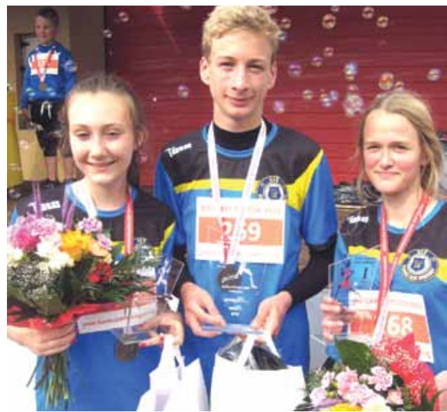
Najlepsi zawodnicy klubu Pijarskiego po biegu w Polesiu.

Uczestnicy biegów w Polesiu zostali nagrodzeni pięknymi pa-