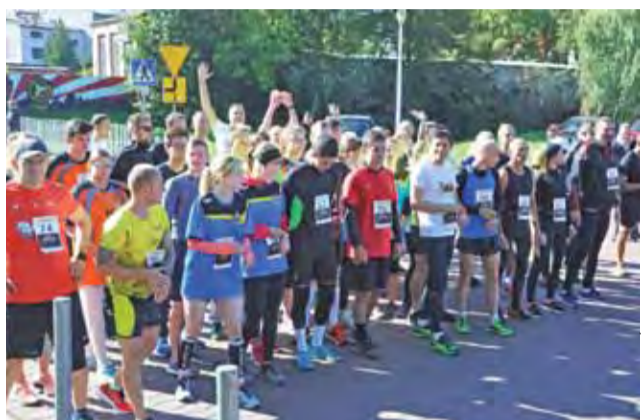
Start do biegu głównego na dystansie 5 kilometrów.

Wśród rodziców wiele emocji budziły biegi przedszkolaków i zawodników z klas młodszych szkół podstawowych. Tu o zwycięstwo walka trwała zawsze do końca. Medal na szyi był super nagrodą. W biegach młodzieżowych rewelacyjnie zaprezentowali się zawodnicy z UKS Pijarski Klub Sportowy. Podopieczni Ta-