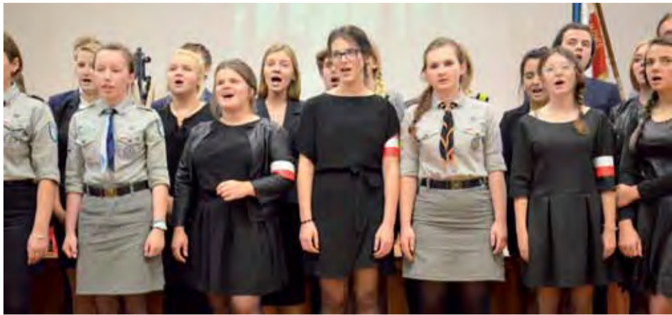
Młodzież z II LO jak co roku zaśpiewała pieśni związane z Szarymi Szeregami, w tym ich hymn.

Łowicz | Zjazd Stowarzyszenia Szarych Szeregów