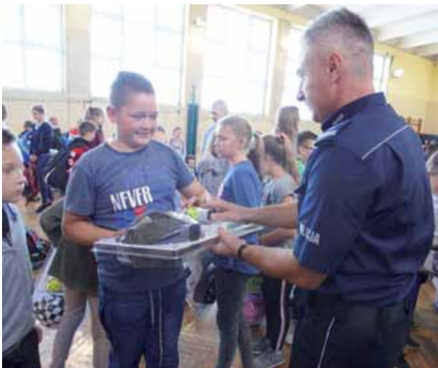
Po cyklu warsztatów o bezpieczeństwie uczniowie z SP Pacyna dostali zestawy rowerowe i odblaski.