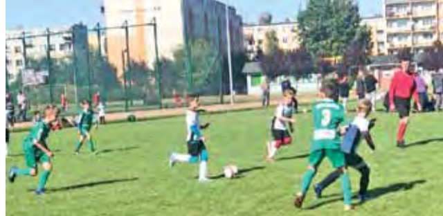
Drużyna Pelikana-2008 nieudanie wystąpiła w Sieradzu.

– Zagrałiśmy bardzo słabo. Przede wszystkim zabrakło woli walki, determinacji, a bez tego nie da się zrobić nic. Rywal to wykorzystał i stąd taki wynik. Mimo niekorzystnego wyniku staraliśmy się rozgrywać piłkę, ale zupełnie to nie wychodziło. Druga sprawa to gra na naturalnym boisku co jest dla nas wielkim problemem. Zawodnicy mają problem z poruszaniem się, podaniami. Mieliśmy zajęcia przed meczem na boisku naturalnym, ale jak widać mało dały. Dalej uważam, że sportowo, a tak bardzo nie odbiegamy od rywali. Niestety tutaj musi podnieść się psychicznie po porażkach. Bę-