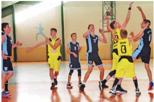
Z ekipą Basket 2010 Książacy walczyli równo do przerwy.

serbskiemu szkoleniowcowi wiele powodów do radości.