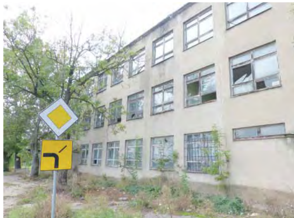
Wiele szyb w budynku RSP jest powybijanych. Jak się dowiedzieliśmy, uszkodzony jest też dach i stropy.

Warto dodać, że RSP jest właścicielem jedynie nanieści, gruntu pod jej dawnym siedliskiem są własnością gminy. Jest to około 9 ha. Biurowiec nie jest jedynym budynkiem, jaki się na tym terenie znajduje, ale jest z nich największy i najwyższy. Pozostałe nie są w lepszym stanie i też nadają się do wyburzenia.