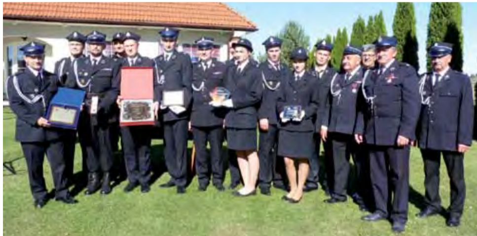
Pamiątkowe zdjęcie z okazji 100-lecia OSP Skórzewa.