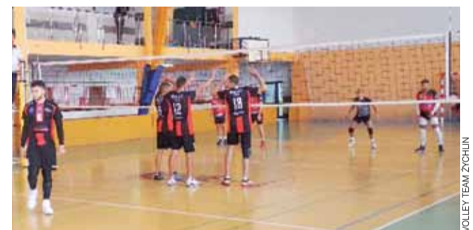
Jedno ze spotkań rozegranych przez seniorów Volley Team Żychlin.