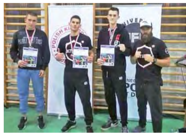
Łowiccy miłośnicy tajskiego boks z medalami Mistrzostw Polski.