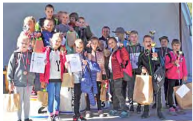
Zadowolona ze startu w biegu ekipa Szkoły Podstawowej w Bąkowie.

Duathlon | Mistrzostwa Polski M.Group w Duathlonie