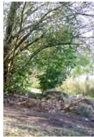
Pod drzewem koło Tesco znów leżą śmieci sprzątnięte z pobliskiego skweru.