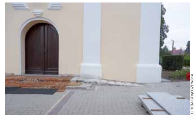
Od kilku tygodni parafianie do kościoła w Żychlinie wchodzi po dywanach. Płyty granitowe czekają na założenie.

Tymczasem minął miesiąc i schody nadal są przykryte dywanem. 14 września były kościelne uroczystości, był biskup i schody