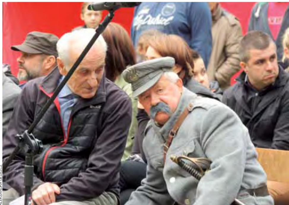
Piknik Narodowy w Dobrzelinie.

Rzeczywiście, tym razem sklep oddał pieniądze za wadliwe buty. To pokazuje, że zwykły człowiek w walce z konsorcjum może być bezradny, ale gdy się handlowa ma do czynienia już z rzecznikiem praw konsumenta, zmienia swoje stanowisko. Podstawą reklamacji jest jednak paragon, a te często gubimy – i wtedy reklamacja staje się niemożliwa. dag