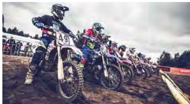
Start do jednego z wyścigów w Serokach.

Pierwsi na torze pojawili się najmłodszy zawodnicy klasy MINI. Rośnie zainteresowanie w gronie najmłodszych tą dyscypliną. Na starcie stanęła grupa aż 15 dzieciaków. – Wielka w tym zasługa Krzysztofa Jarmuza, który od początku mocno wspiera organizację rywalizacji w tej klasie – podkreślają działacze ŁKM.