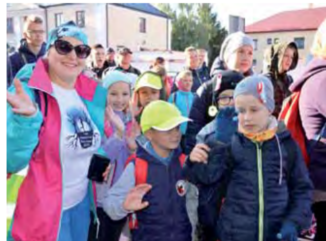
Uczestnicy rajdu zebrał się przed budynkiem Urzędu Gminy Łowicz.

W sobotni wieczór w Gzinie bawili się około 50 osób. tm