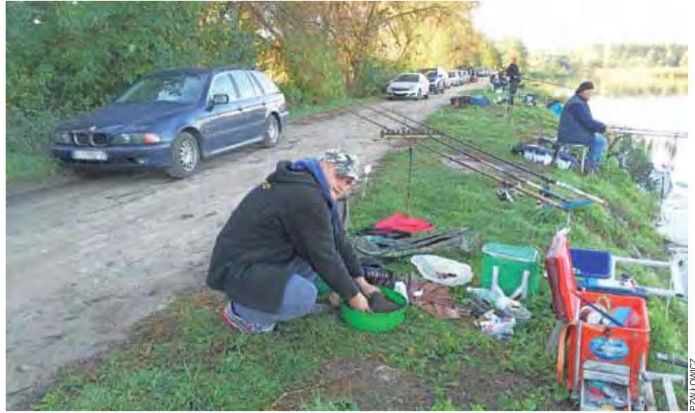
Najpierw zanęcić, a potem wędkować – zdjęcie wykonano podczas przygotowań do wędkowania.

Kolejne zawody organizowane przez koło PZW Łowicz zaplanowano na 21 października. Będą to tym razem zawody spinningowe. Rozegrane zostaną także na zalewie za lasem w Łowiczu. opr. mak