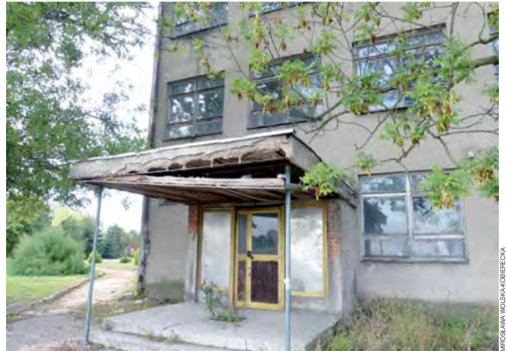
Daszek nad wejściem do dawnego biurowca rozwarstwił się i w każdej chwili może runąć.