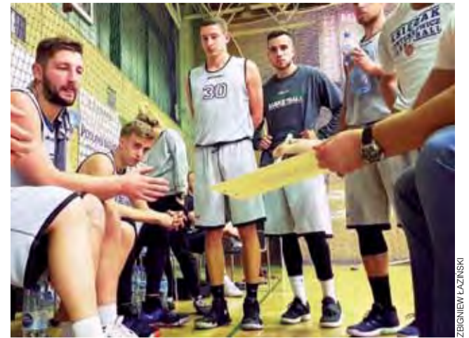
Książacy w dobrym stylu pokonali Polfarmex Kutno i pokazali, że będą groźni w lidze.