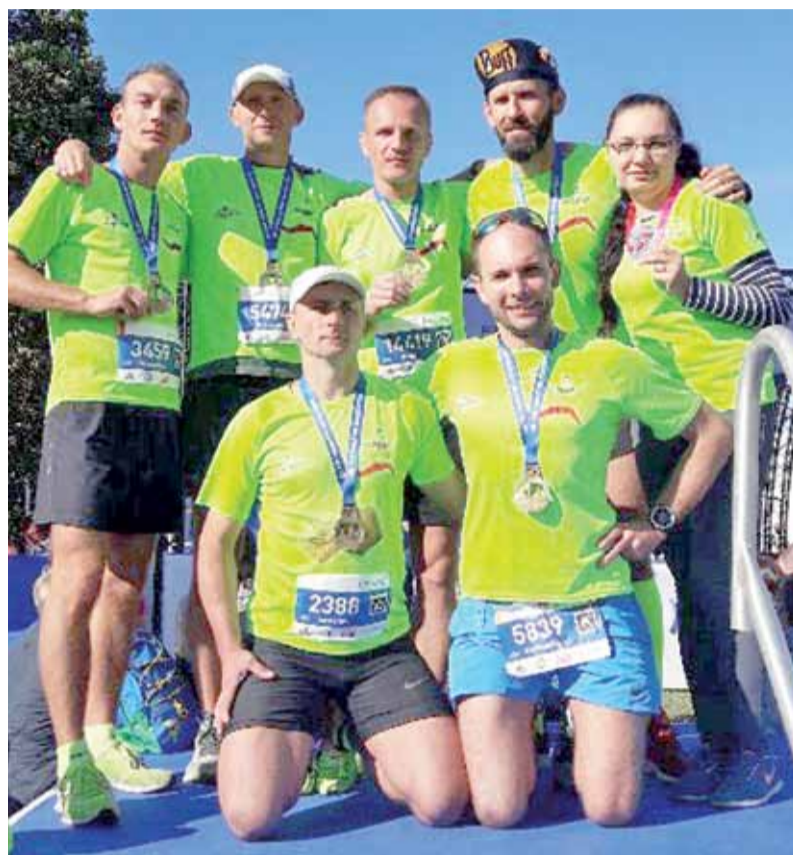
Członkowie grupy Rozbiegani Żychlin, którzy pokonali trasę 40. PZU Maratonu w Warszawie oraz towarzyszącemu Biegu na Piątkę (5 km).

Lekkoatletyka | 40. PZU Maraton Warszawski, 38. Biegu Soczewka z BOP