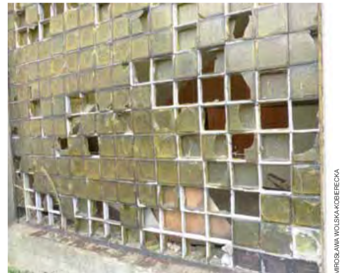
Tak z bliska wyglądają szklane luksfery, znajdujące się w szczycie budynku.

dzi już żadnej działalności, może być w trudnej sytuacji finansowej i nie mieć na to pieniędzy. Zabezpieczenie będzie na pewno prostsze i tańsze. Na razie Urząd Gminy nie zwracał się z prośbą o interwencję do Powiatowego Nadzoru Budowlanego.