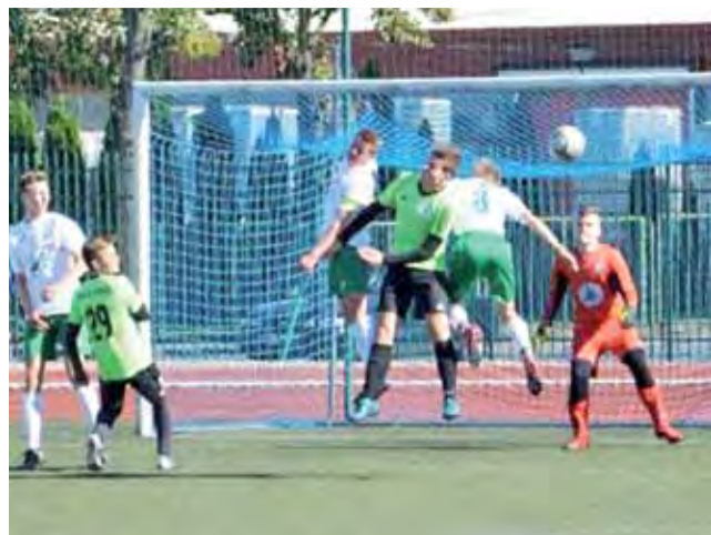
Pelikan 2002 (białe stroje) tylko zremisował z Wartą Sieradz 1:1.