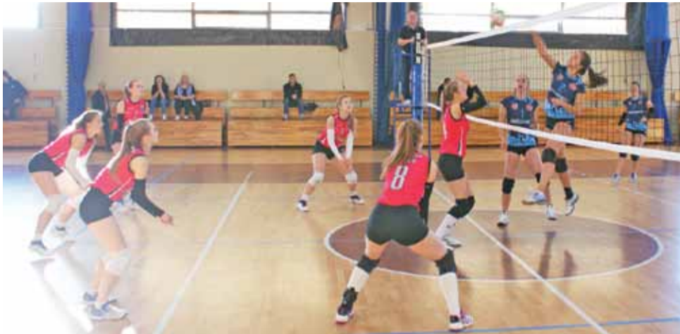
Sobotnie spotkanie siatekarek Volley Team Żychlin kontra UKS Ozorków, które rozegrano w żychlińskiej hali sportowej zakończyło się przegraną gospođyn 1:3.

Następna kolejka spotkań Wojewódzkiej Ligi Juniorek z udziałem Volley Team Żychlin odbędzie się w sobotę 13 października. Siatkarki z Żychlina w Łodzi zmierzą się z KS Dziewiątka Łódź. mr