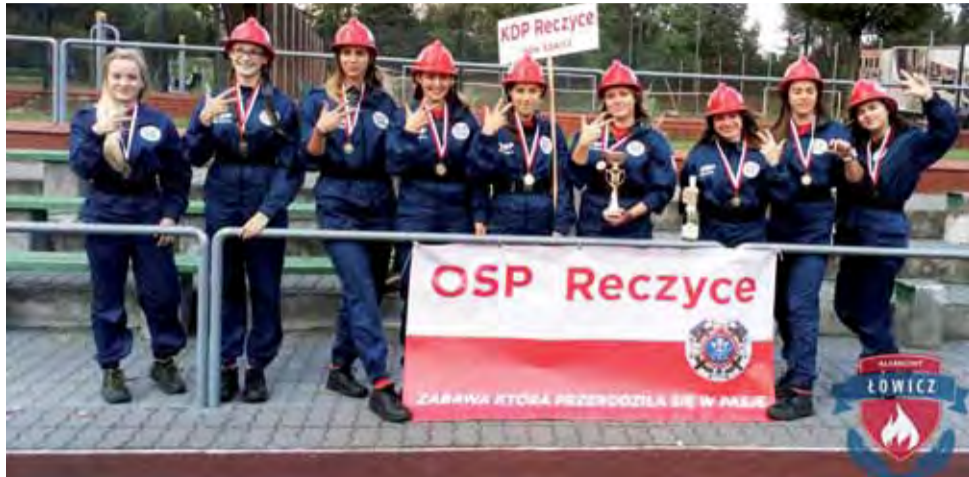
Druhy z OSP Reczyce nie ukrywały swojej radości z tak wysokiego miejsca w ranking.