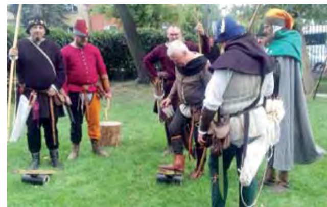
Jedną z atrakcji imprezy było łucznictwo historyczne.