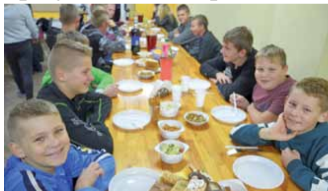
Stół dla młodszej części uczestników zabawy.

Na zewnątrz rozpalono duże grill, ale ponieważ wieczór był już chłodny, cała impreza odbyła się w środku strażnicy. Były