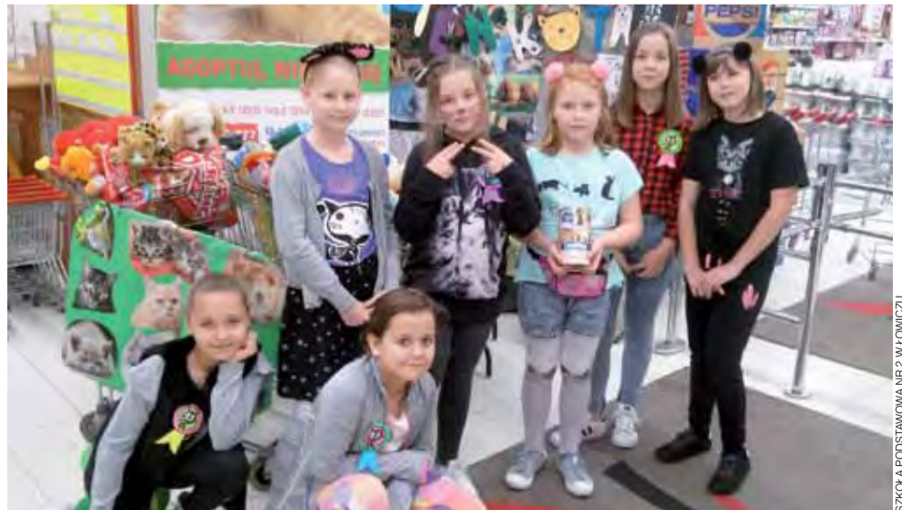
Dzieci ze Szkoły Podstawowej nr 2 w miniony weekend mogły Stowarzyszeniu Cztery Łapy z Łowicza zbierać ponad 196 kg karmy dla zwierząt. Jak będzie w tym tygodniu?

W akcji udział wezmą dzieci ze świetlicy Szkoły Podstawowej nr 2 w Łowiczu, które darczyńców nagrodzą własnoręcznie zrobionymi laurkami i „medalami”. Podobną akcję w poprzedni weekend w markecie Intermarkhè przeprowadziło łowickie Stowarzyszenie