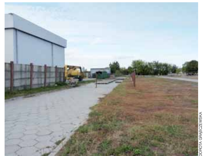
Union Chocolate już zajęło część placu targowego o szerokości 7 m, które kupuje od UG Żychlin. Zrobiono prowizoryczne ogrodzenie z siatki. Teraz widać o ile zostanie pomniejszone targowisko miejskie.

Tak więc targowisko już zostało częściowo zmniejszone. dag