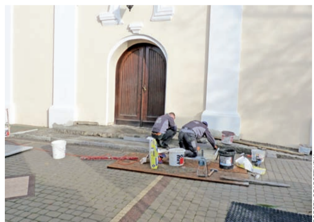
We wtorek rozpoczęto obkładanie schodów granitowymi płytami.

pracy, choć od kilku lat znajduje się ono nie w Nowej Wsi, a w Żychlinie. Młodzież zawsze mnie lubiła, przychodziła do mnie jak do mamy, darzyli mnie sympatią. Ten okres życia będę wspominać z sympatią. dag