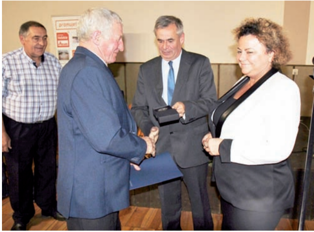
Towarzyszące imprezie wręczenie „Odznak Sołtysów” i listów gratulacyjnych od marszałka województwa odbyło się w remizie OSP Zamiary.

Organizatorem spotkania był Gminny Ośrodek Kultury w Kiernozii, a partnerem regionalnym województwo łódzkie w ramach kampanii Łódzkie Promuje – skąd