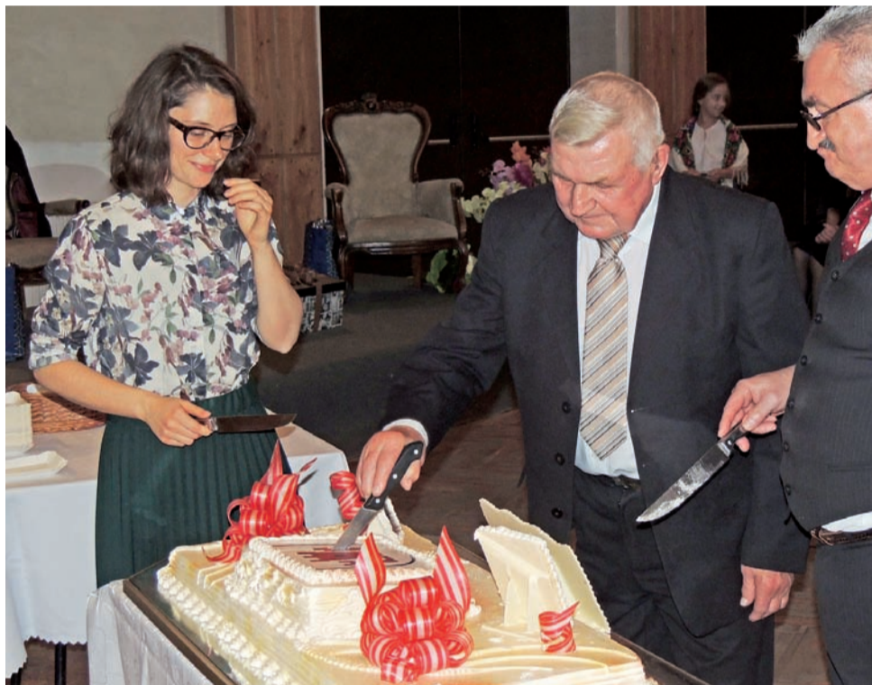
Tort ufundowany przez burmistrza Żychlina dzielony przez jubilatów.