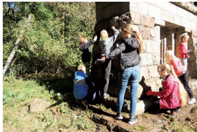
Uczniowie z SP w Pacynie porządkowali teren wokół obelisku żołnierzy z I wojny światowej oraz groby żołnierzy z II wojny światowej znajdujące się na cmentarzu w Lusznynie.

Wzięli udział w zajęciach terenowych szlakiem cmentarzy I wojny światowej przygotowanych i poprowadzonych przez pracowników Muzeum Ziemi Sochaczewskiej i Pola Bitwy nad Bzurą. Odwiedzili nekropolie w: Boli-