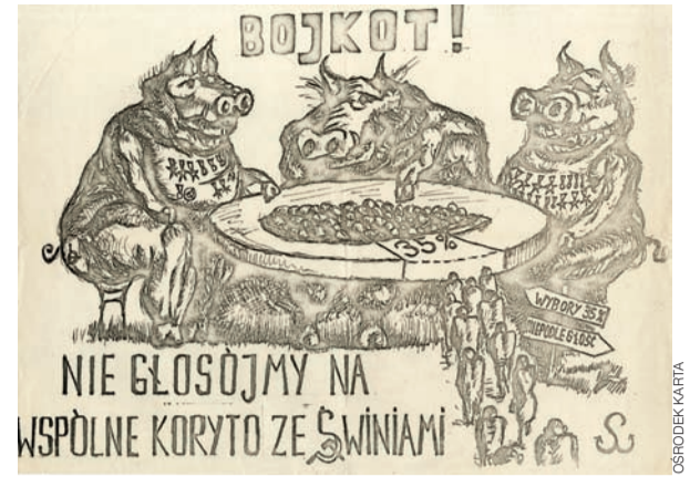
Plakat nawołujący do bojkotu wyborów parlamentarnych w czerwcu 1989 roku.

Historia i Teraźniejszość | Czego nas uczy ostatnie 100 lat