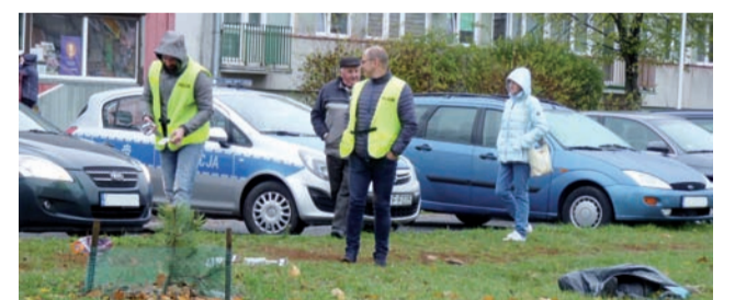
Na miejscu zdarzenia.

Turniej będzie odbywać się w dwóch kategoriach wiekowych: 14-18 lat i powyżej 18 lat. Zwycięzcy otrzymają puchar burmistrza Grzegorza Ambroziaka. Turniej będzie się odbywać w ZS nr 1 im. Adama Mickiewicza. Początek zmagania o godz. 9.00. dag