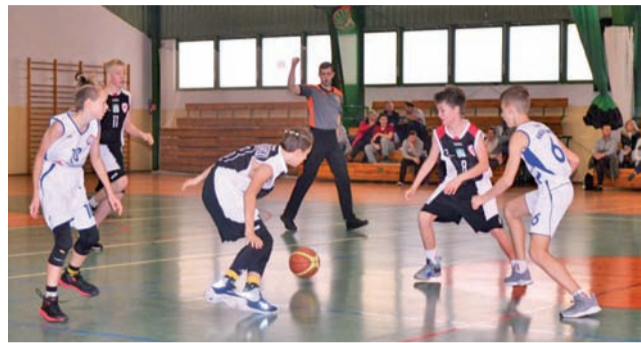
Młodzicy Książka zaczęli sezon od porażki, ale na pewno pojawią się zwycięstwa.

Łodzianie w tym spotkaniu szybko wyszli na prowadzenie i zdołali utrzymać je, spokojnie do końcowego gwizdka. Po pierwszej kwarcie Książek przegrywał dziewięcioma punktami, a do przerwy łowiczanie przegrywali 32:46. W drugiej połowie nasi rywale powoli powiększali przewagę. Łowiczanie walczyli ambitnie, ale strat nie udało się odrobić.