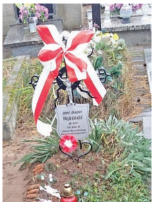
Tak dziś wygląda grób.