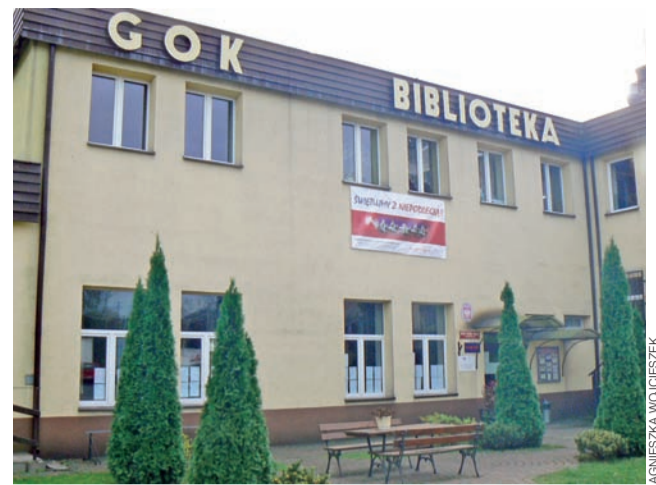
Tak dziś prezentuje się GOK w Domaniewicach. Za dwa lata budynek zostanie rozbudowany.

Szacunkowy koszt rozbudowy obiektu wynosi ok. milion złotych, jednak ostateczną cenę poznamy dopiero po wyłonieniu oferty przetargowej. Całość zrealizowana zostanie ze środków Programu Rozwoju Obszarów Wiejskich na lata 2014-2020, przeznaczonych na inwestycje w obiekty pełniące funkcje kulturalne.