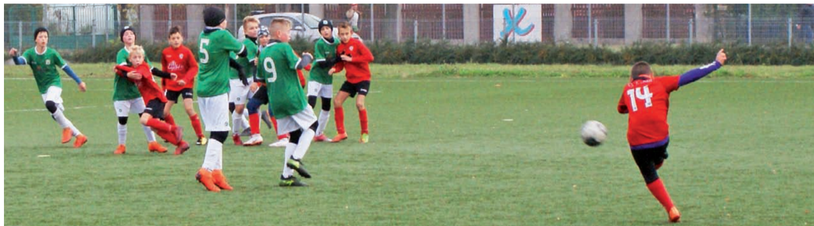
Na zakończenie rozgrywek rundy jesiennej D1 grupa III drużyna KS Żychlin zajęła trzecie miejsce.