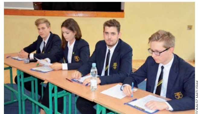
Zwyciężyła drużyna oponentów podanej tezy, tworzona przez uczniów bardziej doświadczonych w prowadzeniu tego typu debat.