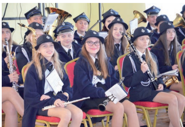
Orkiestrę w Wiciu tworzą osoby będące samoukami, które wszystkie umiejętności gry na instrumentach zdołały osiągnąć dzięki swojemu uporowi i ciężkiej pracy.

z gminy, których od tej pory w szeregach orkiestry sukcesywnie przybywa.