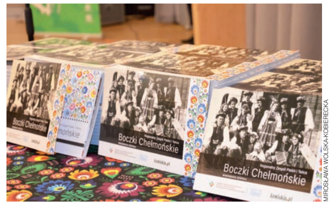
Monografia zespołu Boczek Chelmońskie ma objętość 112 stron. Wydana została na papierze kredowym.