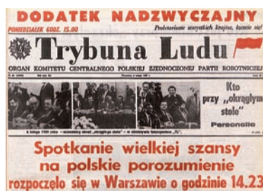
„Trybuna Ludu” z 6 lutego 1989 roku z relacją z pierwszego dnia obrad Okrągłego Stołu.

3. Polacy – jak każdy naród świata – mają prawo do samodzielnego kształtowania ładu gospodarczego, który nadaje sens pracy, zapewnia skuteczność inicjatyw ludzkich, pozwala uczestniczyć w pożytkach rozwoju cywi-