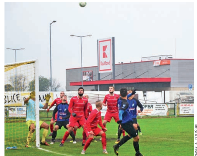
Stale fragmenty gry były największym ofensywnym atutem biało-zielonych w niedzielę, ale to nie wystarczyło, aby zdobyć chociażby punkt.