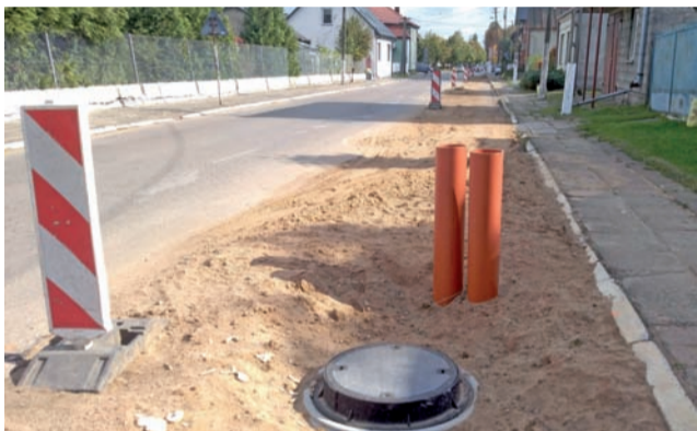
Ulica Żychlińska – budowa kanalizacji została prawie zakończona.

Niejąko przy okazji poprawiana była nitka wodociągu, a oddanie wodociągu do użytkowania wiąże się z koniecznością m.in. przeprowadzenia szeregu badań jakości i przydatności wody do spożycia.