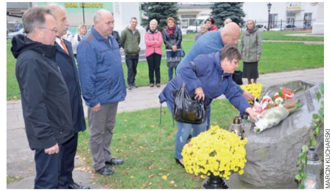
Przedstawiciele sześciu komisji zakładowych Solidarności oraz burmistrz złożyli kwiaty przy pomniku przy kościele pijarskim.

Po zakończeniu części oficjalnej uczestnicy Forum wzięli udział w biegu terenowym na orientację oraz mieli możliwość zwiedzenia szkoły i gospodarstwa. W trakcie trwania całej uroczystości można też było spróbować zdrowego żytniego chleba ze smacznymi dodatkami w ramach obchodów „Tygodnia Żytnego Chleba”. opr. mkw