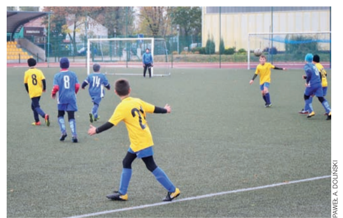
Zawodnicy Akademii bez problemów kontrolowali przebieg gry.