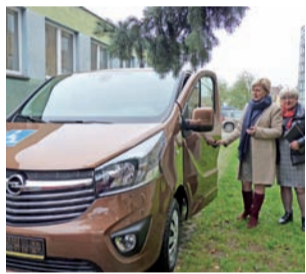
Młodzieżowy Ośrodek Socjoterapii w Żychlinie odebrał nowego Opla Vivaro za 127.500 zł.

Dyrektor ośrodka osobiście przejechała się nowym autem. Teraz samochód trzeba zarejestrować i ubezpieczyć, by można było nim jeździć. Dotychczasowy Volkswagen Transporter ma