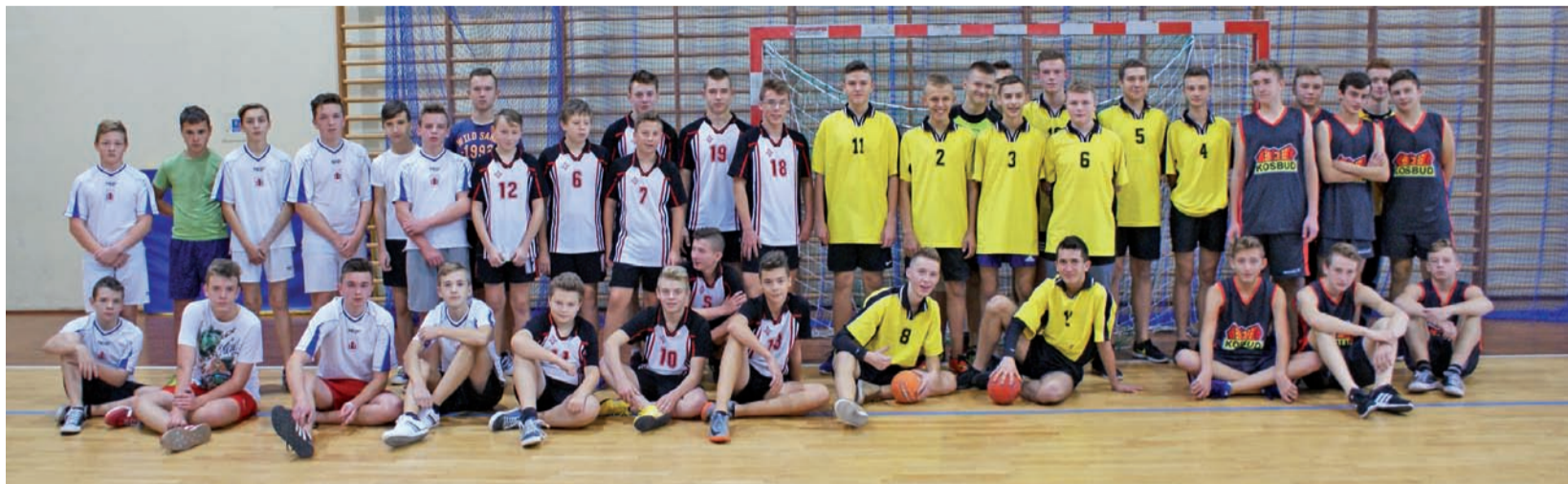
Reprezentacje szkół biorących udział w rozgrywkach półfinałowych w piłce ręcznej chłopców.

Sport szkolny | Półfinał Mistrzostw Powiatu w Piłce Ręcznej Dziewcząt i Chłopców