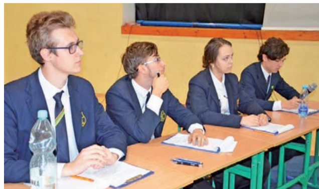
Obroncy tezy, chociaż po werdykcie musieli uznać wyższość rywali, również zaprezentowali się bardzo dobrze.