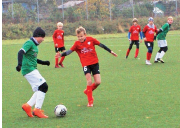
Młodzicy KS Żychlin (rocznik 2006) przegrali w sobotnim meczu 0:1 z liderem Sokół Aleksandrów.

W niedzielę, 28 października 2018, w spotkaniu 9. kolejki łódzkiej klasy E1 Orlik Grupa V dru-