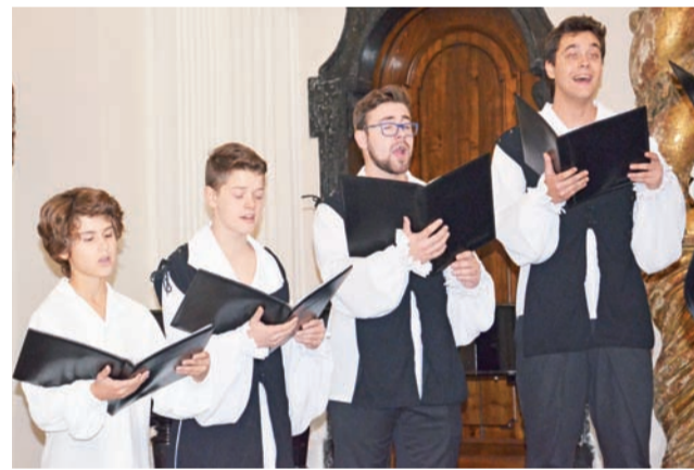
Chór Młodzieżowy Gregorianum z Warszawy w czasie przesłuchania festiwalowego w muzeum.

nie imprezy. Zacytowała też, co powiedziała jedna z chórzystek, pytana o to, dlaczego przychodzi na próby. – Cudownie dziewczyna odpowiedziała, że to spotkanie z muzyką, ze starym śpiewem, a przede wszystkim z drugim człowiekiem, z którym razem coś budujemy, razem tworzymy. Od siebie dodała: – Kłaniam się młodym ludziom bardzo nisko. Jesteście wspaniali!