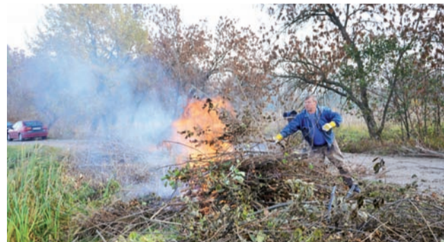
Wykarczowane krzaki w bezpiecznym miejscu, blisko zalewu, wędkarze od razu spalili.

W ostatnią sobotę za cel postawiono sobie karczowanie zakrzaceń. Ono też ma znaczenie – bo nie chodzi tylko o to, że krzaki zewążają drogę dojazdową do zalewu i utrudniają dostęp do lustra wody. Porośnięte brzegi sprzyjają też kłusownikom, którzy mogą w nich pozostawić swoje zasadzki i będą one wtedy niewidoczne dla wędkarzy – którzy walczą z takimi praktykami. mwk