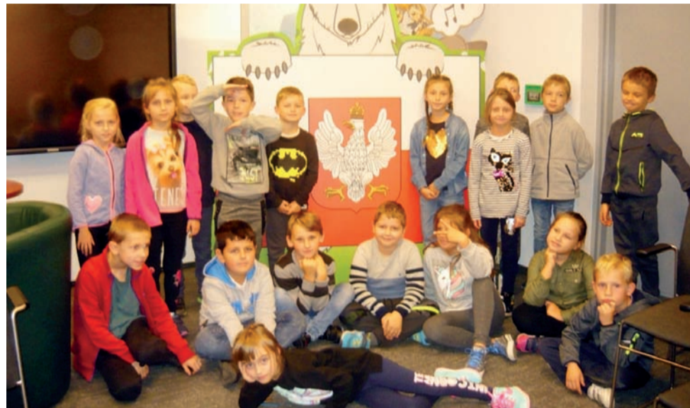
Uczniowie z klas I-III byli na wycieczce w Warszawie i brali udział w zajęciach w Centrum Edukacyjnym im. Janusza Kurtyki „Baśka Murmańska żołnierka komendanta Piłsudskiego”.

15 października uczniowie klasy VIII i gimnazjum przygotowali prezentacje multimedialne dotyczące przebiegu działań wo-