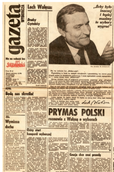
Pierwszy numer „Gazety Wyborczej” z 8 maja 1989 roku.

lizacyjnego, gwarantuje godziwe warunki życia, podtrzymuje prawdziwe relacje między człowiekiem a środowiskiem naturalnym. [...]