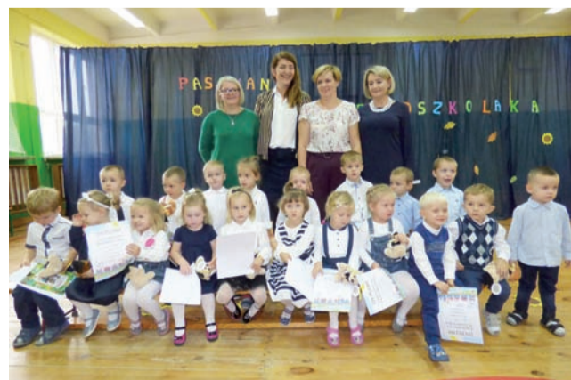
Po zakończeniu uroczystości pasowania, przedszkolaki pozowały do pamiątkowych zdjęć.

Akademia była okazją do wręczenia nagród w przedszkolnym konkursie plastycznym pt. „Jak dbam o swoje bezpieczeństwo”. Wszystkie dzieci biorące w nim udział otrzymały nagrody książkowe. oprac. aa