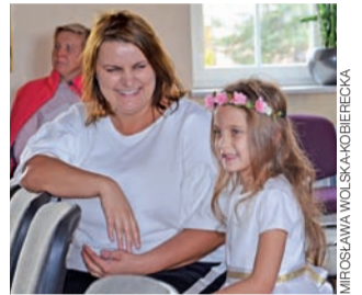
Po występie małe artystki biegną do mamy.

Zduny | II Gminny Przegląd Piosenki Dziecięcej