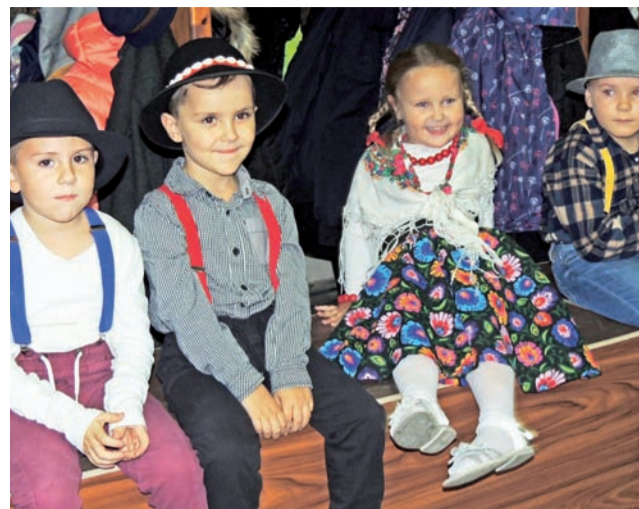
Najmłodsi pasjonaci muzyki ludowej czekający na swój występ.

W uzasadnieniu odrzucenia skargi przez radę czytamy, że po wyjaśnieniach dyrektora ŻDK, komisja chciała poprosić skarżącego, ale ten w międzyczasie opuścił urząd. Po zapoznaniu się z argumentami i wyjaśnieniami dyrektora domu kultury, radni jednogłośnie odrzucili skargę uznając ją za bezzasadną. dag