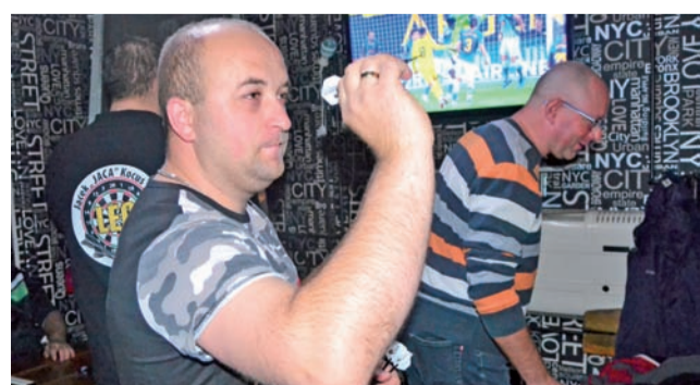
Jedenastu zawodników rywalizowało ze sobą w piątkowy wieczór.