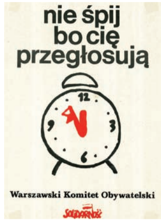
Plakaty wzywające do głosowania na kandydatów „Solidarności” w wyborach parlamentarnych w czerwcu 1989 roku.