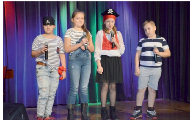
Wilki Morskie, bez podkładu muzycznego, zaśpiewali „Pacyfik”.