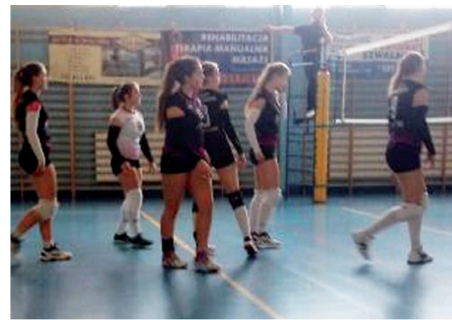
Siatkarki Volley Team Żychlin przegrały spotkanie z UKS Ozorków w ramach wojewódzkiej ligi juniorek.