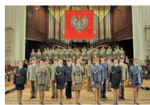
Reprezentacyjny Zespół Artystyczny Wojska Polskiego.

Następnie pokazany zostanie 17-minutowy reportaż pt. „10x10”, który stanowi podsumo-