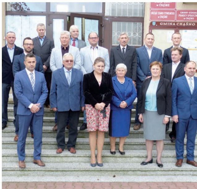
Przed ostatnią sesją kadencji 2014-2018 radni zrobili sobie pamiątkowe zdjęcie.