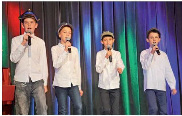
Zespół Polscy Wojacy wykonał piosenkę „Jak szło wojsko raz ulicą”.