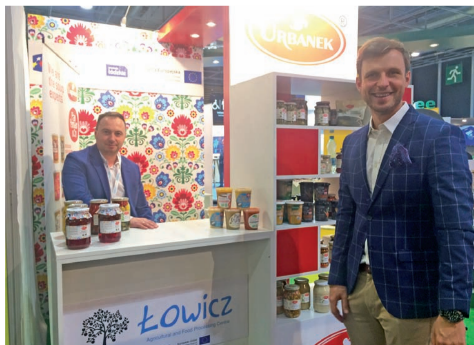
Wyjazd łowickich firm do Paryża to jedno z przedsięwzięć realizowanych w ramach projektu „Łowicz – centrum przetwórstwa rolno-spożywczego”.

Targi odbywają się co dwa lata i są jednymi z największych i najbardziej prestiżowych targów rolno-spożywczych na świecie. Udział w nich to okazja do poka-