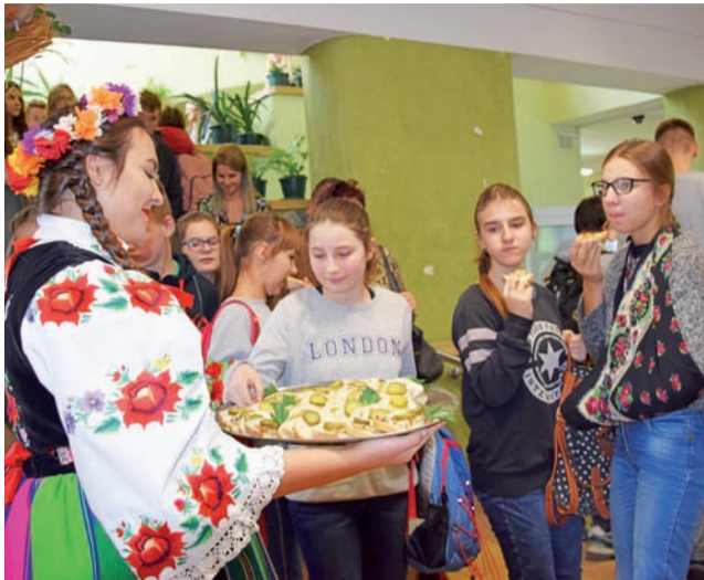
Uczestnicy Ekoforum w Zduńskiej Dąbrowie byli częstowani zdrowym jadłem, przygotowanym w ramach obchodów „Tygodnia Żytnego Chleba”.

Zaproszeni goście mówili m.in. o biologii rodziny pszczolej, codziennej pracy pszczelarza, sposobie pozyskiwania miodu oraz o znaczeniu i możliwościach