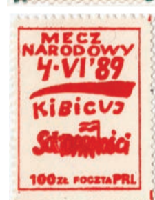
Znaczkę niezależnych wydawnictw nawiązujące do wyborów parlamentarnych w czerwcu 1989 roku.

Lech Wałęsa w przemówieniu, zamykającym obrady Okrągłego Stołu: Dziewięć tygodni rozmów o najważniejszych sprawach naszej ojczyzny pozwoliło nam dojść do przekonania, że w sytuacji, w której się znajdujemy, nie ma już