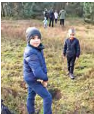
W akcji sadzenia krzewów brały też udział dzieci.

Sadzenie krzewów nie było jedyną atrakcją tego spotkania. Jego uczestnicy – których działacze nazywali „Drzewolubami” – zostali zaproszeni na spacer po lesie (nagrodą okazały się znalezione w lesie maślaki, a na polanie – czubajki kanie). Osobom, które nie brały udziału w poprzednich akcjach pokazano, gdzie zosta-