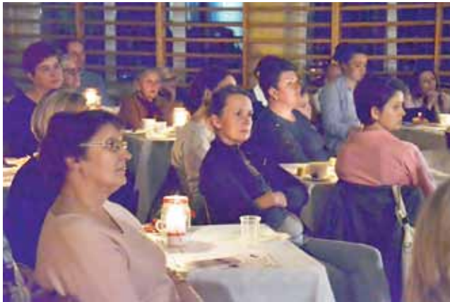
W kawiarnianej atmosferze, przy zgaszonym świetle, mieszkańcy Kocierzewa Płd. uczestniczyli w wieczorku patriotycznym.

Przed widownią wystąpiło około 45 uczniów z kilku klas. W programie ich występu znalazły się nie tylko pieśni patriotyczne i wiersze uznanych poetów, ale także ich osobiste przemyślenia na temat bycia Polakiem i miłości do Ojczyzny. Mówili między innymi o tym, że są dumni z bycia Polakami i mimo że są bogatsze kraje, to nie chcą nigdzie wyjeżdżać. – Nie chciałabym mieszkać w innym kraju, nie umiałabym się tam odnaleźć, nie znalazłabym swojego miejsca. We własnym kraju jest jakoś inaczej, on jest jak duży dom, a jego mieszkańcy to jedna