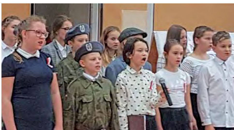
Uczniowie ze Szkoły Podstawowej nr 1 z klasy VIb przygotowali montaż słowno-muzyczny z okazji 100-lecia odzyskania niepodległości.

9 listopada uczniowie SP1 w Żychlinie o godz. 11.11 przyłączyli się do bicia ogólnopolskiego rekordu w śpiewaniu 4-zwrotkowego hymnu narodowego.