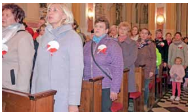
Uczestnicy mszy punktualnie o godz. 12 odśpiewali hymn narodowy.