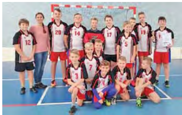
Reprezentacja chłopców z SP Grabów zdobyła tytuł Mistrzów Powiatu w Unihokeju.