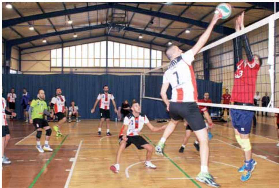
Jedno ze spotkań siatkarskich VT Żychlin. Nasza drużyna zajęła ostatecznie drugie miejsce w turnieju.

W turnieju udział wzięły cztery drużyny: Volley Team Żychlin, Iskra Szczawin Kościelny, Stal Głowno i Piotrków Trybunalski. Grano systemem „każdy z każdym”, do dwóch wygranych setów. Zwycięzcami turnieju został zespół Stal Głowno. Drużyna z Żychlina zajęła drugie miejsce.