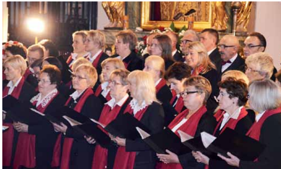
Pieśń „Boże coś Polskę” w wykonaniu chórów była najlepszym wprowadzeniem do ogólnej myśli spektaklu.