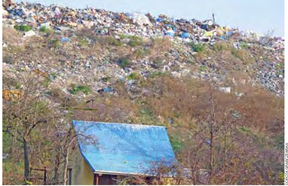
Nie przykryte odpady na składowisku są wylęgarnią prusaków, które przechodzą na pobliskie ogrody działkowe.

Żychlin | Składowisko odpadów coraz bardziej uciążliwe