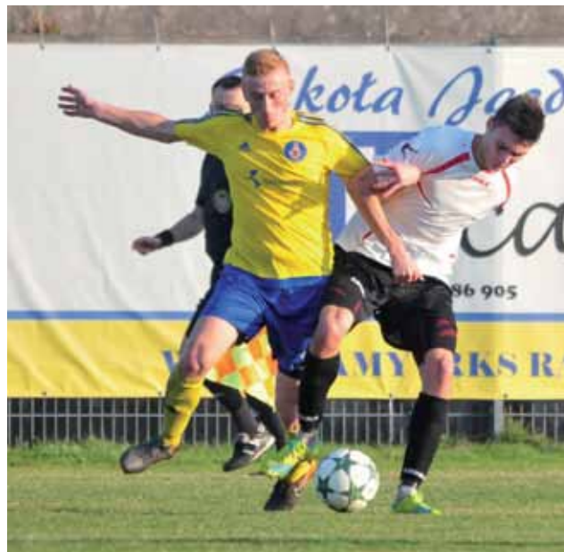
W spotkaniu 16. kolejki łódzkiej IV ligi zespół KS Kutno został pokonany przez RKS Radomsko 4:0.

■ Andrespolia Wiśniowa Góra – Omega Kleszczów 1:2