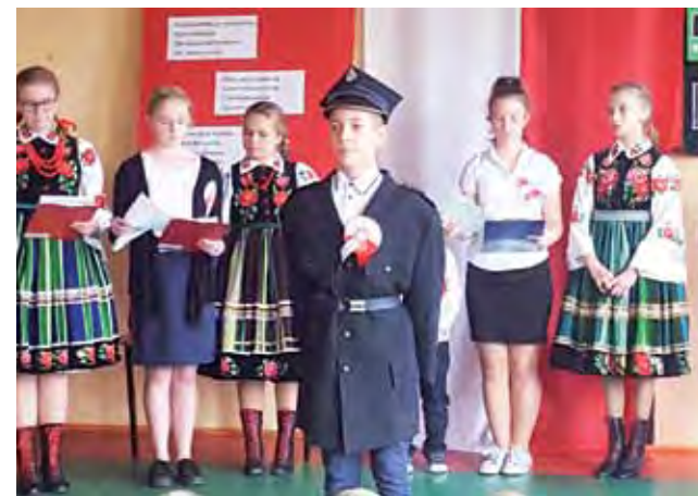
Uczniowie Szkoły Podstawowej w Gągolinie Płd. zaśpiewali pieśni patriotyczne w gwarze łowickiej.