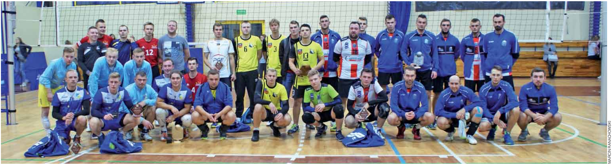
Uczestnicy Turnieju „Siatkarski Dzień z Volley Team Żychlin” z okazji 100-lecia Odzyskania Niepodległości.

Piłka siatkowa | Turniej z okazji 100. rocznicy odzyskania przez Polskę niepodległości