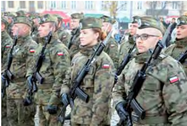
Kompania reprezentacyjna 38. Sochaczewskiego Dywizjonu Zabezpieczenia Obrony Powietrznej na Nowym Rynku w Łowiczu.

Jak zawsze przy takich okazjach dużym powodzeniem cie-