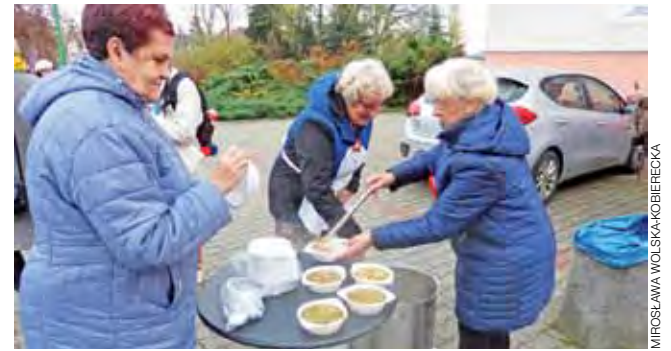
Zupa rozdawana była 12 listopada przed wejściem do Zacisza przy ul. Kaliskiej. Następnego dnia częstowano nią na działkach przy Bolimowskiej.

Po wysłuchaniu akademii gości zostali zaproszeni na poczęstunek ciastami, które z okazji 100. rocznicy odzyskania niepodległości przez Polskę również przybrały barwy biało-czerwone. aa