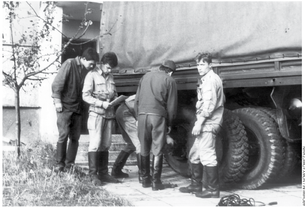
11 października 1991 roku. Chwila przed wyjazdem z Łowicza ostatniej grupy żołnierzy radzieckich, stacjonujących tu od końca II wojny światowej. Załadunek ostatnich ciężarówek przed blokiem przy ul. Kwiatowej, gdzie mieszkała część starszyny. Ostatni cywile z rodzinami opuścili nasze miasto we wtorek, 15 października 1991 roku.

Podczas wieczornego koncertu podsumowano również realizowany w ośrodku od lipca projekt „Świętujmy z Niepodległą!”. W ciągu kilku minionych miesięcy zorganizowano w jego ramach m.in. spotkania integracyjne, historyczne prelekcje, warsztaty artystyczne oraz patriotyczne rajdy.