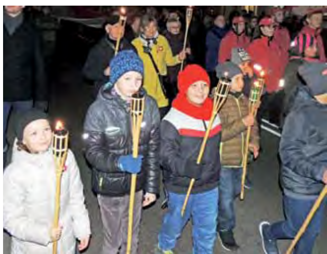
Najmłodsi dumnie otwierający biało-czerwony marsz.

Tłumy mieszkańców Żychlina stawiły się o godzinie 17.00 przed Żychlińskim Domem Kultury, by świętować 100-lecie odzyskania przez Polskę niepodległości. O godz. 17 rozpoczął się uroczysty przemarsz ze 100-metrową biało-czerwoną flagą.