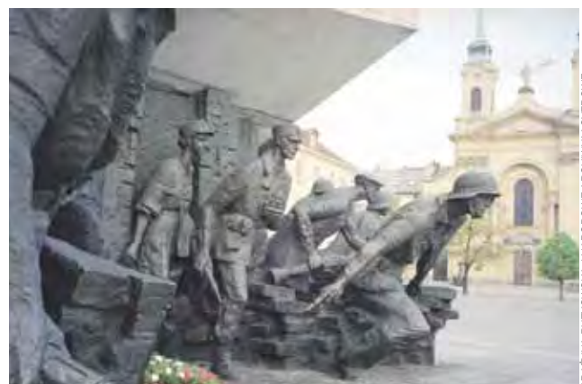
Warszawa, 1996-1997. Pomnik Powstania Warszawskiego na placu Krasińskich.

Słyszę, że dla inicjatorów z prezydenckiego dworu to zaproszenie miało być dowodem naszej „europejskości”, naszego wyrastania z prowincjonalizmu. A było brakiem szacunku dla gruzów miasta, dla poległych mieszkańców Warszawy i warszawskich powstańców.