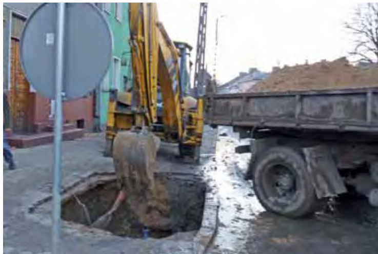
Awaria zasawy wodociągowej na kilka godzin pozbawiła mieszkańców wody.

Do usunięcia awarii konieczne było wypożyczenie małej koparki z doświadczonym operatorem, bowiem dziurę wykopano w pobliżu nowo ułożonych krawężników w jezdni i słupa energetycznego. Rozebrano kilka metrów kwadratowych kostki polbrukowej. W trakcie prac okazało się, że pod chodnikiem przechodzą jakieś kable, które nie były naniesione na mapy. Na szczęście nie zostały uszkodzone i nie wystąpiły kolejne utrudnienia.