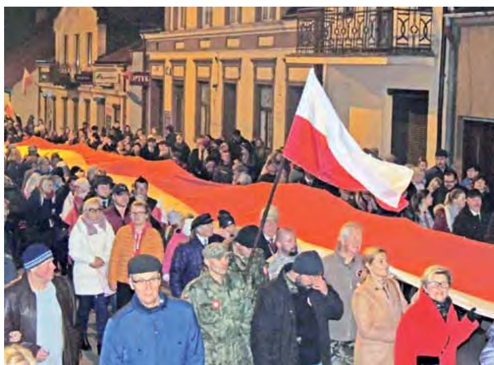
Tłumy mieszkańców Żychlina wspólnie świętowały 100-lecie Odzyskania Niepodległości.