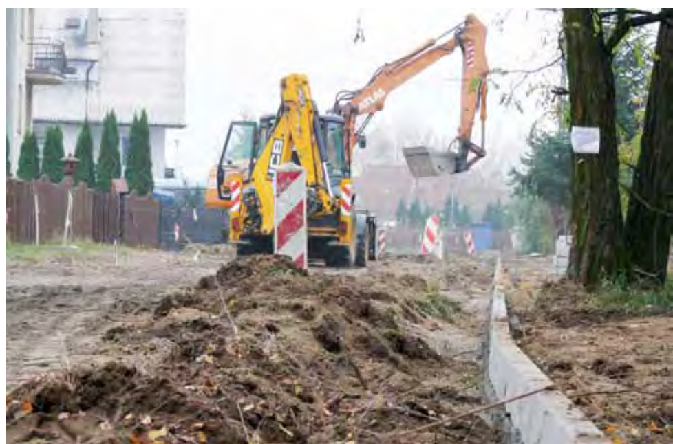
Budowa nawierzchni ul. Moniuszki na os. Górki rozpoczęła się od ułożenia krawężnika.

TELEFON: +48 608-094-050 E-MAIL: BIURO@SYNTEX.PL Syntex Sp. z o.o.