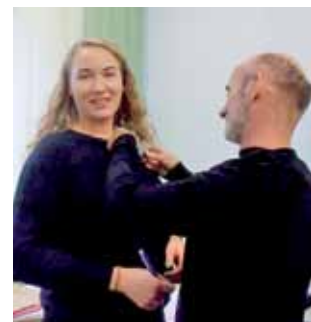
Dyrektor nieborowskiej biblioteki dekoruje okolicznościowym znaczkiem jedną z pracownic Urzędu Gminy.