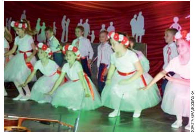
Dziewczynki z młodszych klas w tiulowych sukienkach w polskim twiście, w reflektorach kolorowych światła, prezentowały się znakomicie.

ludzie cieszyli się dawniej tym, że są ze sobą, że rozmawiają, podczas gdy teraz najczęściej zamknięci są w 4 ścianach, a czas spędzają przed telewizorem.