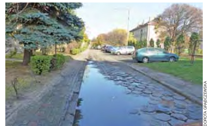
Trylinka na drodze wewnętrznej wzdłuż bloków Narutowicza 85a, b, c jest wypaczona, a po deszczu robią się tam kałuże wody.