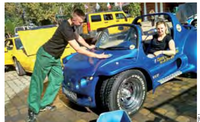
Podczas praktyk był czas zarówno na pracę, jak i zabawę – np. podczas pozowania do zdjęć w samochodach, które naprawiali.

Dzieci z przedszkola w Kiernozi 8 listopada włączyły się w obchody 100-lecia odzyskania przez Polskę niepodległości biorąc udział w spektaklu „Droga do niepodległości”, z którym przyjechał Teatr Psikus z Łodzi. Krótki spektakl oraz pogadanka były dostosowane do wieku dzieci i polegały np. na przybliżeniu polskich symboli narodowych oraz ważnych wydarzeń historycznych. Była to też okazja do wspólnego odśpiewania hymnu i innych pieśni patriotycznych. Dzieci recytowały też wiersz Władysława Bełzy „Katechizm polskiego dziecka”. opr. mak