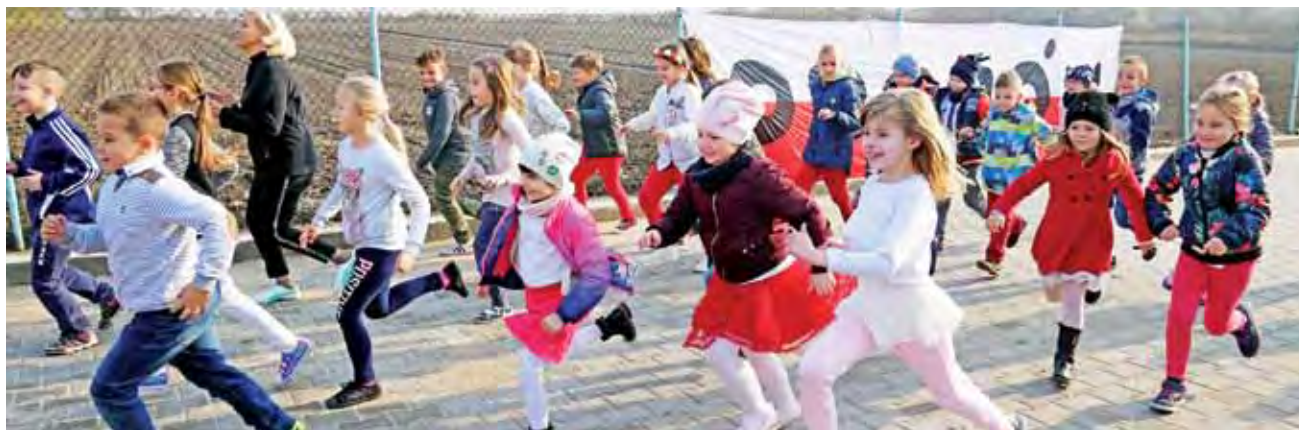
Uczestnicy biegu Niepodległości, uczniowie SP Oporów i SP Szczyt, ruszyli właśnie w trasę.

Gmina Bedno | Szkoła Podstawowa w Szewcach Nadolnych