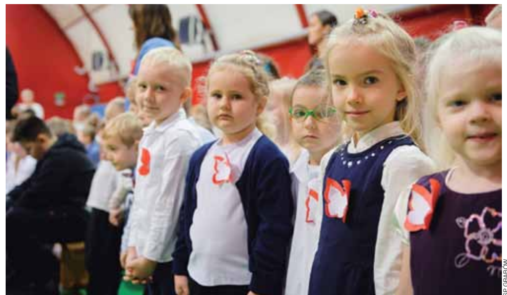
Najmłodszy uczniowie z SP w Grabowie – dumni, że mogą żyć w wolnym kraju.

Wszyscy uczniowie byli odświętnie ubrani, z biało-czerwonymi kotylionami. Poznawali niezwykłą historię – drogę Polaków do wolności. Były wiersze patriotyczne, piosenki legionowe i z czasów I wojny światowej. Starsza młodzież przygotowała scenkę przedstawiającą lekcję w zaborze rosyjskim. Uczniowie nie kryli radości z faktu, że żyją w wol-