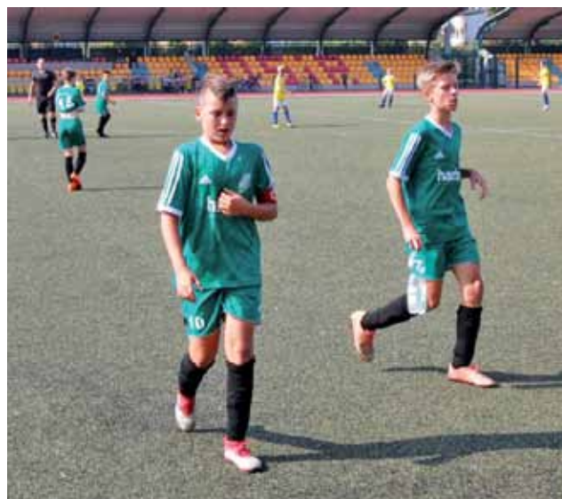
Zawodnicy Pelikana z rocznika 2006 wrócił ze Zgierza bez punktów.