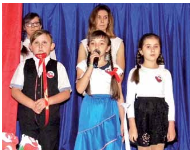
Widowisko patriotyczne zaprezentowali uczniowie klas II i III.

Uroczystości patriotyczne odbywały się w sąsiadującej ze