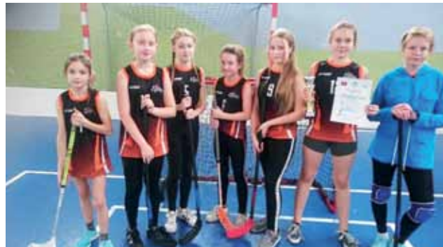
Reprezentacja dziewcząt z SP Nr 2 w Żychlinie zdobyła tytuł Mistrzyń Powiatu w Unihokeju.

Bardzo dobrze zaprezentowały się dziewczęta ze Szkoły Podstawowej Nr 2 w Żychlinie oraz chłopcy z Grabowa – obie drużyny zdobyły Mistrzostwo Powiatu, tym samym uzyskując awans do zawodów rejonowych, które odbędą się 14 listopada w Bedlinie. mr