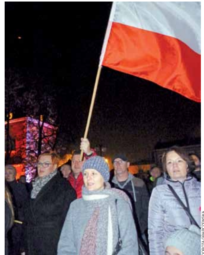
To było spontaniczne, radosne zgromadzenie.