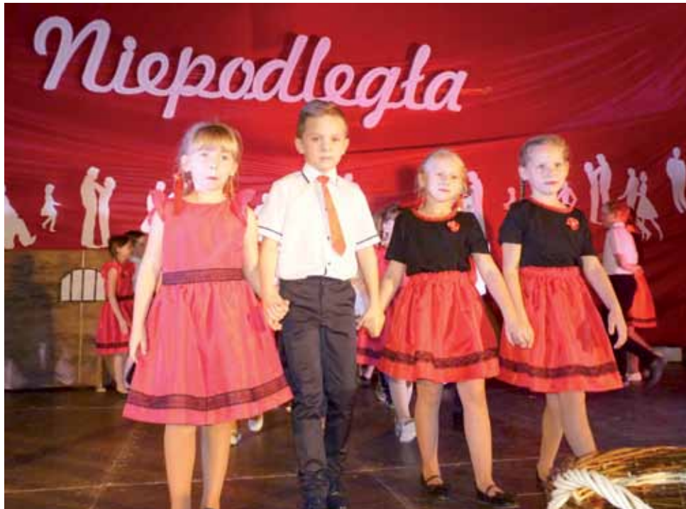
Najmłodsze dzieci ze szkoły zatańczyły poloneza.

Dawkowano emocje, przechodząc z euforii odzyskania niepodległości, poprzez refleksję, smutek i ponowną radość. Wszystko przeplatane dodatkowymi efektami. Z megafonów leciały słowa Jana Pawła II, odgłosy syren alarmowych, odgłos samolotów i bombardowania. Była modlitwa w chwili zagrożenia i strachu o życie, a podniosłe wiersze patriotyczne przeplatały się ze scenkami rodzajowymi opowiadającymi o obowiązkowych dostawach żywności przez rolników, o odbudowie Polski po wojnie, o telewizyjnym przemówieniu Wojciecha Jaruzelskiego