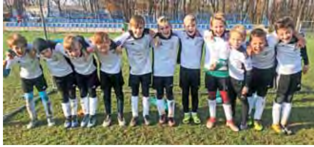
Pelikan 2008 zadowolony po wygranej w Zduńskiej Woli.

Ambitna postawa dała Pelikanowi 2008 z kolei wygraną w Zduńskiej Woli. – Graliśmy na naturalnej trawie, dlatego w piątek odbyliśmy trening również na takiej nawierzchni. W pierwszej kwarcie mieliśmy problemy z grą na takiej murawie, z biegiem czasu graliśmy coraz lepiej. Mieliśmy sporo niewykorzystanych sytuacji i przegrywaliśmy już 3:0. Nie straciliśmy jednak wiary i w ostatnich dziesięciu minutach zagraliśmy bardzo dobrze zarówno pod względem ambicji, jak i samej gry w piłkę. Przede wszystkim dążyliśmy do zdobycia gola za wszelką cenę, oddawaliśmy mnóstwo strzałów i to przyniosło efekt. Bardzo ucieszyłem się z wygranej, pierwszej w lidze. Nie dlatego, że mamy dopisane trzy punkty, ale dlatego, że chłopcy na to zasłużyli. Dziewięć razy przyjmowali porażki na siebie z różnych skut-