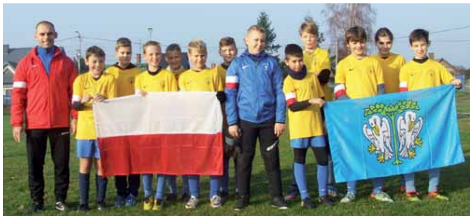
Na rękę każdego zawodnika była opaska z symbolem narodowym.

Pierwsza połowa była jeszcze bezbolesna dla Pelikana, jeżeli chodzi o stratę bramki. Biało-zieloni nie najgorzej radzili sobie na boisku, odpierali ataki, ale mało stworzyli akcji, które mogłyby zagrozić bramce Widoku. Niestety