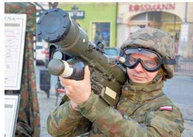
Jeden z żołnierzy jednostki z Sochaczewa prezentuje broń przeciwpancerną.

Dwukrotnie – tuż po zapadnięciu zmroku i o 17.30 prezen-