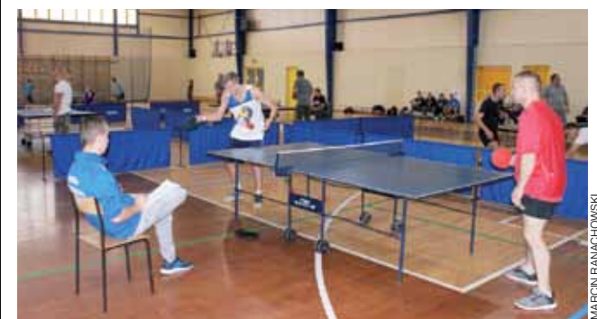
Rozgrywki meczowe podczas turnieju tenisa stołowego z okazji 100 rocznicy Odzyskania Niepodległości.