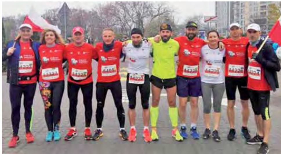
Rozbiegani Żychlin, którzy pobiegli w 30. Biegu Niepodległości w Warszawie, aby uczcić setną rocznicę odzyskania niepodległości.

Podczas biegu uczestnicy w białych i czerwonych koszulkach z napisem „Warszawa – stolica wolności 1918-2018” utworzyli „żywą” flagę Polski, która podniosła jeszcze poziom wspaniałego nastroju. Tradycyjnie już trasa wiodła Al. Jana Pawła II, ul. Chałubińskiego i Al. Niepodległości. Start i metę zlokalizowano przy ul. Stawki, nieopodal Ronda Zgrupowania AK Radosław, gdzie na kilkudziesięciometrowym maszcie powiewa największa w Warszawie flaga narodowa.