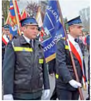
Strażacy prowadzą pochód z kościoła pod pomnik w parku gminnym.