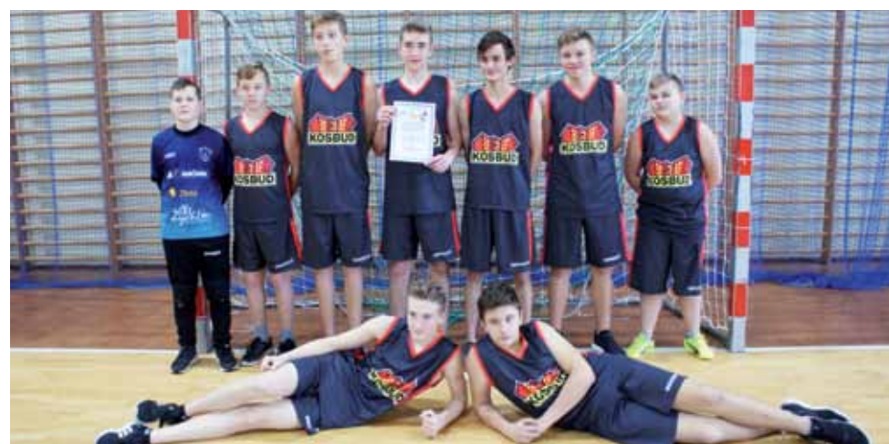
Reprezentacja Szkoły Podstawowej Nr 2 w Żychlinie zajęła III miejsce w rozgrywkach.

■ Szkoła Podstawowa Nr 2 w Żychlinie – Gimnazjum Żychlin 9:8 Mecz o I miejsce: