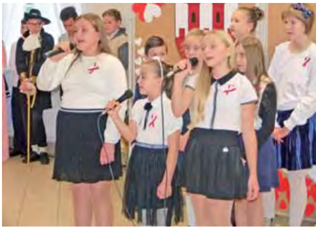
Z pieśnią ku niepodległości. Uczennice SP w Sobocie niejednokrotnie miały 11 Listopada okazję zaprezentować swoje talenty wokalne. Mocnych głosów można im pozazdrościć.

Później nastąpiło jeszcze ogłoszenie wyników dwóch gminnych konkursów (plastycznego i historycznego), ogłoszonych z okazji stulecia niepodległości Polski, po czym zebranych zaproszono na poczęstunek. Prace nagrodzone w konkursie plastycznym można było na miejscu oglądać, organizatorzy uroczystości prosili też jej uczestników do wpisywania się do księgi pamiątkowej, by ślad tego wydarzenia na zawsze zapisał się w annałach szkoły. ewr