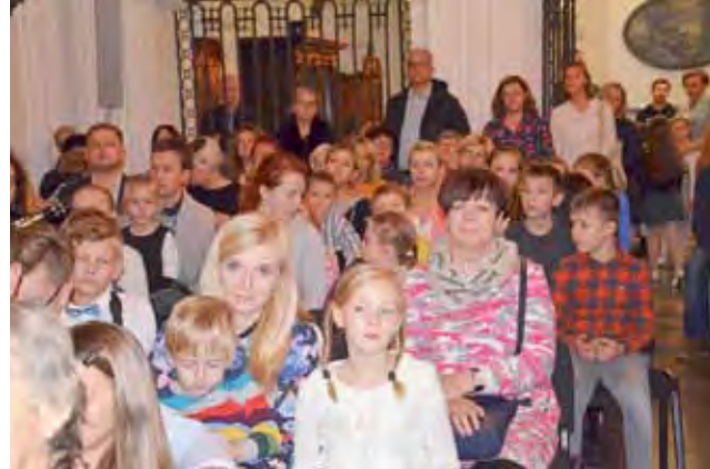
Koncertu wysłuchała licznie zgromadzona widownia, na której zasiadli przede wszystkim rodzice i bliscy młodych muzyków.

polskich kompozytorów bywa czasem tak piękna, jak i trudna, ale wiele kompozycji powstało z myślą o tym, by mogły je grać