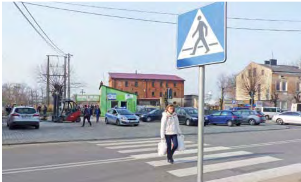
Po raz pierwszy w miniony czwartek mieszkańcy Żychlina mogli bezpiecznie przejść po pasach na targowisko.

– Coś wspaniałego! – mówi mieszkanka Żychlina. – Nareszcie można bezpiecznie przejść przez ulicę na targowisko, a do tego obok policji. Wcześniej każdy przechodził, ale zanim pokonał ulicę dokładnie patrzył, czy na horyzoncie nie ma radiowozu. A dziś choć policyjny radiowóz stał, szliśmy przez ulicę bez lęku, że zaraz dostaniemy mandat. Aż dziwne, że przez kilkanaście lat nie potrafiono załatwić tak prostej sprawy. Teraz proszę poprosić panów z wojewódzkiej komisji bezpieczeństwa i pokazać im, że podjęte działania poprawiły bezpieczeństwo.