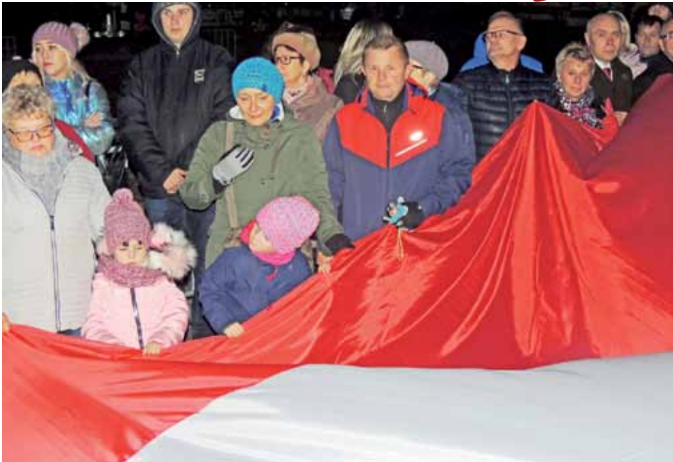
Flagę chcieli nieść i starsi, i najmłodszy.