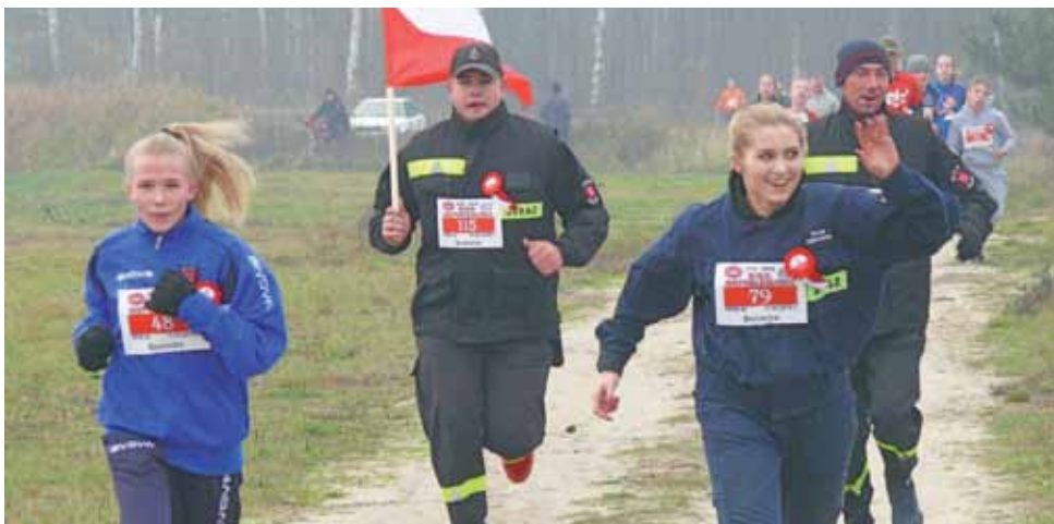
W biegu udział wzięli licznie m.in. strażacy z OSP Bolimów.

Część osób, zwłaszcza młodych, wprost z tej uroczystości udała się na organizowany przez Gminny Ośrodek Kultury w Bolimowie Bieg Niepodległości, na terenie żwirowni w sąsiedztwie A2. Tu atmosfera była znacznie luźniejsza i weselsza. Na dystansie 1918 m, nawiązującym do roku odzyskania niepodległości, pobięło przeszło 120 osób, w większości z Bolimowa i gminy, ale także Skierniewic i Łowicza. Wśród tych osób były małe i duże dzieci, młodzież i dorośli, uczniowie podstawówek, szkół średnich jak i strażacy ochotnicy, pracownicy urzędu gminy, lekarze, nauczyciele. Wszyscy tuż przed startem, o godzinie 12.00, odśpiewali hymn.