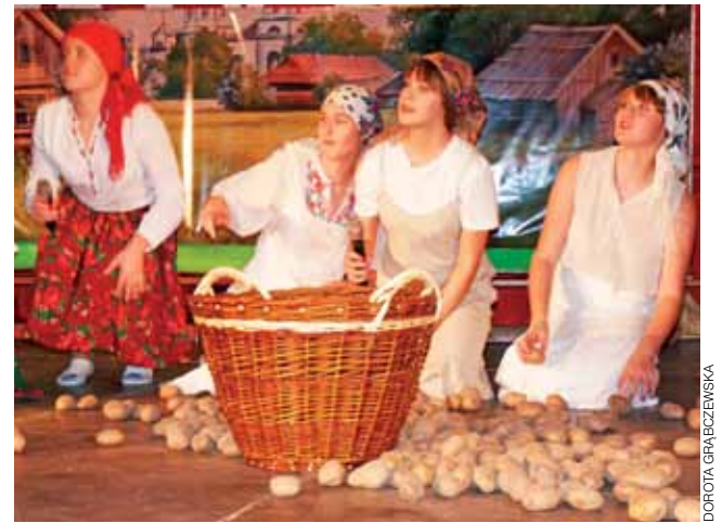
W części obrzędowej w tym roku uczniowie zaprezentowali zwyczaj zbierania ziemniaków.

Druga część widowiska to scenka rodzajowa przypominająca ludowy obrządek zbierania ziemniaków. Podczas tych prac mieszkańcy wsi spotykali się i opowiadali różne historie. Morał płynął z tej historii jeden: że