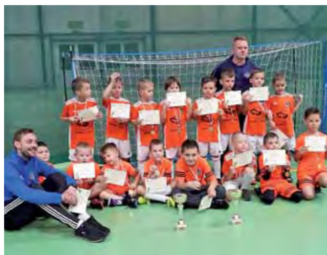
Gracze Soccer Kids grali na Widok Cup rocznika 2011.

Zespół prowadzony przez trenera Dziedzicę składał się z za-