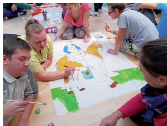
Postaci bohaterów, symbole narodowe i wydarzenia z naszej historii były tematami plakatów, które przez najbliższe dni będą zdobyły korytarze w Specjalnym Ośrodku Szkolno-Wychowawczym w Łowiczu. Prace plastyczne wykonywała cała szkolna społeczność tego ośrodka, a także goście z zaprzyjaźnionego ośrodka w Mocarzewie. tm