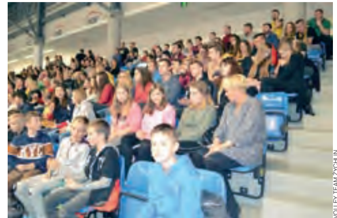
Kibice z Żychlina na trybunach podczas meczu w Belchatowie.