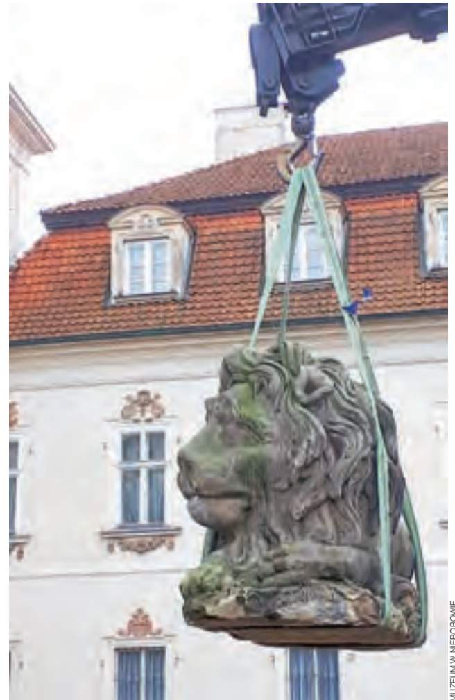
Jeden z nieborowskich lwów w czasie demontażu, w tle pałac Radziwiłłów.