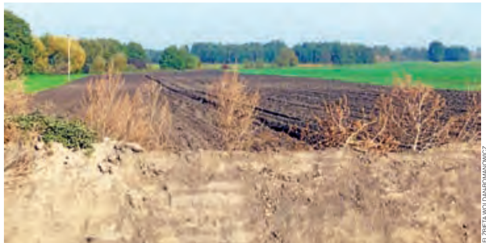
Pola za skarpią rowu. Te działki rolnika z Chrusłina oddziela od przebudowywanej DW 703 głęboki rów, przez który nie wybudowano zjazdu.

Trzeba tu zaznaczyć, że działki położone na północy DW 703 oddziela od równoległej do niej dro-