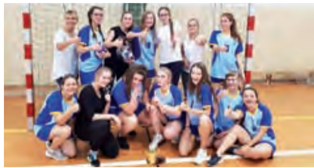
Szczypiornistki z Pijarskiej potwierdziły dominację w powiecie łowickim,

Najlepszą ekipą okazała się drużyna Pijarskiego Gimnazjum w Łowiczu która awansowała do półfinału wojewódzkiego. W meczu finałowym podopieczne Bożeny Mostowskiej pokonały 5:3 zespół SP 2 Łowicz. Na trzecim