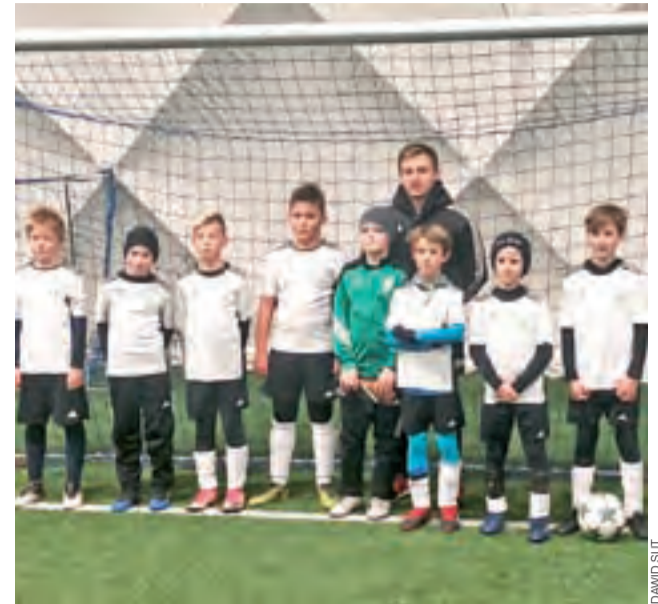
Pelikan 2008 udanie wystartowali w lidze zimowej.

W następnej kolejce zespół trenera Suta zmierzy się z Mazurem Radzymin, a mecz zaplanowano