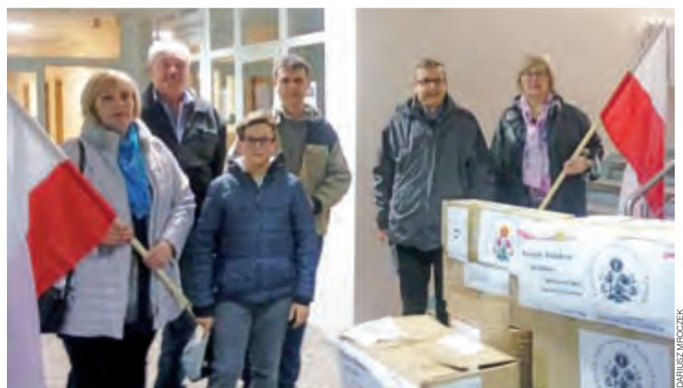
Delegacja z Łowicza, wraz z darami ze szkół pijarskich, na miejscu w Solecznikach.