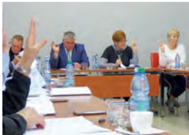
Radni starej kadencji 2014-2018 po raz ostatni spotkali się 14 listopada. Jednogłośnie ustalili podatki na 2019 roku na poziomie roku bieżącego.

Podatek od gruntów związanych z prowadzeniem działalności gospodarczej będzie wynosił – 0,88 zł od m 2 powierzchni, po-