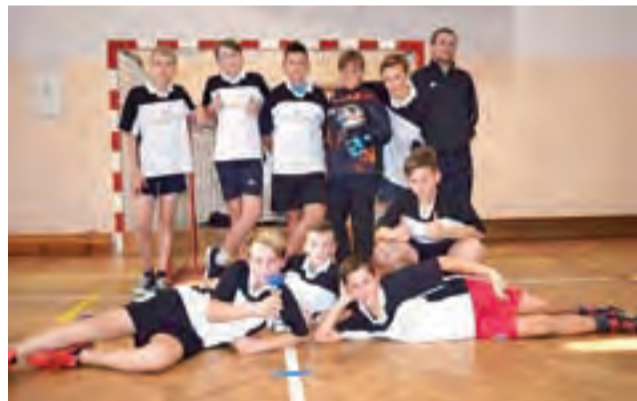
Ekipa SP Baków wygrała mistrzostwa powiatu w Bielawach.