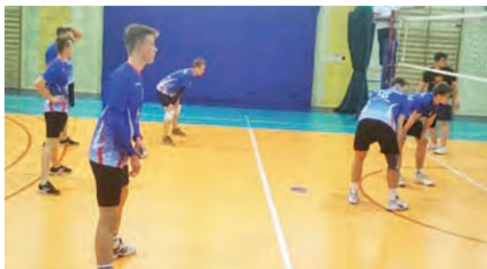
Młodzicy Akademii Siatkówki Volley Team Żychlin podczas 5 kolejki KALS II ligi mężczyzn zdobyli 4 punkty.