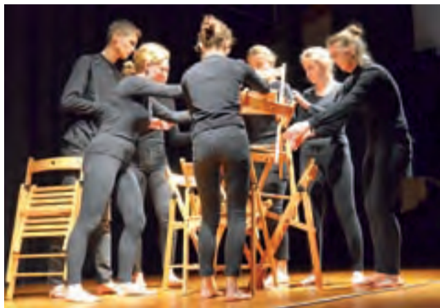
Członkowie grupy teatralnej Some z Elbląga jako jedyni przygotowali pantomimę.