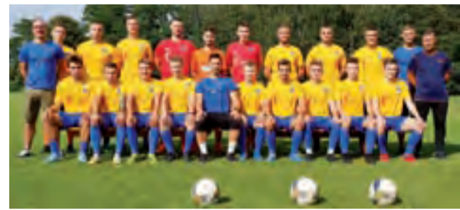
Pogoń zremisowała z wiceliderem Jutrzenką Drzewce 1:1.

■ Olimpia Chaśno – Vagat Domaniewice 5:4