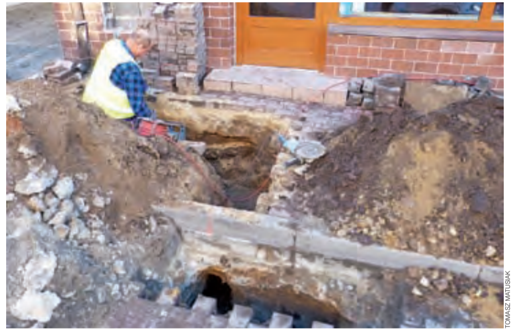
Podczas prac rozkopane zostały chodniki w części Zduńskiej pomiędzy Browarną a Kozią.

Przez cały czas awarii był dostęp do sklepów i zakładów usługowych w tej części Zduńskiej, choć utrudniony – na co narzekali niektórzy przedsiębiorcy. Mówili,