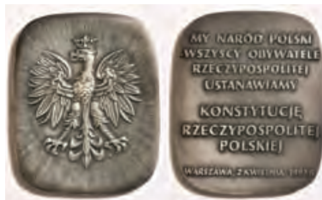
Plakietka okolicznościowa upamiętniająca podpisanie Konstytucji Rzeczypospolitej Polskiej z 1997 roku.

■ 2 kwietnia 1997 – uchwalona zostaje Konstytucja Rzeczy-