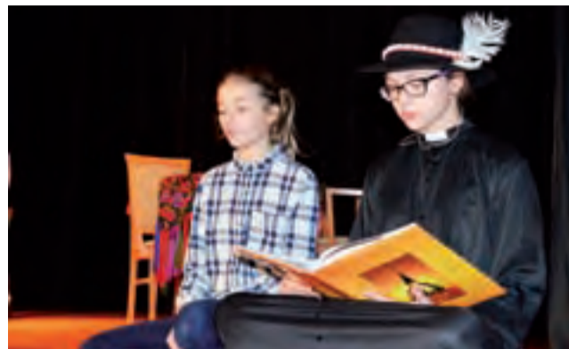
W „Tischnerowskich drogowskazach” dwie młode aktorki z Katowic czytały fragmenty nauk ks. Tischnera.

W jej przedstawieniu główny bohater – czyli stary diabeł, Krętacz – został „rozszerp-