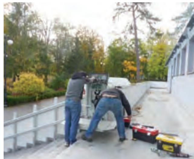
Pracownicy z firmy montującej platformę naprawiali urządzenie 26 października. Niestety, po kilku dniach musieli przyjechać ponownie.