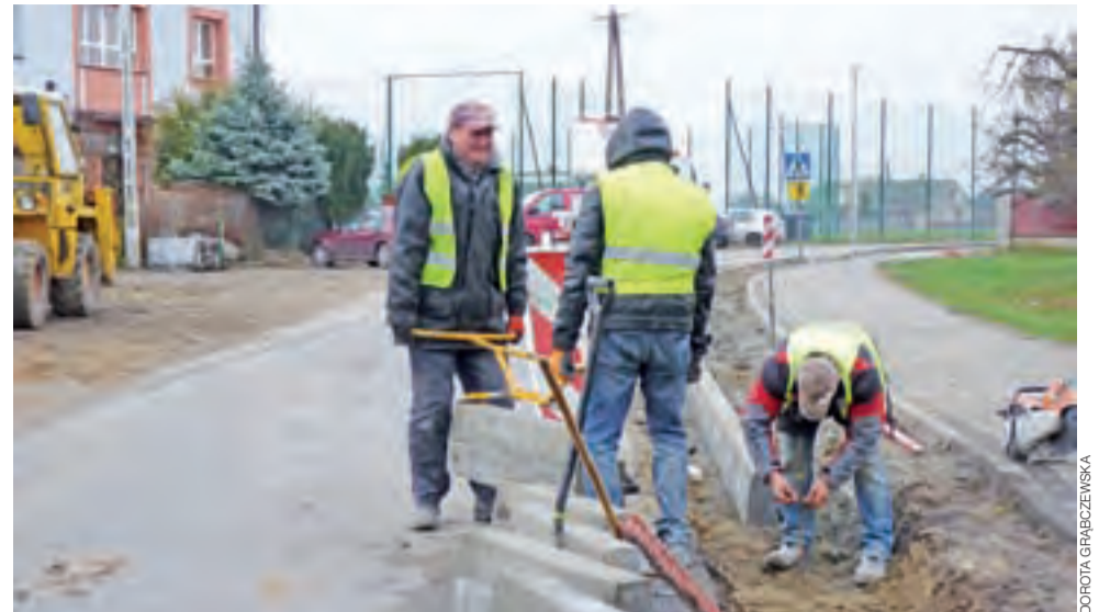
W minionym tygodniu pracownicy France-Gost układali nowe krawężniki na wysokości szkoły. Na łuku drogi, naprzeciwko wejścia do szkoły, droga zostanie poszerzona do 6 m.

Wzdłuż drogi zostaną odtworzone rowy, do których będzie odprowadzona woda opadowa. Jest nadzieja, że po zakończeniu inwestycji na drodze nie będą stać duże kałuże wody, która teraz nie miała dokąd odpłynąć. dag