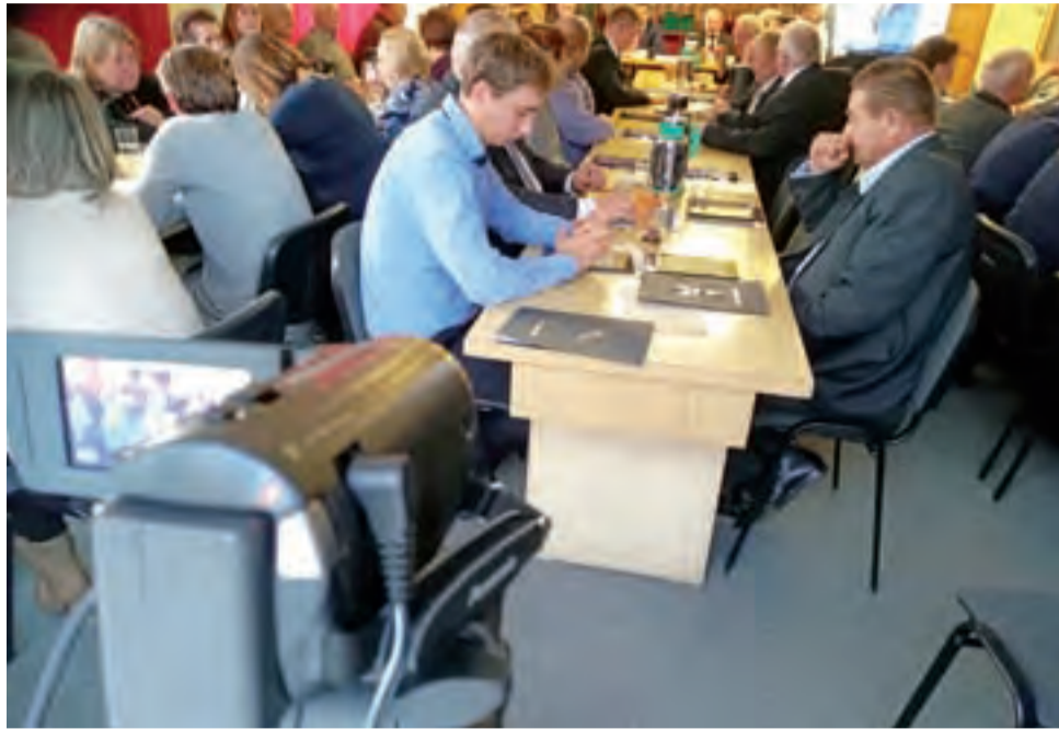
Nowa kadencja, nowe przepisy. I sesja Rady Gminy w Bolimowie w środę 21 listopada. Kamera rejestruje przebieg obrad.

Gmina poniosła stosunkowo mniejsze niż większość samorządów wydatki na przystosowanie sali urzędu do transmisji na żywo, wydając tylko około 17 tys. zł. Było to możliwe, ponieważ już wcześniej zainwestowała w sprzęt, głównie pod kątem prowadzenia