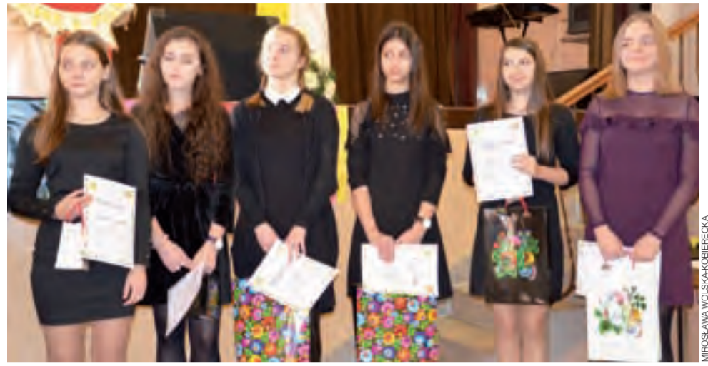
Konkurs związany z Dniem Papieskim podzielony jest na recytatorski i poezji śpiewanej. Na zdjęciu laureatki tego drugiego.

Warto przypomnieć, że Tipos Topes to cykliczny projekt, który zadebiutował w 2001 roku pod patronatem Łowickiego Ośrodka Kultury. Program zawsze jest tak dobierany, aby oscylował wokół promocji alternatywnych form kultury i sztuki współczesnej, z akcentem na muzykę i film. aa