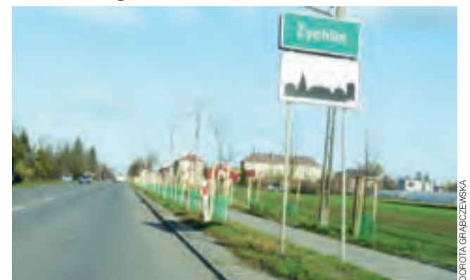
Decyzją Wojewódzkiego Zarządu Dróg w Łodzi na terenie gminy Żychlin, wzdłuż drogi wojewódzkiej 583 posadzono 200 sztuk lipek.

– Są to nasadzenia kompensacyjne, które mają zastąpić wycięte wcześniej stare i zniszczone drzewa, jak i te które ulegną wkrótce wycinie. Koszt to 22 tys zł.