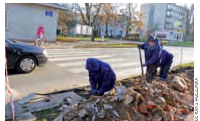
Pracownicy z Zakładu Usługowego Pomiary i Instalacje Krzysztofa Zduńcziyka, rozpoczęli prace przy budowie sygnalizacji świetlnej na skrzyżowaniu ulic Narutowicza i Marii Konopnickiej koło Emitu.

– Teraz wysyłam pisma do stron postępowania, z informacją że inwestor rezygnuje z realizacji przedsięwzięcia. Zgodnie z przepisami kpa, jeśli strony nie będą wnosić sprzeciwu, postępowanie zostanie przez urząd umorzone – wyjaśnia Anna Łąpieś. dag