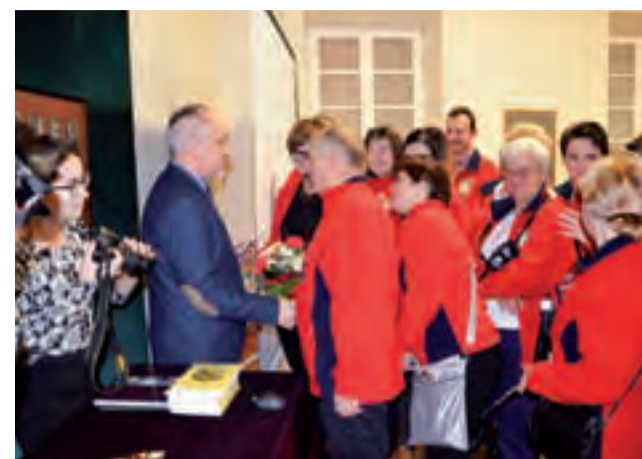
Na promocję wydawnictwa przybyła liczna grupa przewodników PTTK, ubranych w charakterystyczne czerwone polary.