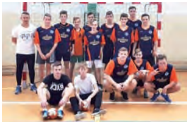
Drużyna SP 2 Łowicz pewnie wygrała powiatowe zmagania.

Tradycyjnie dobrze zaprezentowali się również szczypiornistki z SP Popów, którzy ostatecznie