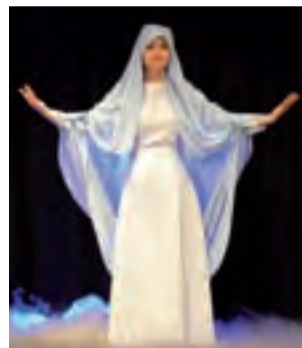
W przedstawieniu „Towarzystwo Stwórcy” piękna kobieta symbolizowała mądrość.