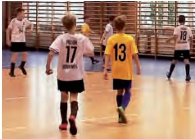
Zespół fowickiej Akademii wygrał tylko Pogonią Godzianów.

Piłka nożna | Puchar Marszałka Województwa Łódzkiego