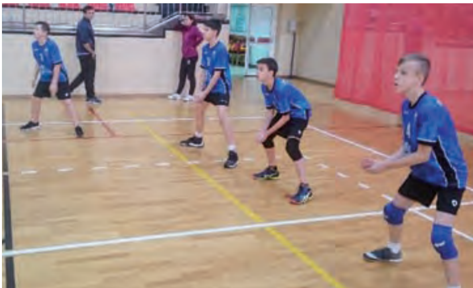
Jedno ze spotkań drużyny Volley Team Żychlin podczas Ogólnopolskiego Turnieju Mini Piłki Siatkowej z okazji 100-lecia odzyskania przez Polskę Niepodległości.

■ Volley Team Żychlin II – LKS Wrzos Międzyborów I 12:15