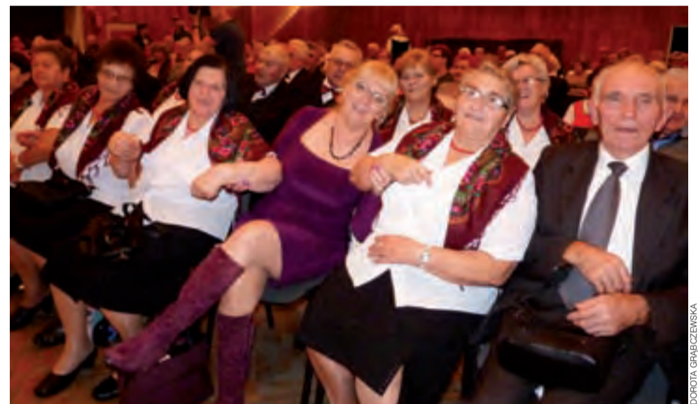
Podczas gdy jedni śpiewali na scenie, inni świetnie się bawili. Na zdjęciu seniorki z Oporowa.

Na scenie zaprezentowały się również zespoły: Żeroniczanki, Szewcowianki, Dąbrowickie Nutki, Młodzi Duchem z Krośniewic, Grzybowianki, chór Melodia ze Szczawina Kościelnego, Klonowianki, Małgorzatki, Ale Babki oraz zespół Witaszewiacy.