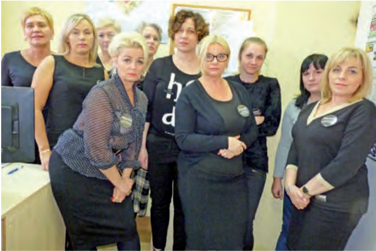
Pracownicy MGOPS w Żychlinie, w ramach ogólnopolskiego tygodnia tzw. czarnego protestu, przychodzą do pracy w czarnych ubraniach. Domagają się ustawowych zmian dotyczących pracowników pomocy społecznej.

Pracownicy pomocy społecznej podkreślają, że ich wynagrodzenia są zbyt niskie. Podają przykład, że wielokrotnie ich podopieczni po uwzględnieniu różnych form wsparcia (500+, alimentów, rodzinnego i wsparcia w postaci różnych zasiłków i dodatków) odbierają więcej, niż wynosi ich wynagrodzenie za cały miesiąc pracy. Podkreślają, że wciąż przybywa im obowiązków