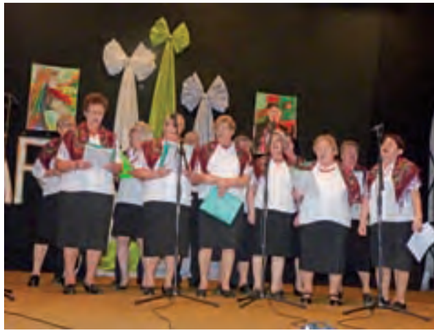
Oporowskie Nutki wystąpiły na scenie Domu Kultury w Żychlinie śpiewając a capella.