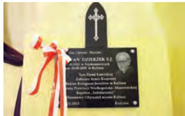
Tablica upamiętniająca jezuitę została zamontowana w przedsionku kościoła w Zdunach.