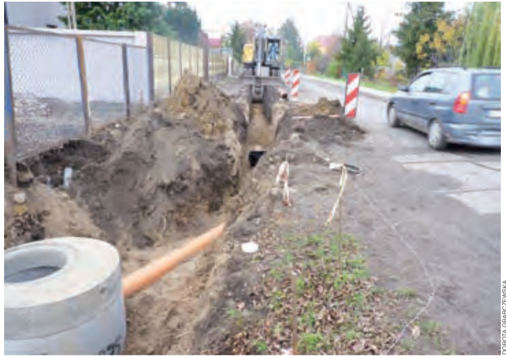
Układana rura będzie odprowadzać wodę z ulicy Jabłonkowej do studni rewizyjnej. Dalej woda ma płynąć do rowu po przeciwnej stronie ulicy. Problem w tym, że póki co przepust jest niedrożny, a rów zarośnięty.

Teraz się okazuje, że woda będzie odprowadzana rurami o średnicy 250 mm. Po lewej stronie ulicy (od strony Dobrzelina) będą wykonane 2 studzienki odprowadzające wodę, zaś po jej prawej stronie będą trzy studzienki odbierające wodę. Rury odprowadzają-