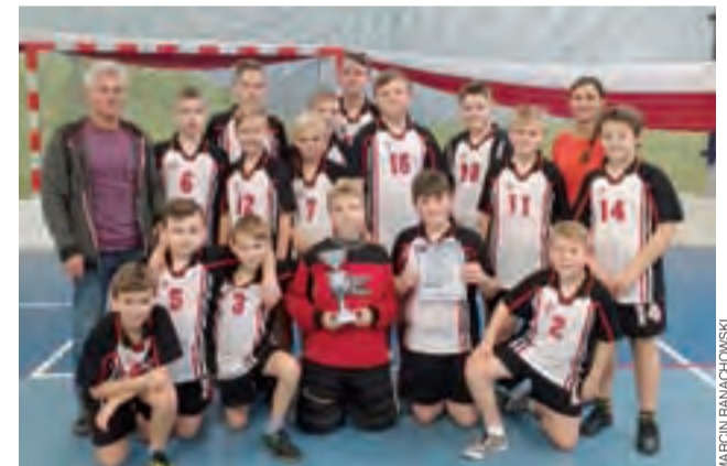
Reprezentacja chłopców z SP w Grabowie wywalczyła pierwsze miejsce podczas Mistrzostw Rejonowych w Unihokeju.

PGE Skra Belchatów – ONICO Warszawa 3:0 (25:21, 25:21, 25:20)