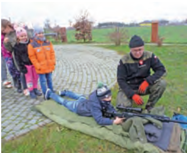
Była też okazja, aby postrzelać do tarczy z karabinu z lunetą. Chętnych do strzelania nie brakowało, ustawiła się długa kolejka.

Obecność rekonstruktorów była możliwa dzięki realizacji projektu „Godność, Wolność, Niepodległość”, zaakceptowanego przez ministerstwo edukacji, na realizację którego szkoła do-