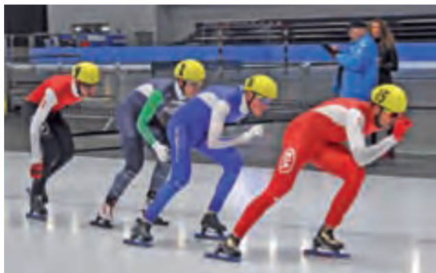
Bieg masowy mężczyzn. Pierwszy w biało-czerwonym stroju z numerem 15 Zbigniew Bródka, Tomaszów Mazowiecki, 27.10.2018.