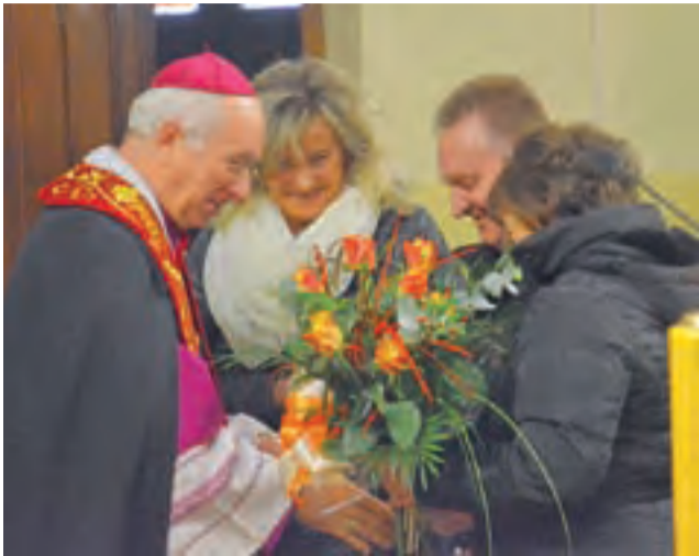
W murach kościoła w Zdunach biskupa łowickiego witali m.in. chórzyści.