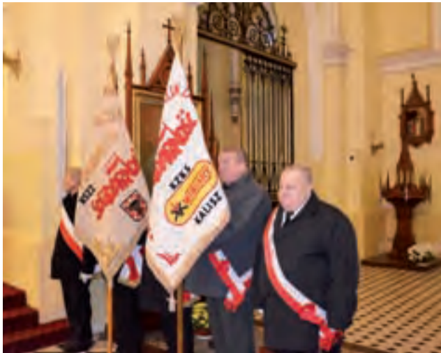
W uroczystości udział wzięły dwa poczty sztandarowe NSZZ Solidarność z Kalisza.