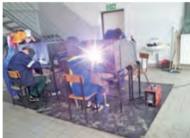
Kurs spawania elektrodami otulonymi dla młodzieży możliwy był w ramach poprzedniego projektu, jest dostępny też obecnie.

Na terenie szkoły powstanie Punkt Informacji i Kariery, w którym uczniowie będą zachęceni do podejmowania własnych inicjatyw, otrzymują porady jak przezwyciężyć bierność, a jak radzić sobie ze stresem i trudnymi sytuacjami.