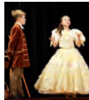
„Przeminęło z wiatrem” w wykonaniu uczniów z Warszawy było kostiumowym musicaliem.

ny” na kilkanaście różnych postaci tworzących diabelskie ministerstwo. Listy cytowane przez aktorów grających w przedstawieniu to studium sposobów kuszenia i niszczenia człowieka przez diabła, pokazujące też mocne strony „pacjenta”, który jest w stanie się przed nim bronić.