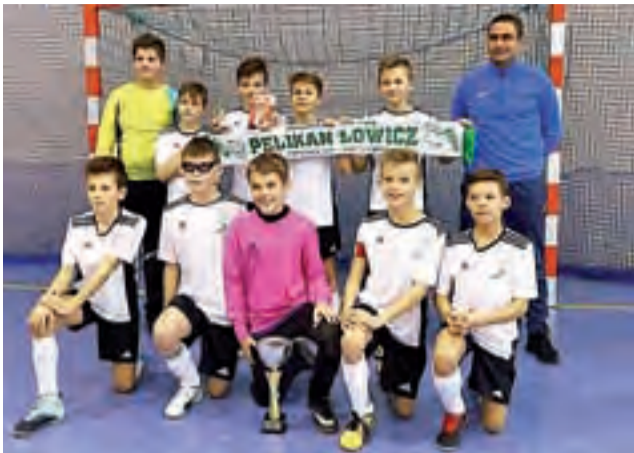
Drużyna fowickiego Pelikana-2007 nie kryła zadowolenia po turnieju.