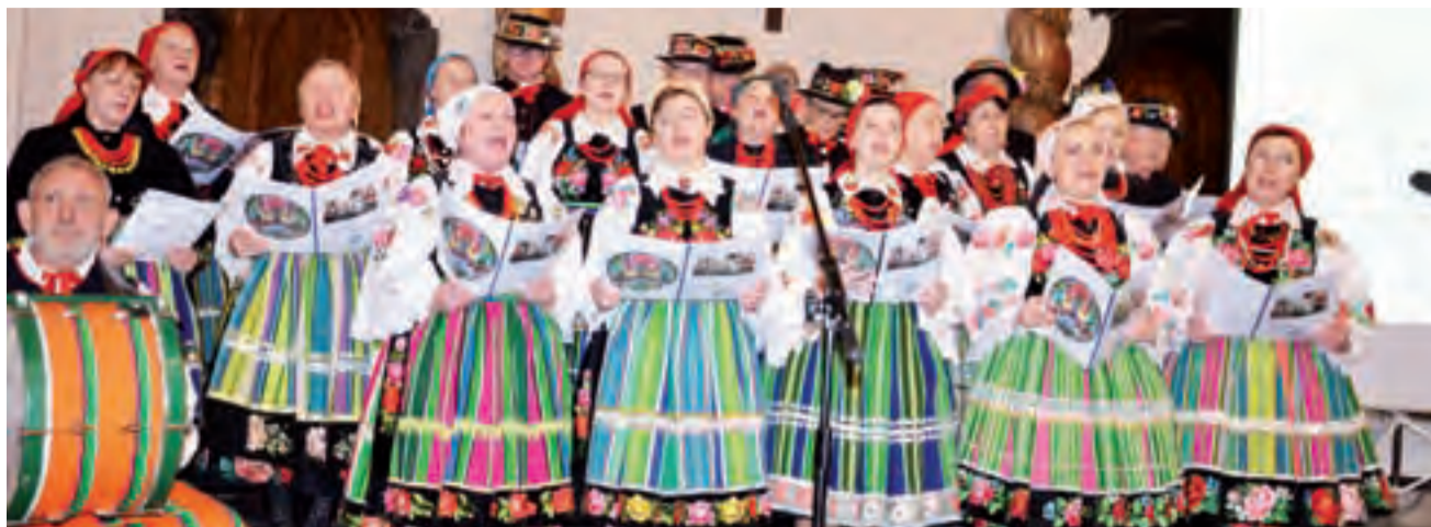
W koncercie Ksinszoków publiczność mogła aktywnie brać udział, ponieważ słowa śpiewanych utworów wyświetlane były na ekranie po prawej stronie.

Łowicz | Koncert promujący płytę zespołu Ksinszoki