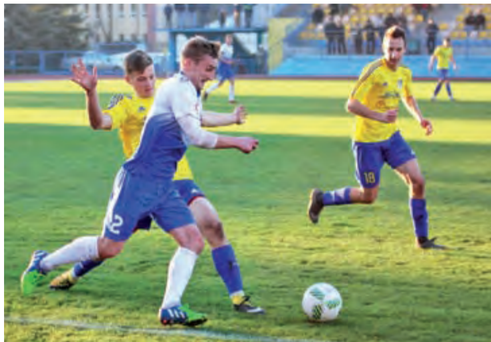
KS Kutno pokonał 2:1 rywala Orkan Buczek w ostatnim meczu rundy jesiennej rozgrywek IV łódzkiej ligi.

Zdobyta bramka spowodowała jeszcze bardziej zaciekle dążenie do doprowadzenia do remisu. Jednak gospodarzom udało się