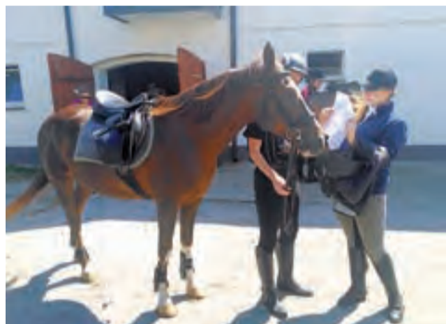
Osoby lubiące konie mogą zdobyć kwalifikacje instruktora jazdy konnej lub instruktora hipoterapii.

W ramach projektu zostanie przeprowadzonych 12 rodzajów