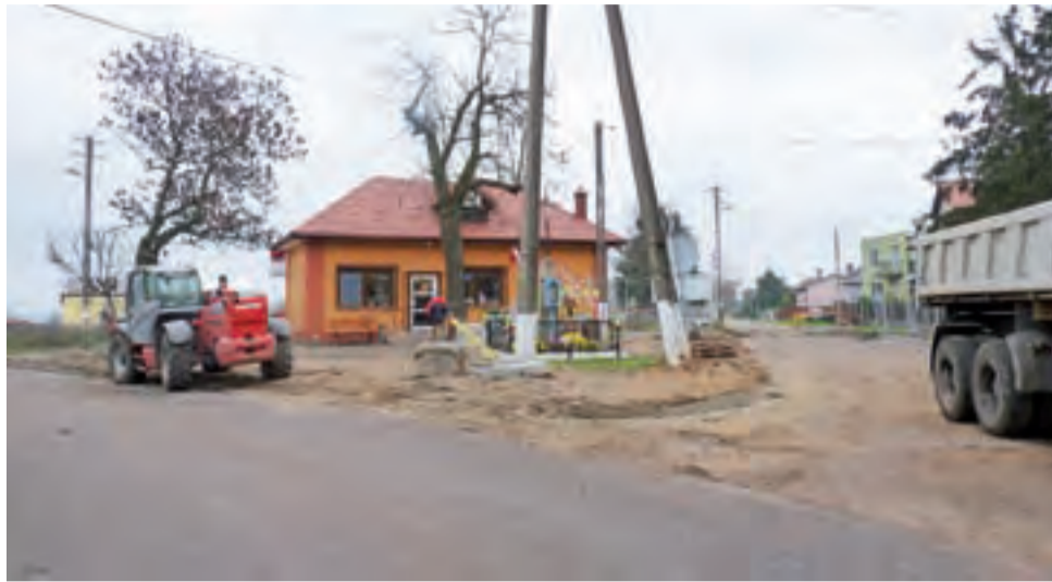
Skrzyżowanie na końcu ul. Żeromskiego, rozchodzące się na Budzynie i Wolę Popową, zostanie przebudowane.

Przedsiębiorcy, którzy prowadzą firmy transportowe, wnioskowali, że zwiększenie odcinków