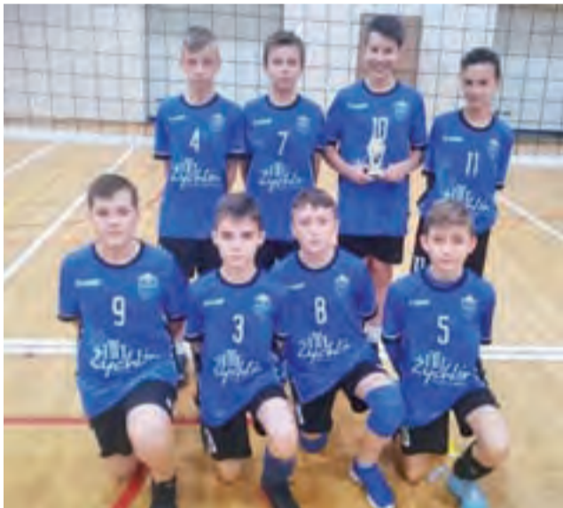
Zespoły chłopców Volley Team Żychlin.

■ Volley Team Żychlin II – UKS Trójka Kobyłka 13:15