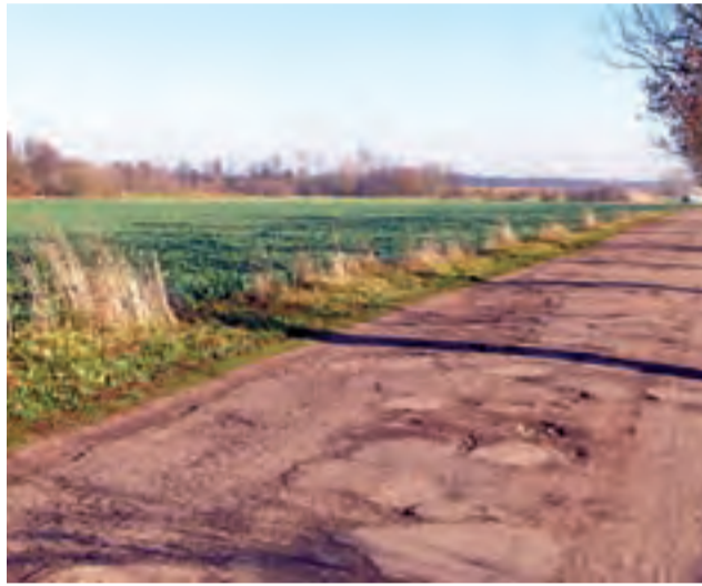
Droga gminna z Walewic do Piotrowic. Ją najbardziej niszczy ciężki transport buraków ze stadniny do cukrowni. Stan drogi na 6 listopada.

gminną, która niegdyś miała nawierzchnię asfaltową. Jej stan od lat pozostawiał zresztą wiele do życzenia, ale teraz, kiedy w wielu przypadkach stała się dla lokalnego transportu alternatywą dla drogi wojewódzkiej nr 703, wygląda gorzej niż kiedykolwiek. Asfalt znajduje się w zaniżu, na dziurach łatwo uszkodzić samochód, a gdy pada deszcz – w głębokich wyrwach gromadzi się woda i powstaje długo niewysychające błoto.