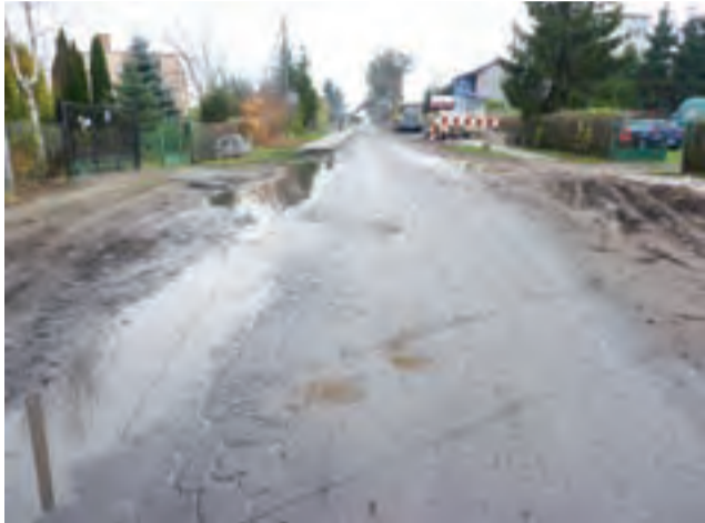
Na lewej stronie ulicy Jabłonkowej, gdzie teraz tworzą się kałuże, będą dwie studzienki kanalizacyjne.

Problem tworzenia się zastojów wody w połowie ulicy Jabłonkowej w Dobrzelinie nasilił się po wybudowaniu kilka lat temu chodnika wzdłuż ulicy. Ponieważ teren jest nachylony, woda z obu stron spływa w najbliższej położone miejsce na ulicy. To sprawia, że nawet po niewielkim deszczu na drodze robią się ogromne jeziora wody, które zimą zamieniają się w lodowiska na jezdni. Przy