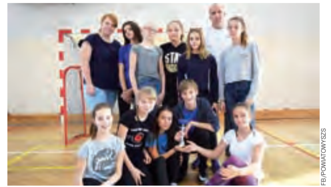
Dziewczyny z SP 1 Łowicz wygrały zawody w Bielawach.