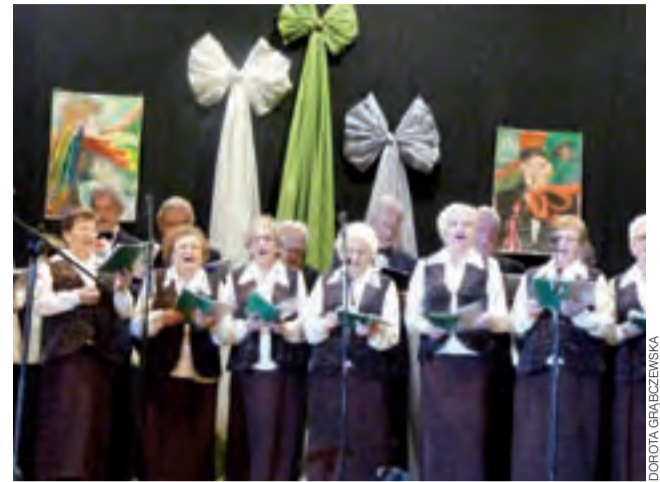
Seniorzy z zespołu Melodia z Żychlina bawili publiczność.