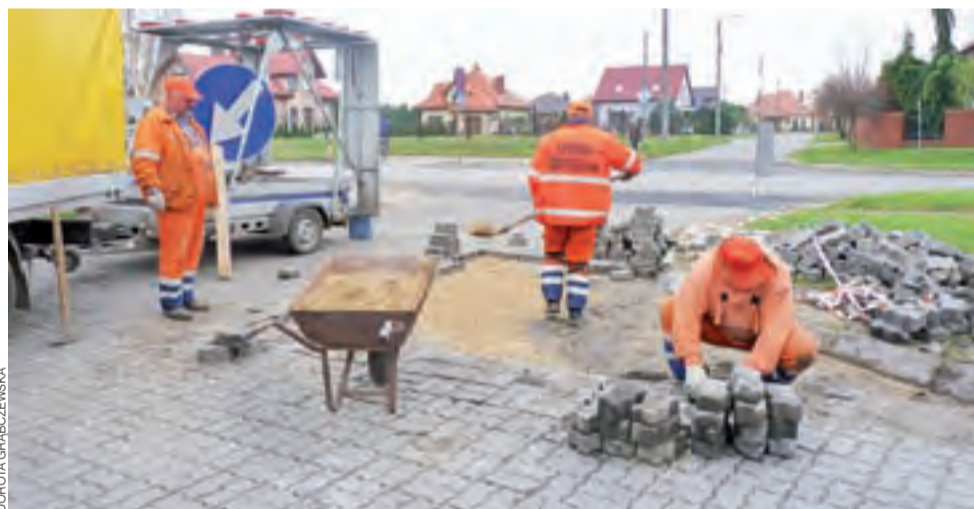
Pracownicy służby drogowej Wojewódzkiego Zarządu Dróg wjazd na parking naprawiali 15 listopada.

Kwestią otwartą jest likwidacja torowiska przebiegającego przez drogę powiatową. Stanowi ono utrudnienie dla kierowców, którzy muszą zwalniać, by pokonać drogę. Usunięcie fragmentów metalowych szyn też wymaga dodatkowej zapłaty. Tymczasem w starostwie stara władza zakończyła pracę, a nowa dopiero została wybrana (21 listopada). ■