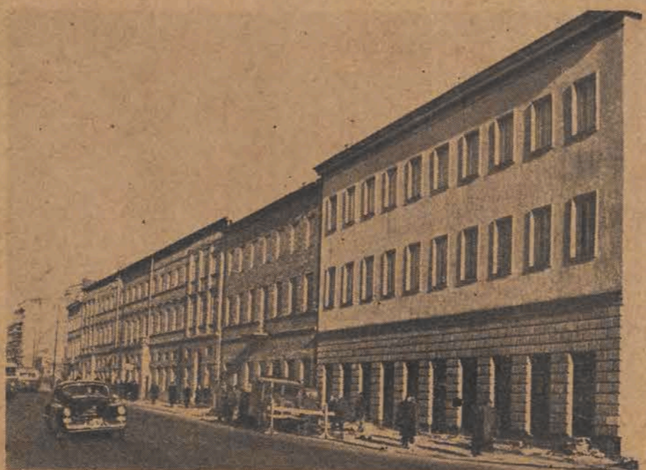
Perspektywa Nowego Świata