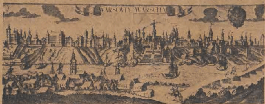
Joan Christoph Hafner, Sztucz z ok. 1703 r. Ze zbiorów Muzeum Narodowego