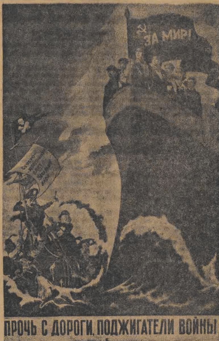
PROČ S DOROZI, PODŽIGATELI WOJNY! Precz z drogi — podlegacze wojenni!

nieczną przypomnieć, że już dnia 6 listopada 1947 roku minister spraw zagranicznych ZSRR W. M. Mołotow złożył oświadczenie na temat tajemnicze bomby atomowej, stwierdzając, że „tajemnica ta oddawna już nie istnieje”. Oświadczenie to oznaczało, że Związek Radziecki odkrył już tajemnicę bomby atomowej i ma te broń do swej dyspozycji. „Co się ty czy paniki, szerzonej z tego powodu przez niektóre koła zagraniczne, to do paniki nie ma żadnych podstaw. Należy stwierdzić, że rząd radziecki, nie bacząc na posiadanie broni atomowej, stoi i zamierza pozostać w przyszłości na swym dawnym stano-