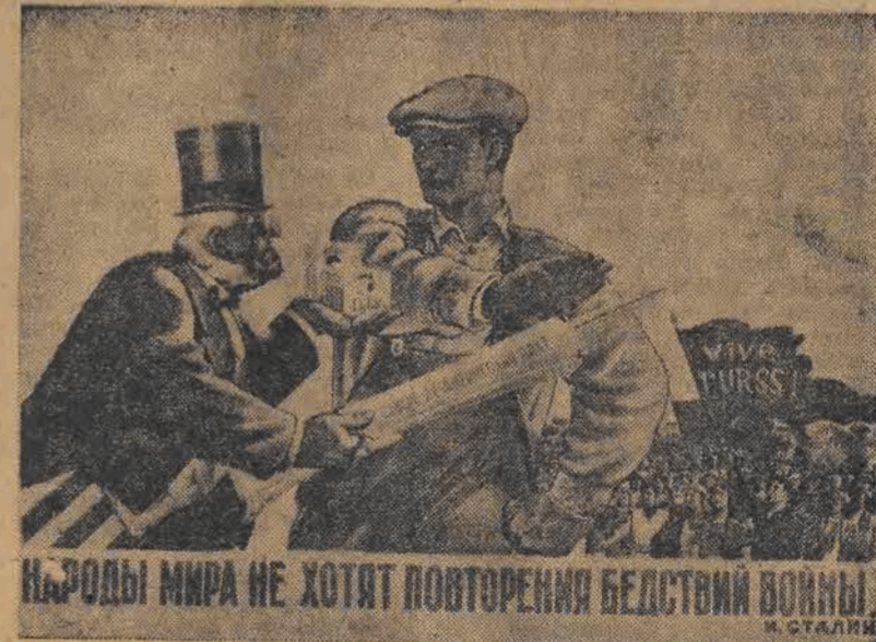
Narody świata nie chcą powtórzenia nieszczęść wojennych! I. Stalin