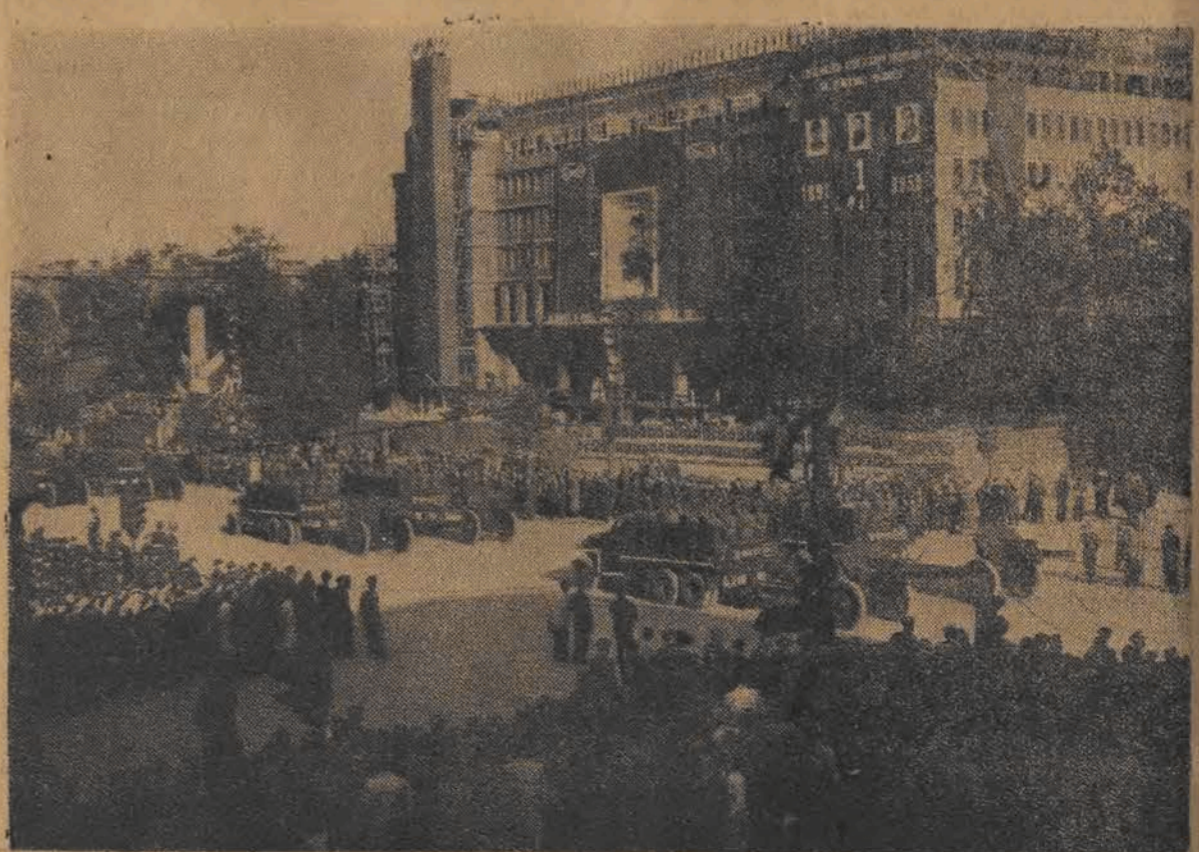
Defilada wojskowa wzbudziła entuzjazm tłumów