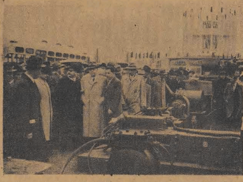
Na zdjęciu Premier Cyrankiewicz w otoczeniu ministrów i przodowników pracy zwiedza stoisko radzieckie.