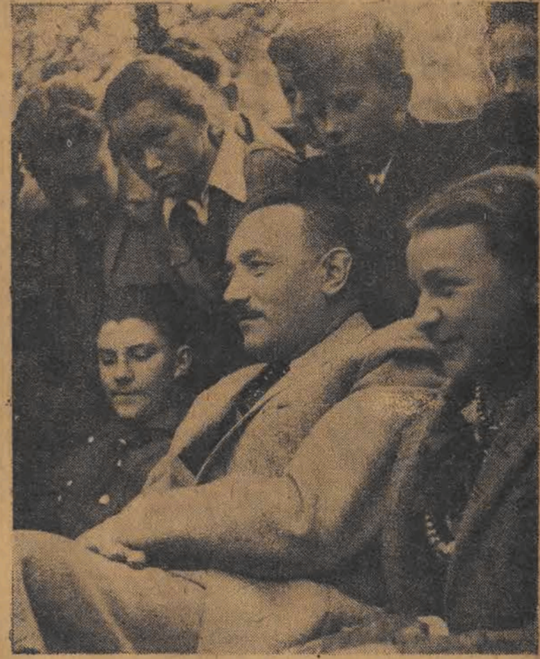
Prezydent Bierut w serdecznej rozmowie z dziećmi