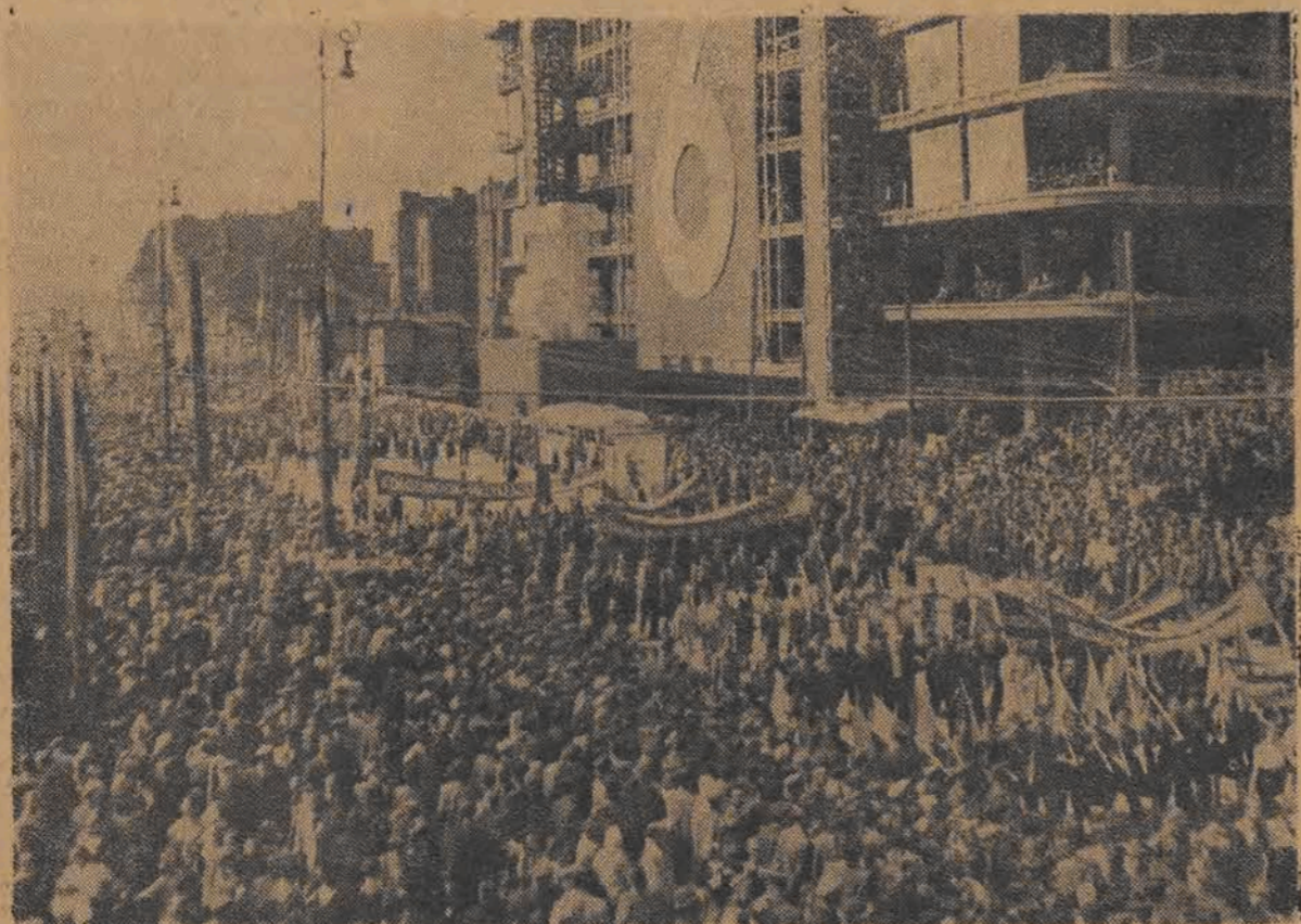
Fragment manifestacji w Alejach Jerozolimskich