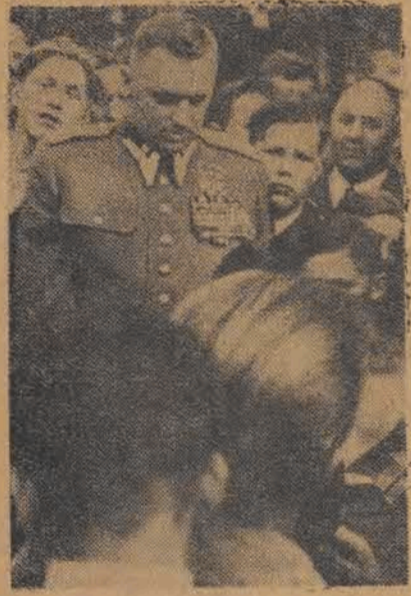
Rój chłopców otoczył Marszałka Rokossowskiego

Cała wyżej przytoczona korespondencja wierszowana wpłynęła do redakcji przed 1 Maja. Wspomniany o tym dlatego, iż nastrój radości, wesołości, siły i dumy, jaki panował w tego rocznym pochodzie pierwszomajowym, znacznie przekroczył oczekiwania, jakiego się spodziewali po nim w swych wierszach wyżej wymienieni robotnicy, chłopcy i młodzieżowi czytelnicy „Głosu”.