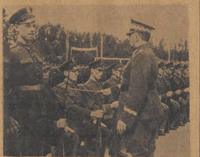
Uroczysty akt promocji

Wspólny obiad odbył się w sali KS „Spójnia” w parku w Helenowie, po czym odbyła się zabawa taneczna i występy artystyczne.