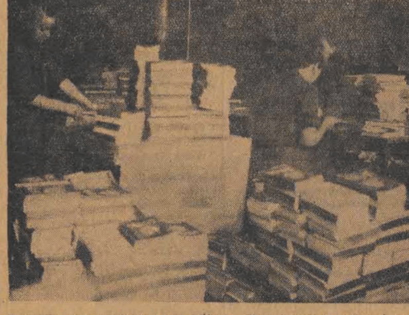
Początek roku szkolnego coraz bliższy. W instytucjach wydawniczych masowo przygotowuje się już nowe podręczniki szkolne dla uczącej się młodzieży.