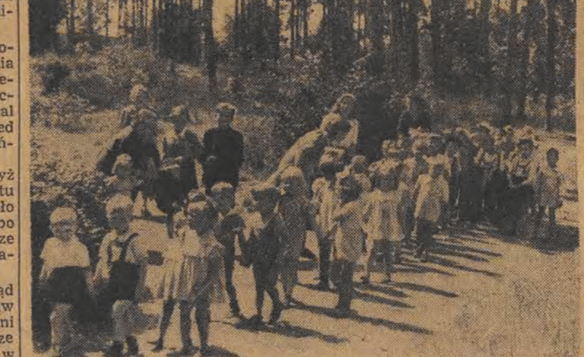
Wesoło i radośnie spędzają czas dzieci robotnicze na koloniach