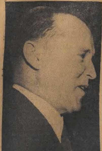
J. Malik, stały przedstawiciel Związku Radzieckiego w Organizacji Narodów Zjednoczonych - przewodniczący Rady Bezpieczeństwa.

Delegat radziecki przedstawia niezbite dowody zbrodniczej agresji rządu USA