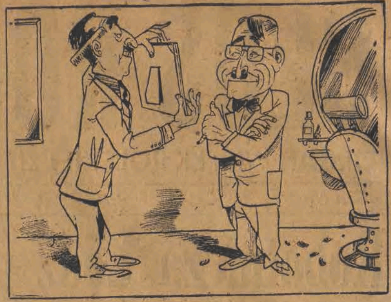
Acheson: Wspaniale, mister Truman! Jest pan teraz stu procentowym zdobywcą świata!

W wielkiej bitwie o zbudowanie w Polsce podstaw socjalizmu, Związek Młodzieży Polskiej winien stać się bojem pomocnikiem i rezerwą naszej Partii — Polskiej Zjednoczonej Partii Robotniczej.