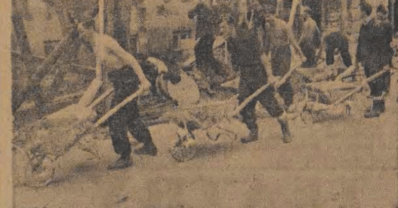
Przy budowie Domu Akademickiego przy ul. Madalińskiego 39 w Warszawie (na zdjęciu pomagają studenci uczelni warszawskiej. 90 studentów w trzytygodniowych turnusach będzie wykonywać prace pomocnicze przy budowie. W ich ślady idzie akademicka młodzież Łodzi, która organizuje studenckie brygady do pomocy w budowie swoich domów na terenie naszego miasta.

Dyrekcja Zakładów Wodociągowych zainteresuje się niewątpliwie sprawą poruszoną przez naszego czytelnika. W każdym bądź razie uruchomienie drugiego kranu ulicznego nie powinno chyba nastąpić z trudnością.