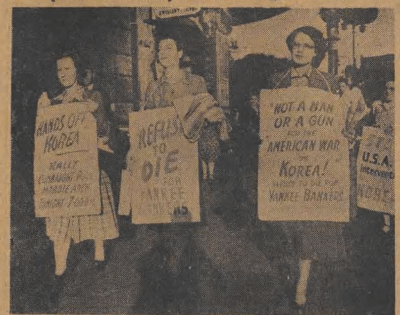
Na całym świecie rozlega się hasło „Ręce precz od Korei! Na zdjęciu — kobiety brytyjskie wzywają do oporu przeciw amerykańskim agresorom.