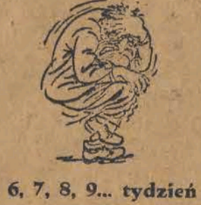
6, 7, 8, 9... tydzień