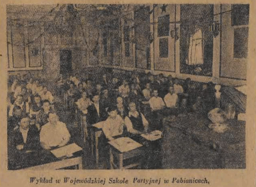
Wykład w Wojewódzkiej Szkole Partyjnej w Pabianicach