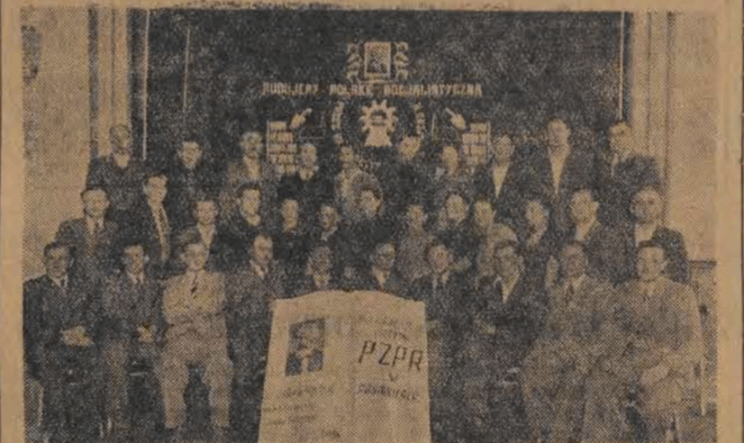
Zakończenie kursu szkoleniowego