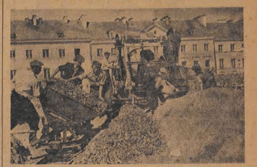
Do budowy Dzielnicowego Domu Towarowego w Mariensztacie przystąpiła Brygada młodzieżowa. Brygada ta walczy o tytuł najlepszej załogi budowlanej w Polsce. Według zobowiązania Dzielnicowy Dom Towarowy o ogólnej kubaturze 6000 m sześciu, wykonany będzie na dzień 31.12. br.

Na zdj. Produkcja brygada betoniarzy grupowego Peca. Grupa ta wyrabia średnio 407 proc. normy.