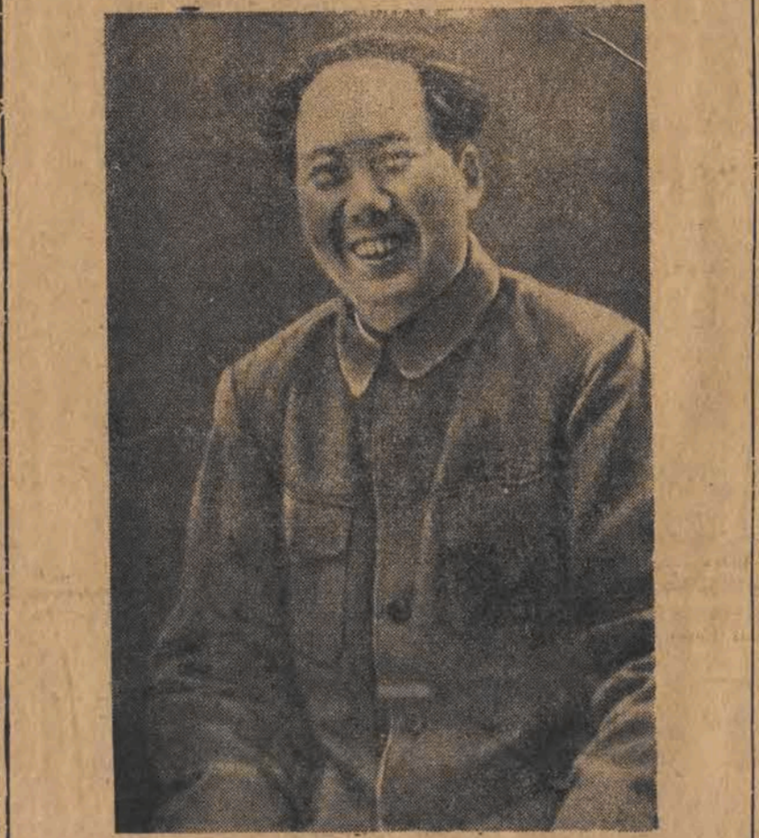
Mao Tse-tung — Przewodniczący Centralnego Rządu Ludowego Chińskiej Republiki Ludowej