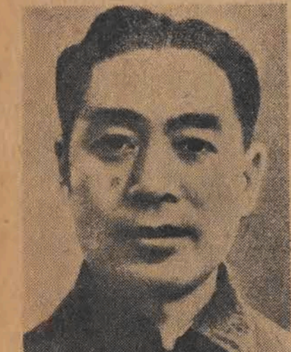
Czou En-laj Premier Państwowej Rady Administracyjnej i minister spraw zagranicznych Centralnego Rządu Ludowego Chińskiej Republiki Ludowej

Szybki i wszechstronny rozwój literatury Chin Ludowych odbywa się na bazie wielkiej aktywizacji politycznej milionowych mas pracujących. Słowa Mao Tse-tunga, rzucane na zjeździe w Jenanie w 1942 r. stają się dziś rzeczywistością. Pisarze i artyści chińscy, czerpią bowiem swe natchnienie z najświeższej łączności z ludem, z wielkich idei marksizmu — leninizmu i bogactw doświadczeń Związku Radzieckiego w dziedzinie kultury i sztuki.