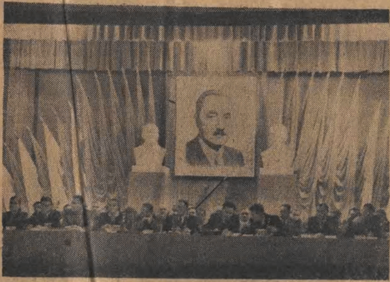
Prezydium II Wojewódzkiej Konferencji PZPR w Łodzi