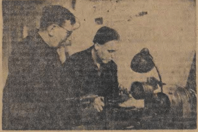
Pomimo przestarzałego parku maszynowego wydajność pracy w ZPW im. 9 Maja stale wzrasta. Jest w tym nie mała zasługa miejscowych racjonalizatorów...

Jaki błąd popełniają najczęściej w swej pracy tkacze oraz tkaczki i to nie tylko młodzi, ale nawet i ci z dłuższą praktyką? Nie śledzą dość dokładnie biegu czółenka.