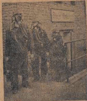
Praca w kopalniach jest ciężka i wymaga wielkiej ostrożności. Górnicze pogotowie ratunkowe gotowe jest do udzielenia w każdej chwili pomocy.