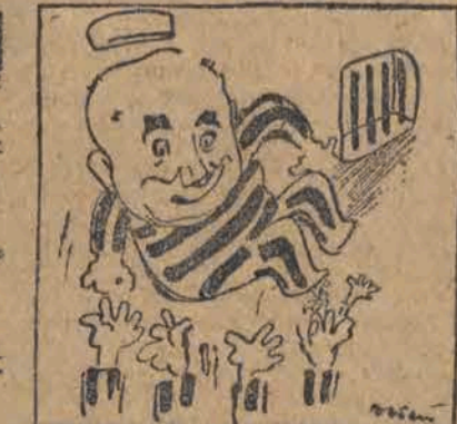
Hej, przyjacielu, jest list dla ciebie! Współwziewnie składają życzenia „stu lat” życia skazanemu na dożywotnie więzienie.