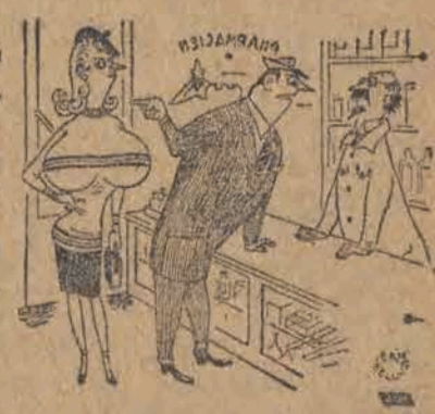
Czy to pan sprzedał tej pani środek na wzmocnienie piersi?