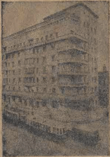
Nowy dom mieszkalny dla robotników transportowych w Moskwie