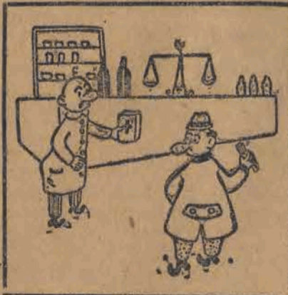
— Oto praktyczna, podręczna apteczka za 1000 zł. — A jest w niej górskie słońce?