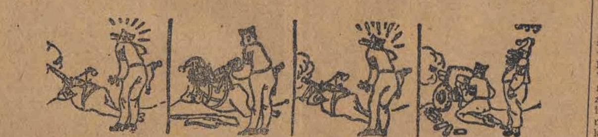
Kiedy amerykańscy „obserwatorzy” w Grecji zobaczyli, jak niski jest poziom wojsk monachijsko - faszystowskich, sami przyłożyli rękę do dzieła...