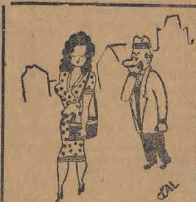
— Dlaczego nosi pani pleska w torebce?... Czy z obawy, żeby nie uciekł? — Nie, on mi polknął pierścione!