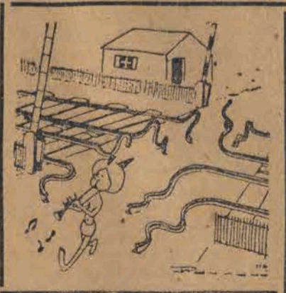
Zaklinacz węży na spacerze