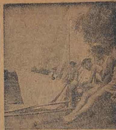
Wody rzeki Odry gościnnie przyjmują gromady młodych entuzjastów sportu żaglowego.