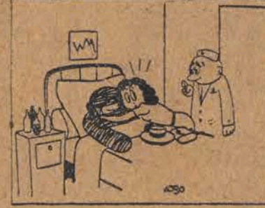
— Najmocniej panią przepraszam, ale mąż pani leży piętro niżej...