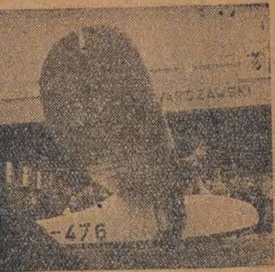
Na zakończenie II Tygodnia Lotniczego w Warszawie odbyły się loty pokazowe. Na zdjęciu wyciąganie szybowca z hangaru do lotu.

KAIR (SAP). Hrabia Folke Bernadotte oświadczył, że w czwartek o godzinie 14 poda prasie oficjalne rezultaty swej misji rozejmowej.