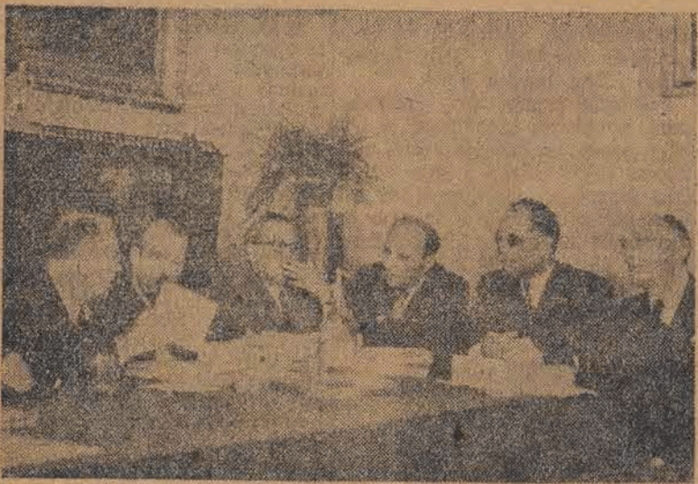
Na stolem obrad Konferencji siedzą od lewej przewodniczący konferencji tow. Oskar Lange (Polska), tow. Basso (Włochy), tow. tow. Sechasidy i Horvath (Węgry), tow. Blancourt (Francja), i tow. Jacobson (Finlandia).

Konferencja Międzynarod. przedwielki partii i grup socjalistycznych Czechosłowacji, Finlandii, Francji, Polski, Węgry i Włoch, wierzących idealowi socjalizmu rewolucyjnego, zebrała się w dniach 5 i 6 czerwca 1948 roku w Warszawie, której ruiny są pomnikiem przestrogi przed wojną i bestialstwem faszyzmu, której odbudowa jest symbolem pokojowej i demokratycznej odnowy.