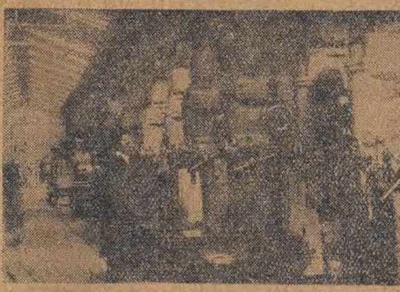
Montaż wiertarek. Przy maszynach ślusarz działu — przedownik pracy ob. Doruch.