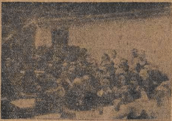
Zebrań pracowników fabryki w świetlicy.

Jeden z najważniejszych ośrodków przemysłowych tego rodzaju w Polsce. Tutaj produkuje się ma- szyny oraz ich części składowe, stąd wychodzą też i inne drobniej- sze narzędzia.