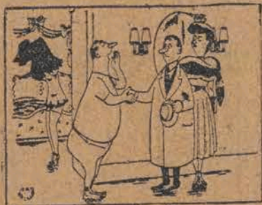
— Szkoda, że państwo już wychodzi...