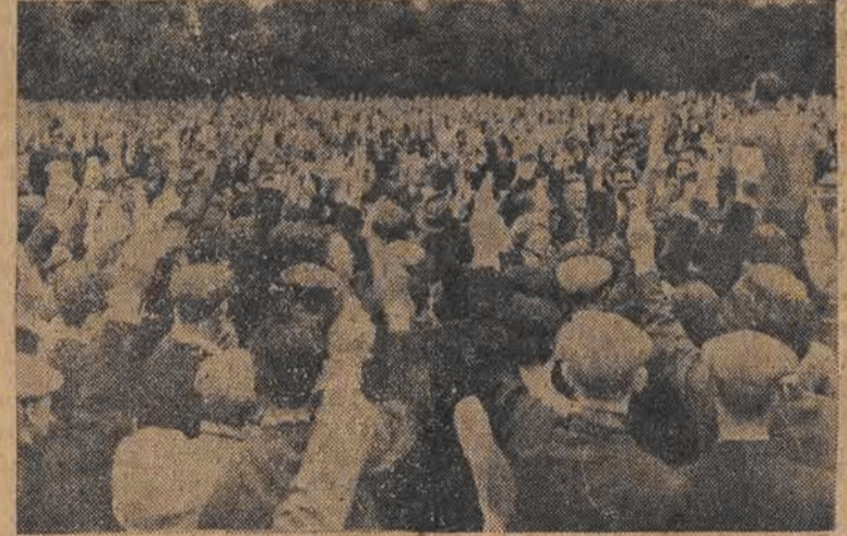
Angielski świat pracy strajkuje! Kapitalizm nie potrafi zapewnić robotnikom minimum warunków egzystencji. Na zdjęciu fragment mitingu strajkujących robotników portowych w parku Wiktorii w Londynie.