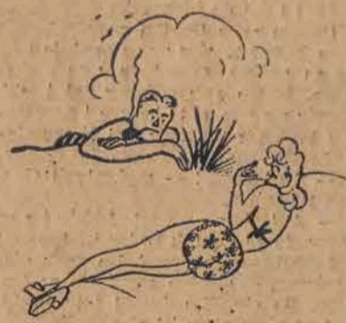
— Od dwóch godzin mówi pan o sianokosach, czy pan nie ma nic innego w głowie?