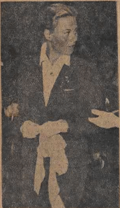
Michelle Morgan francuska artystka filmowa znana z „deskonalnych „Komendantów“ i „Symfonii Pastoralnej“ bawiła dłuższy czas we Włoszech, gdzie nakręcała swój ostatni film „Fabiola“. Paryżanie zachwyceni są opalonym przez włoskie słońce obliczem swej ulubienicy. Podczas pobytu Morgan we Włoszech, w Paryżu krążyły pogłoski, że Michelle rozwodzi się z mężem Billem Marshalllem. Artystka bezpośrednio po powrocie do Paryża zaprzeczyła oficjalnie pogłoski, twierdząc, że chodziło o chwilowe nieporozumienie i separację.