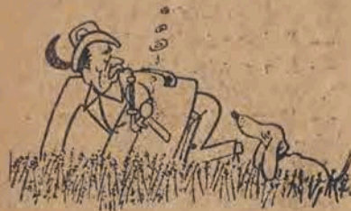
— Tak się aportuje, ty głupi psie!