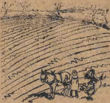
Bój się Boga człowieka, jak ty orzesz to pole? Ach, nie denerwuj mnie. To koń cierpi dzisiaj na czkawkę...