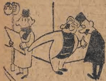
— Panie posterunkowy, daję słowo, że chciałem tylko ugrzać rękę!...