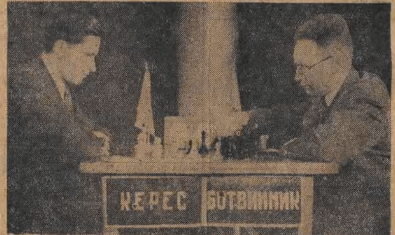
Moskwa — stolica Związku Radzieckiego obserwowała niecodziennie zawody. Odbyły się tutaj rozgrywki szachowe o tytuł mistrza świata. Do konkurencji przystąpili: arcymistrz radziecki Botwinnik, W. Smysłow i Keres, mistrz Stanów Zjednoczonych Rzeszewski i b. mistrz świata Holender Euwe. Pierwsze miejsce zajął Botwinnik zdobywając mistrzostwo świata, drugie Smysłow, trzecie zajęli Keres i Rzeszewski. Na zdjęciu Keres i Botwinnik obmyślają ruchy figur.