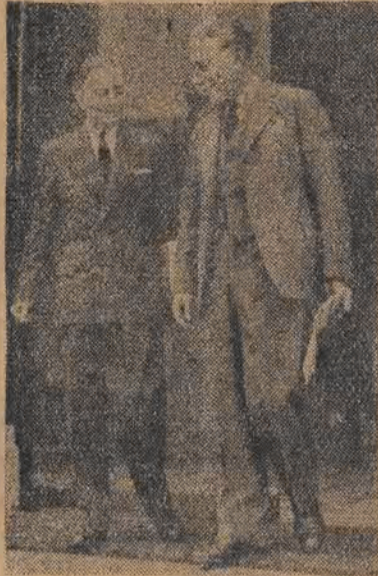
Rząd francuski radzi ciągle nad trudnościami gospodarki finansowej kraju. W prezydium Rady Ministrów odbywają się często zgromadzenia. Na zdjęciu minister Finansów Francji Rene Mayer i min. spr. zagr. Bidault opuszczają gmach Prezydium.