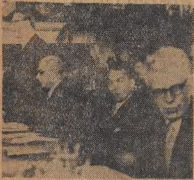
W Montreux w Szwajcarii odbył się kongres organizacji żydowskich z poza państwa Izrael. W wielkim kongresie wzięło udział sześćdziesiąt skupisk żydowskich z sześćdziesięciu państw. Na zdjęciu widzimy przewodniczącego kongresu Stephen Wiso z USA podczas wygłaszania przemówienia.