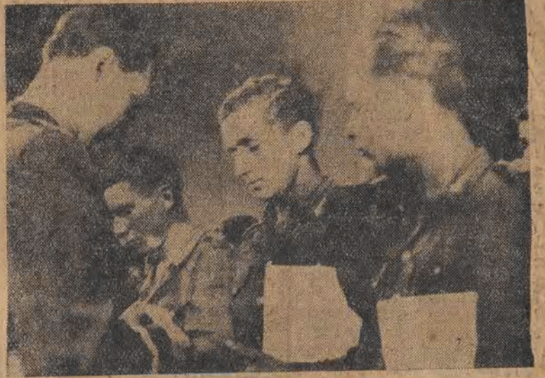
Organizacja „Służba Polsce“ skupiająca w swych szeregach tysiące młodych chłopców przyczyniła się wydatnie do odbudowy Ojczyzny. Junacy dzielnie wywiązują się ze swego obowiązku i sami inicjują współzawodnictwo, które prócz efektów materialnych — przyczynia się do dodatniego rozwoju ambicji młodych ludzi. Co pewien czas odbywają się zloty przodowników „Służby Polsce“, które wykazują, że młodzieńcy potrafią wyróżnić się w pracy w stopniu nie ustępującym wykwalifikowanym pracownikom. Zdjęcie przedstawia fragment z ostatniego zlotu — wręczenie nagród przodownikom przez gen. Zarzyckiego.