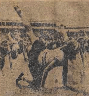
Deszcze i błoto dokuczają nie tylko obywatelom Polski. W Czechosłowacji na popisach gimnastycznych młodzież wykonuje ćwiczenia na stadionie, mimo złej pogody i błota.