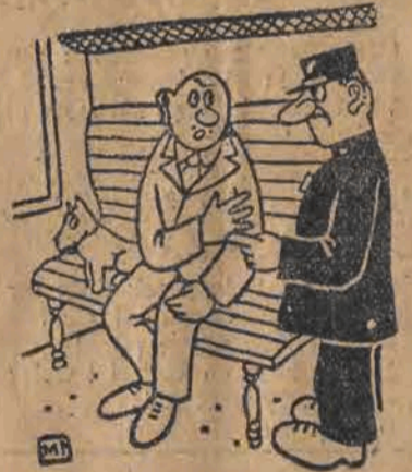
— Pan wie o tym, że psów nie wolno wozić tramwajami! — Ale ja zapłaciłem za niego bilet, jak za dorosłego człowieka! — Niech mi pan pokaże wobec tego człowieka, który siedzi w ten sposób na ławce.