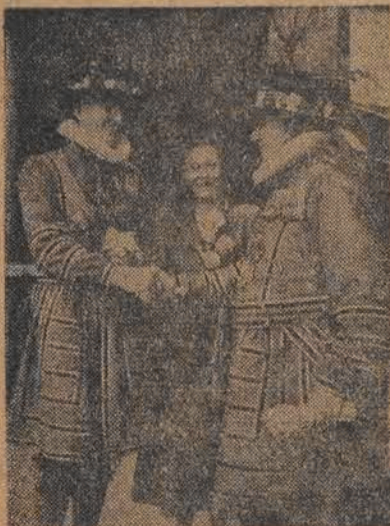
Jedyny kawaler na wieży Londynu poślubił pannę poznana podczas oprowadzania wycieczki pannie Fich. Kucharz naczelny straży gratuluje: „ostatniemu Mohikaninowi”.