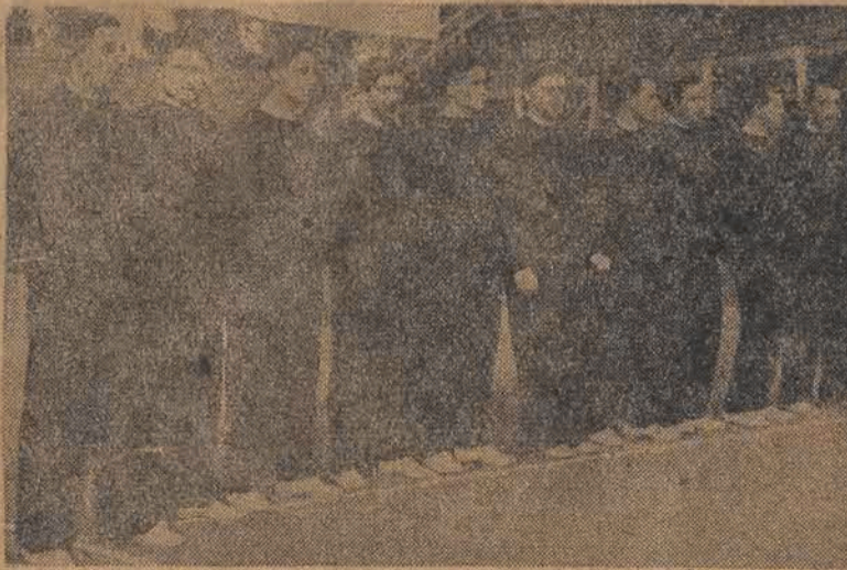
Od kilku dni w Polsce trwa turniej koszykówki i siatkówki z udziałem sportowców radzieckich, węgierskich, czeskich i polskich. Jak było do przewidzenia, zwycięstwa należą do drużyn radzieckich, które reprezentują najwyższą klasę. Na zdjęciu sławna drużyna radzieckich siatkarzy „Dynamo”.