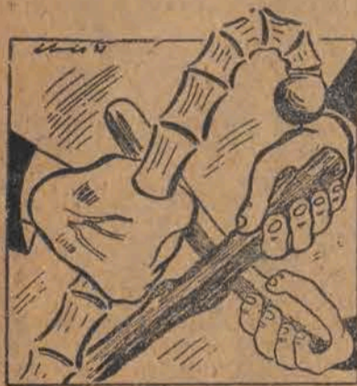
Z prasy: Bójka w Parlamencie włoskim. — Neofaszyści nie chcieli słuchać przykrych prawdy o rządzie de Gasperi'ego. — Nieparlamentarne „argumenty” parlamentarne