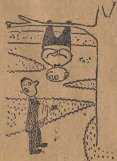
— Możesz już zejść, teraz wiem jak śpi nietoperz.