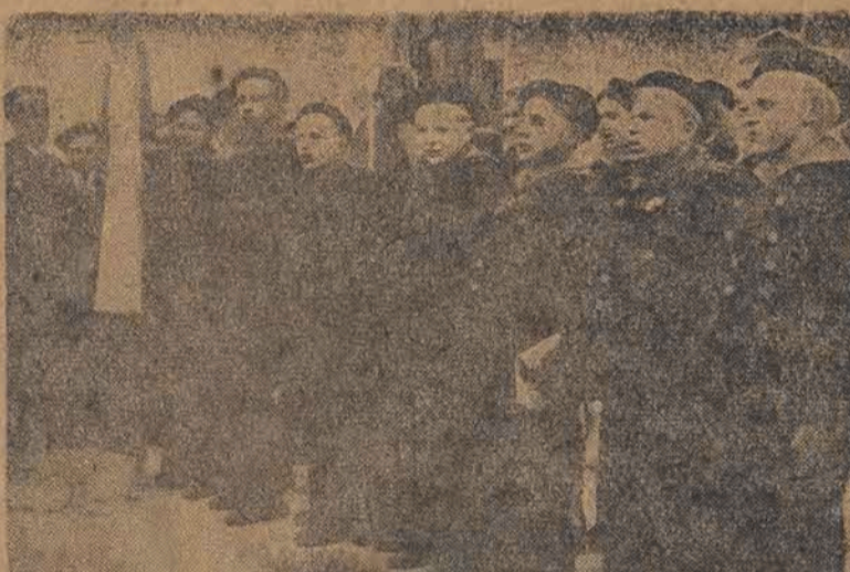
W tym roku grupa polskich dzieci spędziła wakacje na Krymie. W ubiegłym tygodniu malcy powrócili do kraju. Na lotnisku przywitał ich ambasador Lebediew. Dzieci są zachwycone pobylem w Związku Radzieckim i gościnnością ich rówieśników, którzy starali się usilnie, aby młodzi Polacy pod każdym względem mieli przyjemne wakacje. Chłopcy zostali obdarowani ślicznymi mundurkami marynarskimi, w których powrócili do kraju.