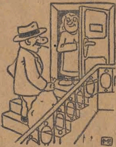
— Ja nie mam na sprzedaż butelek, ale niech pan idzie do sąsiada, jego żona była miesiąc na urlopie.