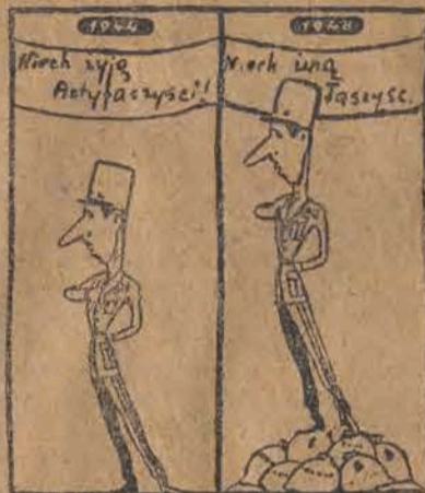
Dwie doby generała de Gaulle'a.