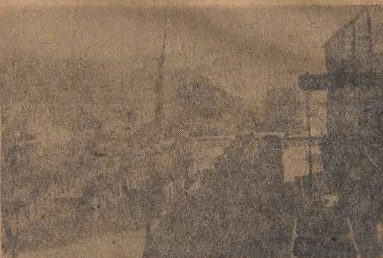
We Francji rozpoczął się wielki strajk górników. Teżniaca praca wielka kopalnia St. Etienne stanęła. Zdjęcie nasze przedstawia ją w kilka godzin po rozpoczęciu strajku.