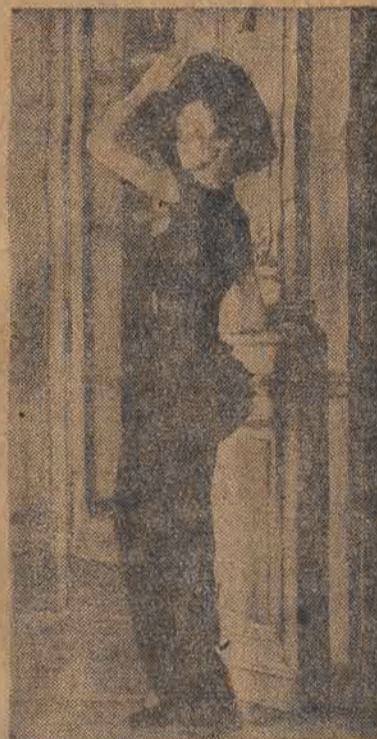
Jak przesadzać, to przesadzać. Ani to estetyczne, ani praktyczne, ale modne, ma więc przewagę nad innymi kreacjami. Strój ten powstał w Anglii, nazywa się „Wachlarz” i zakwalifikowany został do ubiorów, obowiązujących na „proszonych o-biadach”. Może głodne Angielki chowają w tych faldach zapasy żywności?