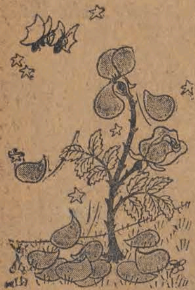
To była pierwszorzędna restauracja. szkoda, że „splajtowała”.