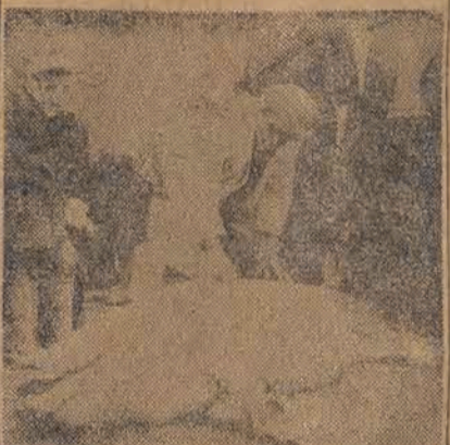
Energicznie prowadzona akcja zwalczania spekulacji żywnościowej dała dobre wyniki. Na targowiskach prowincjonalnych pojawiły się w dużej ilości ciężkie sztuki trzody chlewnej.