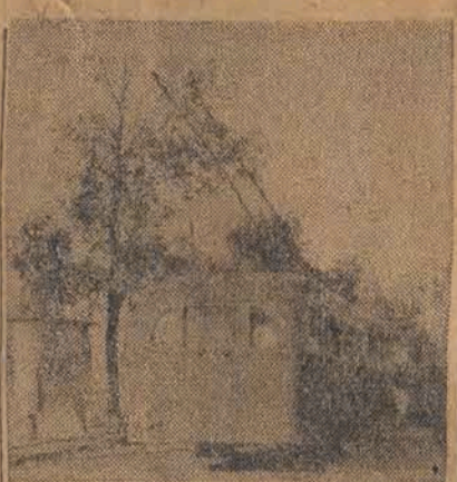
W Warszawie wznowiono w tych dniach komunikację trolleybusową łączącą Plac Unii z Dworcem Gdańskim. Nowe udogodnienie przyjęte zostało z uznaniem mieszkańców stolicy.