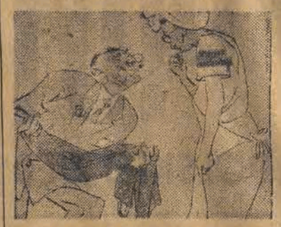
Ubrzemy cię, Germanio!