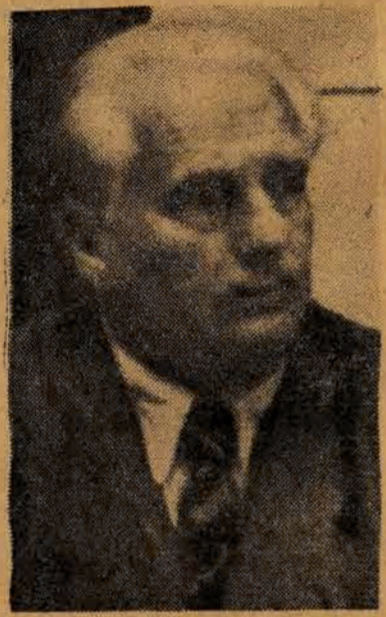
BERLIN (PAP). — W sobotę przed południem, podczas obrad Kongresu Frontu Narodowego Niemiec Demokratycznych, prezydent Niemieckiej Republiki Demokratycznej, Wilhelm Pieck, wygłosił przemówienie, przerywane burzliwymi oklaskami delegatów.