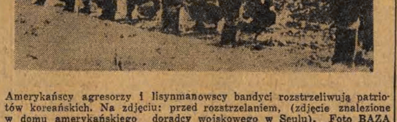
Amerkańscy agresorzy i lisymanowscy bandyci rozstrzelują patriotów koreańskich. Na zdjęciu: przed rozstrzelaniem, zdjęcie znalezione w domu amerykańskiego doradcy wojskowego w Seulu.