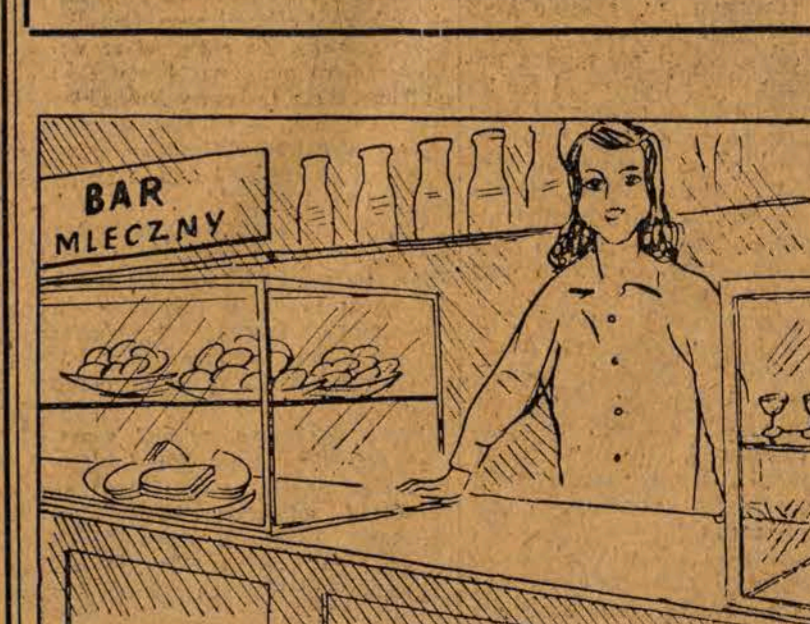
* Z książki — „Oto jest Ameryka” — wydawnictwo „Prasa Wojskowa”.