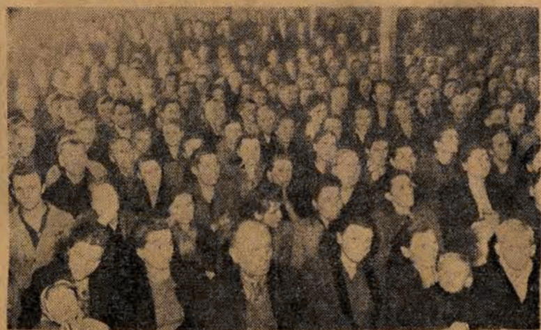
Załoga ZPB im. Dzierżyńskiego przysłuchuje się przemówieniu przewod...